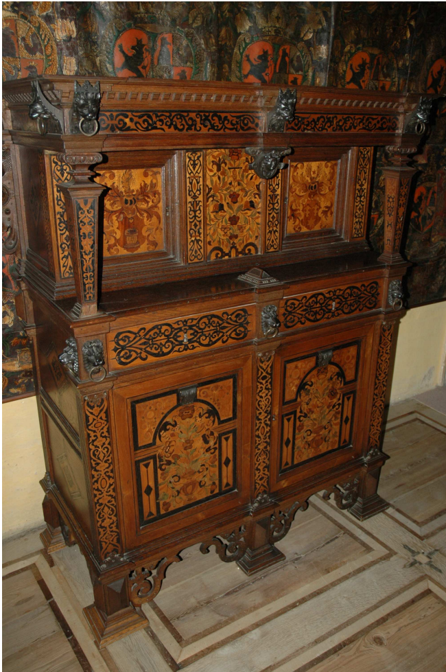
3. Příborník, střední Evropa, začátek 17. století, doplněn v 19. století, inv. č. VL00207