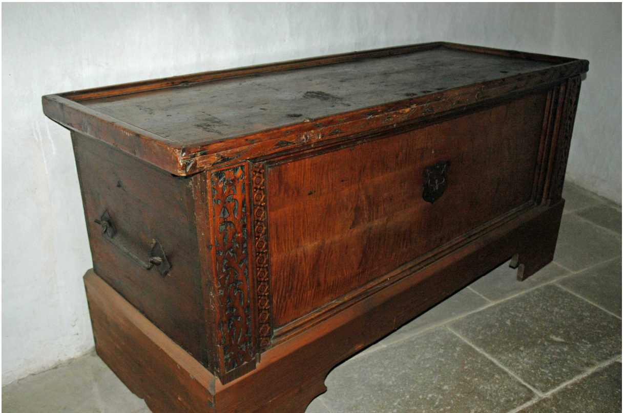
3. Truhla, jižní Německo, počátek 16. století, inv. č. BU 614