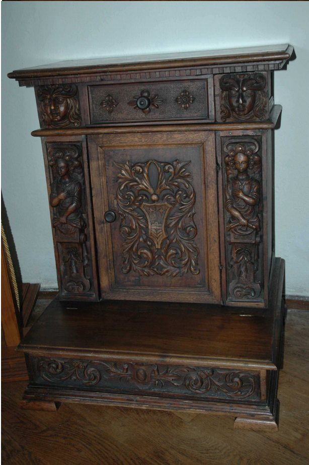
14. Klekátko, Itálie, po roce 1550, inv. č. BZ 2389.