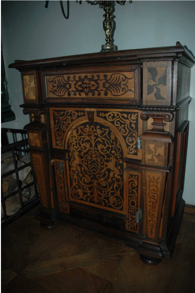
19. Skříňka, Švýcarsko, kolem roku 1620, inv. č. BZ 00807