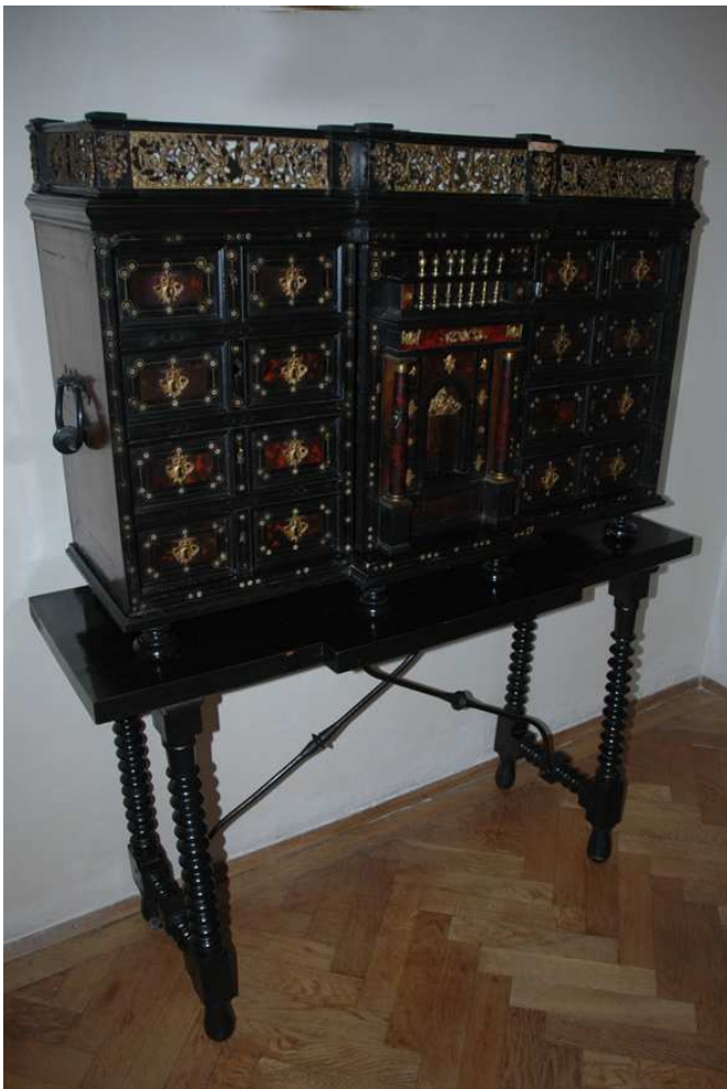
2. Cestovní kabinet, jižní Evropa Španělsko (?), 17. století, inv. č. VL00457