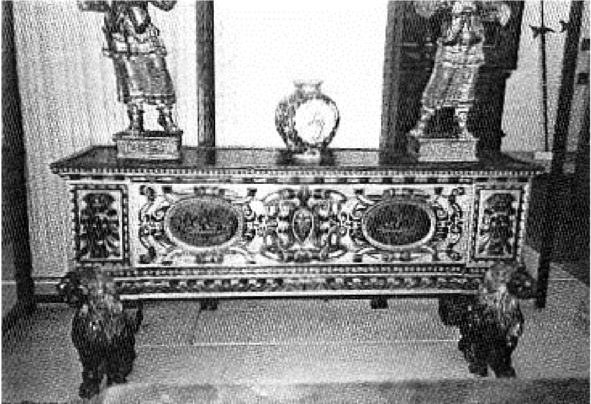
5. Truhla, Benátky, kolem roku 1600, inv. č. 14 121