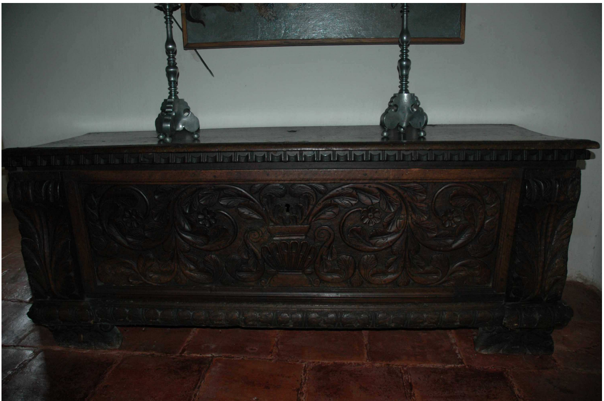
8. Truhla, střední Evropa, první polovina 17. století, inv. č. BU 725