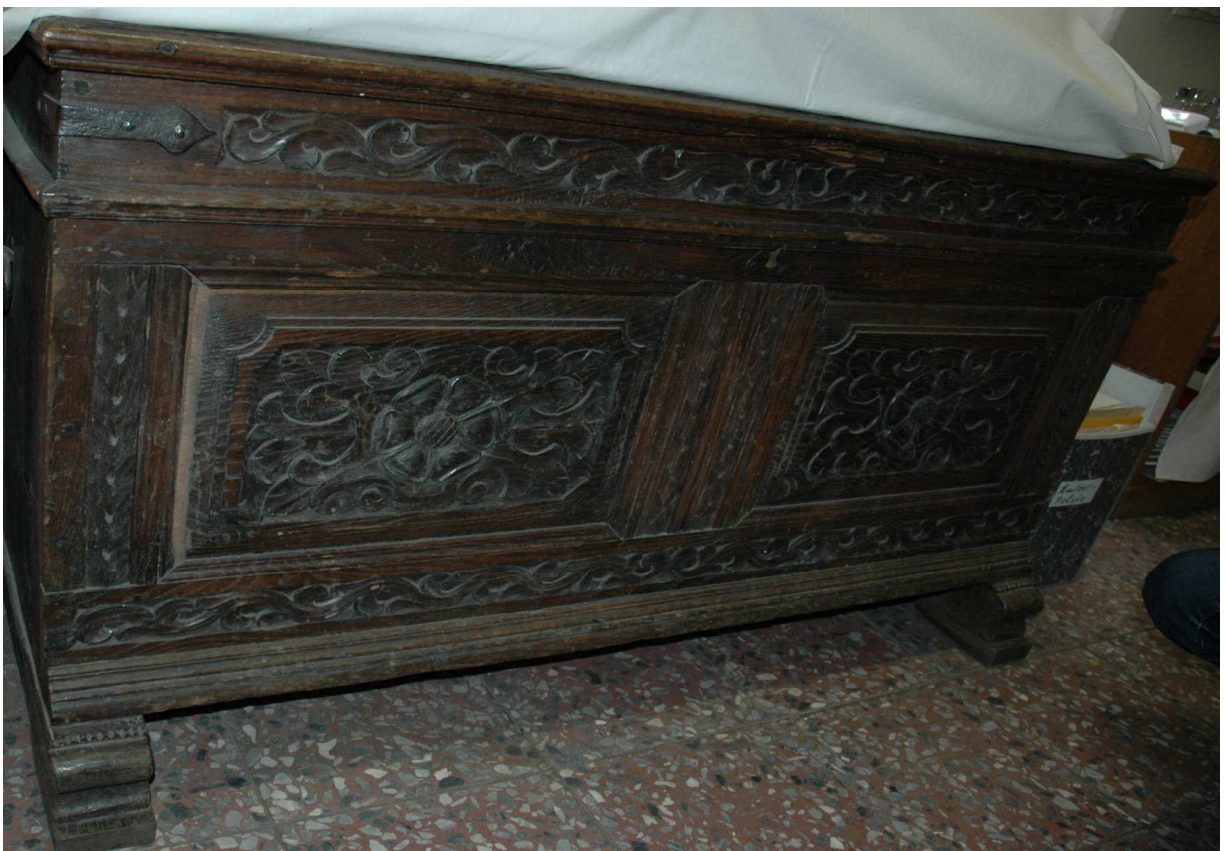
7. Truhla, střední Evropa, kolem roku 1700, inv. č. U184 N