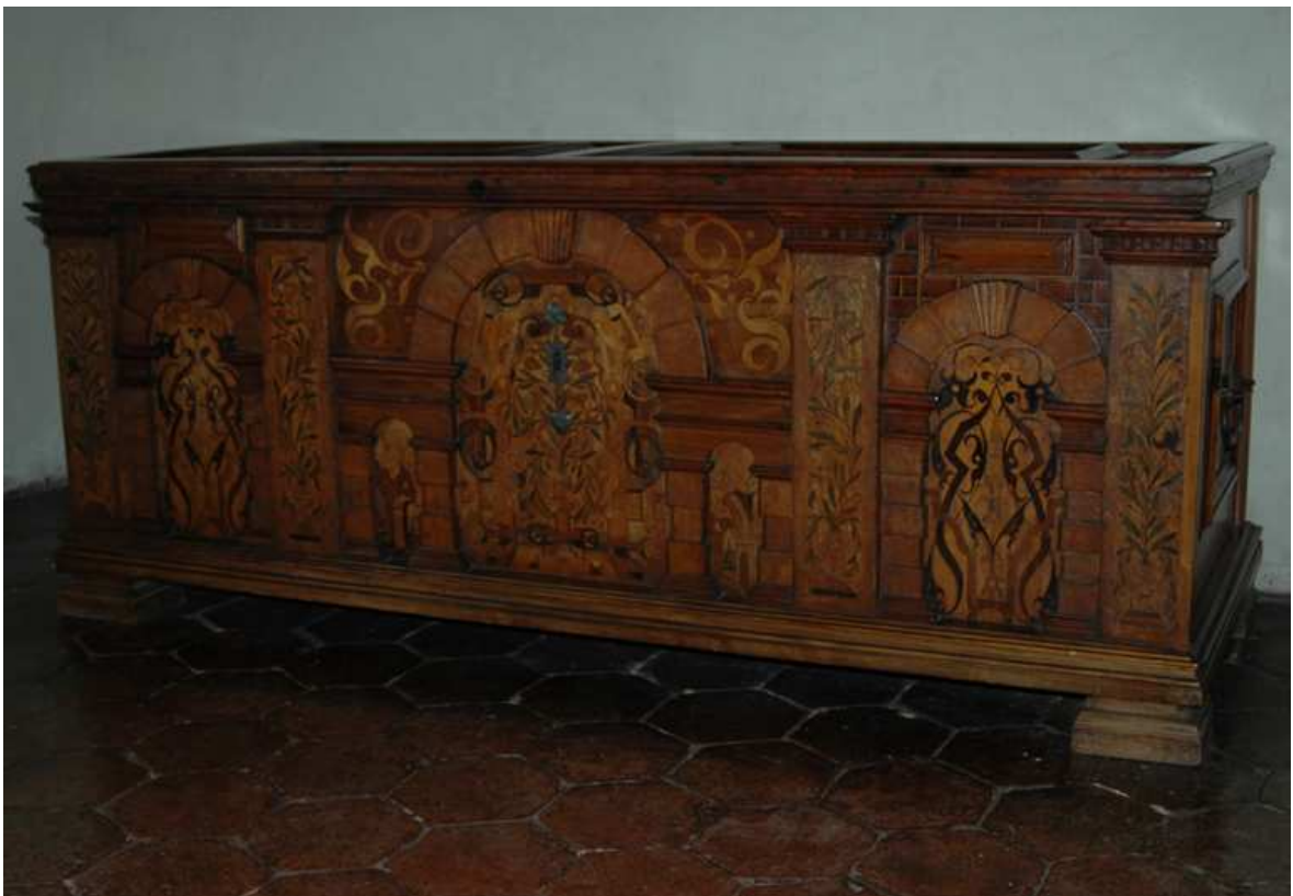
8. Truhla, střední Evropa, druhá polovina 17. století doplněna v 19. století, inv. č. BO-66