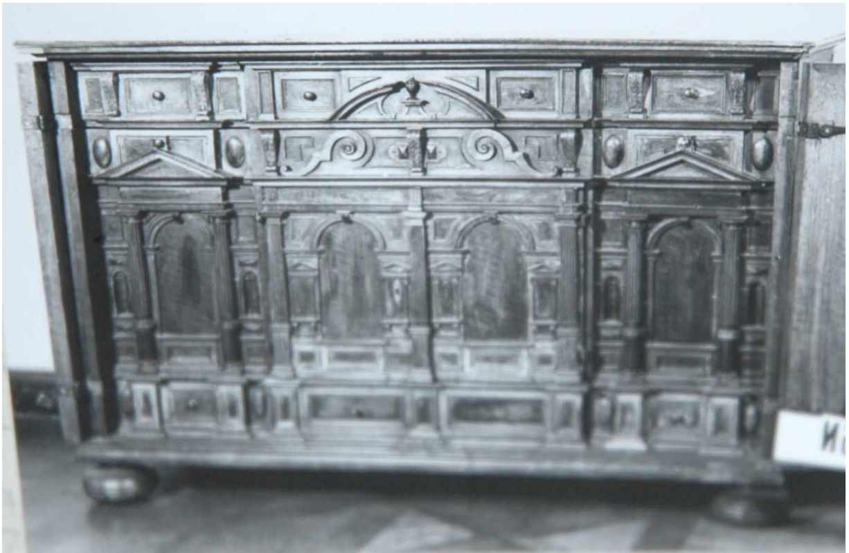
5. Kabinet, severní Německo Augsburg (?), konec 16. století, inv. č. U26 N