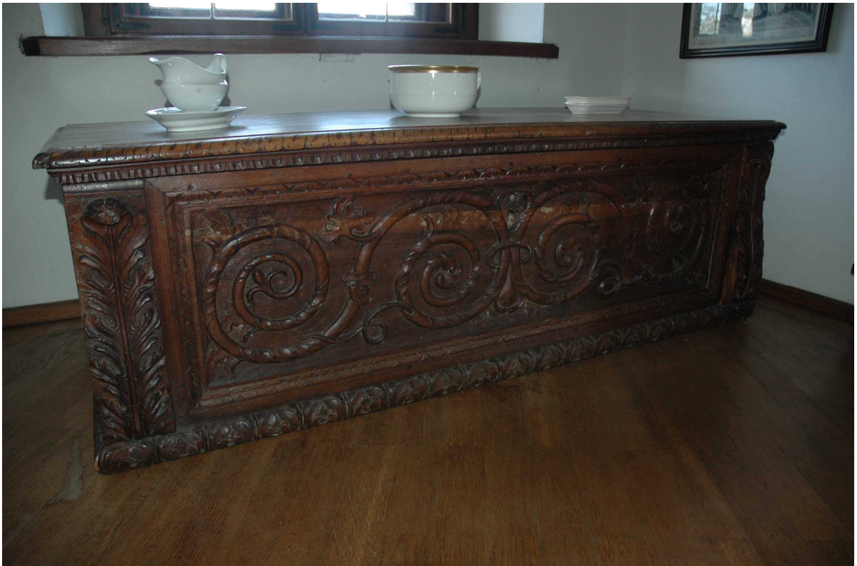
3. Cassone, střední Evropa (?), první polovina 17. století, inv. č. BZ 01136