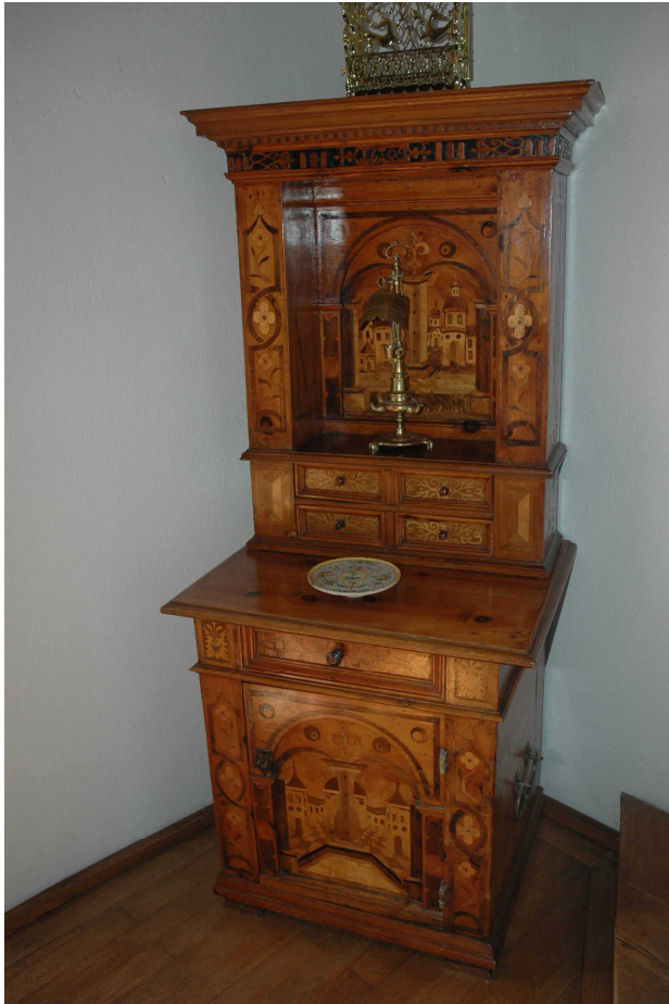
17. Kabinet jižní Evropa, 1609, inv. č. BZ 00713