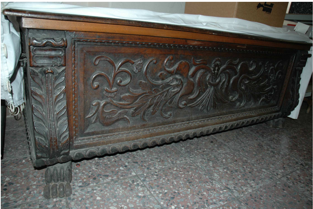
4. Truhla, střední Evropa, první polovina 17. století, inv. č. U168 N