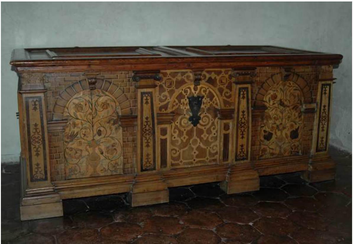
6. Truhla, střední Evropa, Tyrolsko (?), první polovina 17. století, inv. č. BO-67