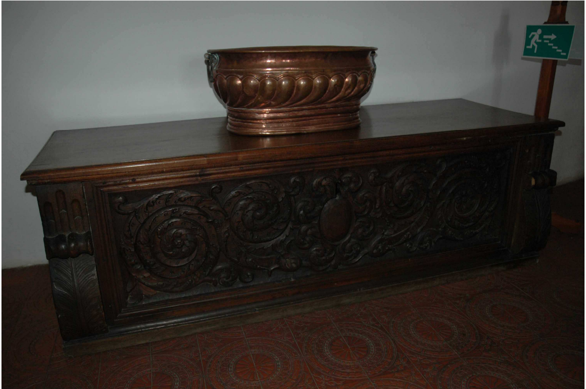
1. Cassone, Rakousko (?), druhá polovina 17. století, inv. č. BZ 02859