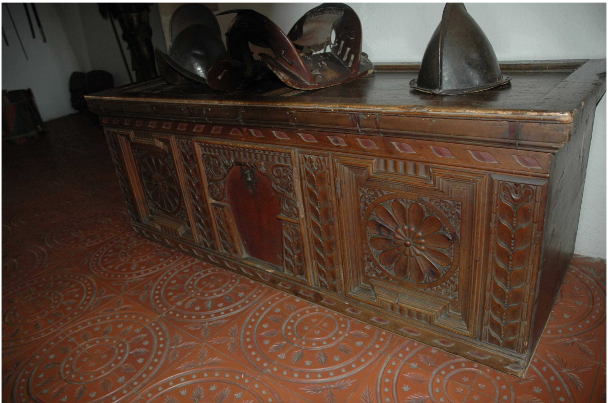
2. Cassone, Tyrolsko, počátek 17. století, inv. č. BZ 01481