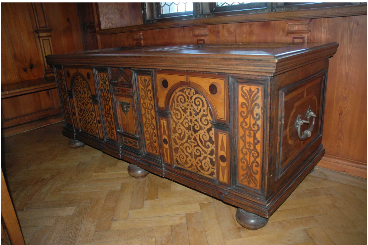
8. Truhla, střední Evropa, konec 17. století, inv. č. BZ 00607