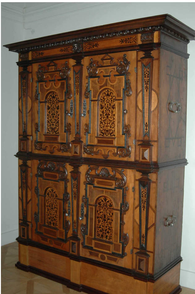
2. Fasádová skříň, Tyrolsko, kolem roku 1650, inv. č. 12 705