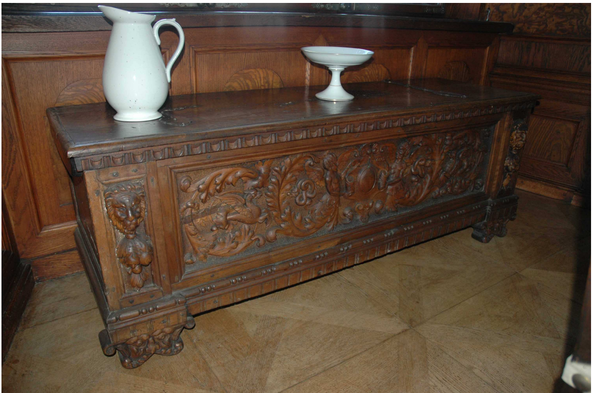
6. Truhla, střední Itálie, kolem roku 1600, inv. č. BZ 00590