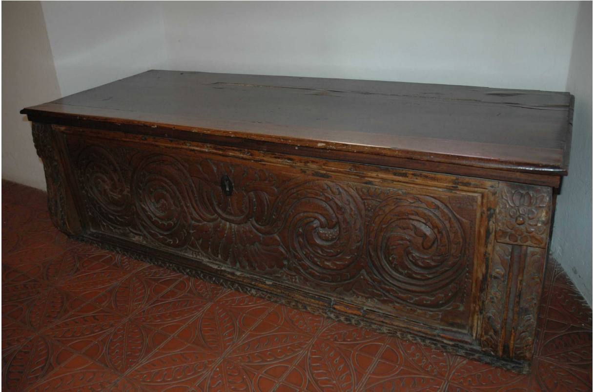
11. Cassone, střední Evropa, konec 17. století, inv. č. BZ 00514