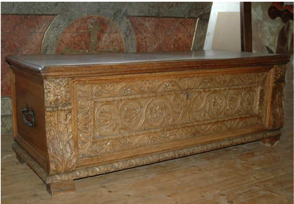
4. Truhla, Tyrolsko, 17. století, inv. č. BO-64