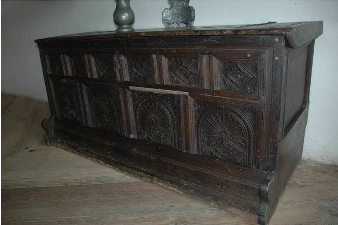
1. Truhla, Kolín nad Rýnem (?), první polovina 16. století, inv. č. VL00467