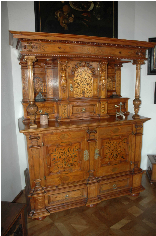
15. Příborník, Holandsko (?), 17. století, inv. č. BZ 00727