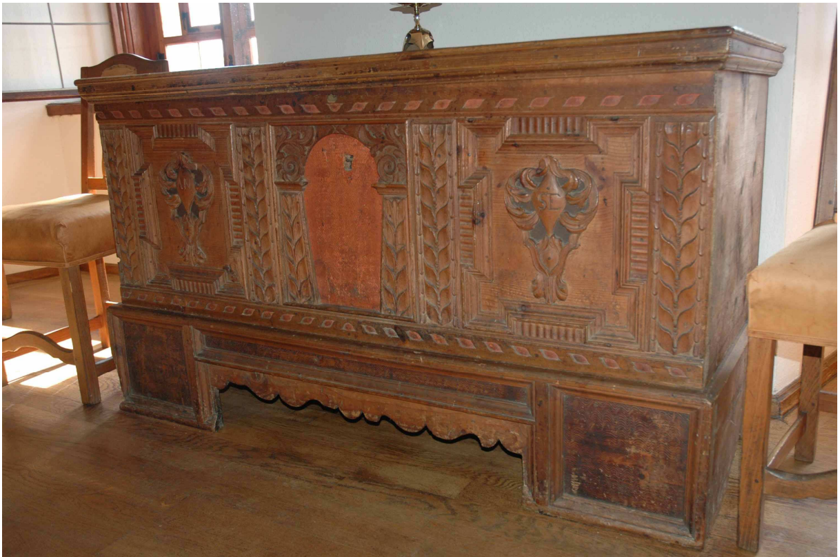
5. Truhla, Tyrolsko, počátek 17. století, inv. č. BZ 1088