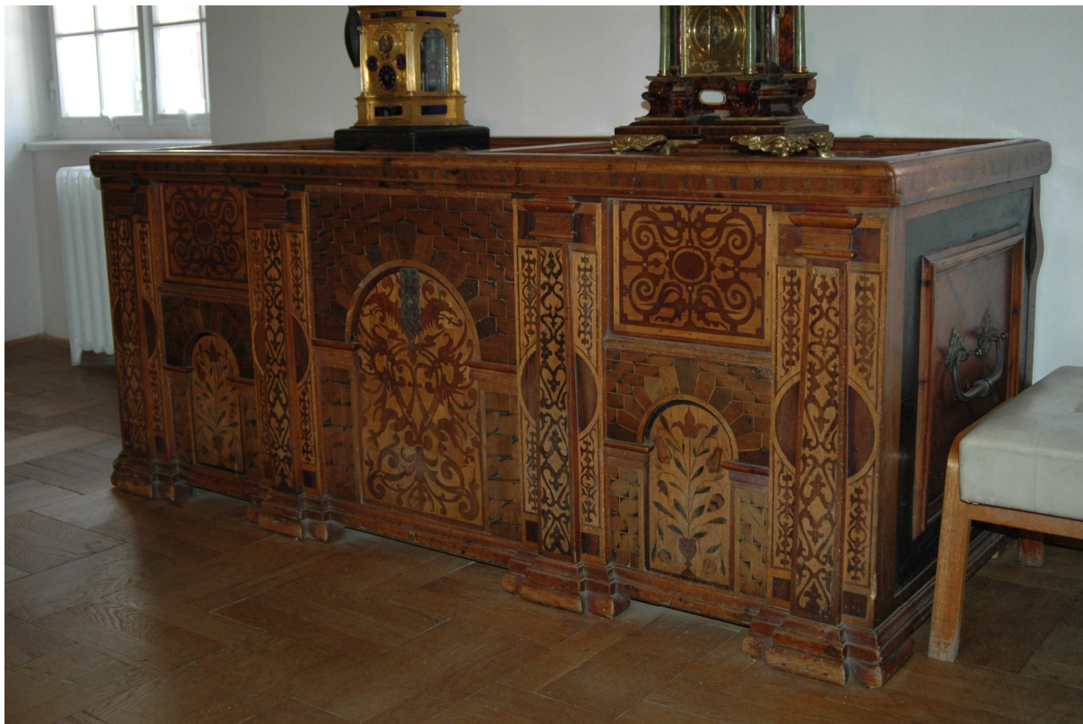
1. Truhla, Tyrolsko, první polovina 17. století, inv. č. N 004