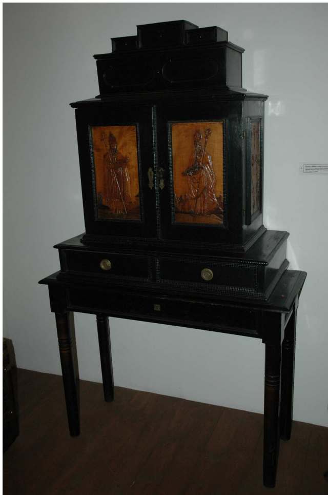
11. Kabinet, Cheb, konec 17. století, inv. č. 21 N