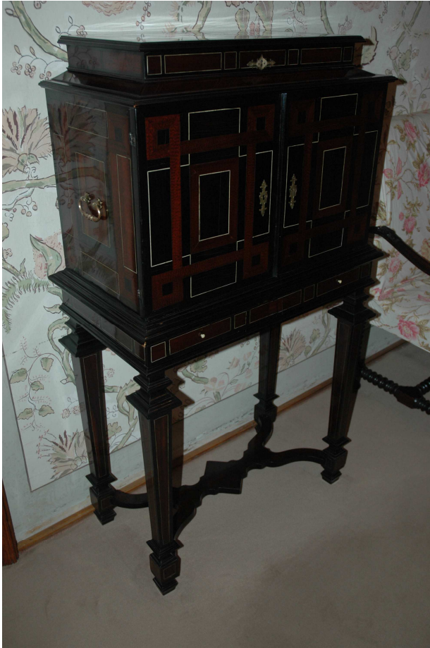
1. Vargueño Holandsko první polovina 17. století, inv. č. BC 460