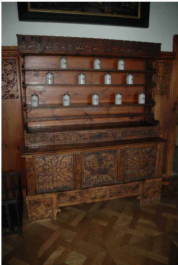
16. Příborník, západní Německo, 16. století, inv. č. BZ 00205