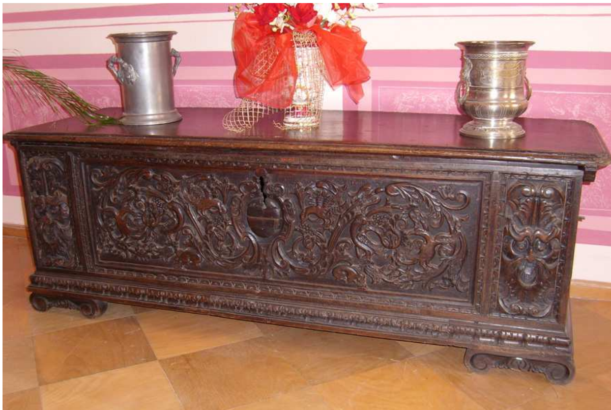
1. Cassone, severní Itálie, počátek 17. století, inv.č. U 3N.