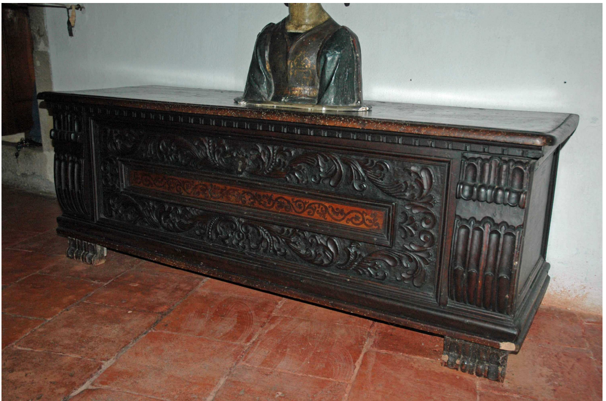
6. Truhla, střední Evropa, kolem poloviny 17. století, inv. č. BU 735