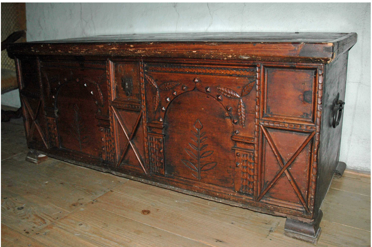
2. Truhla, střední Evropa, konec 16. století, inv. č. BU 592