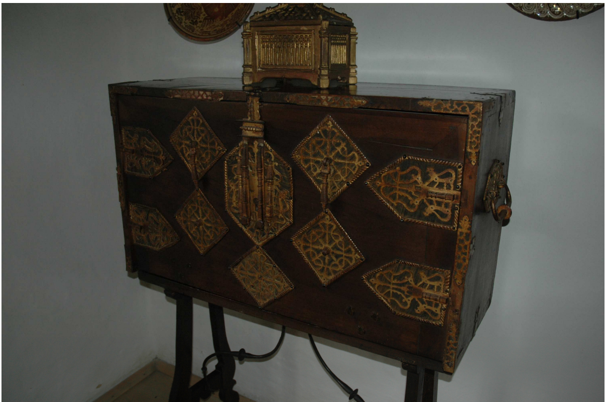
6. Vargueño, Kastilie (Burgas?), konec 16. století, inv. č. VL0072