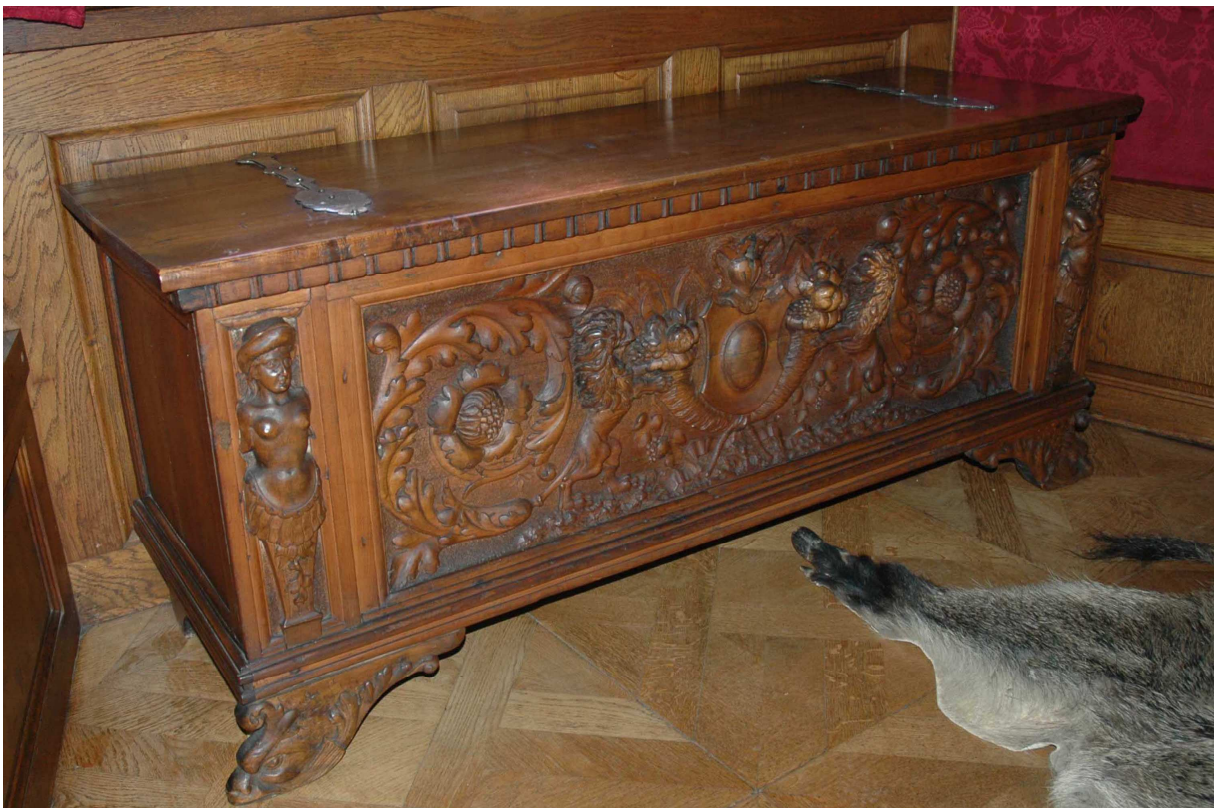
10. Truhla, Itálie, konec 16. století, inv. č. BZ 00568