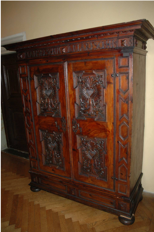
7. Skříň, severní Německo, 1683, inv č. ST00473