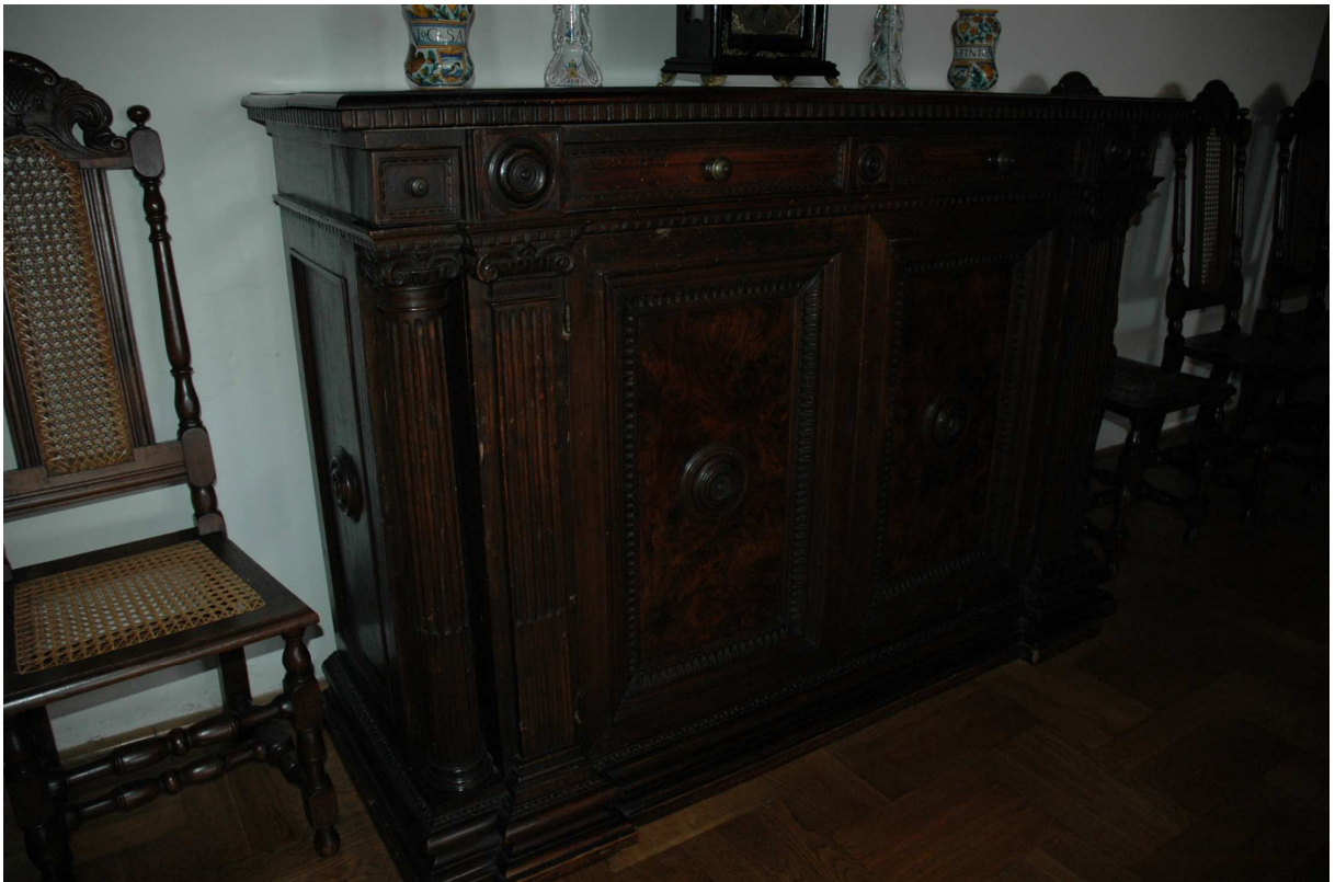
6. Skříň, Toskánsko, konec 16. století, inv. č. ST00103