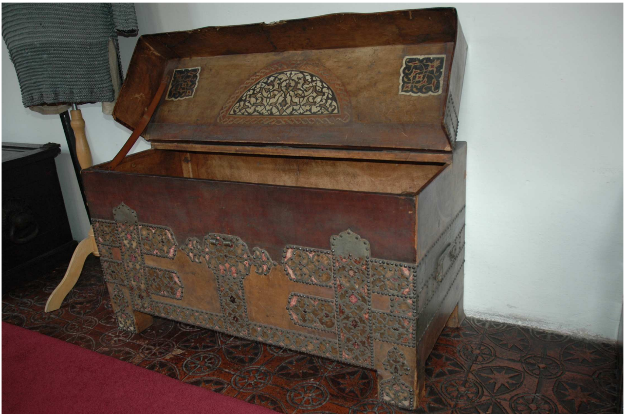
4. Truhla, Španělsko (?), 16. století, inv. č. ST00207