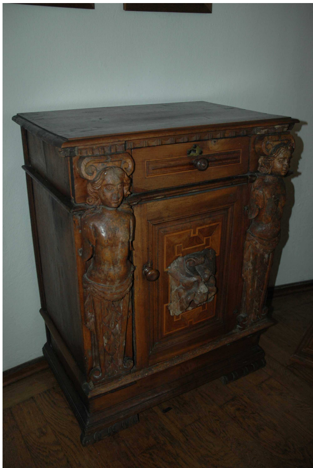
18. Skříňka, jižní Evropa, 1609, inv. č. BZ 00751