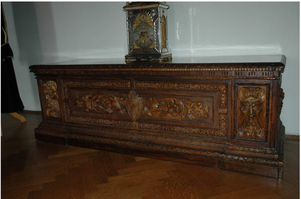
2. Truhla, Itálie, kolem poloviny 16. století, inv. č. ST00151