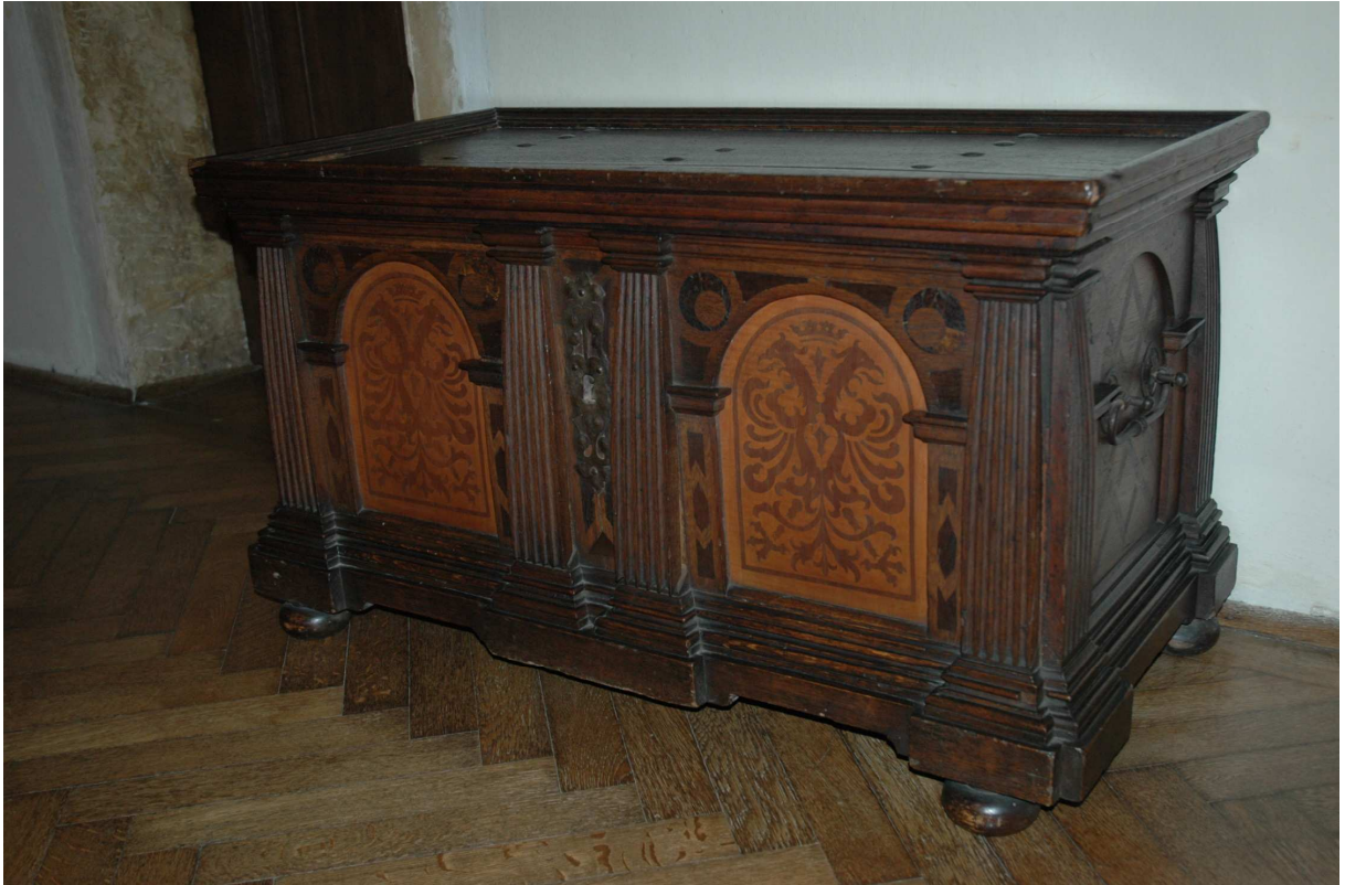
3. Truhla, jižní Německo – Švýcarsko, kolem roku 1600, inv. č. ST00460