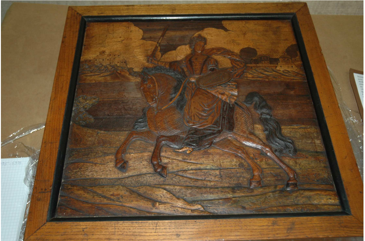
8. Hrací kazeta, Cheb, třetí třetina 17. století, inv. č. U7 N