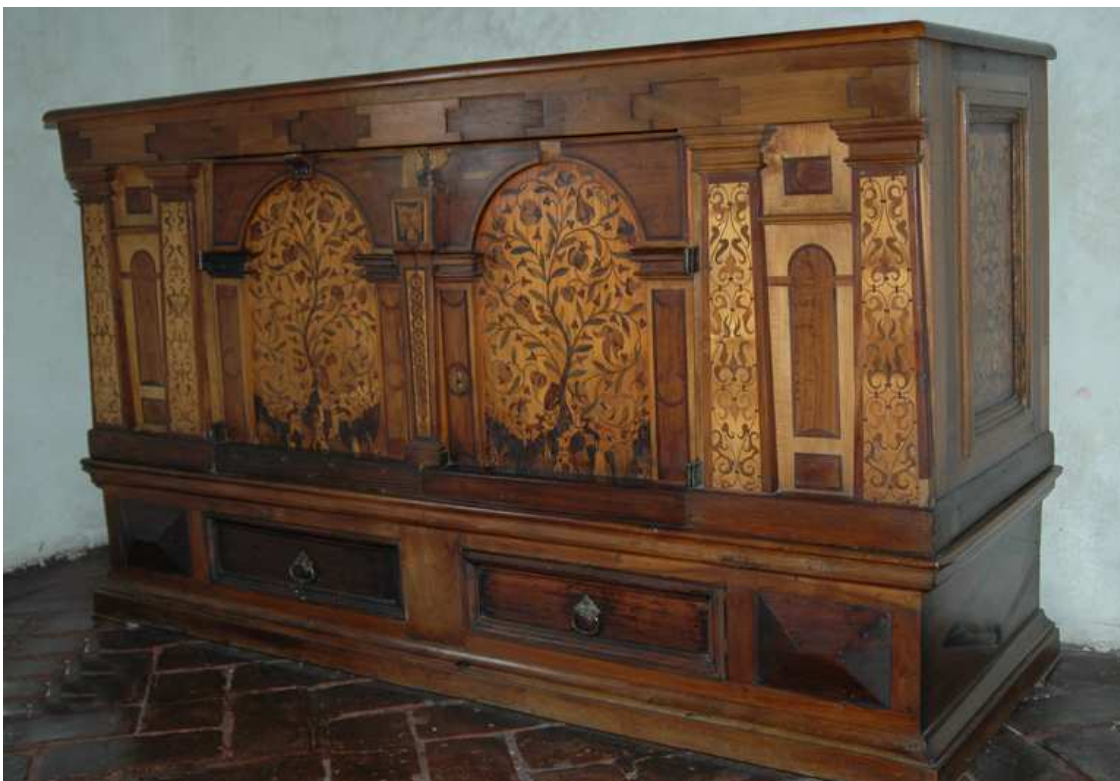
9. Fasádová kredenc, střední Evropa, Holandsko (?), druhá polovina 17. století doplněna v 19. století, inv.č. BO 69