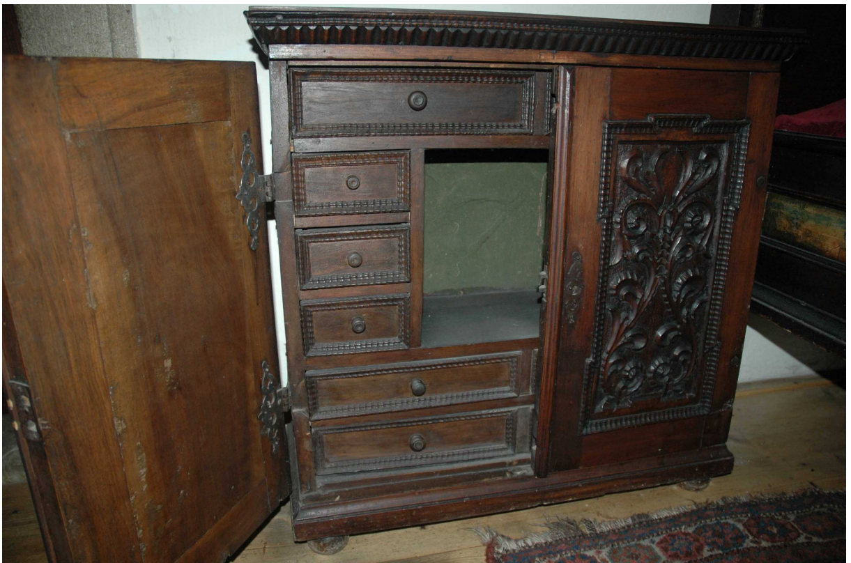
17. Kabinet, severní Německo, první polovina 17. století, inv. č. BU 779