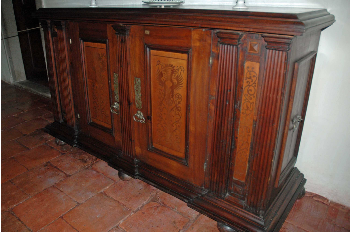
18. Příborník, Švýcarsko, druhá polovina 16. století, inv. č. BU 733

11.4. Katalog renesančního úložného nábytku na státním zámku Buchlovice.