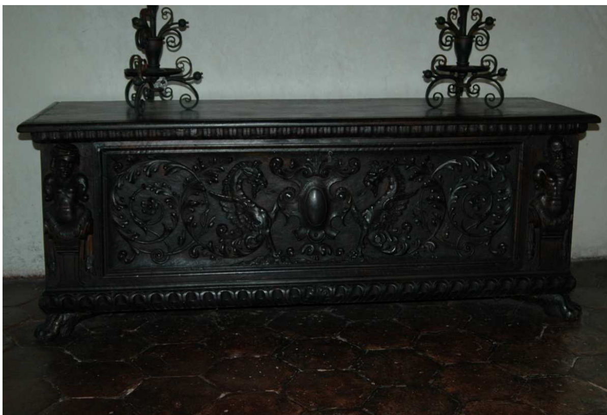
2. Truhla, Florencie, počátek 17. století, inv. č. BO-59