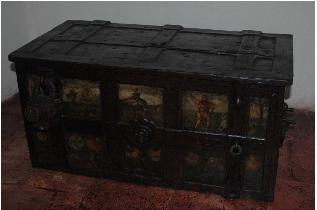
14. Truhla, střední Evropa, první polovina 17. století, inv. č. BU 696