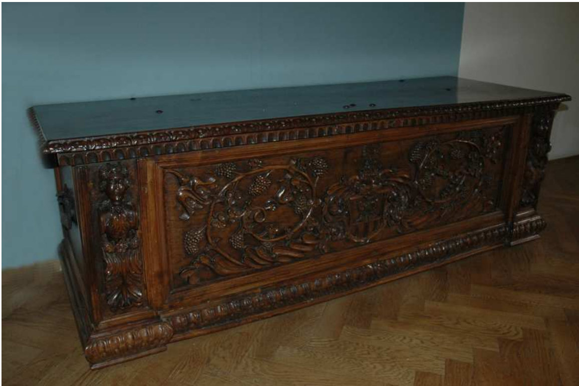
8. Cassone, střední Itálie (?), před rokem 1600, inv. č. VL00153