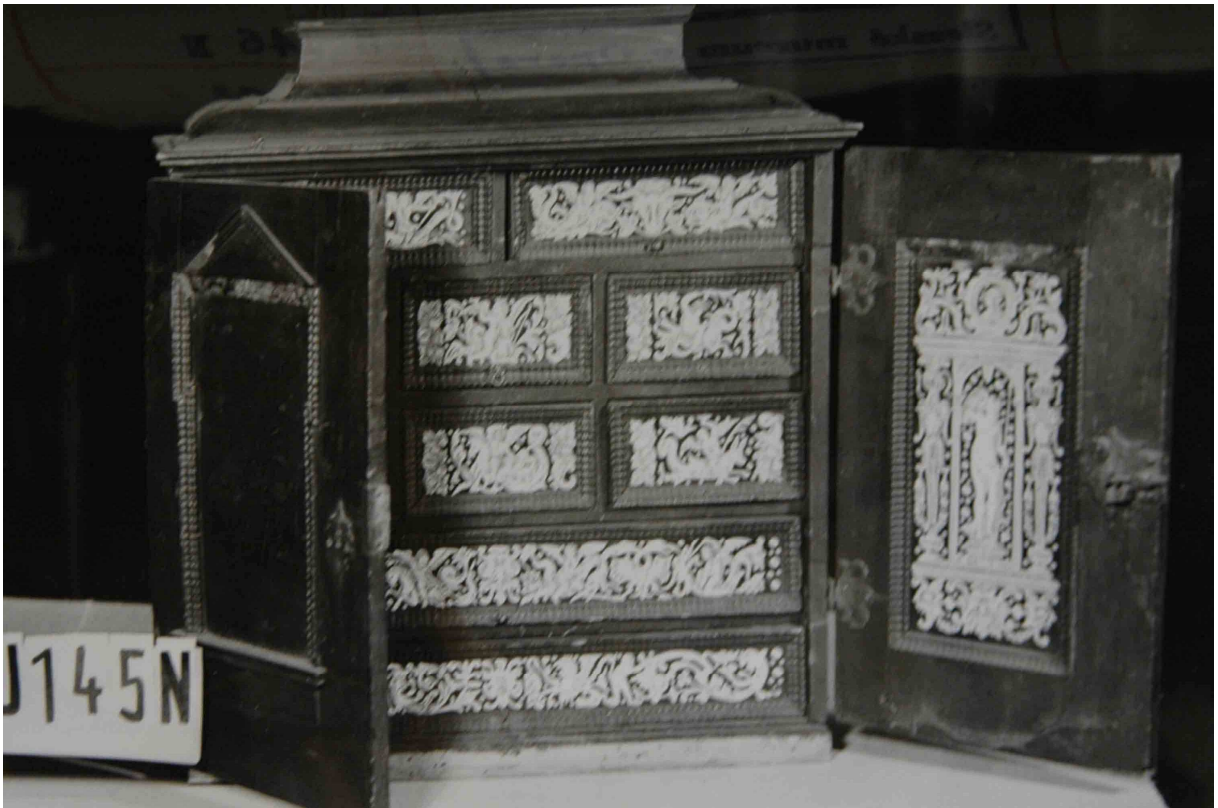
12. Šperkavnice, severní Německo, před rokem 1700, inv. č. 146 N