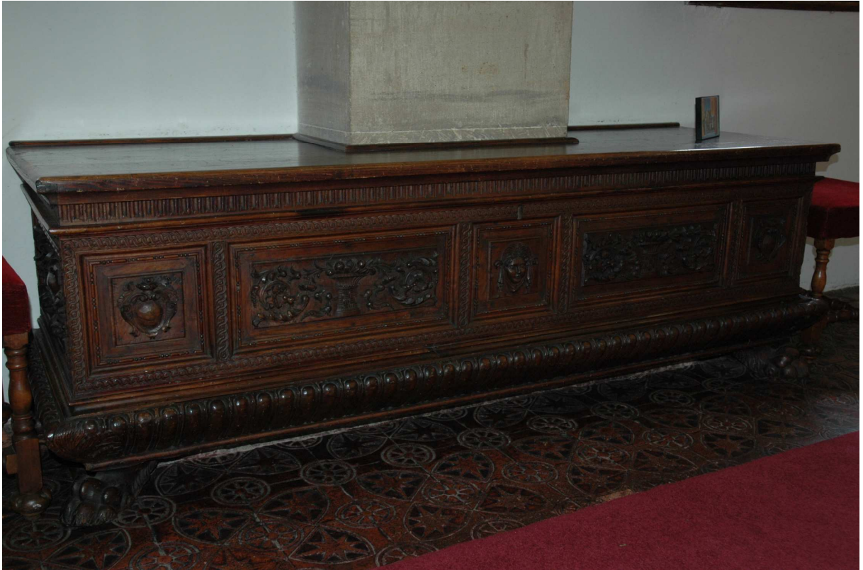
5. Truhla, Siena, kolem roku 1540, inv. č. ST00018