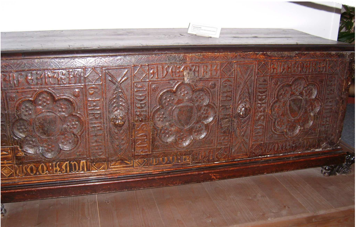
2. Truhla, Siena, začátek 15. století, inv. č. U14 N