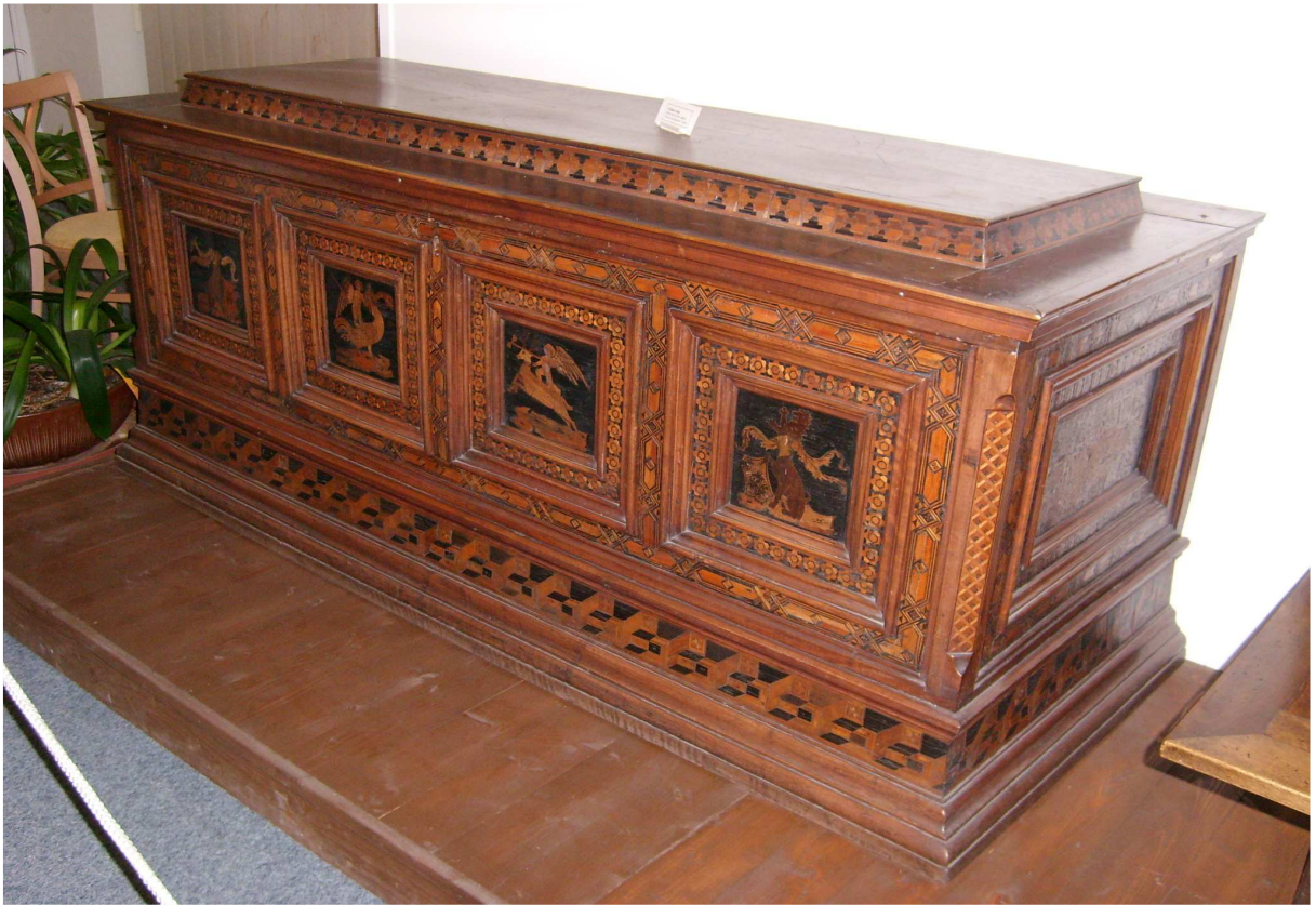
1. Truhla, Florencie, první polovina 17. století, inv. č. U12 N