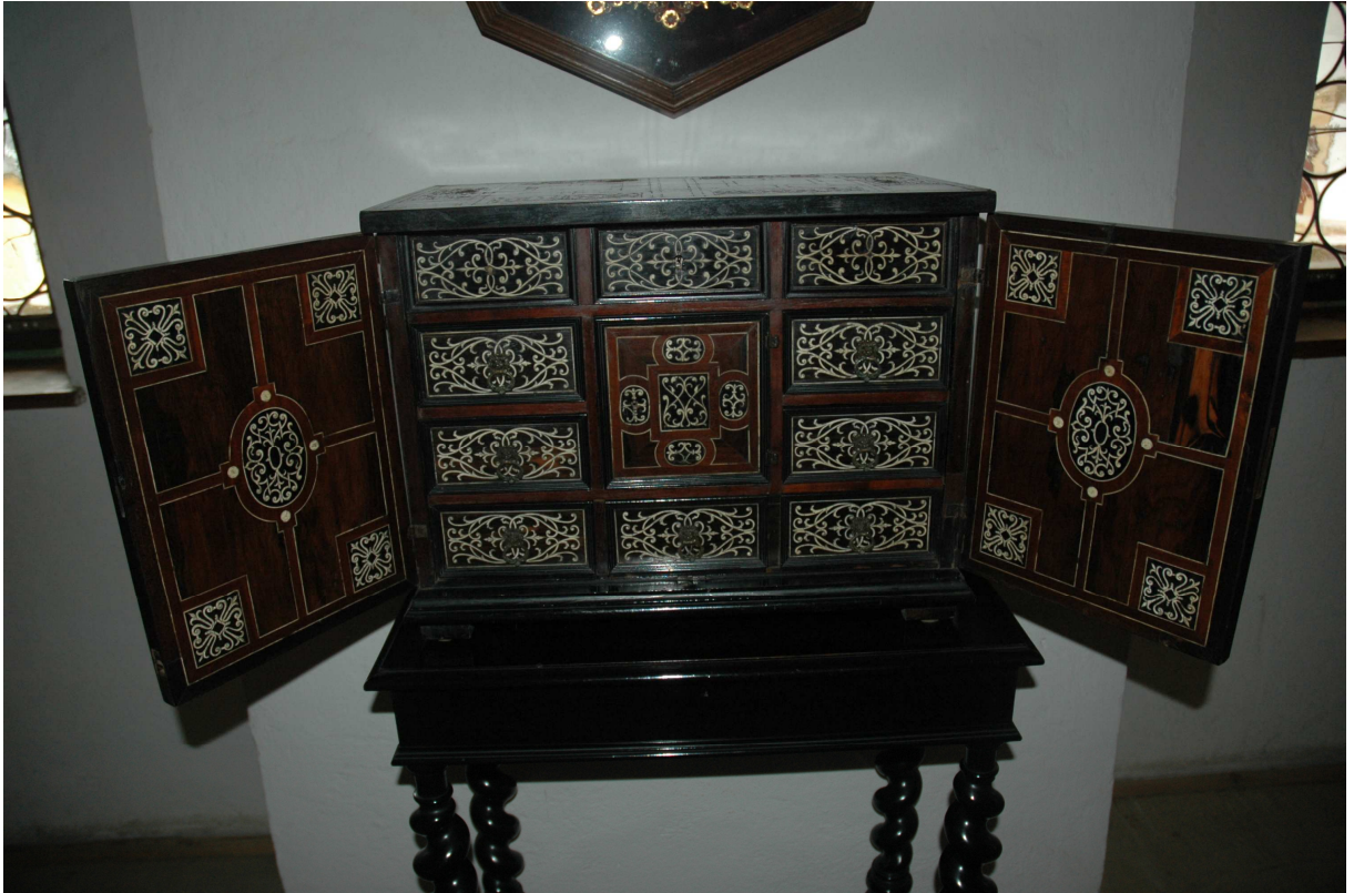
5. Kabinet, Holandsko, první polovina 17. století, inv. č. VL0136