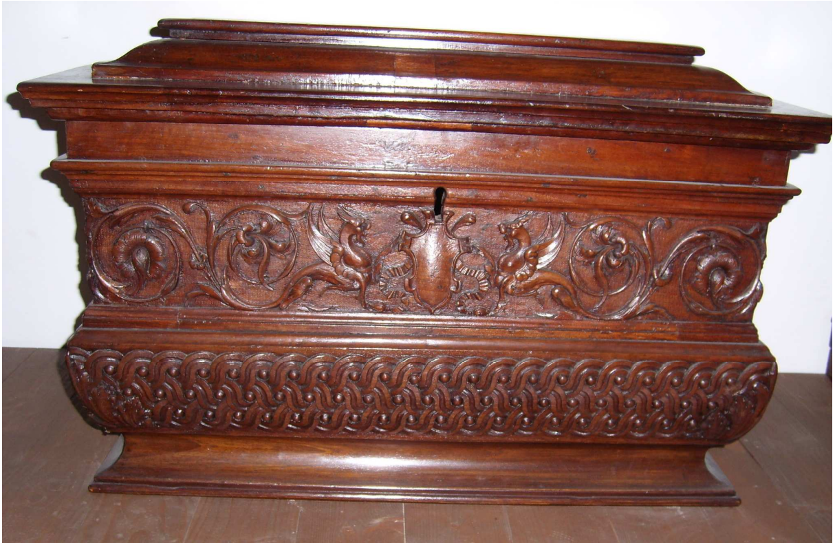
3. Truhlice, Florencie, 16. století, inv. č. U15 N