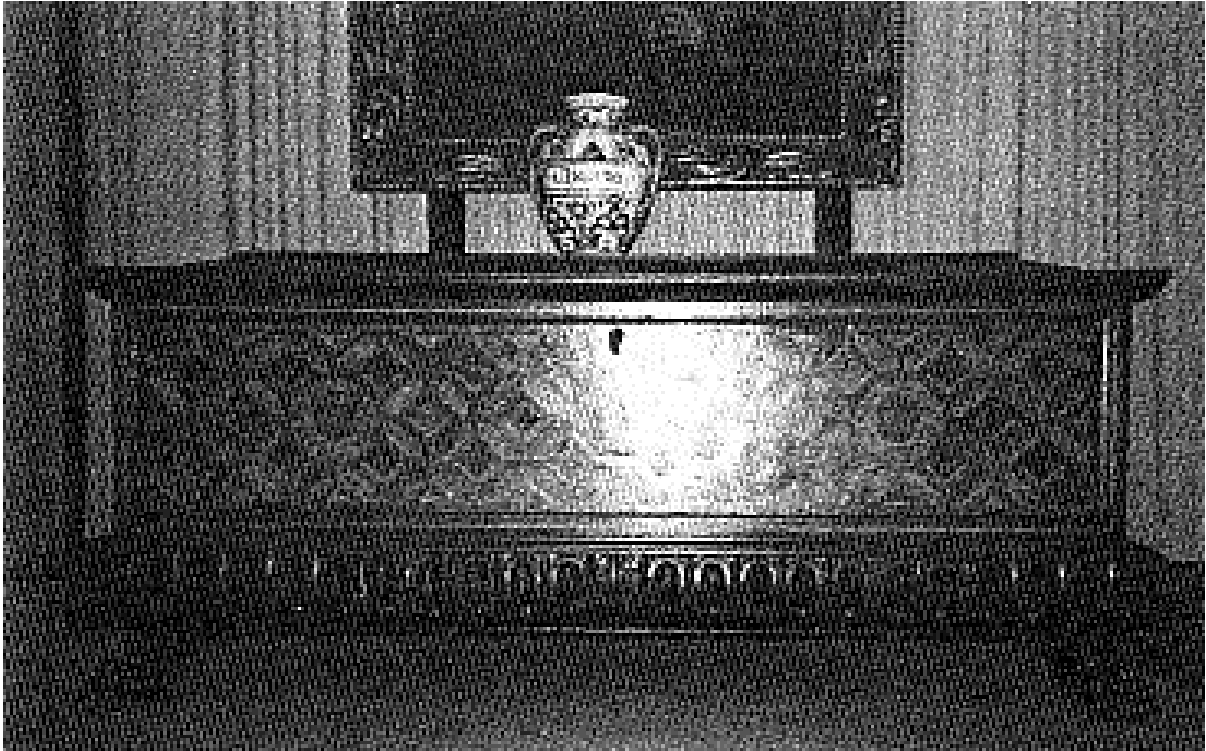
3. Truhla, Bologna, 16. století, inv. č. 7 056