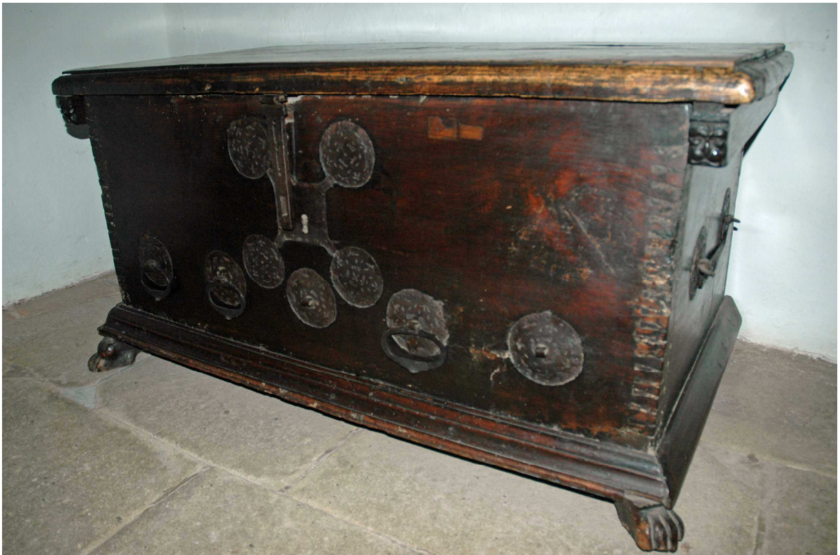
1. Truhla, severní Itálie, 15. století, inv. č. BU 584