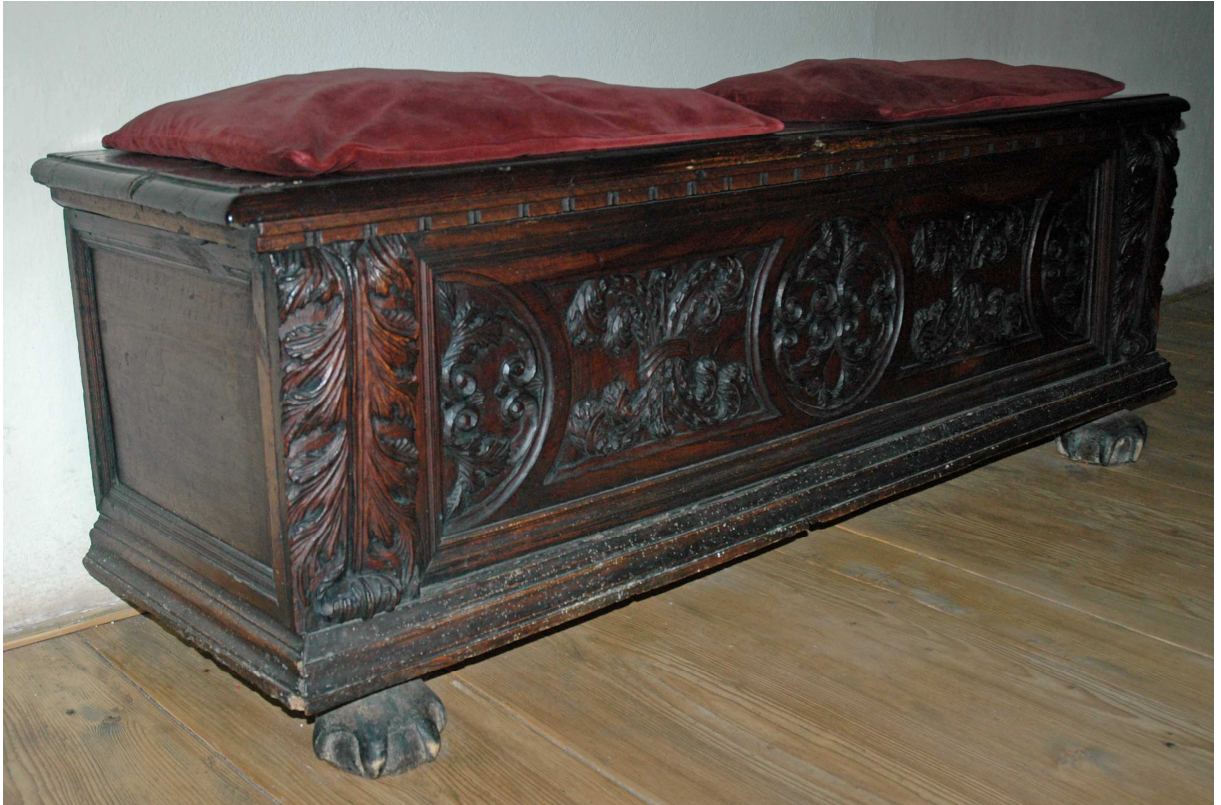
5. Truhla, střední Evropa, druhá polovina 17. století, inv. č. BU 796