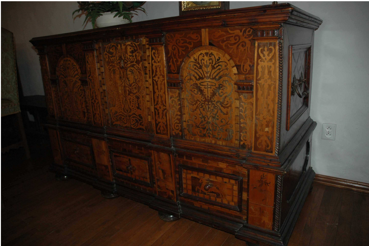
1. Truhla, Tyrolsko, první polovina 17. století, inv. č. BZ 00460