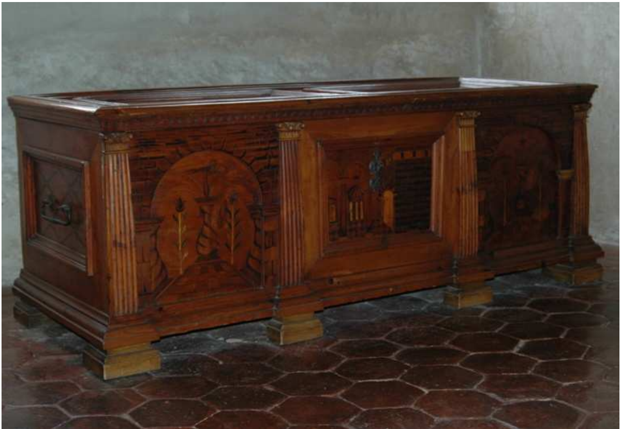
5. Truhla, jižní Německo, kolem roku 1600, inv. č. BO-71