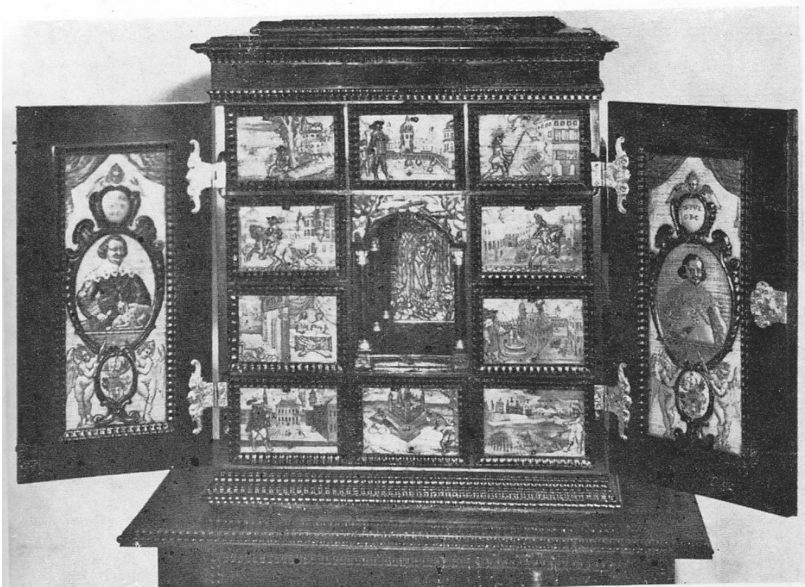
11. Kabinet Čechy(?), kolem roku 1650, stůl doplněn v 19. století, inv. č. BO-55