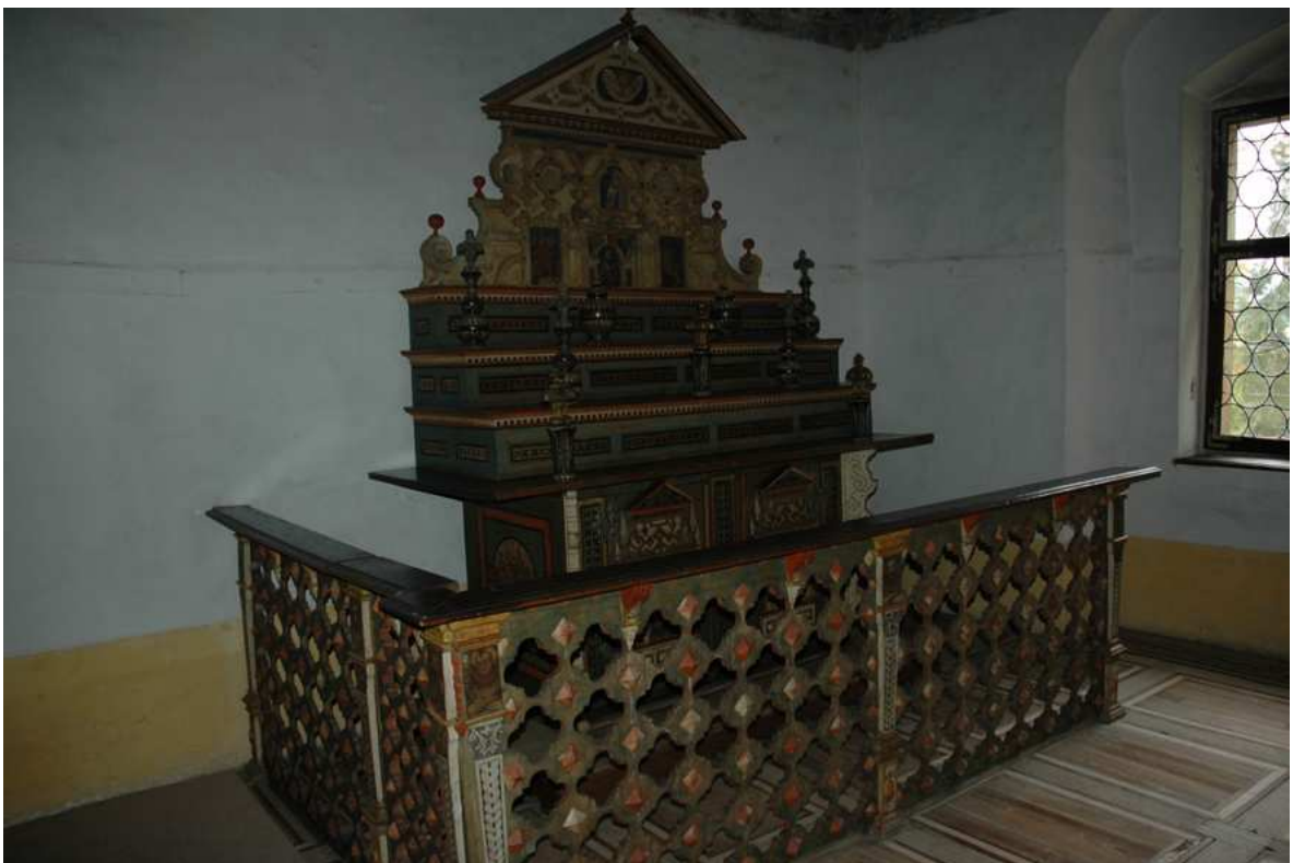
4. Příborník, Morava (?), 16. století, inv. č. VL00183