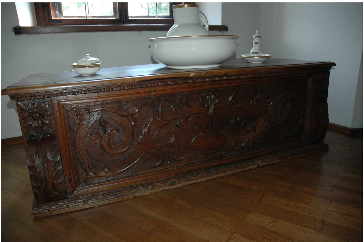
4. Cassone, střední Evropa, 17. století, inv. č. BZ 01128