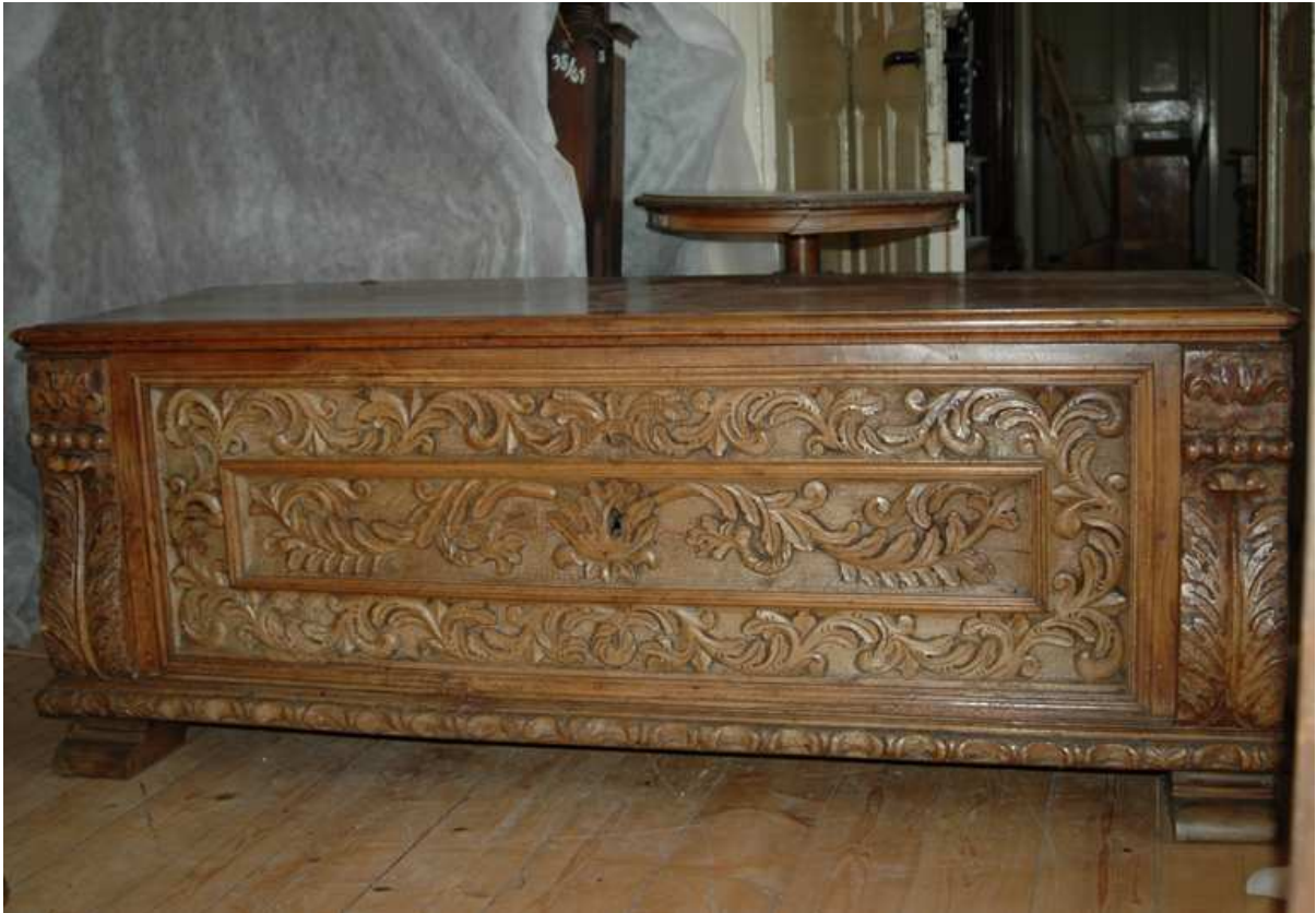
3. Truhla, střední Evropa, první polovina 17. století, inv.č. BO-63