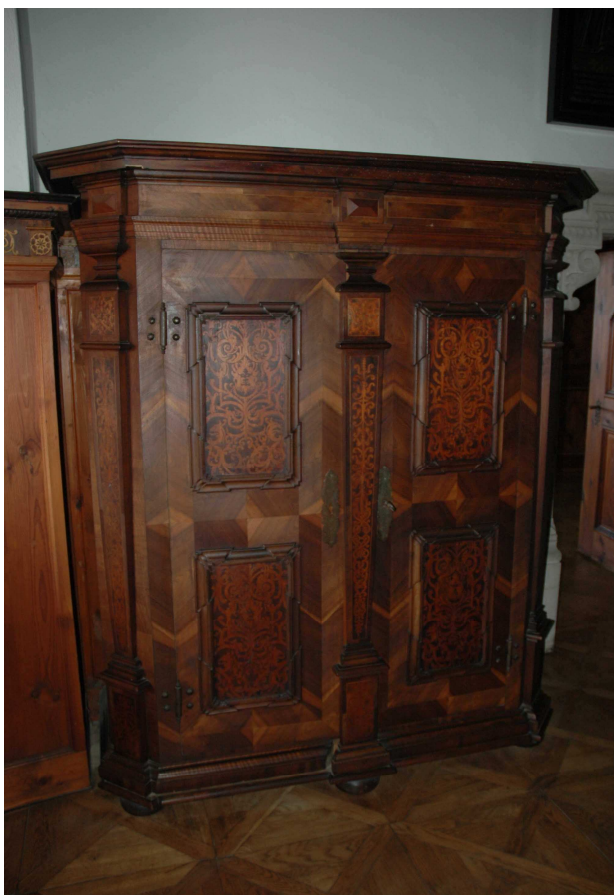
13. Skříň střední Evropa, konec 17. století, inv. č. BZ 00479