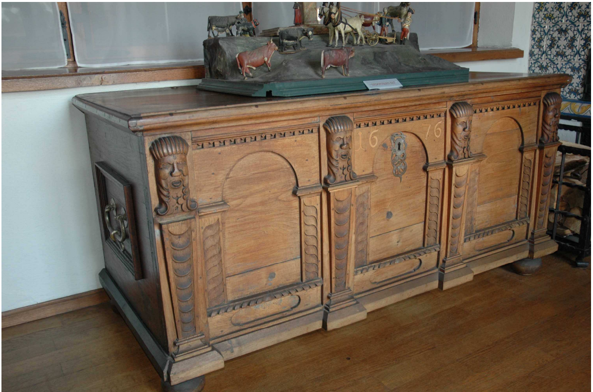
7. Truhla, severní Německo (?), 1676, inv. č. BZ 00708