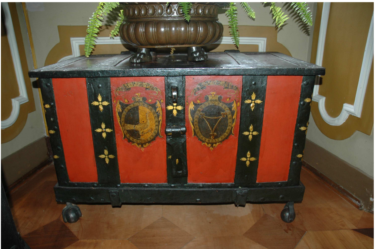
2. Kovaná truhla, Holandsko (?), datováno 1613, inv. č. BC 6553