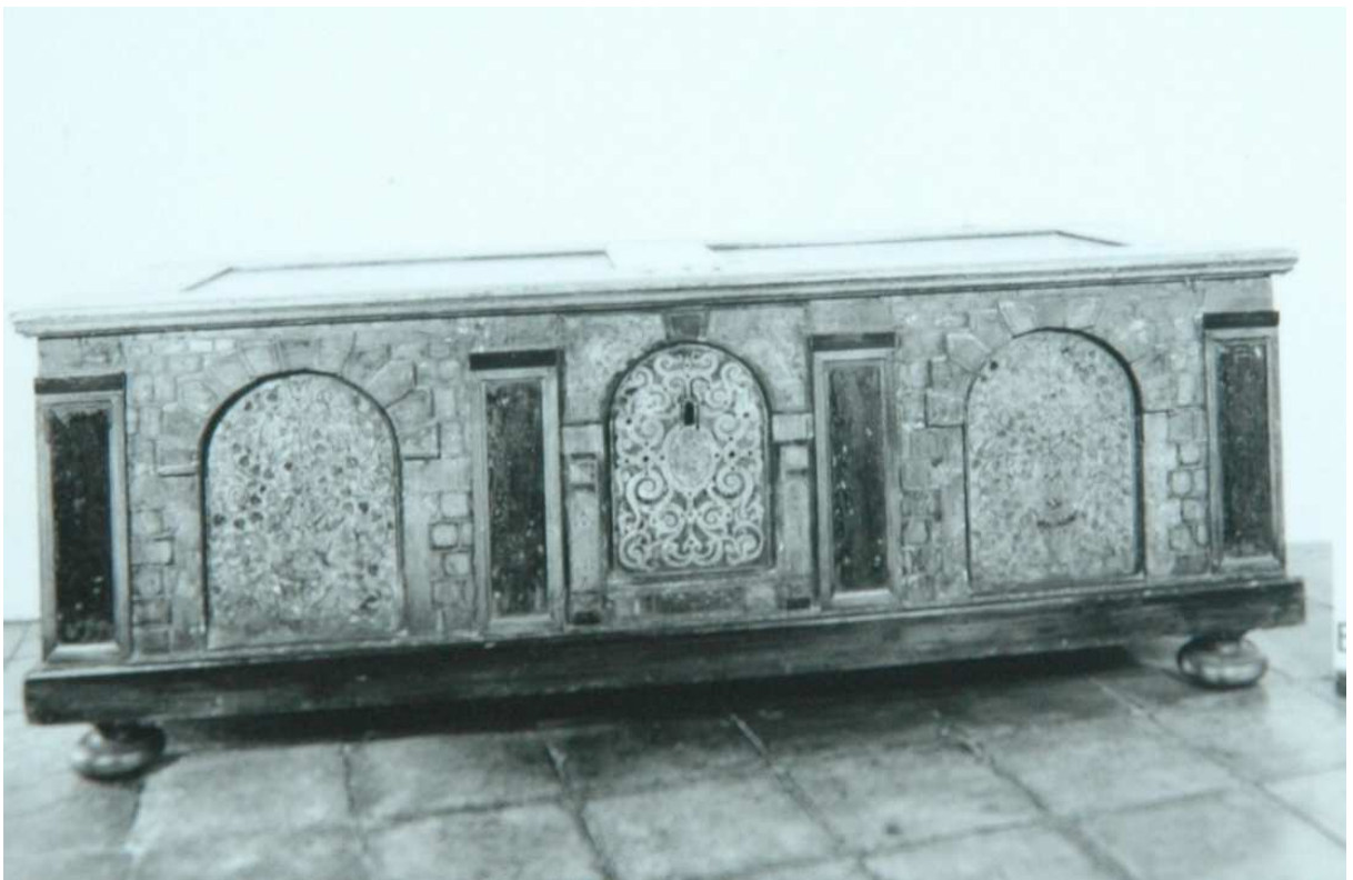
15. Truhla, Morava (?), počátek 17. století, inv. BU 862