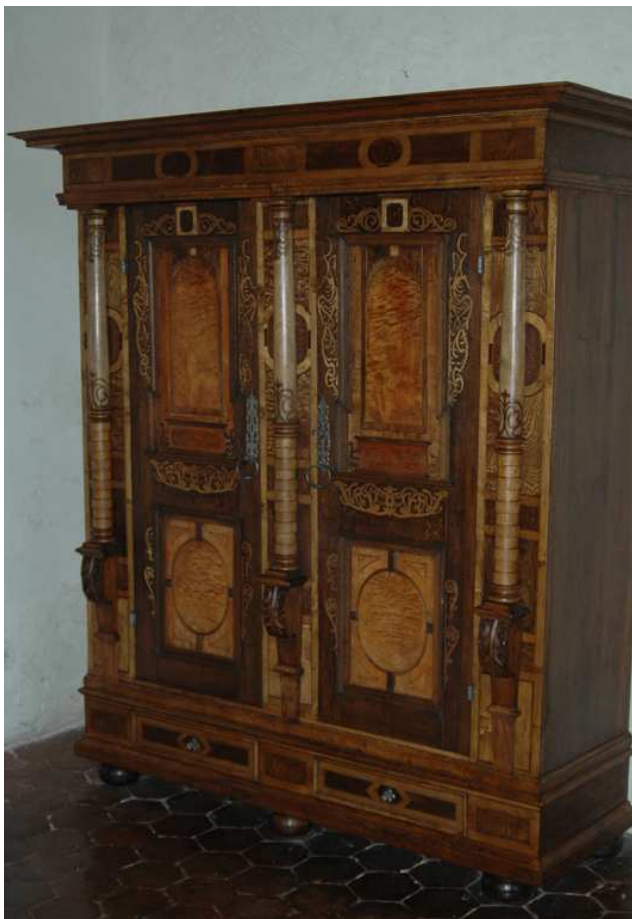
11. Fasádová skříň, střední Evropa, datováno 1667, inv. č. BO-70