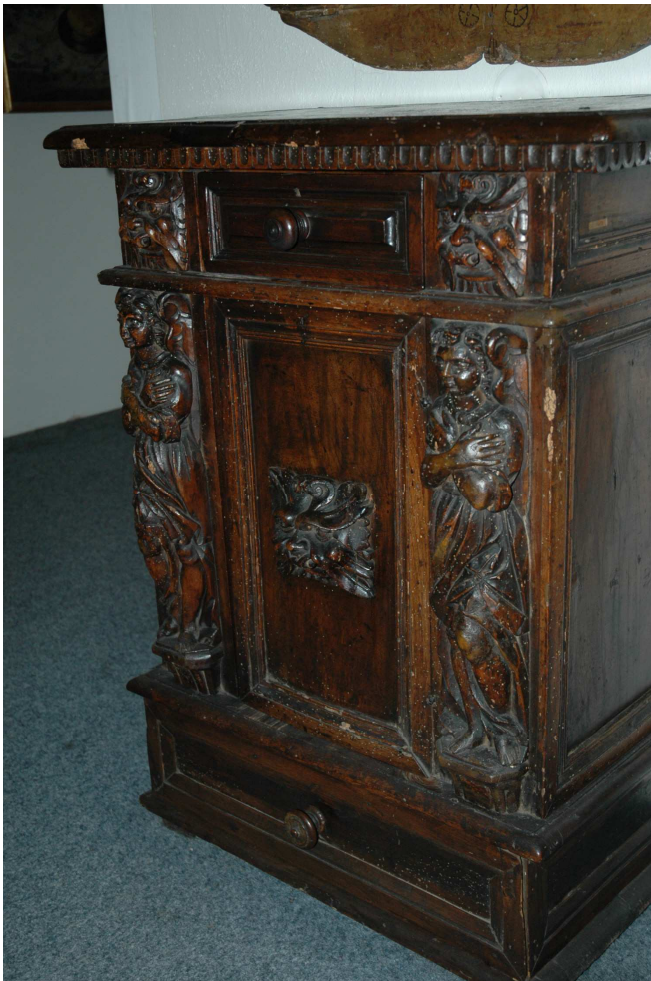
9. Skříňka, Itálie Toskána (?), 16. století, inv. č. U120 N