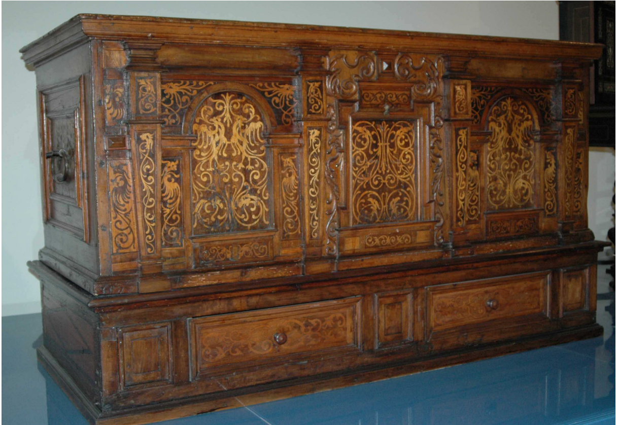
1. Truhla, jižní Rakousko, polovina 17. století, inv. č. 6 342