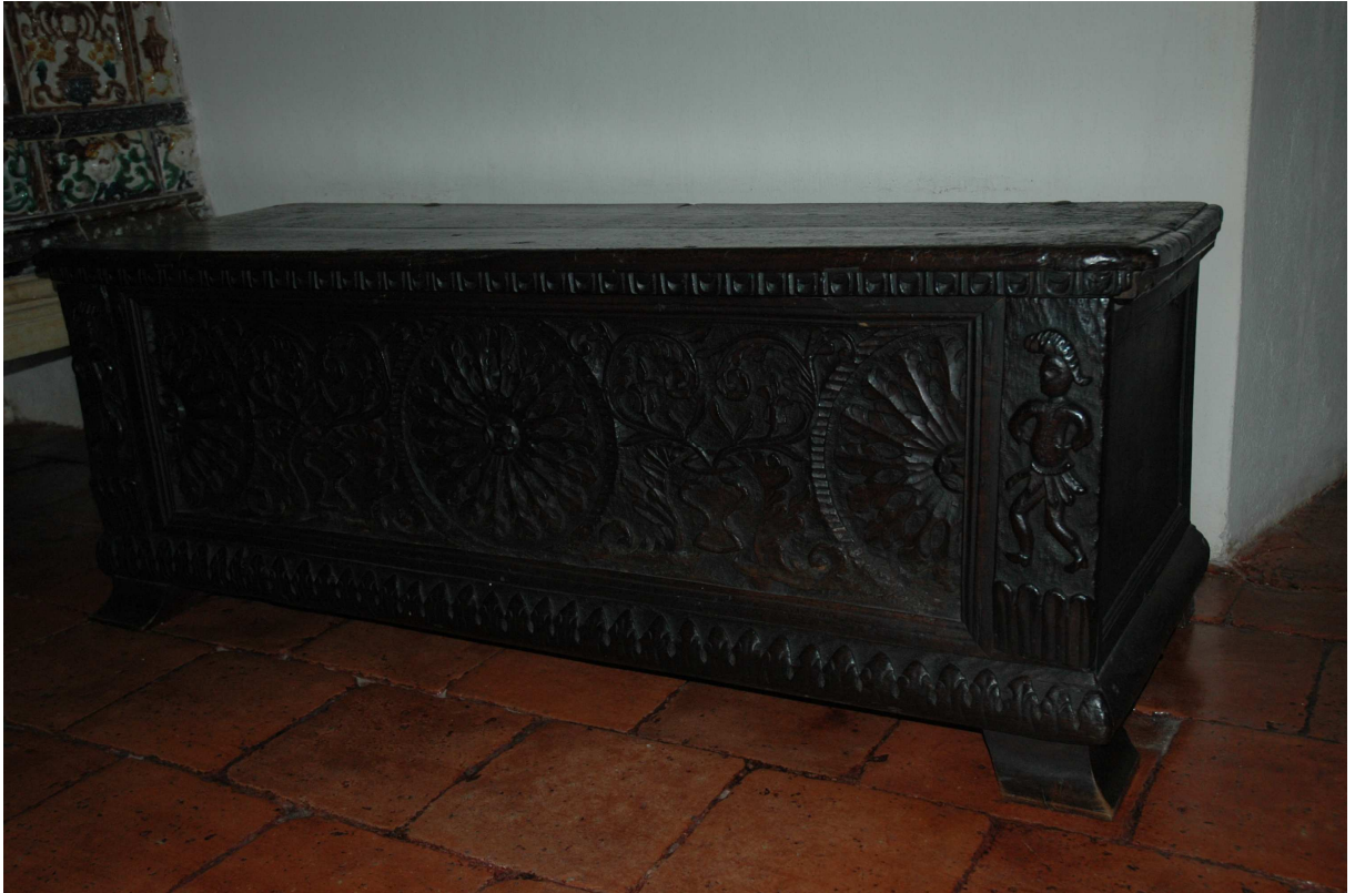
16. Truhla, střední Evropa, druhá polovina 17. století, inv. č. BU 384