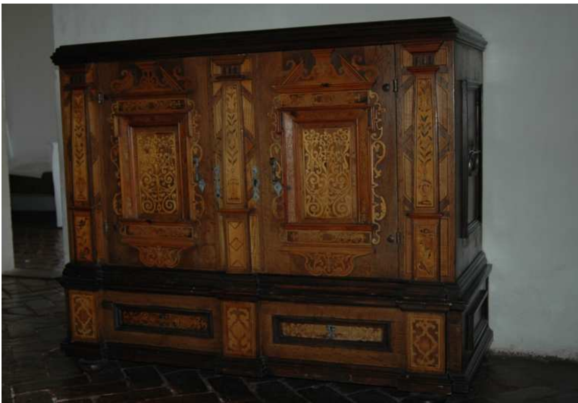
10. Fasádová kredenc, střední Evropa, druhá polovina 17. století, inv. č. BO-65