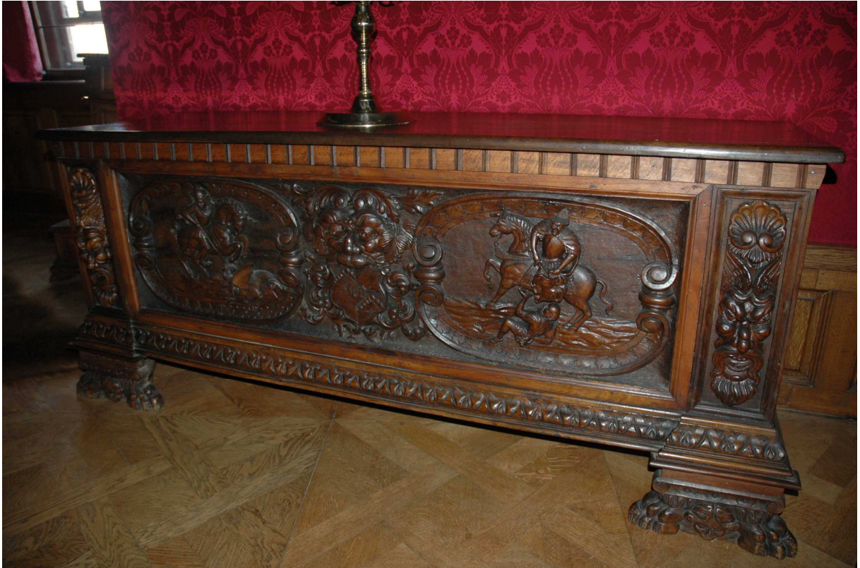
9. Truhla, severní Itálie, konec 16. století, inv. č. BZ 549