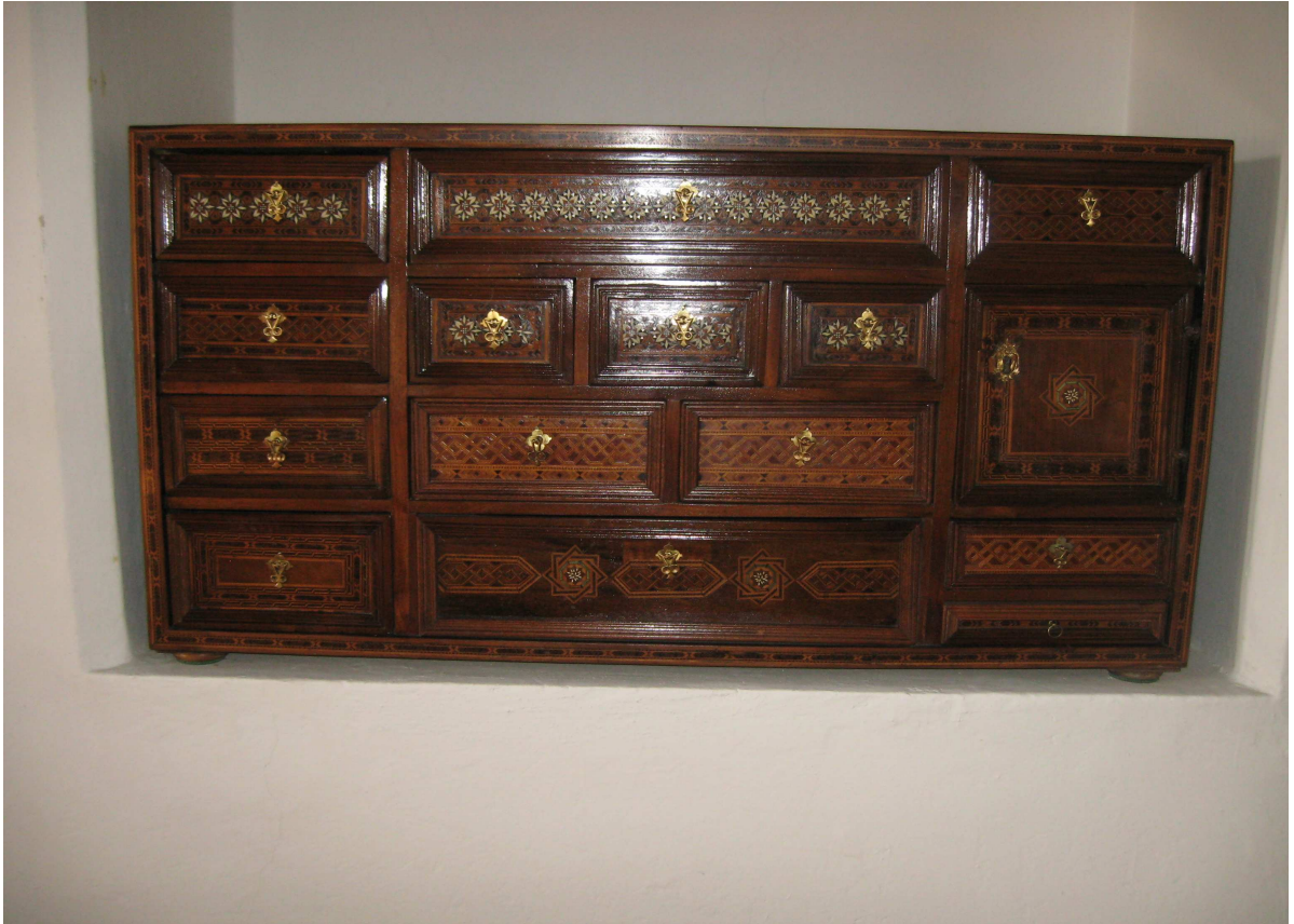
1. Sekretář, severní Itálie kolem roku 1700, inv. č. ST01350