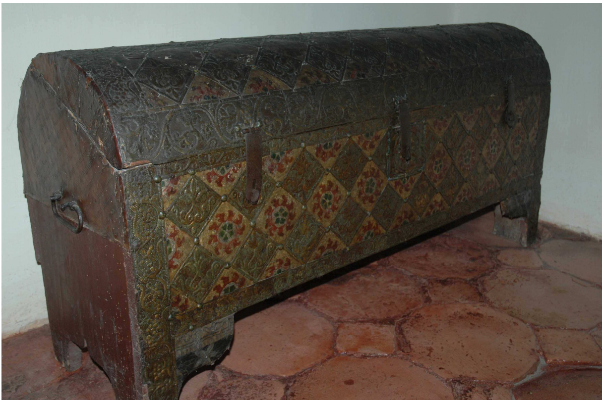
4. Truhla, Benátky, konec 16. století, inv. č. BU 637