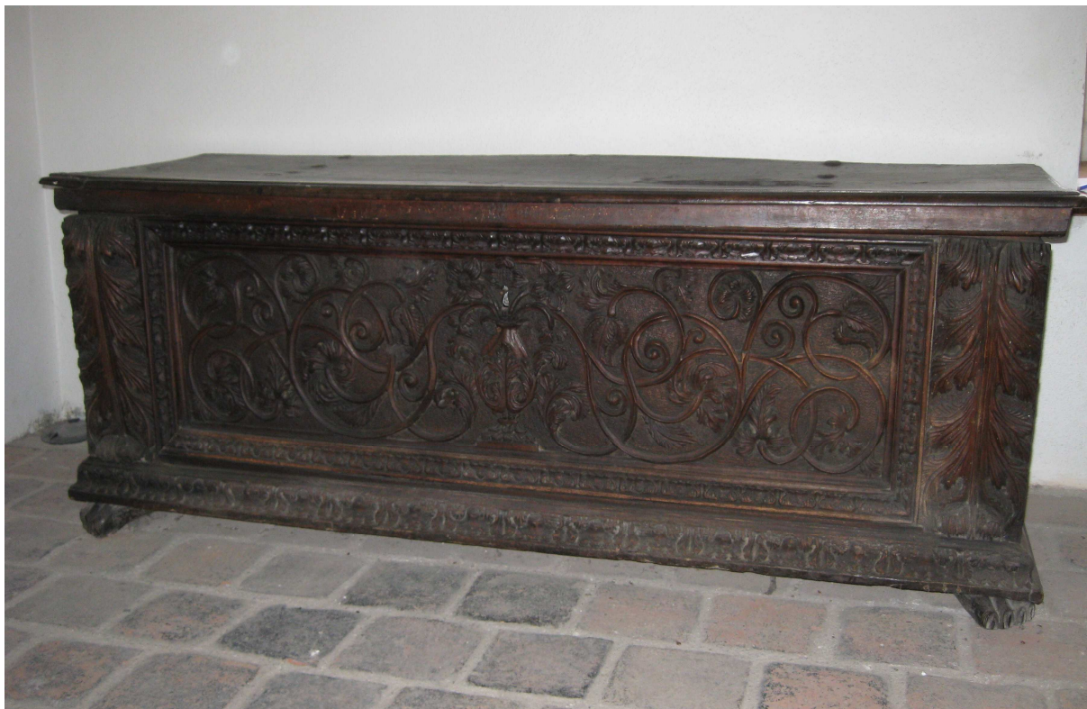
1. Cassone, střední Evropa, první polovina 17. století, inv. č. T741/64/1