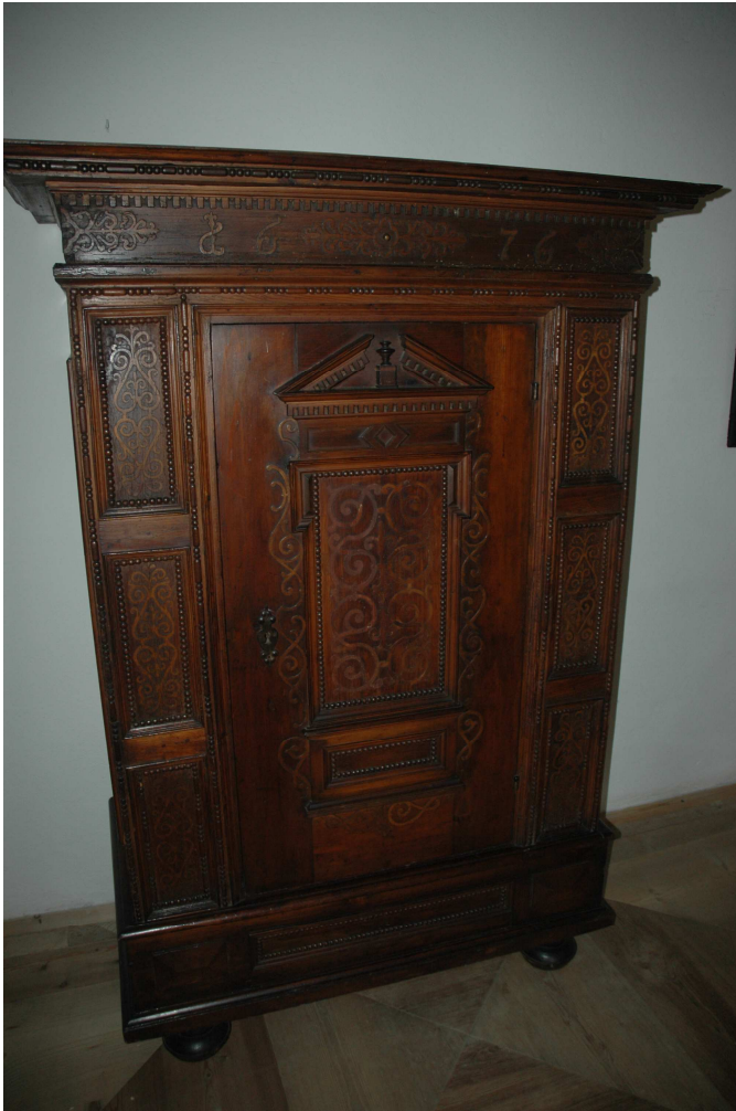
7. Šatní skříň, 1676, inv. č. VL00118