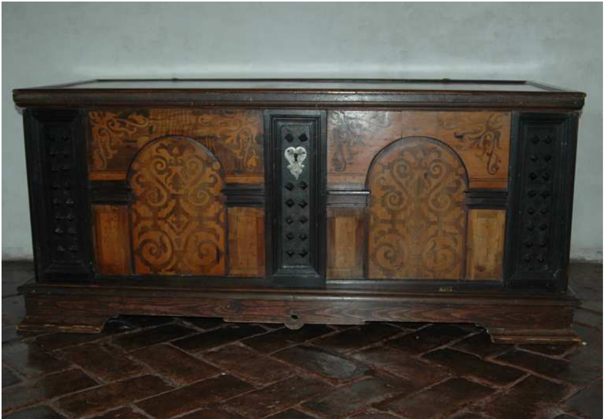
7. Truhla, střední Evropa – Čechy (?), druhá polovina 17. století, inv. č. BO-62