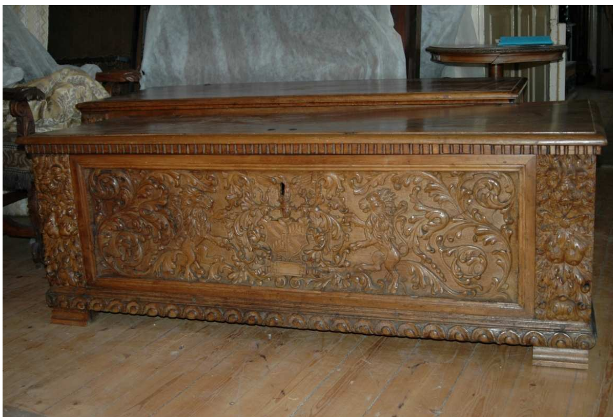
1. Truhla, severní Itálie, kolem roku 1600, inv. č. BO-58