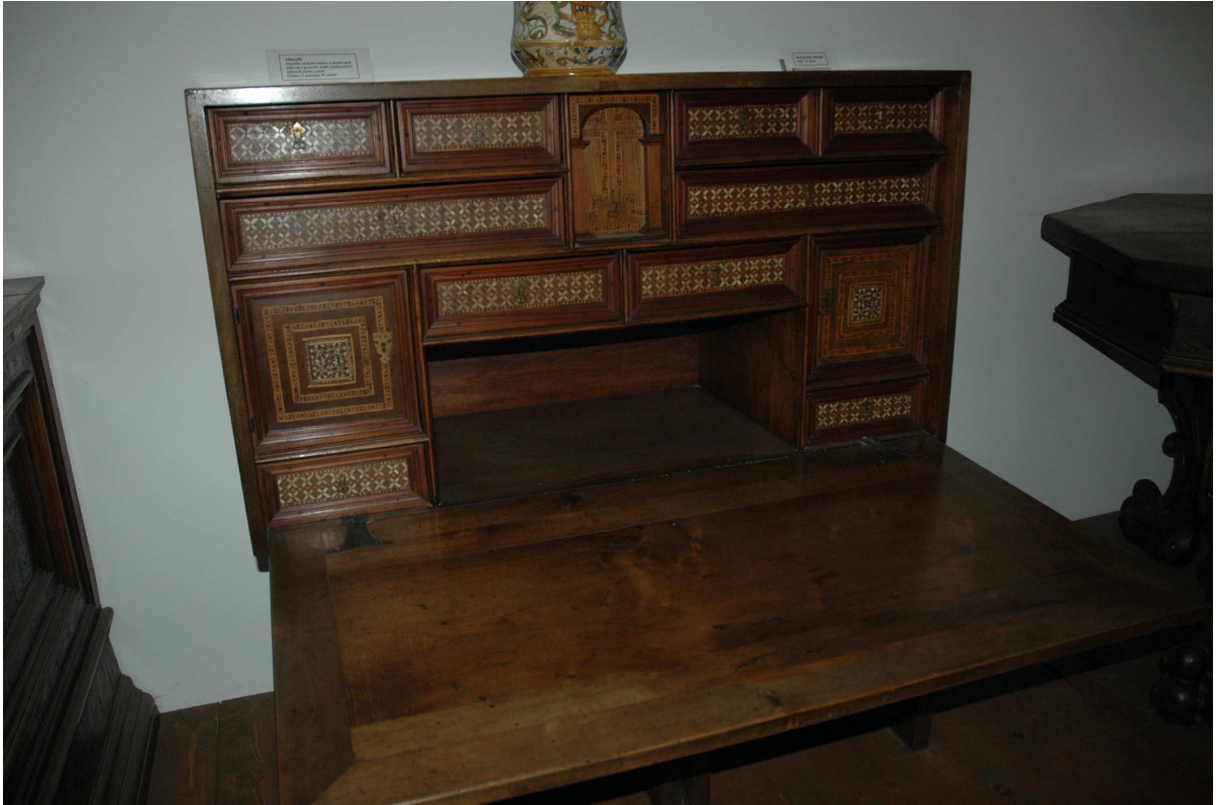
10. Sekretář, Itálie Toskána (?), 16. století, inv. č. U13 N