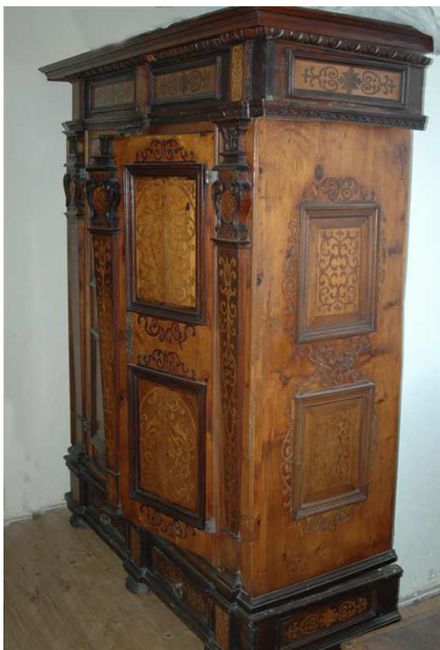
12. Fasádová skříň, Ulm, druhá polovina 17. století, inv. č. 13.470.