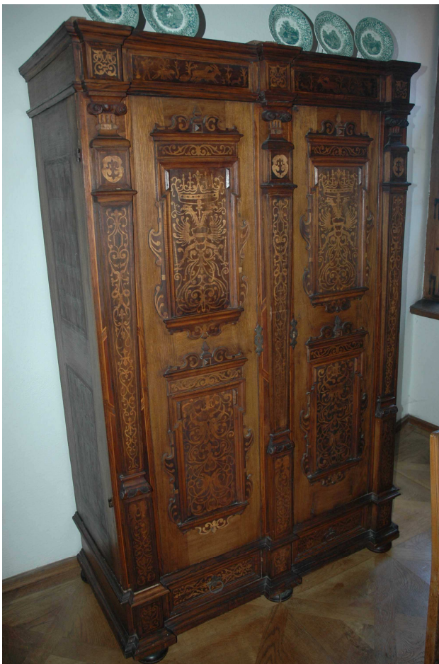
12. Skříň, Německo, druhá polovina 17. století, inv. č. BZ 00782