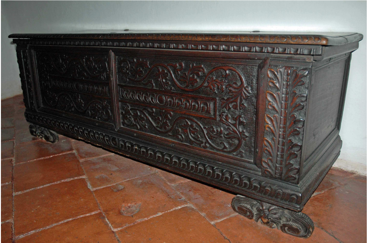
7. Truhla, střední Evropa, první polovina 16. století, inv.č. BU 734