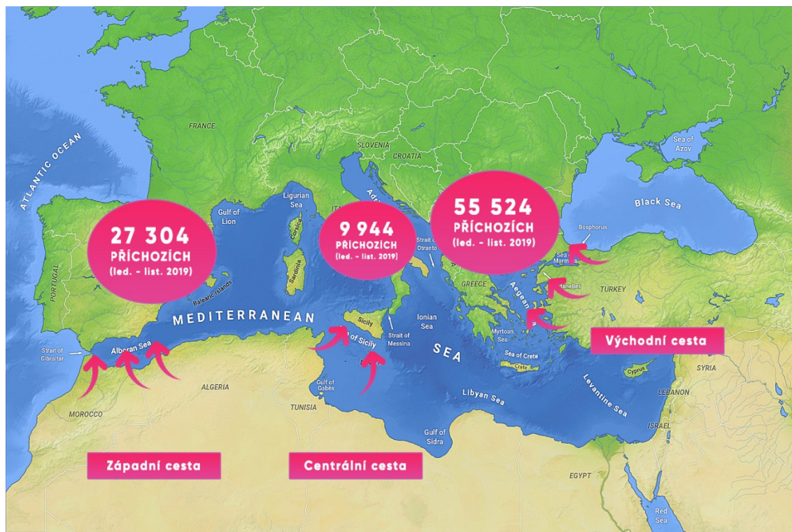
Obrázek č. 2: Mořská cesta do Řecka, Itálie a Španělska 72

V důsledku tragických událostí z října 2013, při nichž při potopení dvou lodí poblíž italského ostrova Lampedusa zemřelo podle odhadů 368 migrantů, začala IOM shromažďovat informace o migrantech, kteří zahynuli nebo zmizeli na migračních trasách po celém světě, vznikl tak projekt zaměřený na nezvěstné migranty tzv. Missing Migrants Project (MMP). Od roku 2014 tento projekt zaznamenal úmrtí více než 32 000 lidí 73 , mezi roky 2017 a 2018 počet úmrtí a zmizení celosvětově výrazně poklesl a to z 6 279 na 4 734. Hlavním důvodem tohoto propadu je pravděpodobně pokles počtu migrantů, kteří používají středomořskou trasu k dosažení Evropy. 74