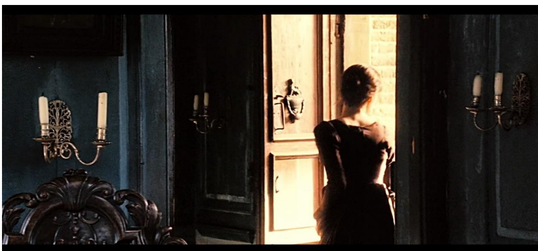
Obr. č. 3: Elizabeth odmieta žiadosť a odchádza.