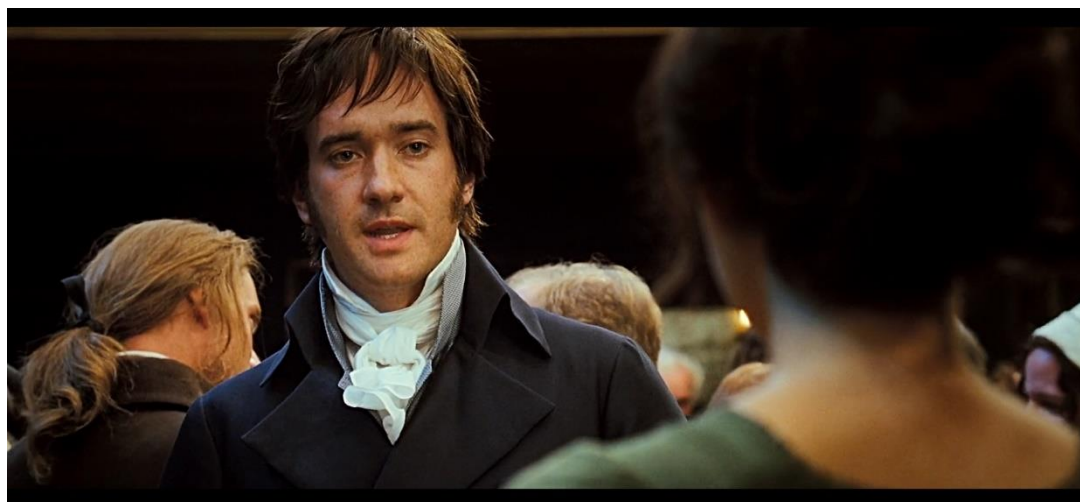
Obr. č. 1: Prvý rozhovor medzi pánom Darcym a Elizabeth.

Jeho nápady, aplikujúce sa na obsah a kontext filmu vytvárajú perspektívu režiséra. Tým sa stáva práve adaptátorom predlohy, ktorá poskytuje čitateľovi príbeh skrz dialógy a mnoho opisov, pre vytvorenie lepšej predstavy aj u samotného režiséra. J. Wright túto filmovú adaptáciu pojíma z pohľadu lásky dvoch ľudí a vývoja charakteru postáv, čo môžeme badať na kľúčových scénach, ktoré pre to zvolil. Vzťah medzi pánom Darcym a Elizabeth bol na začiatku veľmi chabý, ale na pár detailných záberoch pohľadu pána Darcyho a úsmevu z polichotenia u Elizabeth divák rozpozná, že to ešte bude pokračovať. Tak ako jedna zo scén prvého tanca Elizabeth s pánom Darcym, kedy ju on sám zavola tancovať nás to vracia na začiatok, kde Darcy položil otázku Elizabeth: „Čím posmeliť rodiaci sa cíti? Elizabeth: Tancom. Aj keď je partnerka iba obstojná. “ Už v tej chvíli vedel, že k nej niečo cíti.