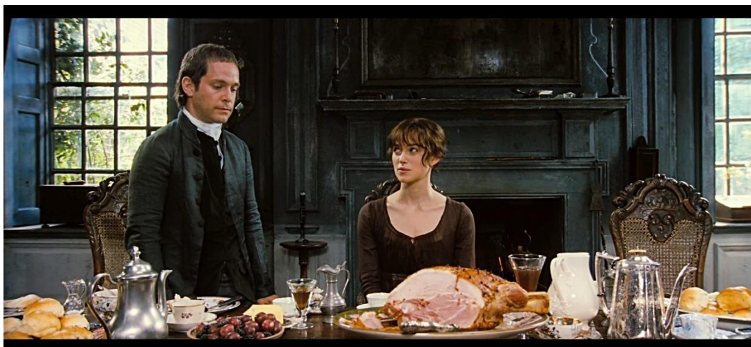
Obr. č. 4: Predhovor pána Collinsa pri žiadosti o Elizabethinu ruku.