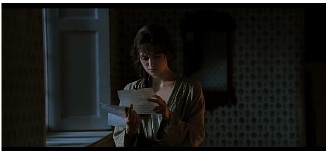
Obr. č. 122: Darcyho vysvetlenie problematiky v liste.

Keď skončí táto scéna, Elizabeth príde domov a odrazu sa jej život odohráva ako keby sa nič nestalo. Týmto spôsobom adaptácia zapojí diváka do príbehu emocionálne, na základe premýšľania o problematike a riešení vzťahového konfliktu. Dodáva mu to odpovede a vysvetlenie Darcyho tajomnosti voči Elizabeth. Recipient je s postavou v miestnosti sám a Elizabeth venuje plnú pozornosť premýšľaniu. Zvedavosť zo strany recipienta sa prenáša na túžbu analyzovať pocity danej postavy.