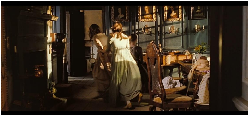
Obr. č. 7: Naháňajúce sa sestry.