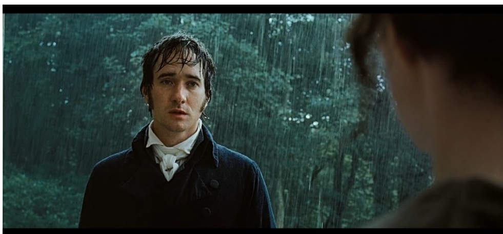
Obr. č. 177: Protizáber na pána Darcyho pri žiadosti o Elizabethinu ruku.

Interpretácia motívov, ako dážď a zmena tónu v hlase postavy, je identifikátorom možností, ktoré vstupujú ako náhrada slov s plnohodnotným významom. V tej scéne Elizabeth chce vysvetlenie o tom, aký mal Darcy vplyv na vzťah Jane a Bingleyho a zároveň zistí, že pán Darcy ju miluje a chce s ňou byť, čo ona ale odmietne. Rozdiel v závere filmu oproti knihe je zvolený filmármi rýchlejšou cestou ako stretnutie v zarosenej krajine, kde kráčajú oproti sebe, aby si konečne mohli vyznať vzájomnú lásku, ktorá bola počas priebehu filmu skrátaná. V knihe je záver zvolený prechádzkou, kedy si tiež vyznajú lásku, avšak pri všetkých podpichovačných dialógoch v knihe a pre čitateľove lepšie pochopenie, nie je potrebné, aby bol koniec tak romantický. Okrem toho, že autorka v 19. storočí ukázala vyznanie lásky, neboli praktiky romantiky ešte tak rozvetvené. Tým, ako bol film adaptovaný pre určitú skupinu ľudí, tak sa sústreďí na pojmávanie lásky cestou, ktorá je v tejto dobe tak chcená.