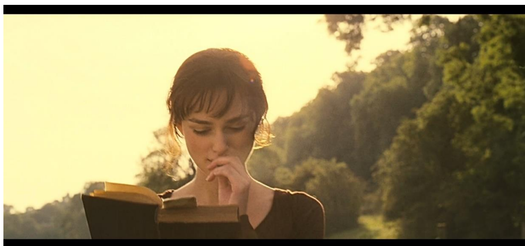
Obr. č. 6: Elizabethina záľuba v čítaní kníh.