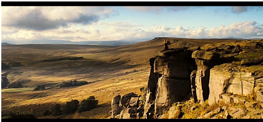
Obr. č. 143: Scéna Elizabeth v exteriéri.