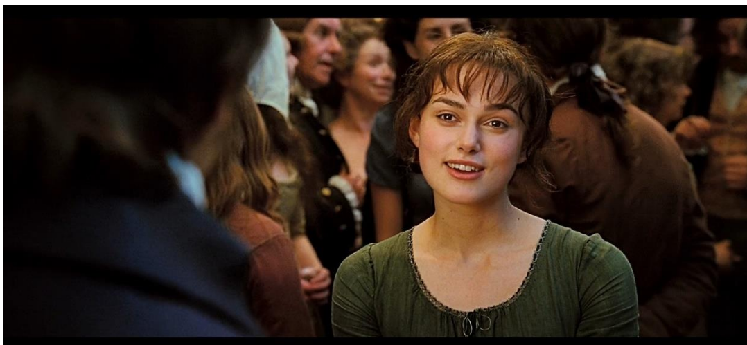
Obr. č. 2: Protizáber prvého rozhovoru Elizabeth a pána Darcyho.

Elizabeth s pánom Darcym k sebe od začiatku javili city, ktoré sú viditeľné hneď na prvom plese. Na obrázku č. 1-2 je ukázaná scéna ich rozhovoru, kedy mimika a odpoveď Elizabeth divákovi sprostredkuje určitý druh radosti z novej interakcie a možnosti nadviazať emočné spojenie s pánom Darcym. Jej lásku spomaľovali okolnosti, ktoré sa diali v jej rodine ako plánovaná svadba Jane s pánom Bingleym alebo stretnutie Wickhelma, ktorý jej narozpráva klamstvá o pánu Darcym. V druhej polovici filmu je scéna s dažďom pri kostole, kedy Elizabethine emócie vyústia v otázky, ktoré jej počas príbehu poplietli hlavu. Pán Darcy ide za ňou a u neho je to žiadosť o ruku, kedy si uvedomí, že miluje Elizabeth a už to nedokáže v sebe potlačiť. Avšak po jej rýchlom odmietnutí divák stráca nádej, že sa ešte niekedy uvidia alebo sa vezmú.