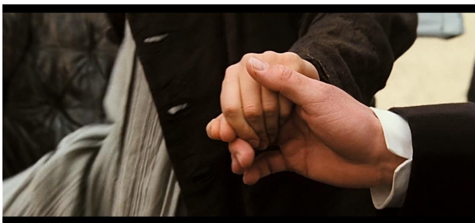
Obr. č. 155: Prvý dotyk medzi Elizabeth a pánom Darcym

Okrem možnosti diváka poznávať zhodné a rozdielne časti pri adaptácii, je podstatné si vytvoriť líniu znakov, ktoré sprostredkujú divákovi očakávania. Táto skutočnosť súvisí s vizuálnym spracovaním scén, ktoré mu napovedajú o milostnom vzťahu dvoch postáv. Podľa cieľovej skupiny filmovej adaptácie, sú vytvorené asociácie diváka k romantickej dobe 19. storočia. Napríklad pri tanci pána Darcyho a Elizabeth, kedy vidí len jeho a to divákovi dá možnosť cítiť a nahliadať na situáciu očami hlavnej hrdinky, z čoho vytuší, že sa medzi nimi bude ešte niečo diať a majú medzi sebou vzájomnú sympatiu. Pokračuje to vo filme vstupom do koča, kedy sa dve postavy navzájom dotknú.