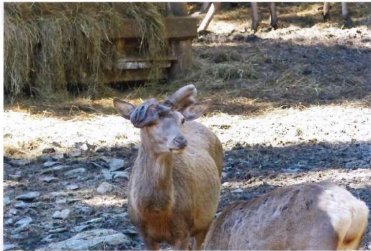
HRADNÍ PÁN PO ÚRAZU V OBŮRCE 4/2014