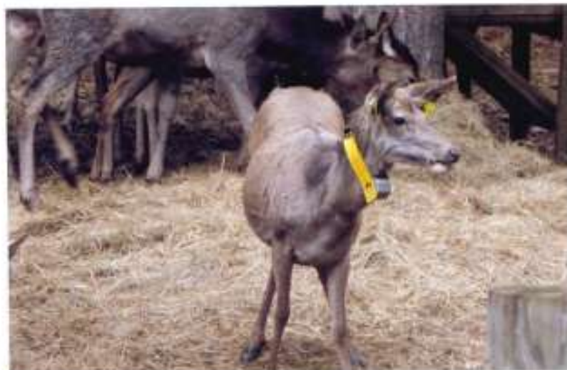
LANĚ - DITA A 21 č. ob. 3174 ZNAČENA 3.4.11