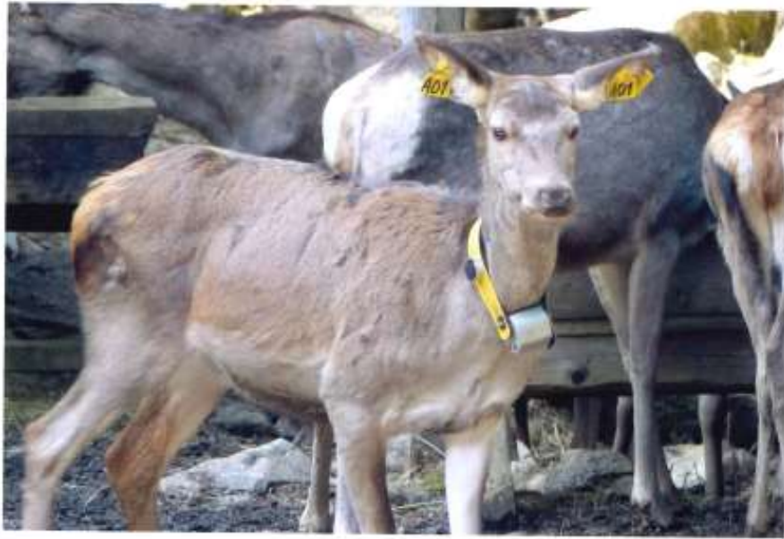
LAN LUCINKA - A 01