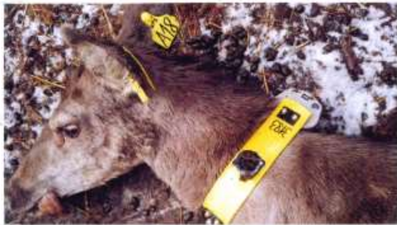
LANĚ - LINDA A 18 č. ob. 3173 ZNAČENA 28.3.11