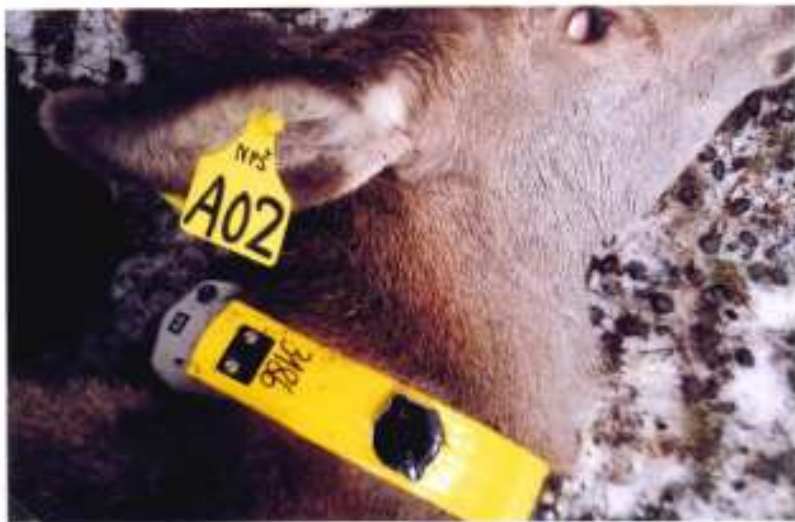
LANĚ - DIANA A 02 č. ob. 3176 ZNAČENA 28.3.11