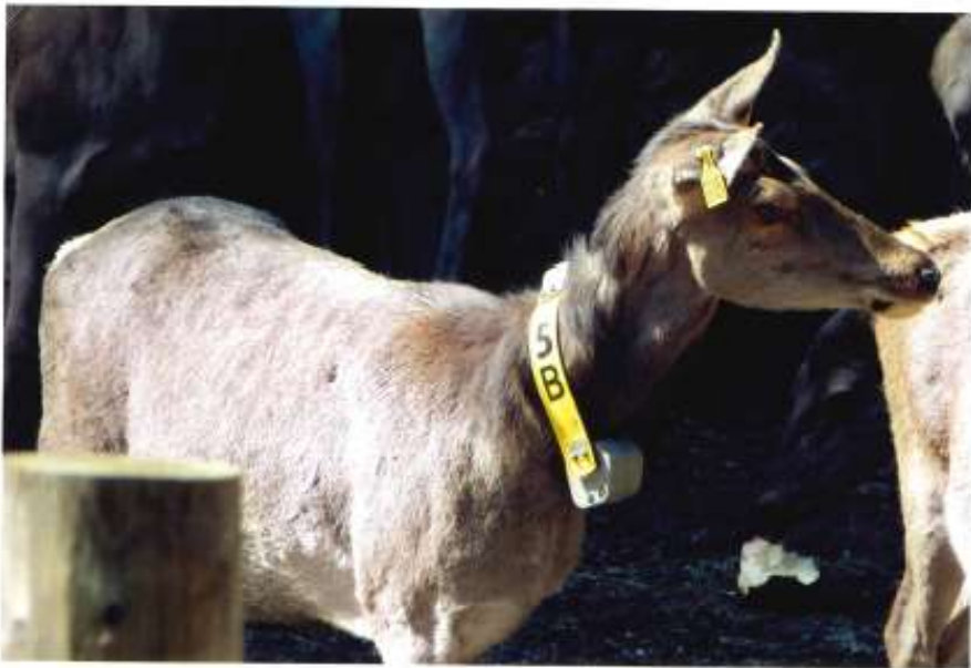
LAN MONIKA - 3 05