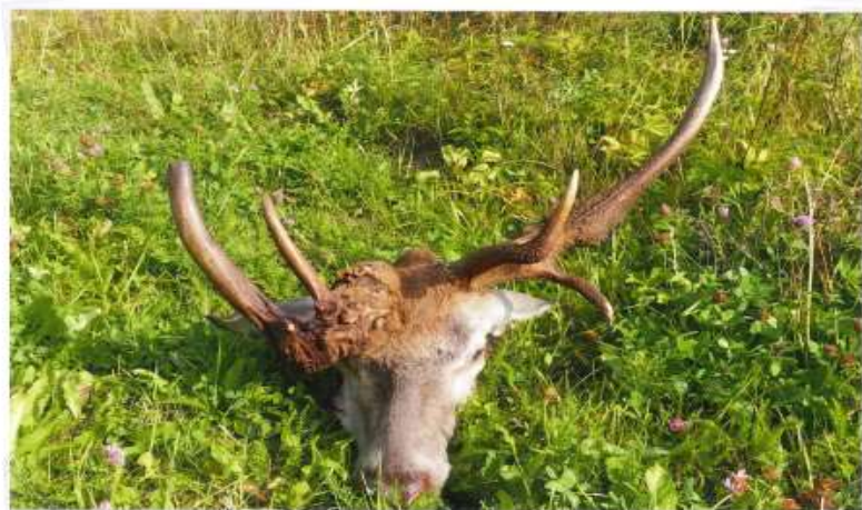
HRADNÍ PÁN UDOVEN 19. 8. 2014 LOVEC SCHARTNER VI. - DIANA - 6 LET