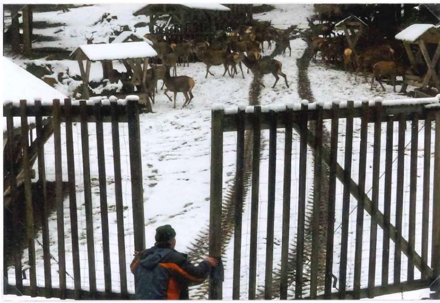
TAKTO CHODILA ZVĚŘ NA KRMENÍ JIŽ 7 RŮ ZAVÍRÁNÍ BRÁNY 4/2014