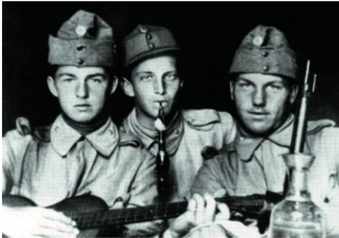
Bild 1: Konrad Henlein (Mitte), als Gefreiter in der Offiziersschule