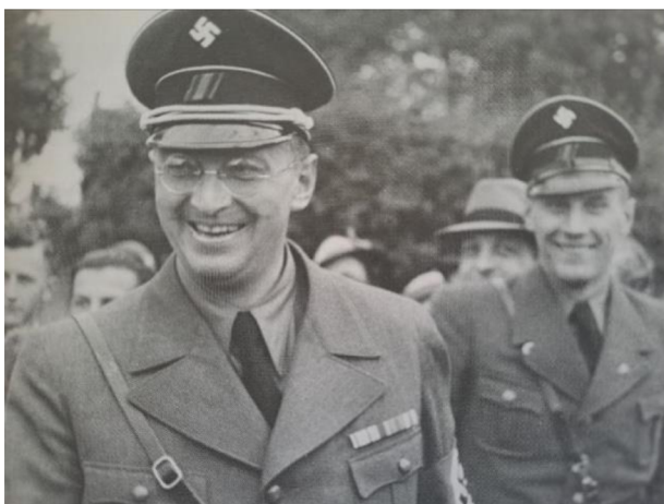
Bild 3: Konrad Henlein als Führer der sudetendeutschen Freikorps, September 1938 (Hruška, 2010, o. S.)

Den Schwerpunkt des Freikorps sollten Henleins Turniere bilden, deren Waffen und Munition ausschließlich von der österreichischen Armee geliefert werden sollten und deren Hauptaufgabe darin bestand, Spannungen im Grenzgebiet zu provozieren. So wurde die Einheit am 17. September 1938 offiziell gegründet, wobei Henlein selbst die Leitung übernahm. In offiziellen Quellen ist zu lesen, dass die Einheit zum Schutz der Sudetendeutschen und zur Verhinderung von Unruhen und bewaffneten Zusammenstößen geschaffen wurde. Und schon bald kommt es zu ihrem ersten Einsatz.