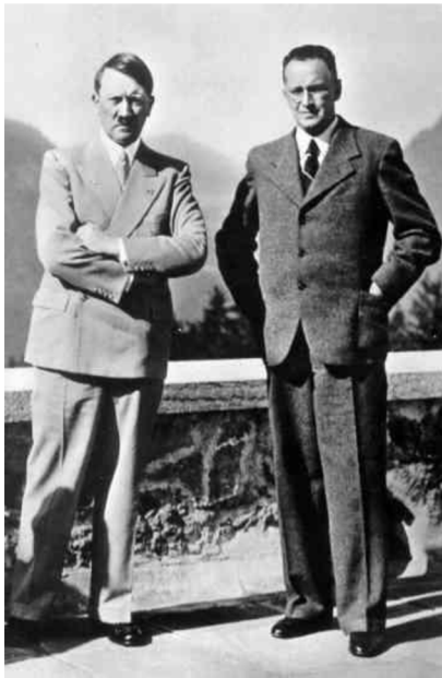
Bild 2: Konrad Henlein und Adolf Hitler bei einem Treffen auf dem Berghof Anfang September 1938 (Naše vojsko, 2022, o. S)

Den Schwerpunkt des Freikorps sollten Henleins Turniere bilden, deren Waffen und Munition ausschließlich von der österreichischen Armee geliefert werden sollten und deren Hauptaufgabe darin bestand, Spannungen im Grenzgebiet zu provozieren. So wurde die Einheit am 17. September 1938 offiziell gegründet, wobei Henlein selbst die Leitung übernahm. In offiziellen Quellen ist zu lesen, dass die Einheit zum Schutz der Sudetendeutschen und zur Verhinderung von Unruhen und bewaffneten Zusammenstößen geschaffen wurde. Und schon bald kommt es zu ihrem ersten Einsatz.