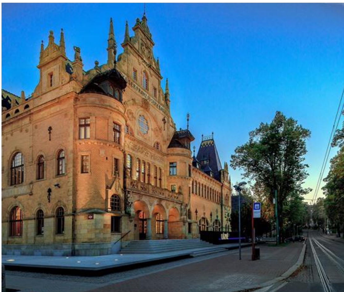
Autor: Oblastní galerie Liberec.