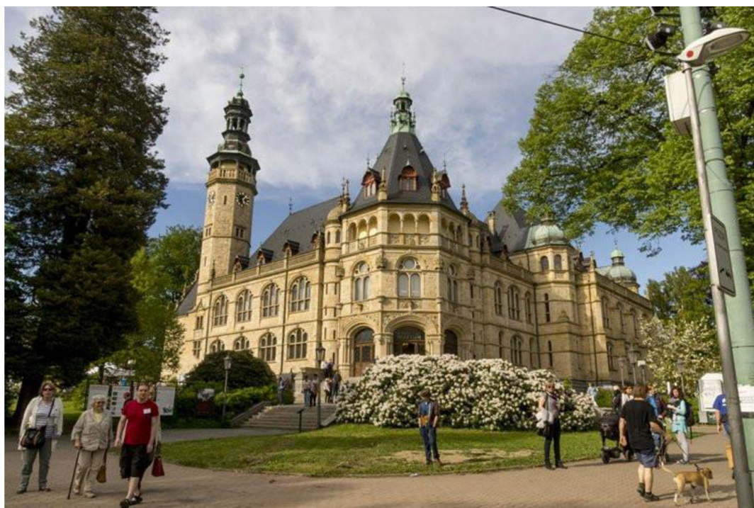
Autor: Jan Mikulička.