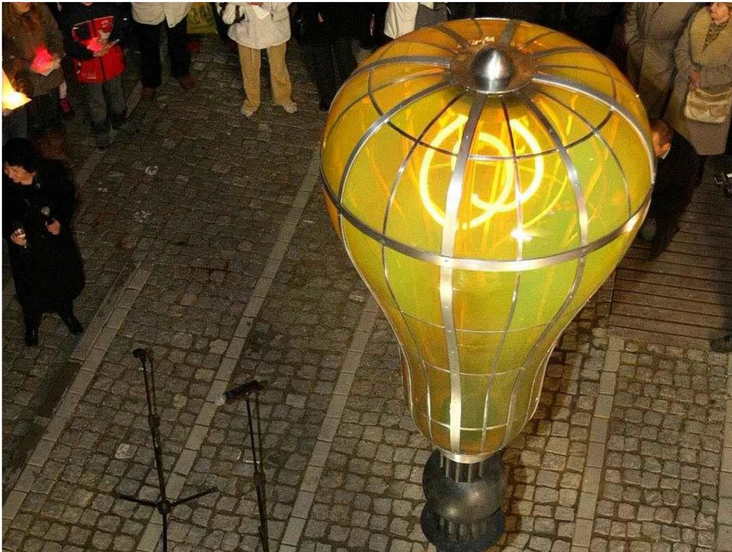
Obrázek 4: Lampa Edison