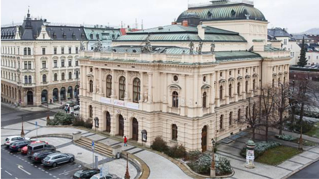
Obrázek 2: Divadlo F. X. Šaldy.

milovníků umění a kultury a hraje klíčovou roli v kulturním životě Liberce. Jeho kombinace historického a uměleckého významu činí Liberecké divadlo důležitou součástí českého kulturního dědictví a symbolem města (zeman, 2012).