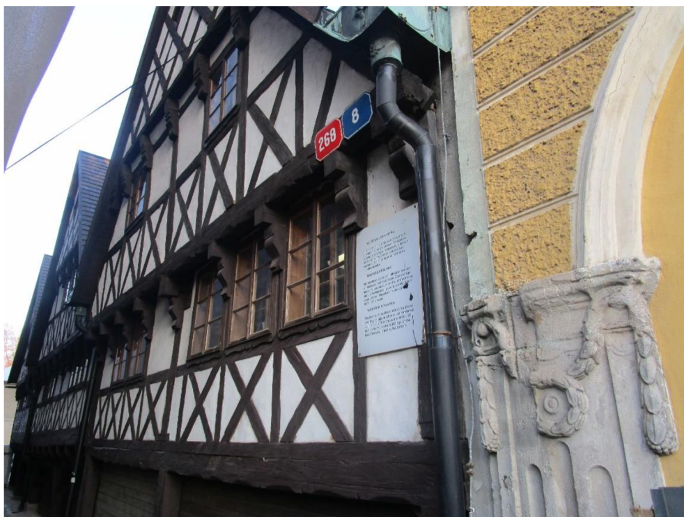
Obrázek 5: Valdštejské domky.