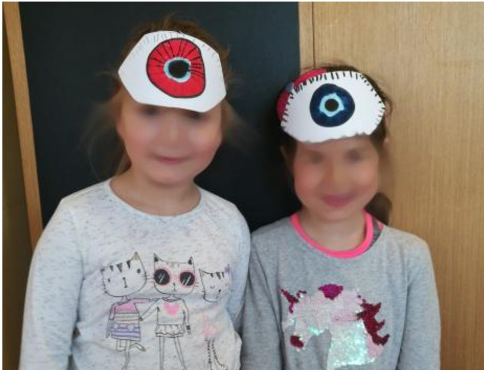
Obrázek č. 7 Maska kyklopa