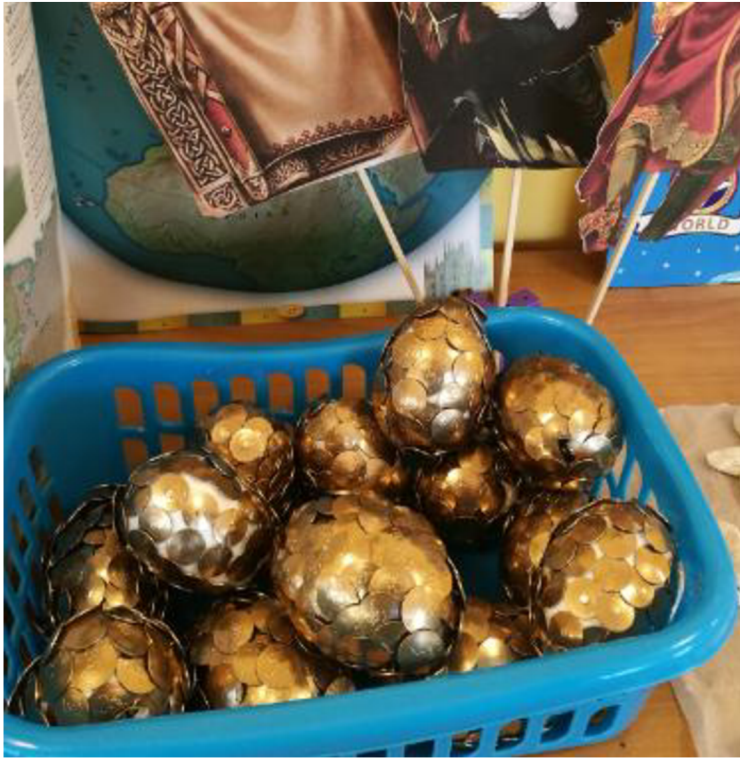
Obrázek č. 9 Zlaté vejce