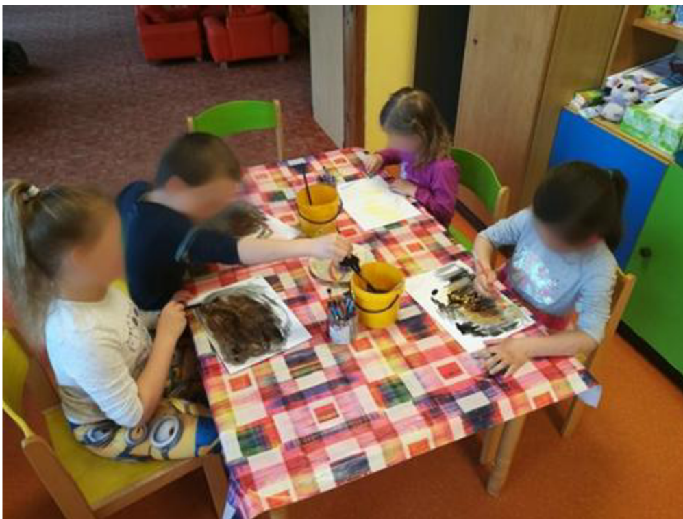
Obrázek č. 3 Kresba plamenů