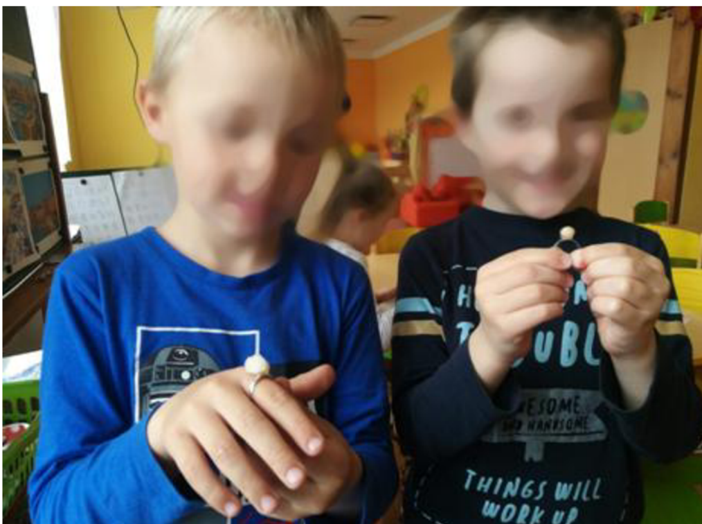
Obrázek č. 4 Prstýnek od Prométhea