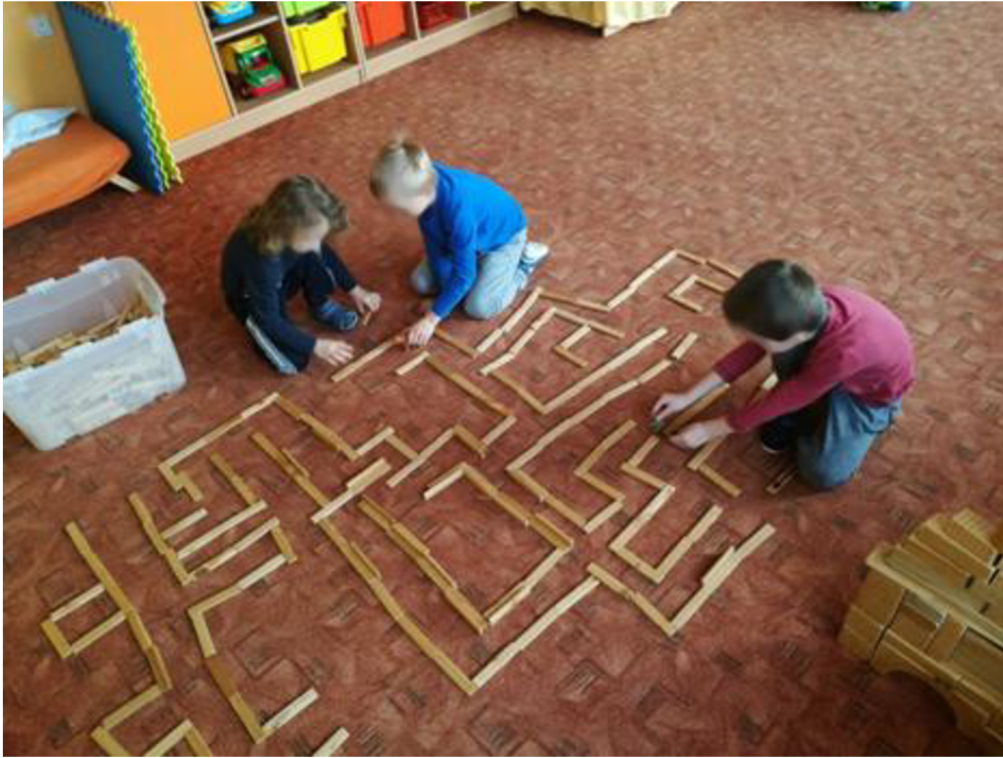
Obrázek č. 5 Stavba labyrintu