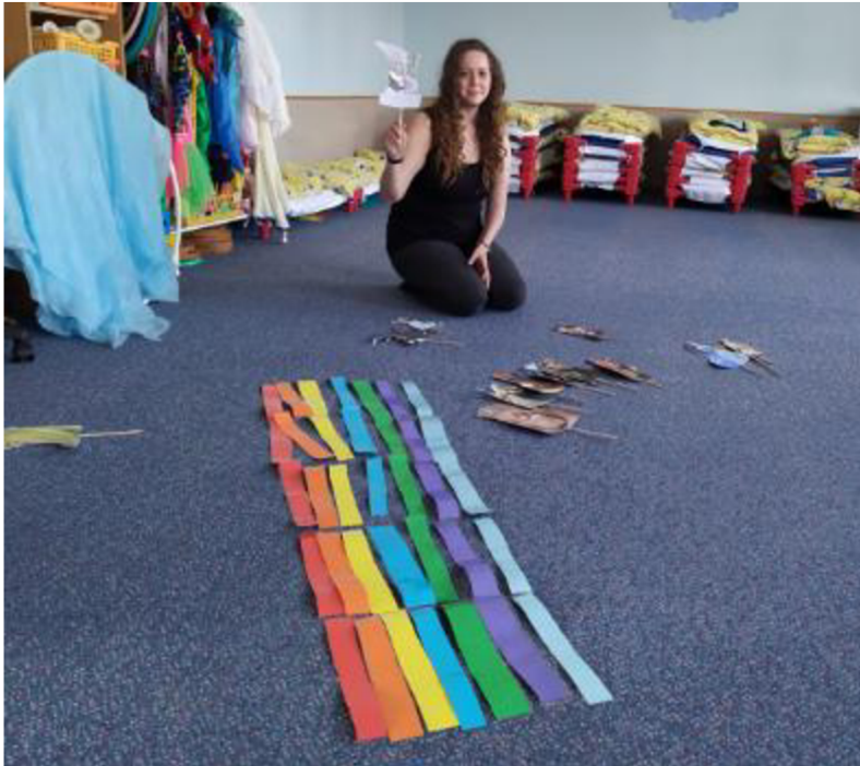
Obrázek č. 13 Duha a postavy ze slovanské mytologie