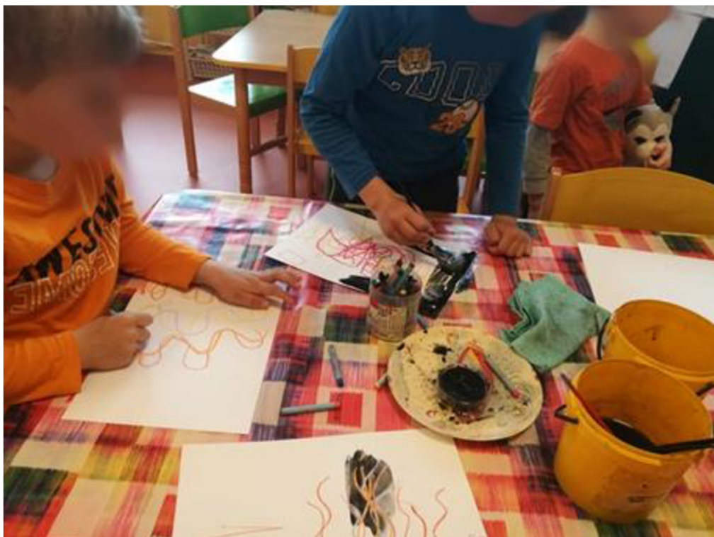
Obrázek č. 2 Kresba plamenů