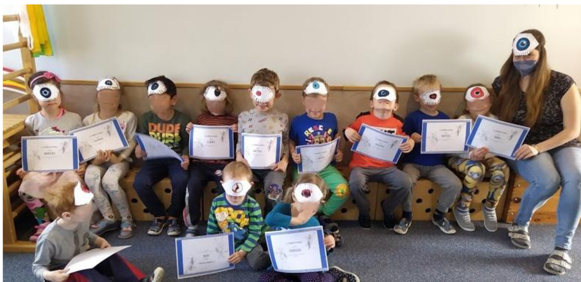
Obrázek č. 8 Certifikát hrdiny