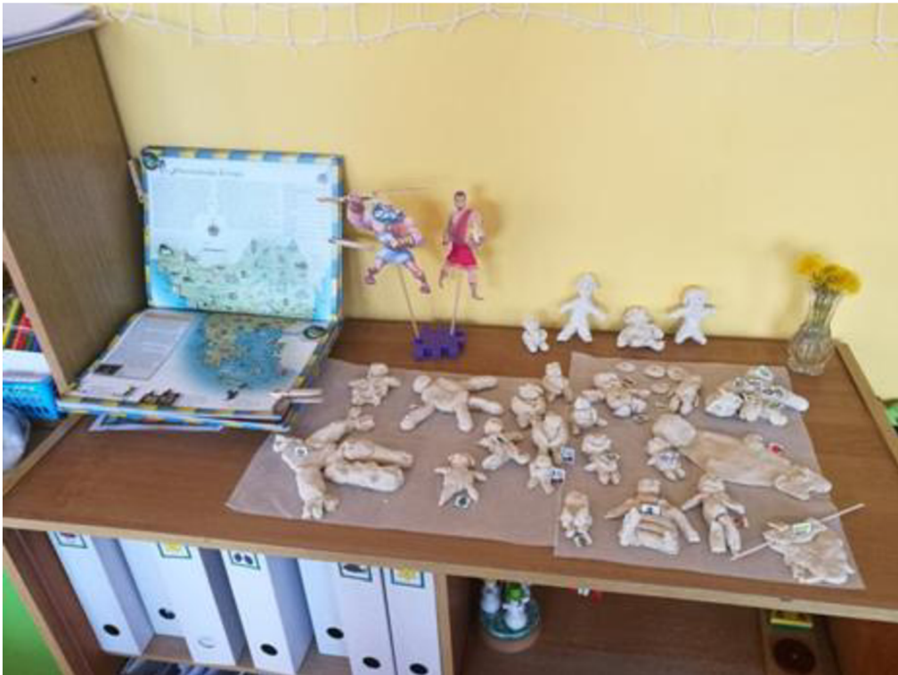
Obrázek č. 1 Vymodelování panáčky z modelovací hmoty