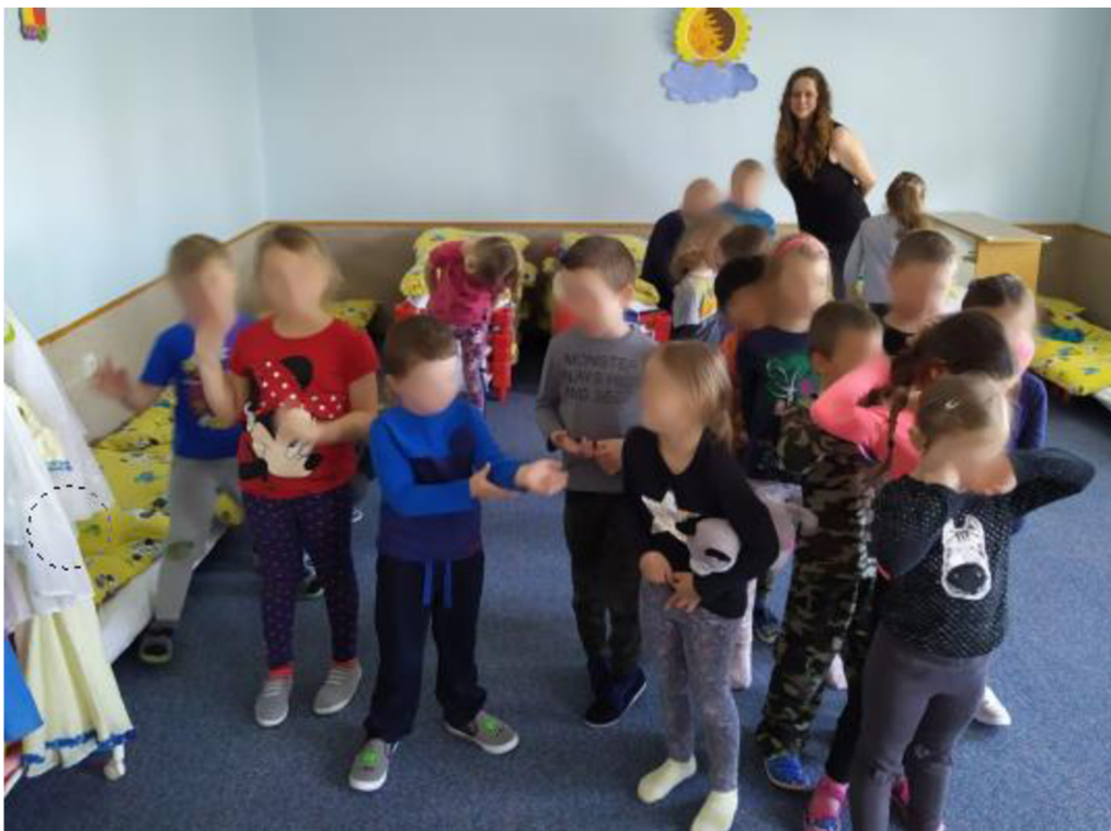
Obrázek č. 14 Závěrečné hodnocení dětí, jaký týden se jim líbil víc (vlevo je řecký týden, uprostřed oba)