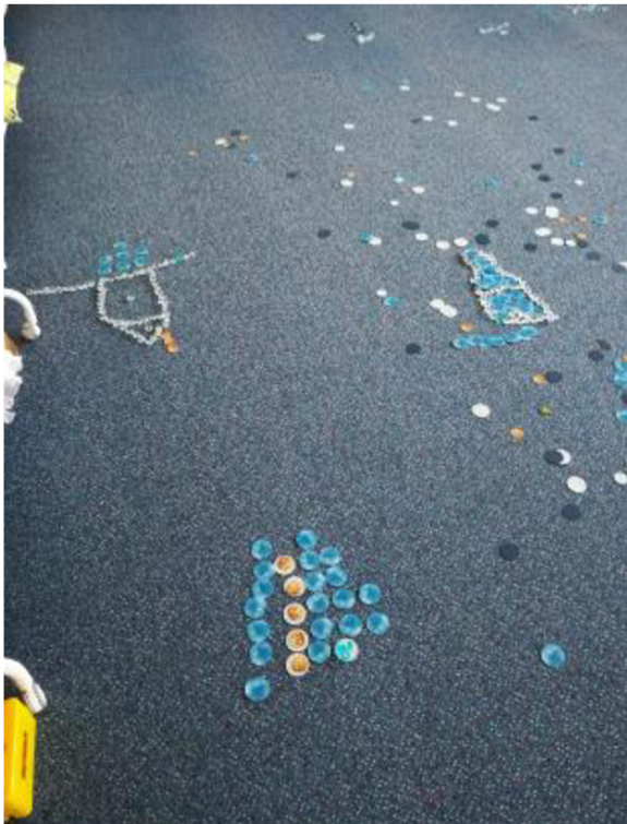
Obrázek č. 10 Sněhová galerie