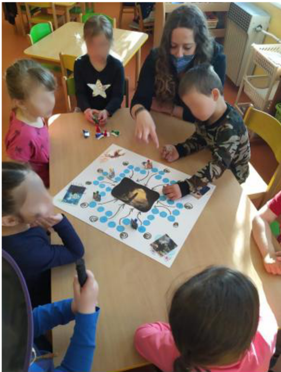
Obrázek č. 12 Desková hra „Bože, nezlob se“