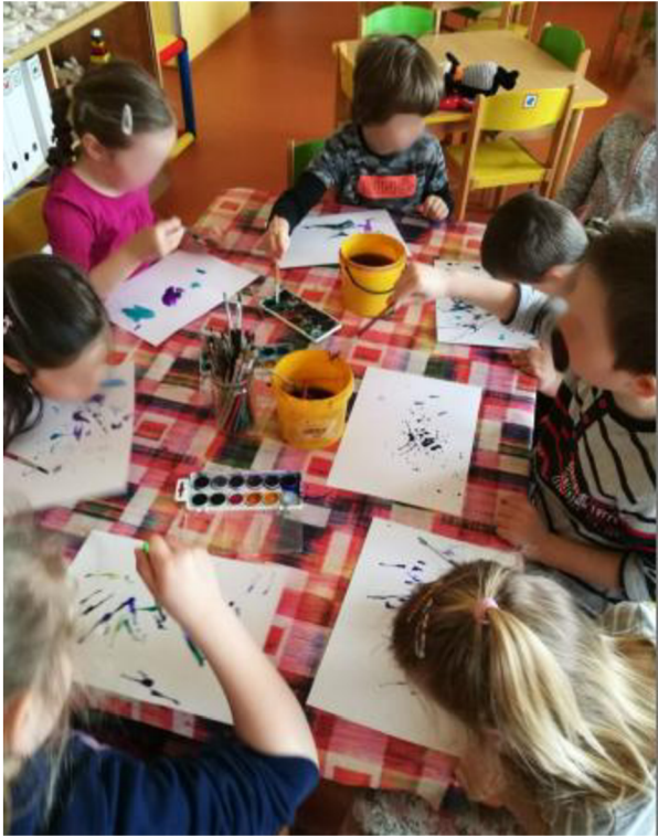
Obrázek č. 11 Malování dechem