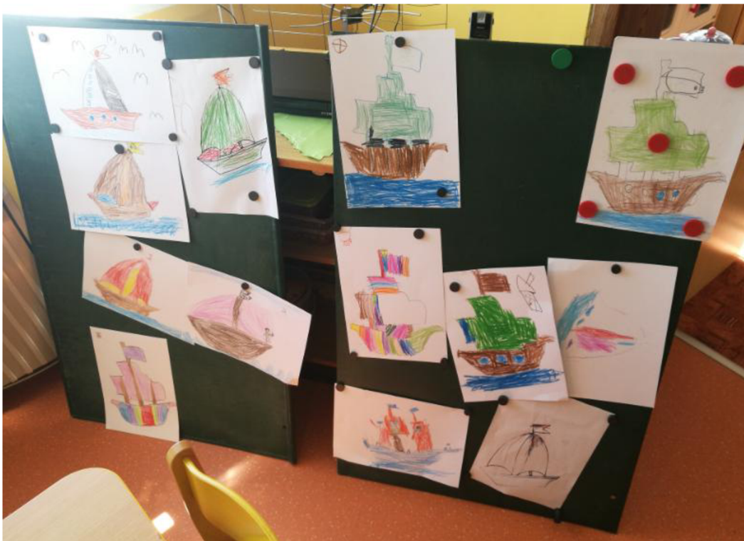
Obrázek č. 6 Kresba lodi