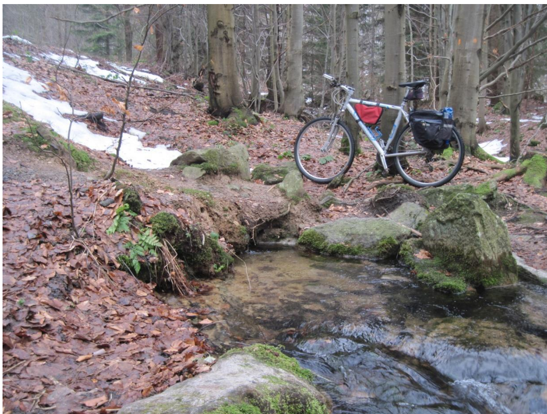
Obr. 12: Mléčný pramen, prosinec 2013