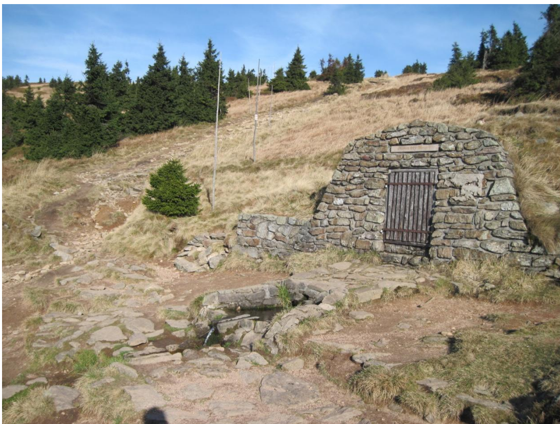
Obr. 1: Upravený pramen řeky Moravy, říjen 2013