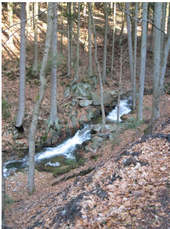
Obr. 16: Kaskády Malé Moravy v nadmořské výšce 800 m, březen 2014