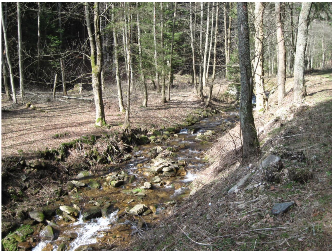
Obr. 17: Stříbrnický potok ve výšce 725 m n. m., březen 2014