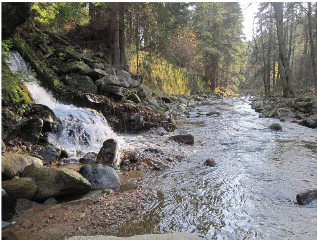
Obr. 7: Uměle vytvořený stupeň na Kamenitém potoce v místě soutoku s řekou Moravou, říjen 2013