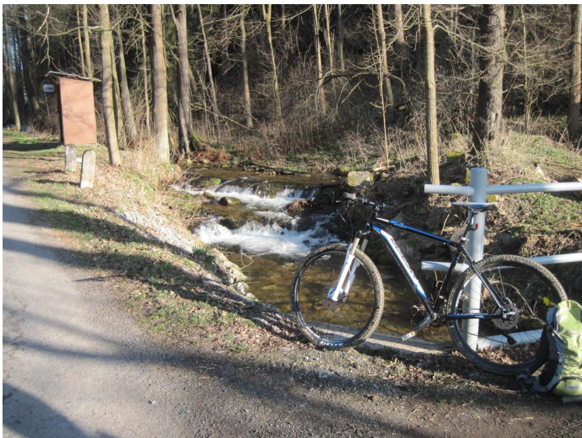
Obr. 15: Potok Malá Morava v obci Malá Morava v místech, kde opouští sledované území, březen 2014