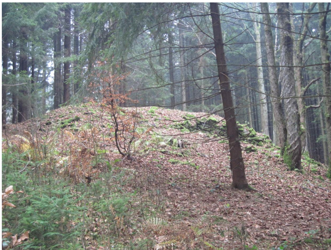
Obr. 24: Agrární halda pod sjezdovkou u chaty Návrší nedaleko obce Stříbrnice, listopad 2013