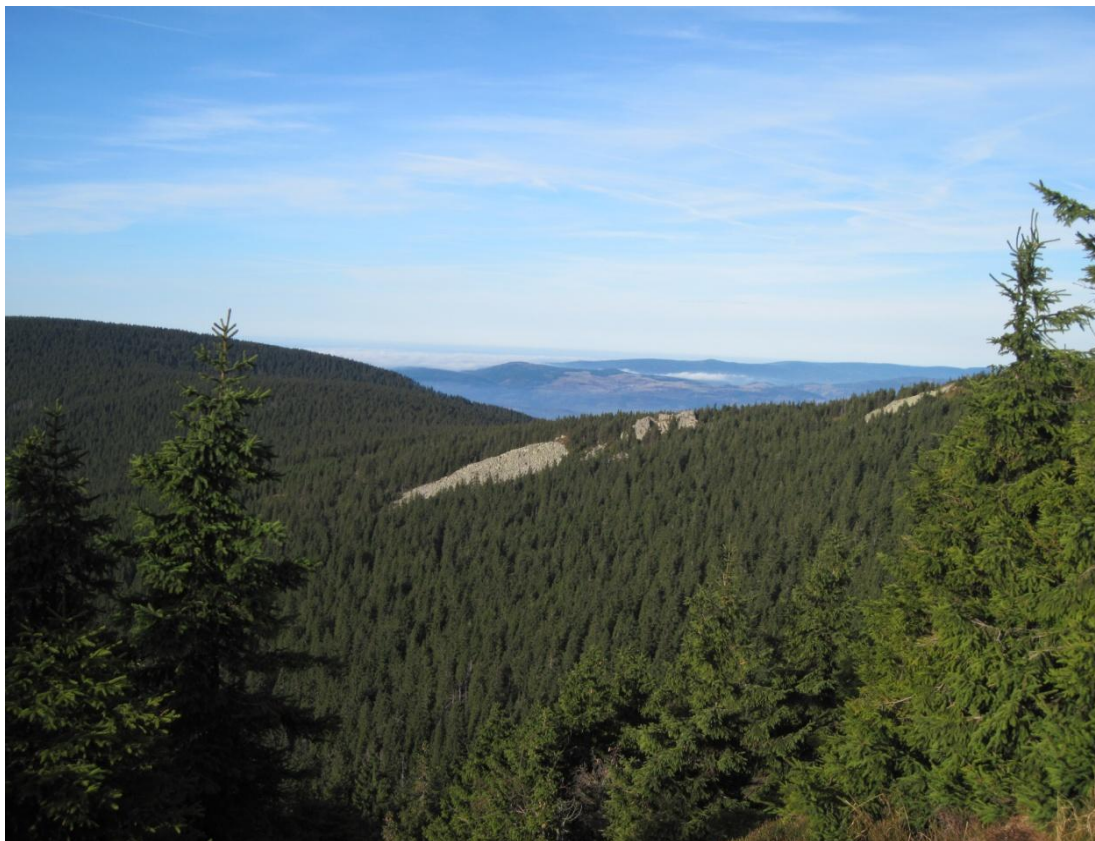
Obr. 20: Skalní hřeben Vlaštovcí skály nedaleko vrcholu Králického Sněžníku, říjen 2013