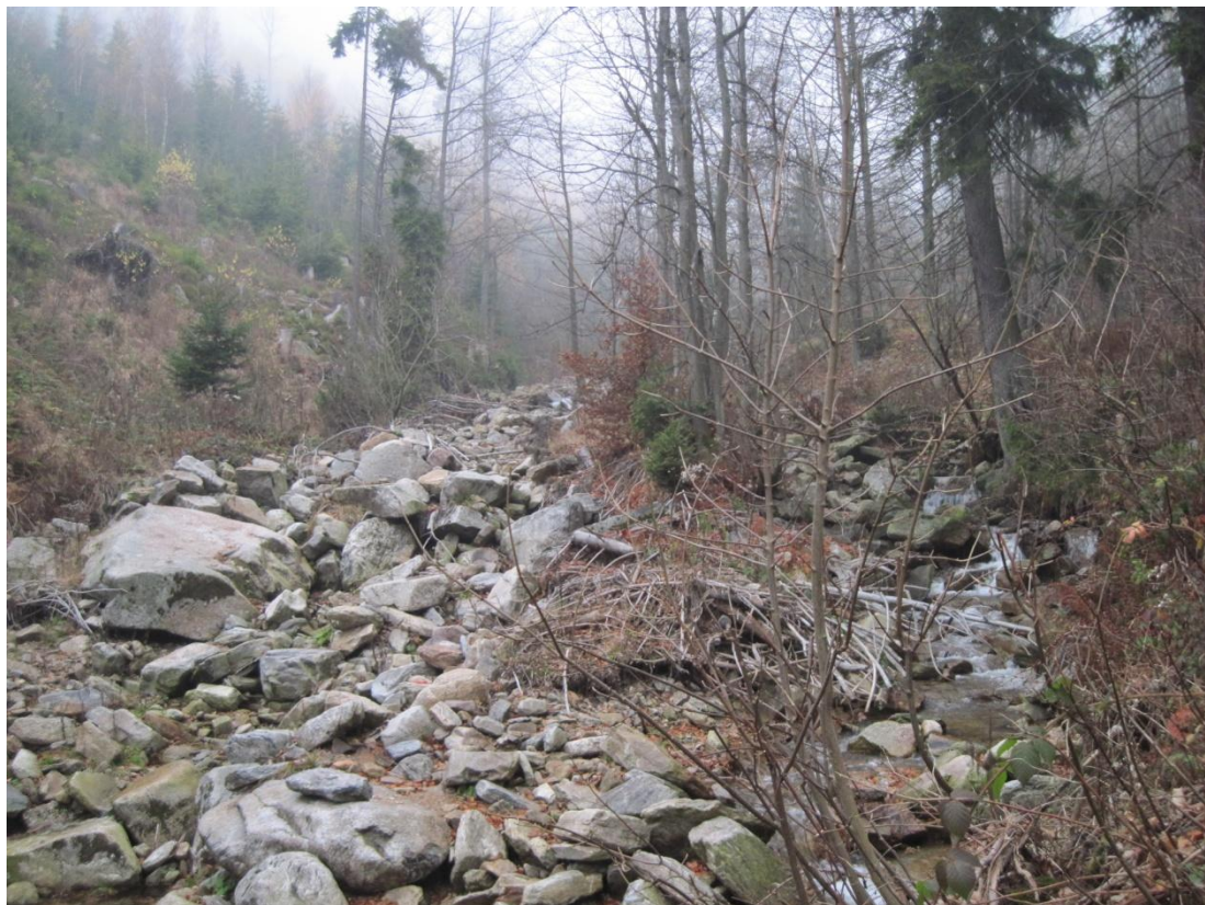
Obr. 11: Val netříděného sedimentu pravděpodobně transportovaného ledovcem v údolí Prudkého potoka, listopad 2013