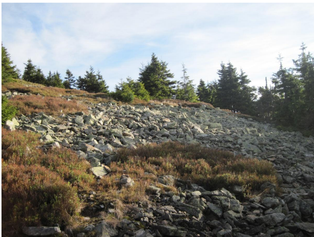
Obr. 19: Kamenné moře nedaleko vrcholu Králického Sněžníku, říjen 2013