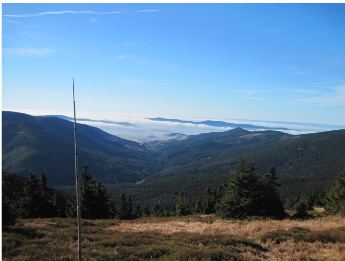
Obr. 33: Údolí horního toku řeky Moravy, říjen 2013