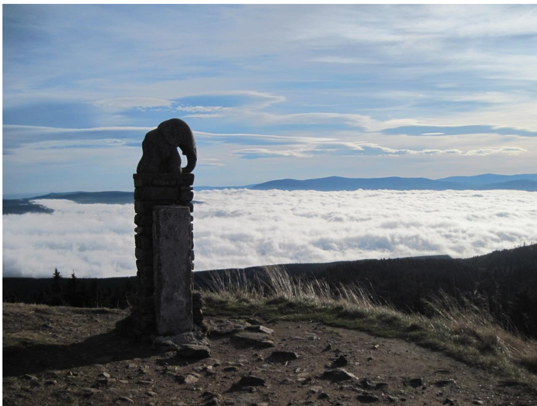
Obr. 29: Socha slúněte je neoficiálním symbolem Králického Sněžníku, říjen 2013