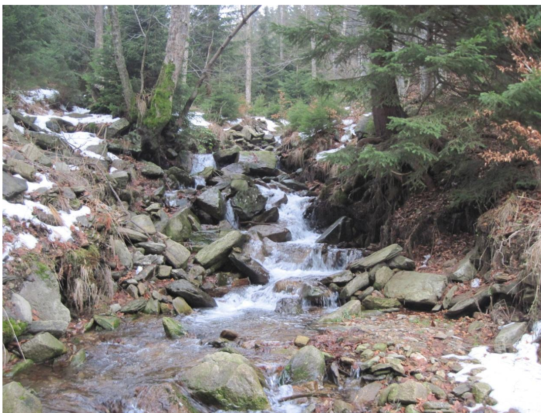
Obr. 13: Potok Koprivák v nadmořské výšce 800 m nedaleko soutoku s Moravou, prosinec 2013