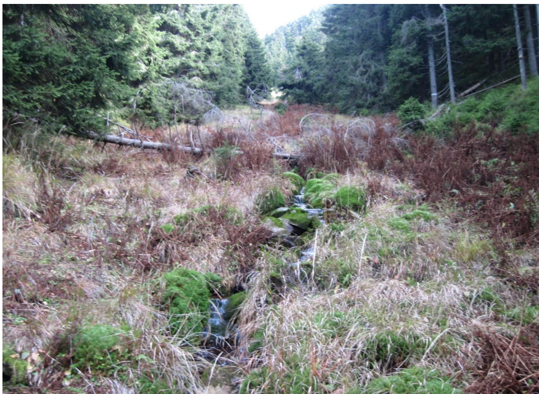
Obr. 2: Řeka Morava pod lavinovým svahem v nadmořské výšce 1190 m, říjen 2013