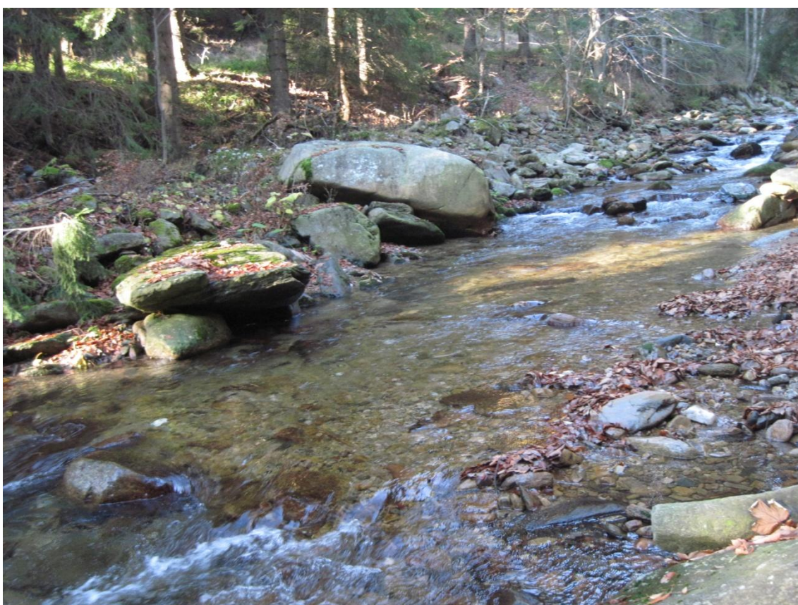
Obr. 6: Řeka Morava v nadmořské výšce 750 m nedaleko obce Dolní Morava, říjen 2013