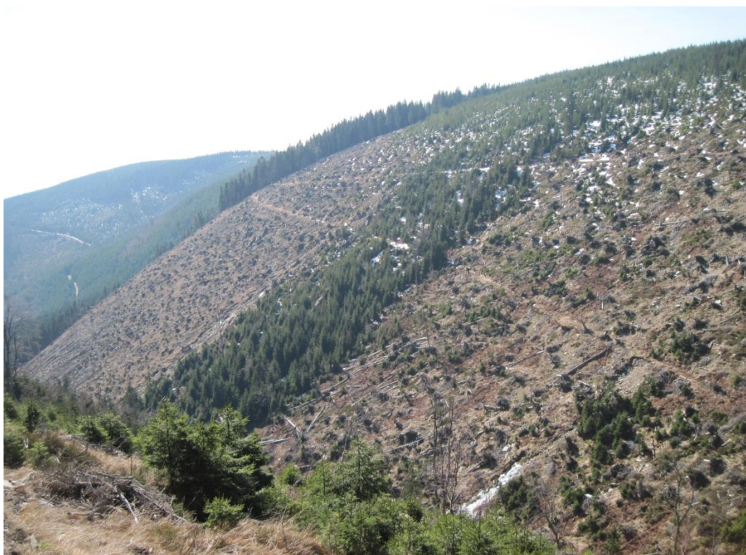
Obr. 39: Odlesněné plochy ve strži Prudkého potoka, březen 2014