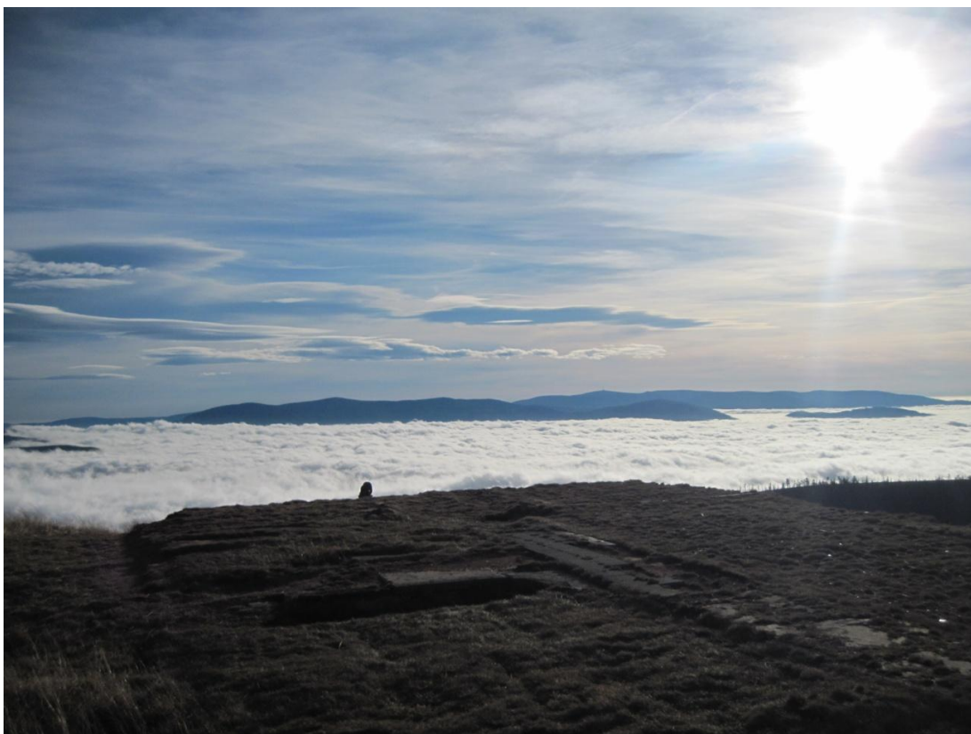
Obr. 30: Zbytky Lichteinsteinovy chaty, říjen 2013