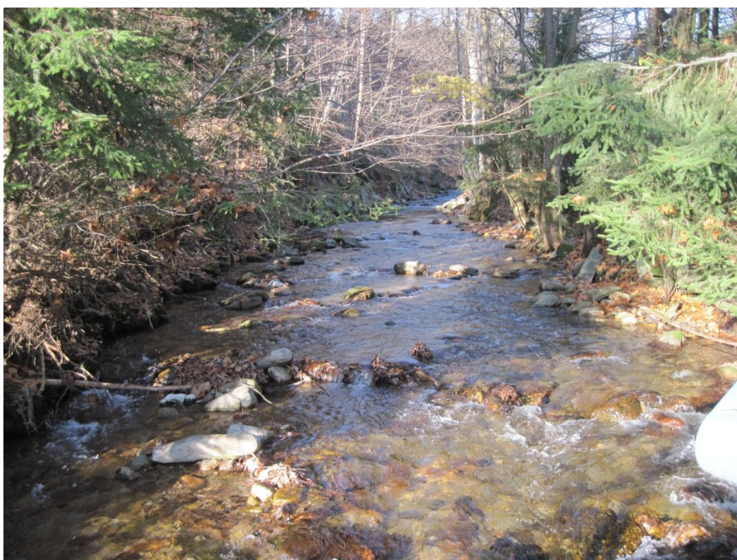
Obr. 8: Řeka Morava na začátku obce Dolní Morava, říjen 2013