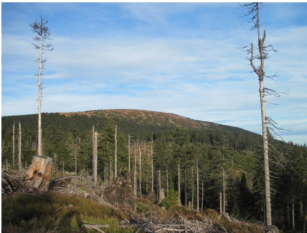
Obr. 25: Primární bezlesí na vrcholu Králického Sněžníku, říjen 2013