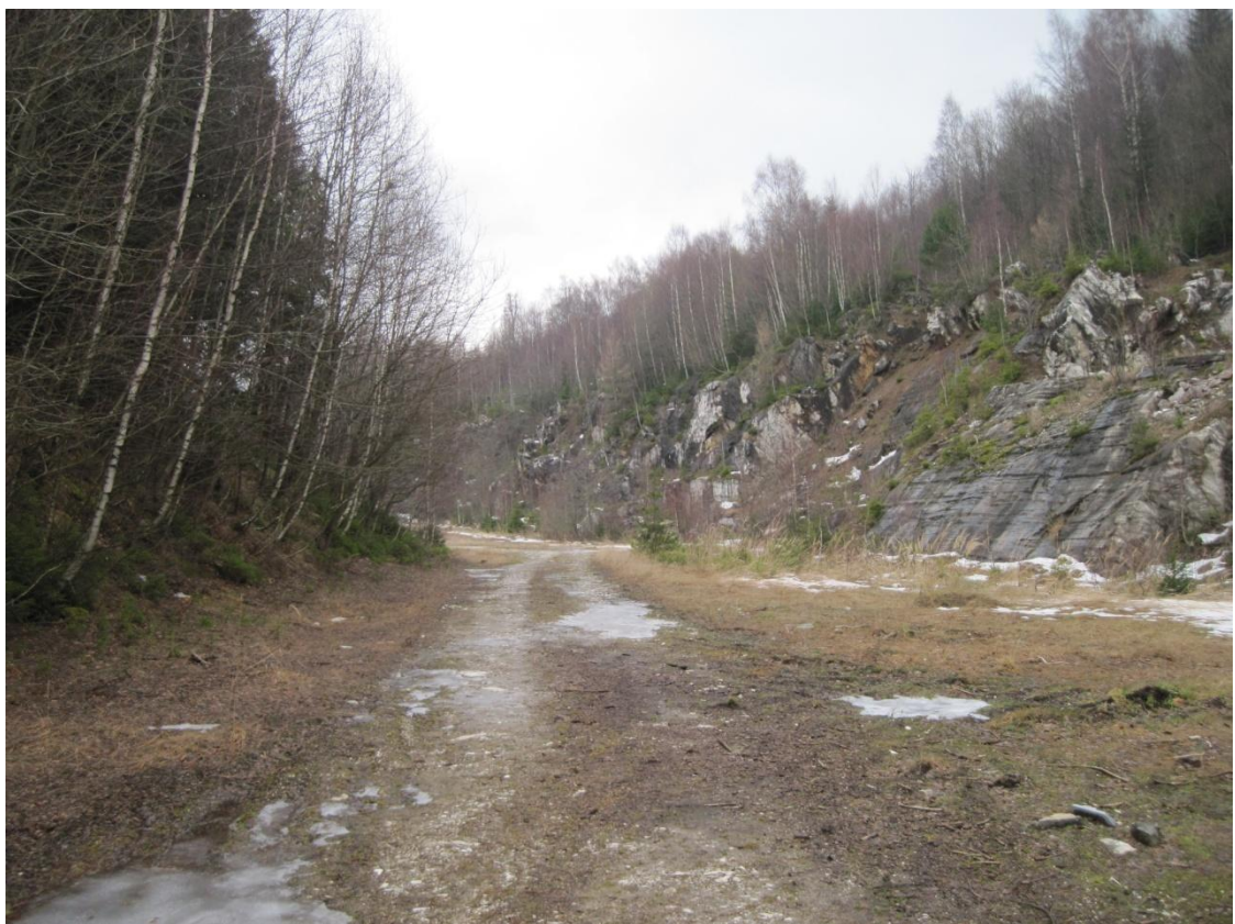
Obr. 45: Opuštěný mramorový lom u obce Dolní Morava, prosinec 2013