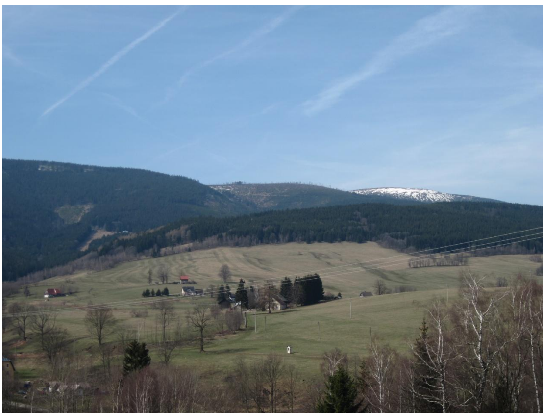
Obr. 41: Sněhová pokrývka na vrcholu Králického Sněžníku, březen 2014