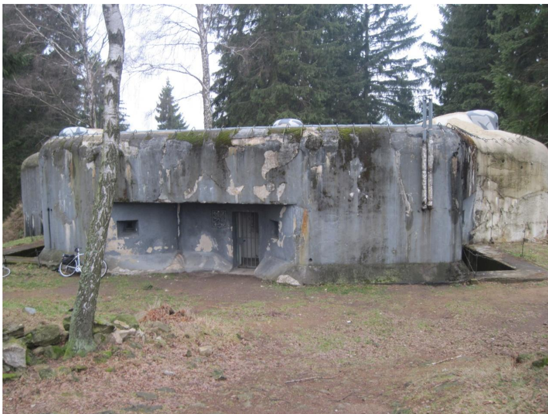
Obr. 42: Pěchotní srub KS 5 U potoka, dnes muzeum vojenské historie, prosinec 2013