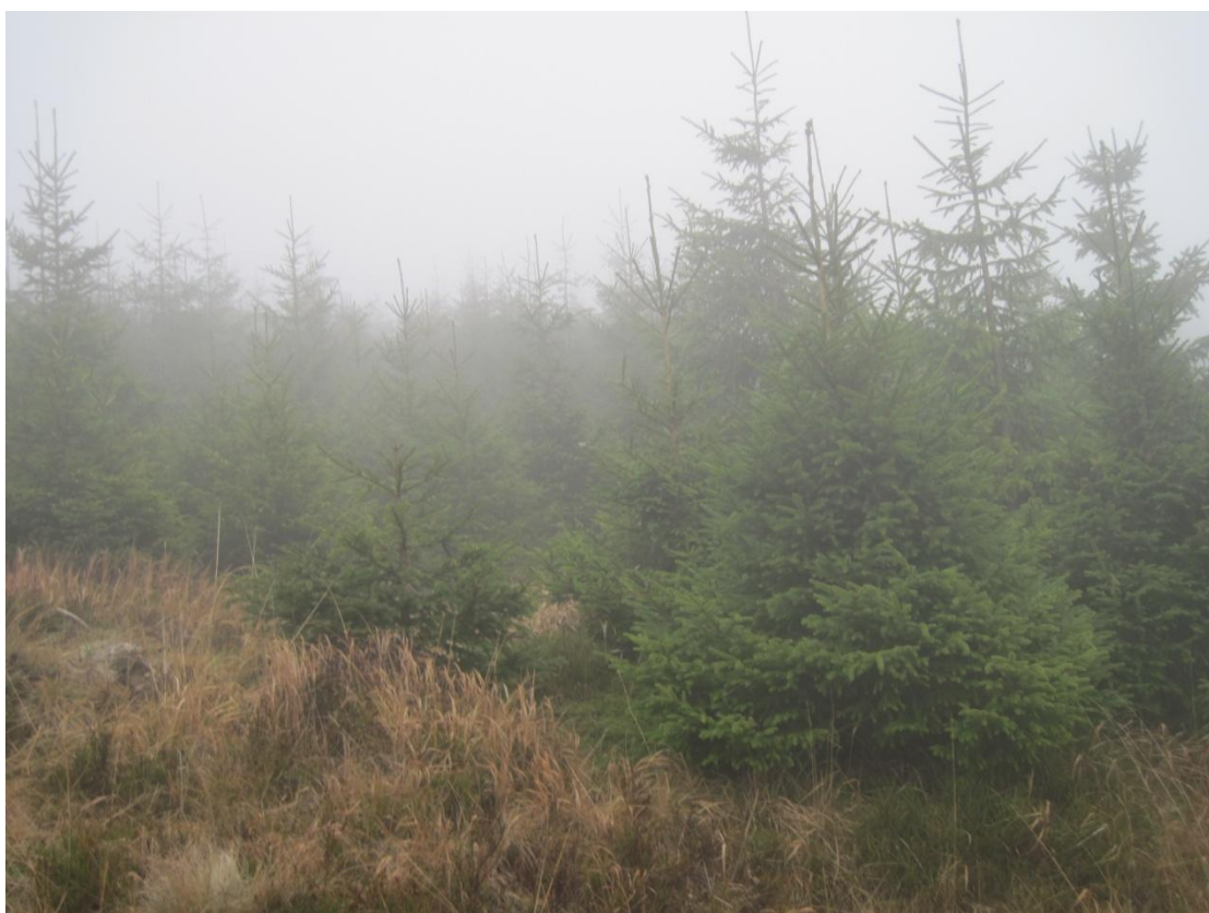
Obr. 37: Ve vrcholových partiích probíhá intenzivní vysazování původní formy smrku ztepilého, odolné proti drsným klimatickým podmínkám, listopad 2013