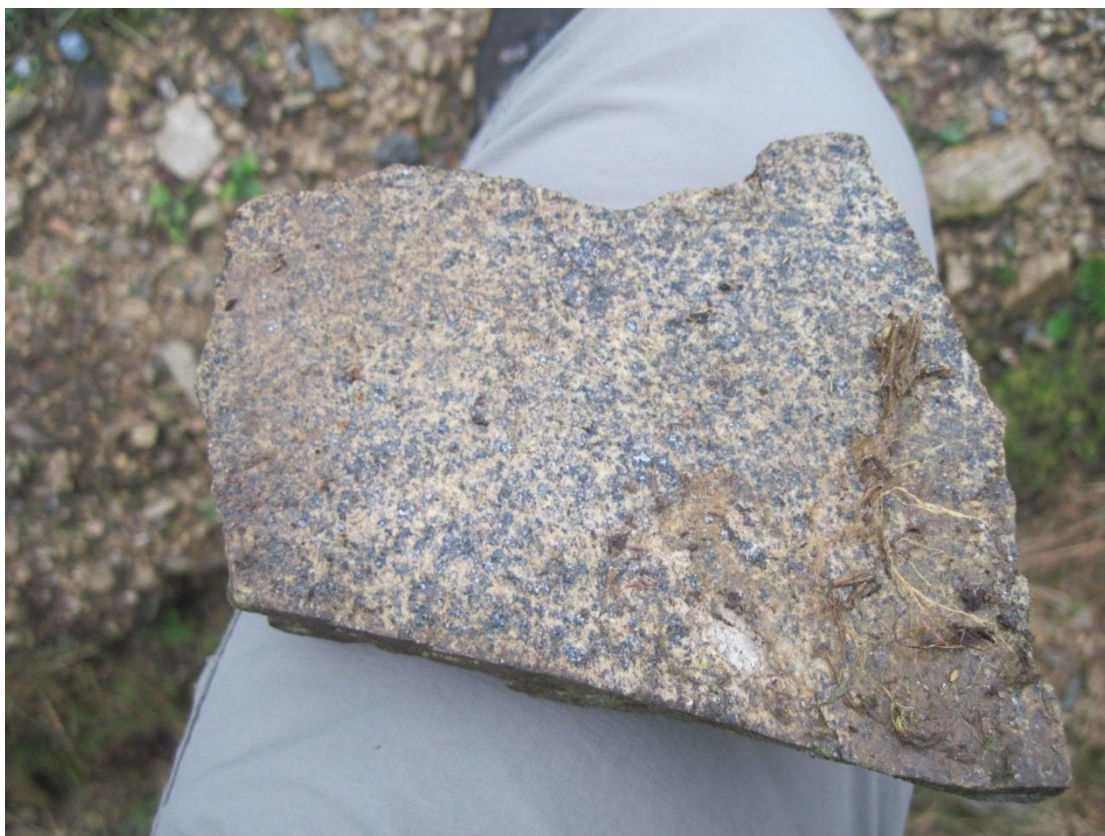
Obr. 34: Sněžnická rula, nalezena nedaleko vrcholu Sušina (1321 m .n. m.), listopad 2013