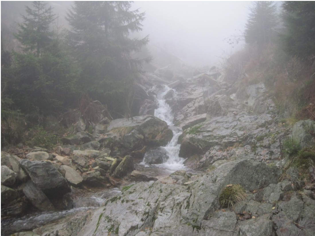
Obr. 10: Kaskády Prudkého potoka v místech pravděpodobného pleistocenního zalednění, listopad 2013