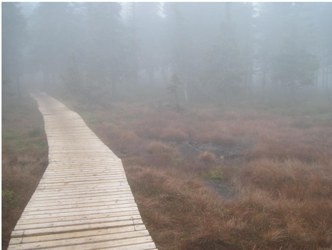
Obr. 36: Rašeliniště na Mokrém hřbetu, listopad 2013