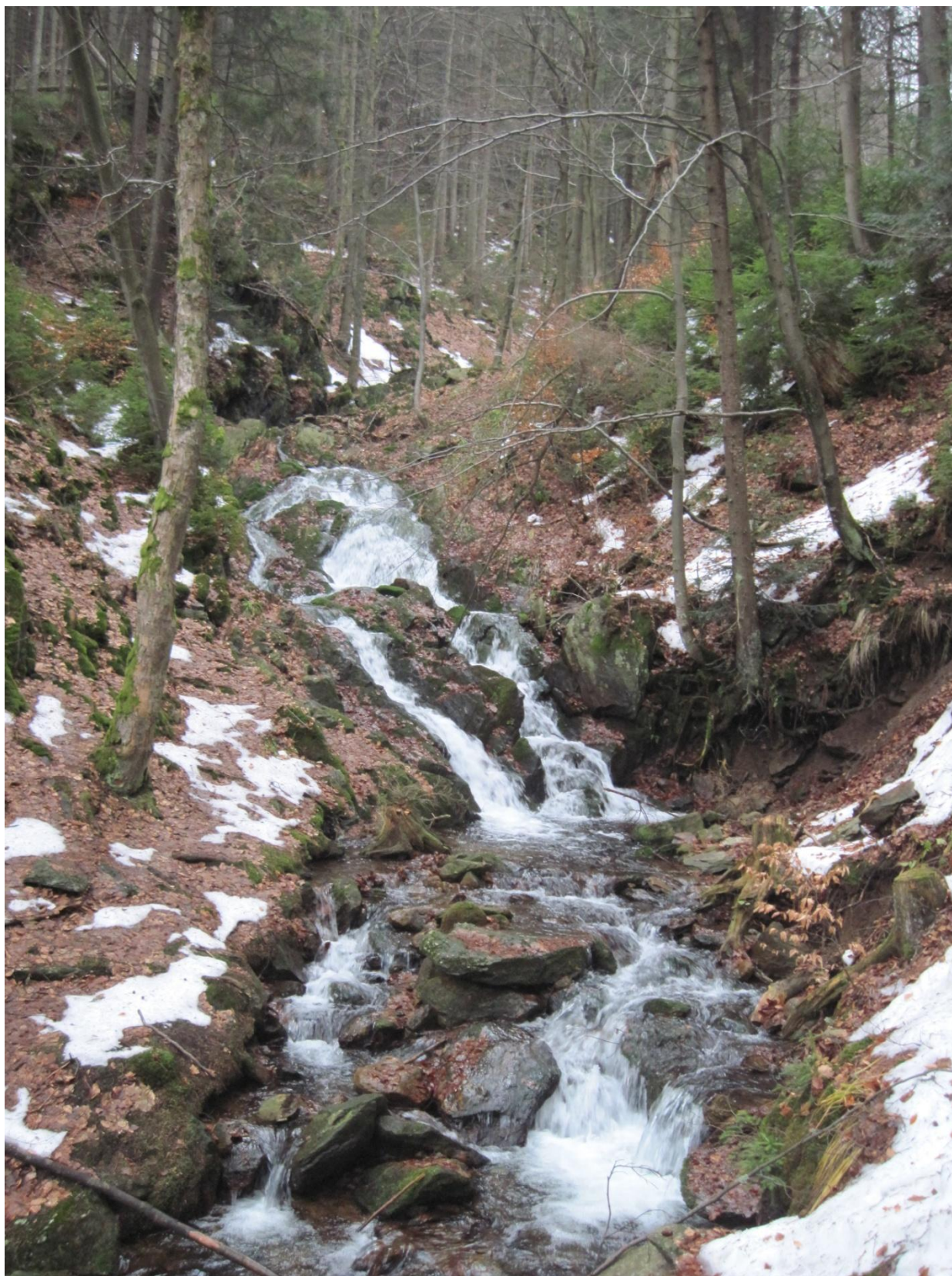
Obr. 14: Vodopád na Hlubokém potoce, prosinec 2013