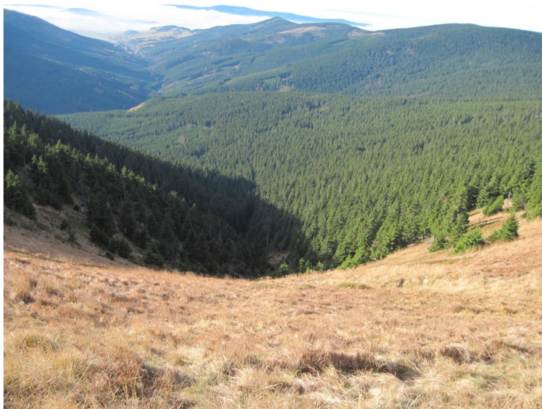
Obr. 21: Lavinový svah řeky Moravy s extrémním sklonem, říjen 2013