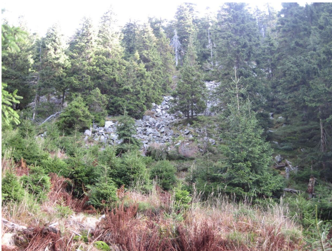
Obr. 22: Kamenné moře pod lavinovým svahem řeky Moravy, říjen 2013