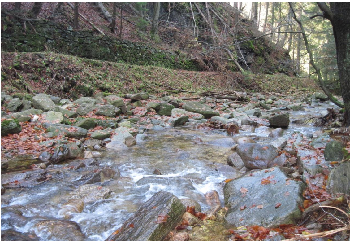
Obr. 5: Balvanité koryto řeky Moravy na hranici NPR Králický Sněžník ve výšce 825 m n. m.