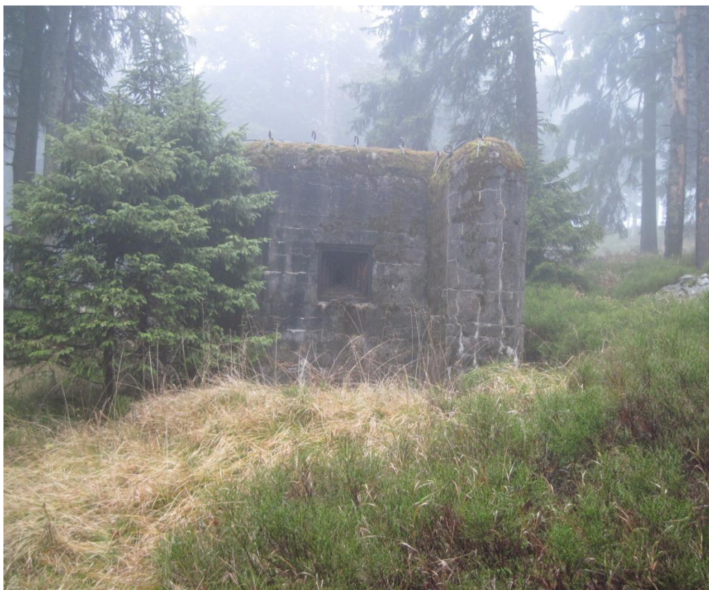
Obr. 38: Pozůstatky meziválečného pohraničního opevnění v úctyhodné nadmořské výšce 1300 m pod vrcholem Sušina (1321 m n. m.), listopad 2013