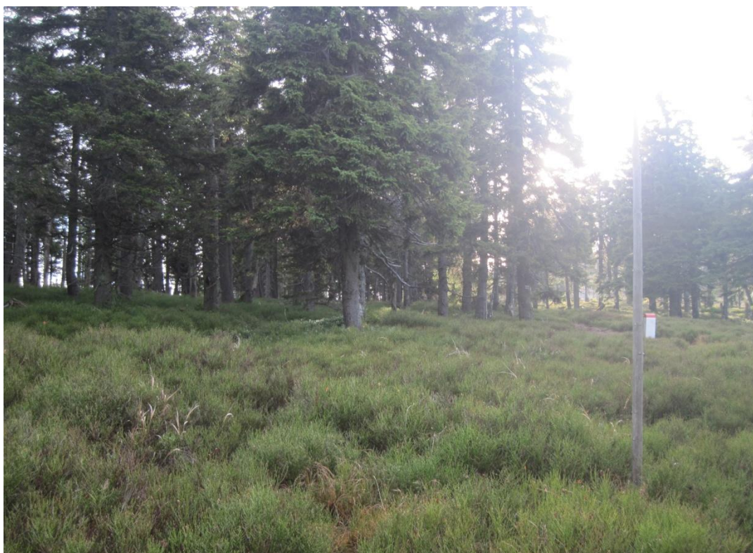
Obr. 26: Rašeliniště na Mokřém hřbetu, říjen 2013