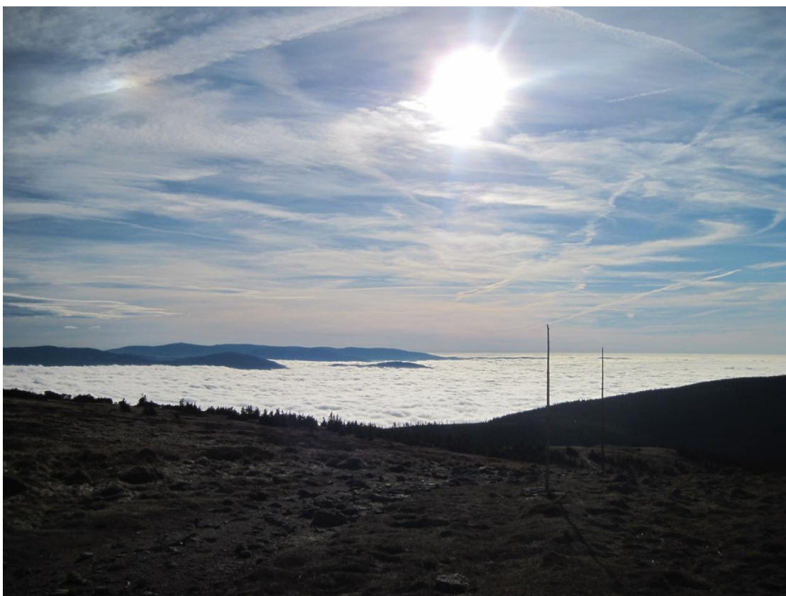
Obr. 31: Pohled z vrcholu Králického Sněžníku na masiv Hrubého Jeseníku při inverzní oblačnosti, říjen 2013