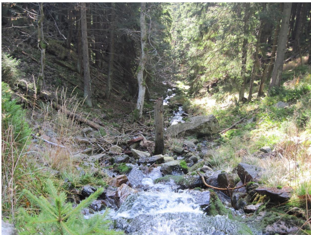
Obr. 3: Řeka Morava v nadmořské výšce 1050 m s výrazně stupňovitým charakterem koryta, říjen 2013