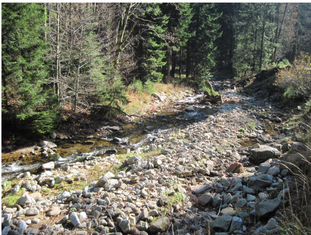
Obr. 23: Štěrková lavice na řece Moravě ve výšce 800 m n. m., říjen 2013