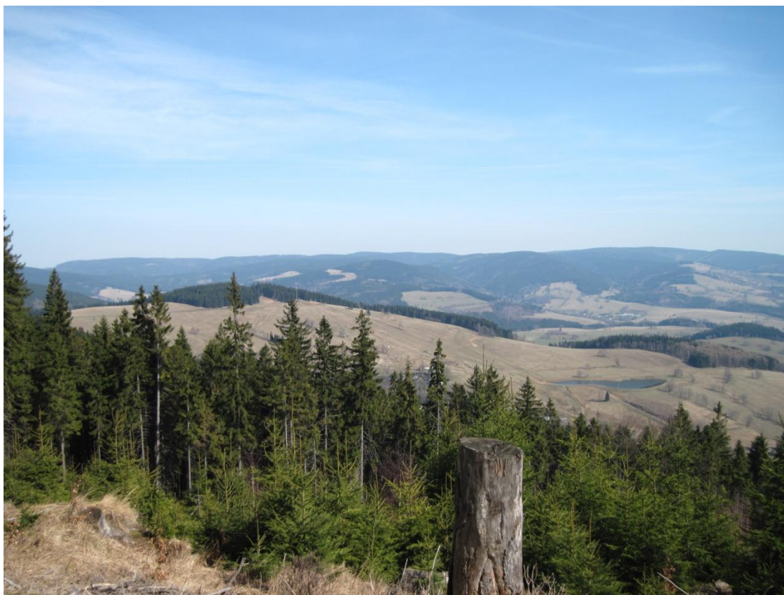
Obr. 40: Malebný ráz krajiny Staroměstské kotliny a podhůří Králického Sněžníku, březen 2014