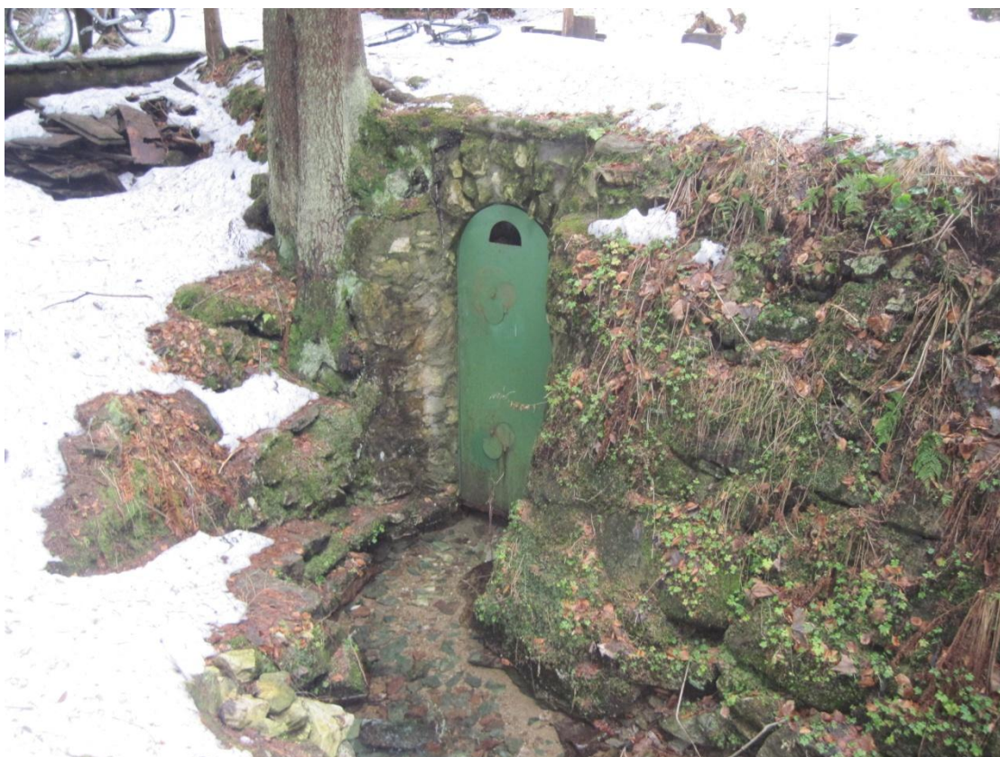
Obr. 43: Vchod do jeskyně Tvarožné díry, prosinec 2013