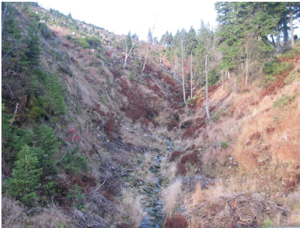
Obr. 18: Strž na východním svahu Mokrého hřbetu, říjen 2013