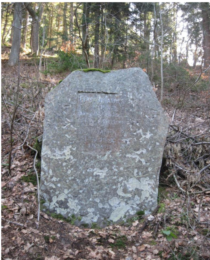
Obr. 27: Pomník v německém jazyce v lesích na obci Malá Morava, říjen 2013