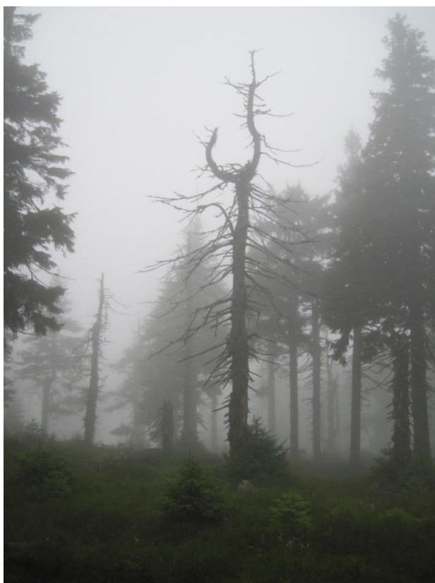
Obr. 35: Bajonetový efekt u nejspíše nepůvodní formy smrku ztepilého nedaleko vrcholu Sušina (1321 m n. m.), listopad 2013