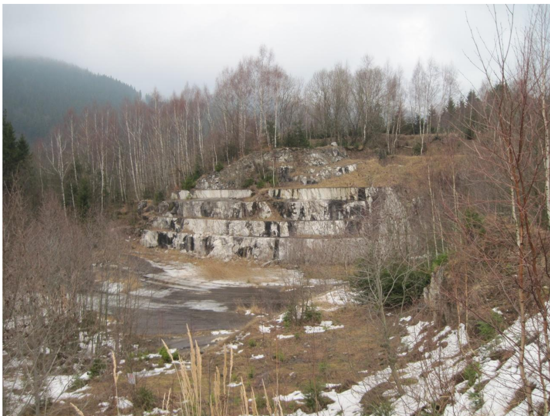
Obr. 44: Opuštěný mramorový lom u obce Dolní Morava, prosinec 2013