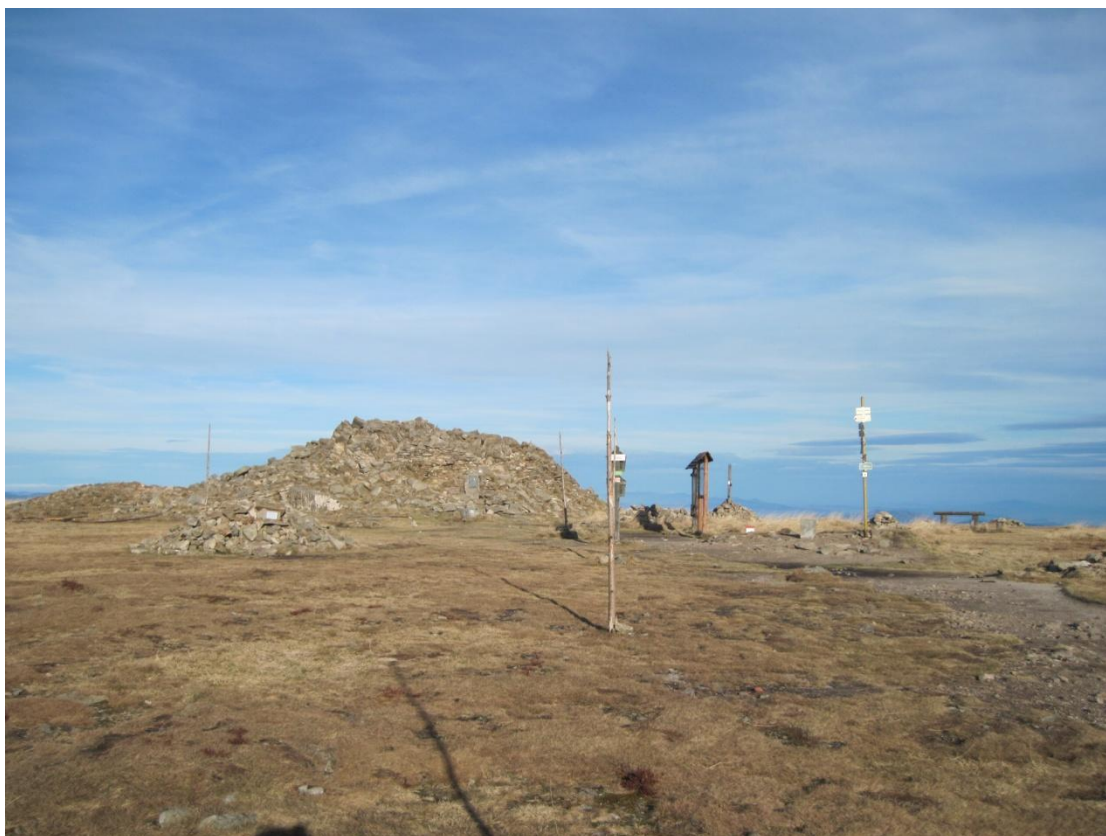
Obr. 32: Trosky rozhledny na vrcholu Králického Sněžníku, říjen 2013