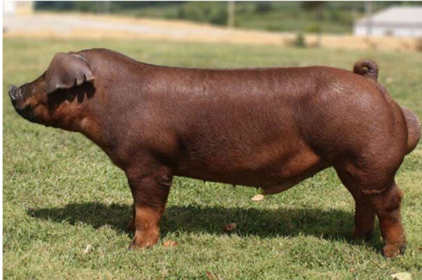
Obrázek 4: Duroc

( https://garden-cs.desiguspro.com/svini/poroda-dyurok.html )