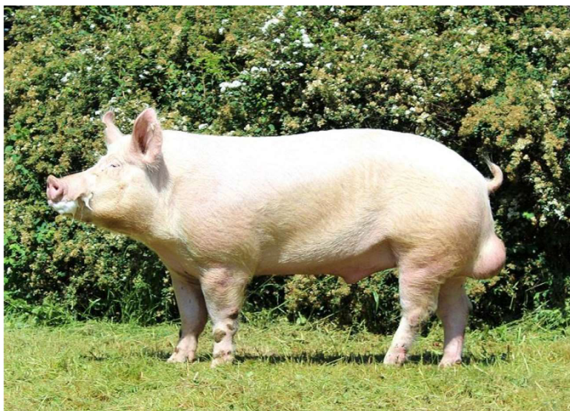
Obrázek 2: České bílé ušlechtilé

Prasata tohoto plemene bývají odolná vůči stresu a jejich předností je velmi dobrá reprodukční schopnost, velmi dobrá růstová schopnost a masná užitkovost. Kvalita masa tohoto plemene je dobrá (Pražák 2005). Podíl libové svaloviny v jatečném trupu je okolo 55–56 % při obsahu intramuskulárního tuku kolem 1,8 % (Sambraus 2006). Toto plemeno si stále zachovává užitkový typ odpovídající mateřským liniím (Pražák 2005).