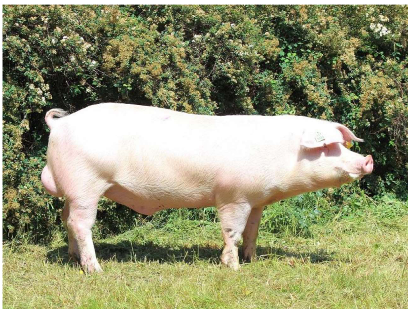
Obrázek 3: Česká landrase ( https://www.energyshobby.cz/mataska-plemena-prasat/ )

Prasata tohoto plemene dosahují vysokého stupně odolnosti vůči stresu. Významné jsou velmi dobré reprodukční vlastnosti, vysoká intenzita růstu a velmi dobrá masná užitkovost (Pražák 2005). V jatečném trupu je podíl libové svaloviny nejméně 55–58 % s obsahem intramuskulárního tuku maximálně 1,8 % (Sambraus 2006).