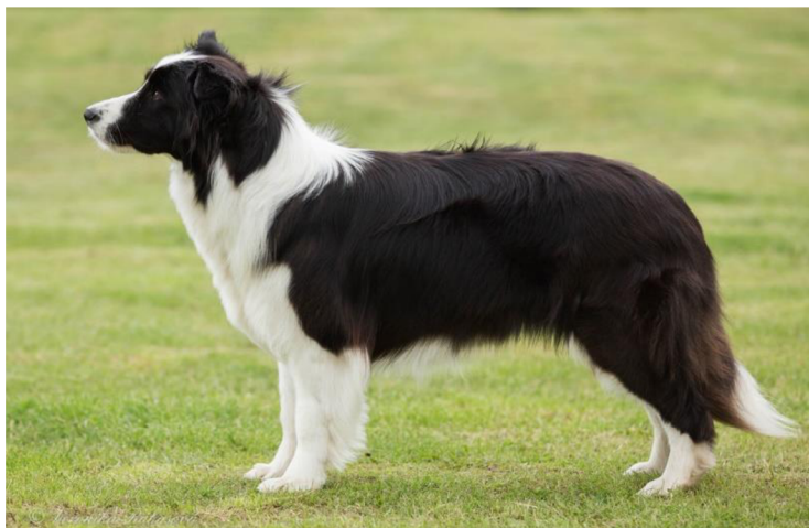
Obrázek 3 Border kolie – černobílé zbarvení

Černé zbarvení je určováno souhrou několika genů. Předně musí mít jedinec dominantní sestavu genů (E/E) nebo dominantně heterozygotní sestavu genů (E/e) lokusu E neboli extension lokusu. Dalším genem ovlivňující toto zbarvení je lokus B, který u černého zbarvení musí být v dominantní sestavě genů (B/B) či heterozygotní dominantní sestavě genů (B/b), více tento lokus bude popsán u hnědého zbarvení, pro které je typická jeho recesivní sestava genů.