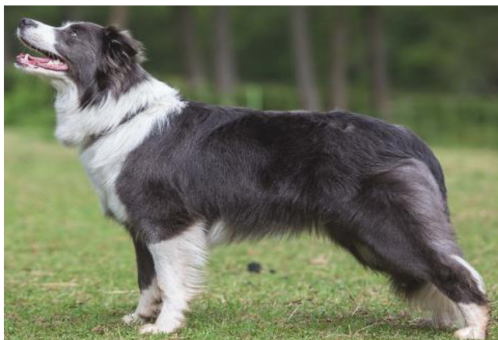
Obrázek 5 Border kolie – modrobílé zbarvení (©Veronika Rákosová) ( http://barvy.weebly.com/ )

vzniká ředěním černého zbarvení a její genotyp je tedy E. K^B B. mm \mathbf{dd} SiSi . Tedy od černé se liší pouze v recesivní sestavě lokusu D. Ředění ale neprobíhá u Border kolií jen u černého zbar-