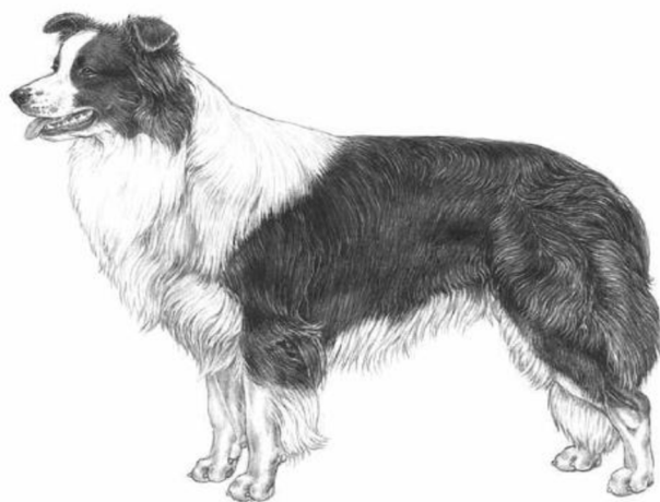
Obrázek 1 ©M. Davidson, ilustr. NKU Picture Library (FCI 2009)

Federation cynologique internationale (FCI) uznala plemeno border kolie v roce 1977. Platný oficiální standart vydala FCI ještě o něco později, a to až v roce 1987 (FCI 2009). Vzhled border kolie dle FCI standartu ukazuje obrázek č. 1. American Kennel Club (Americká organi-