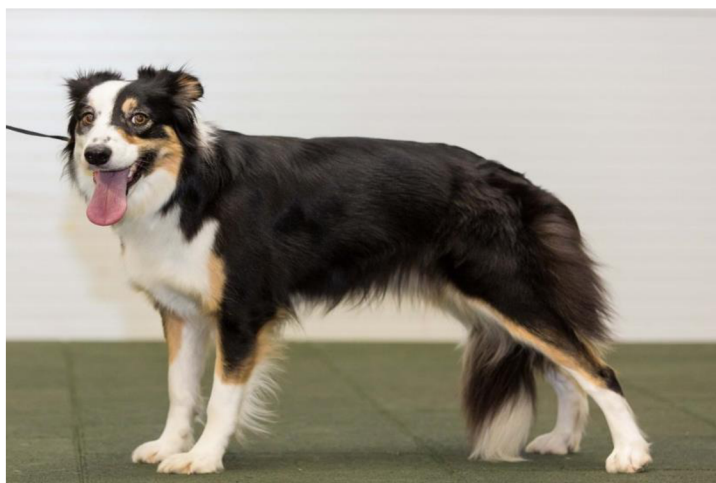
Obrázek 8 Border kolie – zbarvení černobílá s pálením

„Black and tan“ se velmi liší svým rozsahem jak u jednotlivců, tak i u jednotlivých plemen (Schmutz & Berryere 2007). U psů není tato variace zbarvení zcela prozkoumána ovšem je více zkoumána a obeznámena u myši (Candille et al. 2004). Černobílá border kolie s pálením je zobrazena na obrázku č. 8.