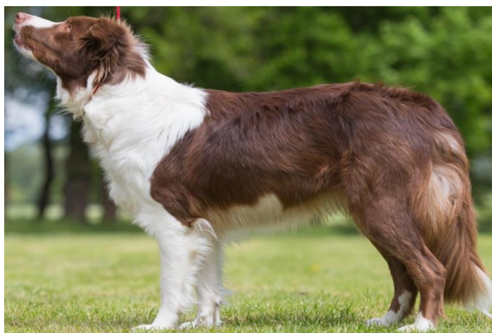
Obrázek 4 Border kolie – hnědobílé zbarvení

Hnědé zbarvení je spojené s lokusem B. Jeho projev stejně jako projev černé barvy závisí nejprve na sestavě lokusu E (Schmutz & Berryere 2007). Tedy psi s černou a hnědou barvou