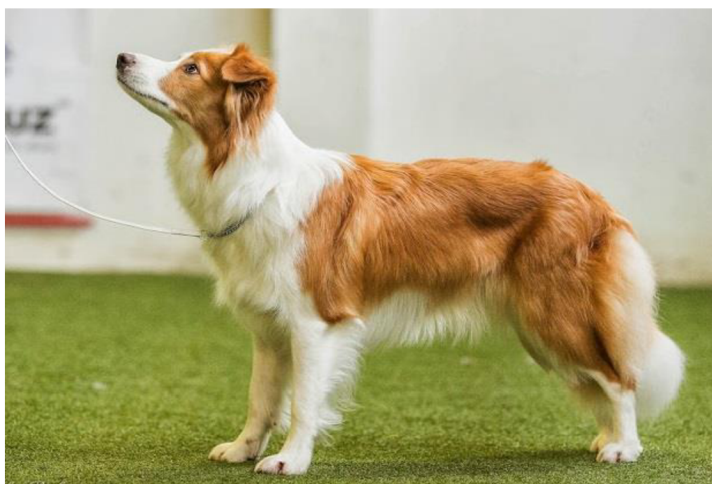
Obrázek 7 Border kolie – zbarvení australská červená

Pro projev výše zmíněných barev tedy černou, hnědou či jejich variant, musí být pes nositelem alespoň jedné dominantní alely E (tedy musí mít alelickou sestavu buďto E/E nebo E/e) (Kerns et al. 2007; Candille et al. 2007). Dominanční hierarchie je u genu E následující: E alela divokého typu (produkce eumelaninu) > E m (černá maska v oblasti obličeje) > e. Lokus E (MC1R gen) je klíčová signální molekula vyskytující se na melanocytech a vyvolává projev enzymů, které při dominantní nebo dominantně heterozygotní sestavě syntetizují eumelanin. Pokud je ale lokus E v recesivní sestavě tedy dvou alel ee mění produkci eumelaninu na feomelanin. Tedy při sestavě dvou recesivních e dochází k expresi feomelaninu (Newton et al. 2000; Schmutz et al. 2003; Dreger & Schmutz 2010). Feomelanin podporuje produkci žluté, krémové či červené barvy. U border kolí se vyskytuje pouze červené zbarvení přesným názvem Australská červená, která je zobrazena na obrázku číslo 7. Tato barva je také známá pod