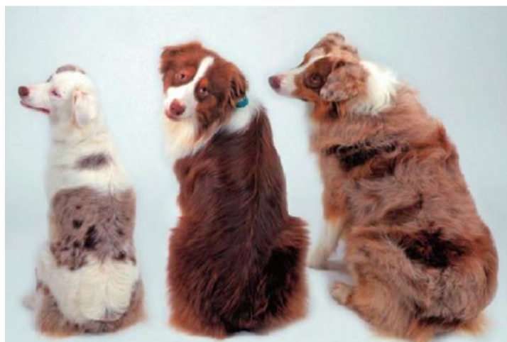
Obrázek 11 Merle jedinec v pravo, normálně pigmentovaný jedinec uprostřed a double merle jedinec vlevo (Clark et al. 2006)

Co se týče hlubšího genetického pozadí merle zbarvení, lokus merle je mapován do genu původně nazvaného SILV (silver locus protein). Později spíše známý jako PMEL (premelanosome protein) s prvkem nazývajícím se SINE (Short Interspersed Elements), který je umístěný na