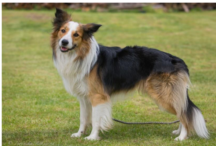
Obrázek 9 Border kolie – sedlové pálení

Mezi méně časté barevné varianty patří u border kolií také sobolí barva. Ta je známá