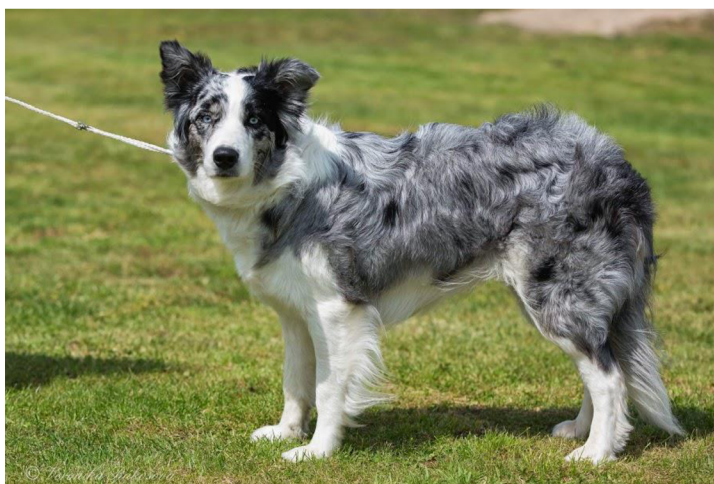
Obrázek 10 Border kolie – merle zbarvení

Posledním popisovaným zbarvením v této práci, které se u border kolíí vyskytuje je merle zbarvení (Langevin et al. 2018). Vizuálně je merle zbarvení pro lidi velmi atraktivní a zajímavé. Možná proto lze merle zbarvení nalézt kromě border kolíí i u bezpočtu plemen zahrnující: Alapha Blue Blood Bulldog, Americký kokršpaněl, Americký pitbulteriér, Americký stafordširský teriér, boxer, čivava, jezevčík, Francouzský Beauceron, Francouzský buldoček, Německá doga, Maďarský Mudi, Labradoodle, Louisiana Catahoula, Lurcher, Miniaturní americký ovčák, Norský Dunkerhound (Strain 2015; Langevin et al. 2018). Nejčastěji se však objevuje u plemene australský ovčák, hned poté následuje border kolie, německá doga a shetlandský ovčák (Savel & Sombé 2020). Varga et al. (2020) označuje merle zbarvení jako jedno z nejzajímavějších, a to jak fenotypově, tak i genotypově. Jedná se o pestré vzorování srsti s nepravidelnými skvrnami neúplně zředěného eumelaninu na normálně pigmentovaném pozadí, jak je zobrazeno na obrázku č. 10.