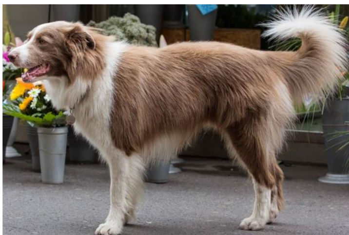
Obrázek 6 Border kolie – Lila zbarvení

vení, ale i u zbarvení hnědého. To se nazývá lila zbarvení. Lila zbarvení je zobrazeno na obrázku číslo 6. Jeho genotyp je E. K^B bb mm \mathbf{dd} SiSi , tedy od hnědého zbarvení se také liší pouze sestavou lokusu D. Zesvětlení se projevuje nejen na srsti, ale i na sliznicích, oku (jantarové oko) a čenichu (břidlicový čenich) (Van Buren et al. 2020).