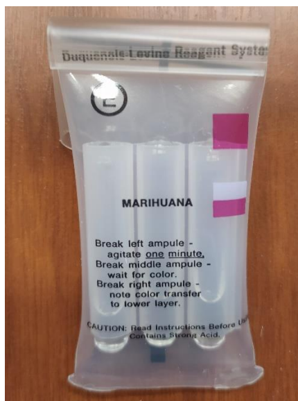
Obrázek 3 - NIK test sada na detekci marihuany