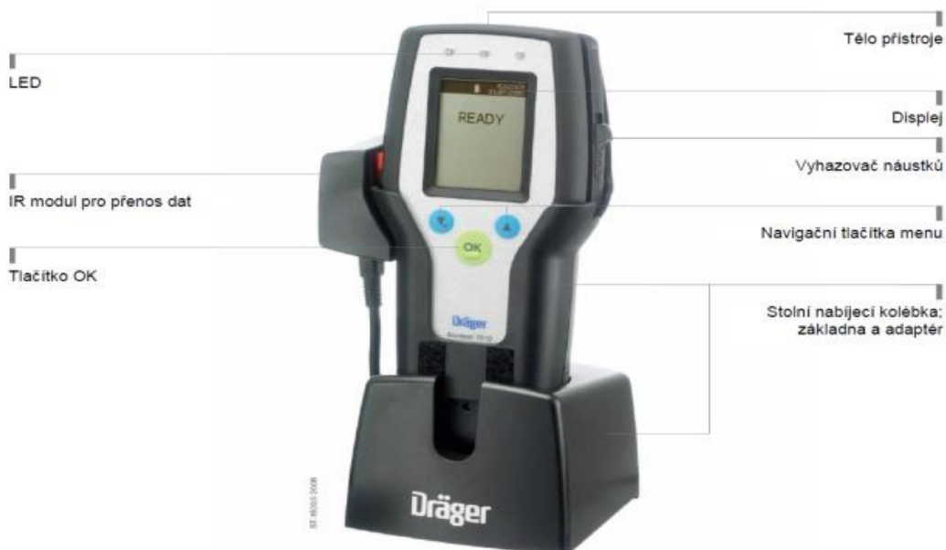
Obrázek 1 - Alcotest 7510