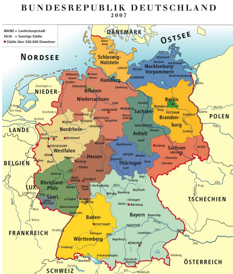
Obrázek č. 2: SPOLKOVÉ ZEMĚ NĚMECKO, (zdroj Atlas Deutschland Bundesländer Karte, 2007)

Spolková republika Německo se člení na šestnáct spolkových zemí, kterými jsou Bádensko-Virtemebersko, Bavorsko, Berlín, Braniborsko, Brémy, Hamburk, Hesensko, Meklenbursko-Přední Pomořansko, Dolní Sasko, Severní Porýní-Vestfálsko, Porýní-Falcko, Sársko, Sasko, SaskoAnhaltsko, Šlésvicko-Holstýnsko, Duryňsko) Všechny tyto spolkové země mají vlastní zemské sněmy a zemské vlády. Je nejlidnatějším státem Evropské unie, má přes 82 miliónů obyvatel (Ministerstvo zahraničních věcí ČR. Německo [online]).