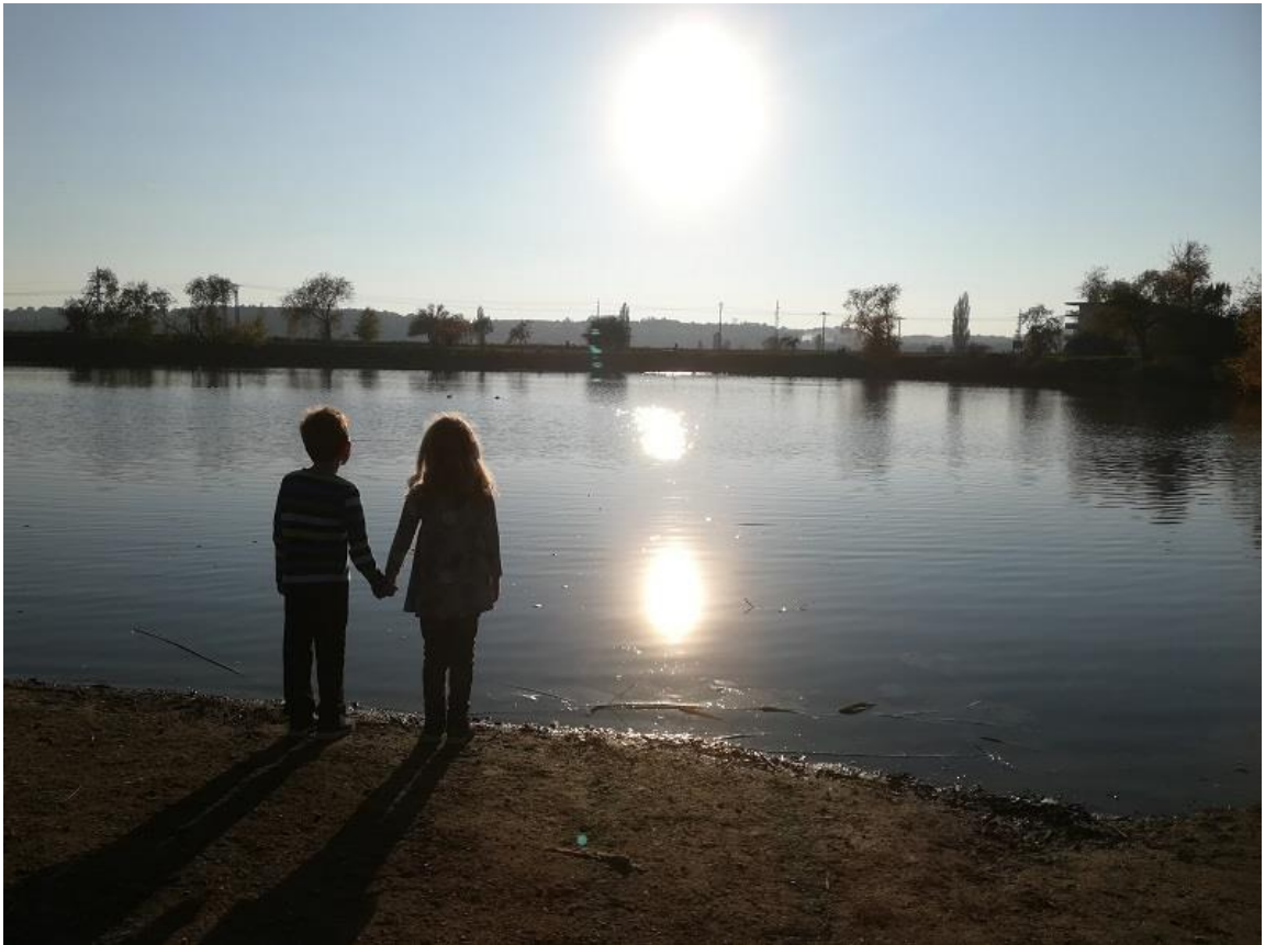
Obrázek č. 1: DĚTI

„Šťastný je ten, kdo našel štěstí v rodině.“