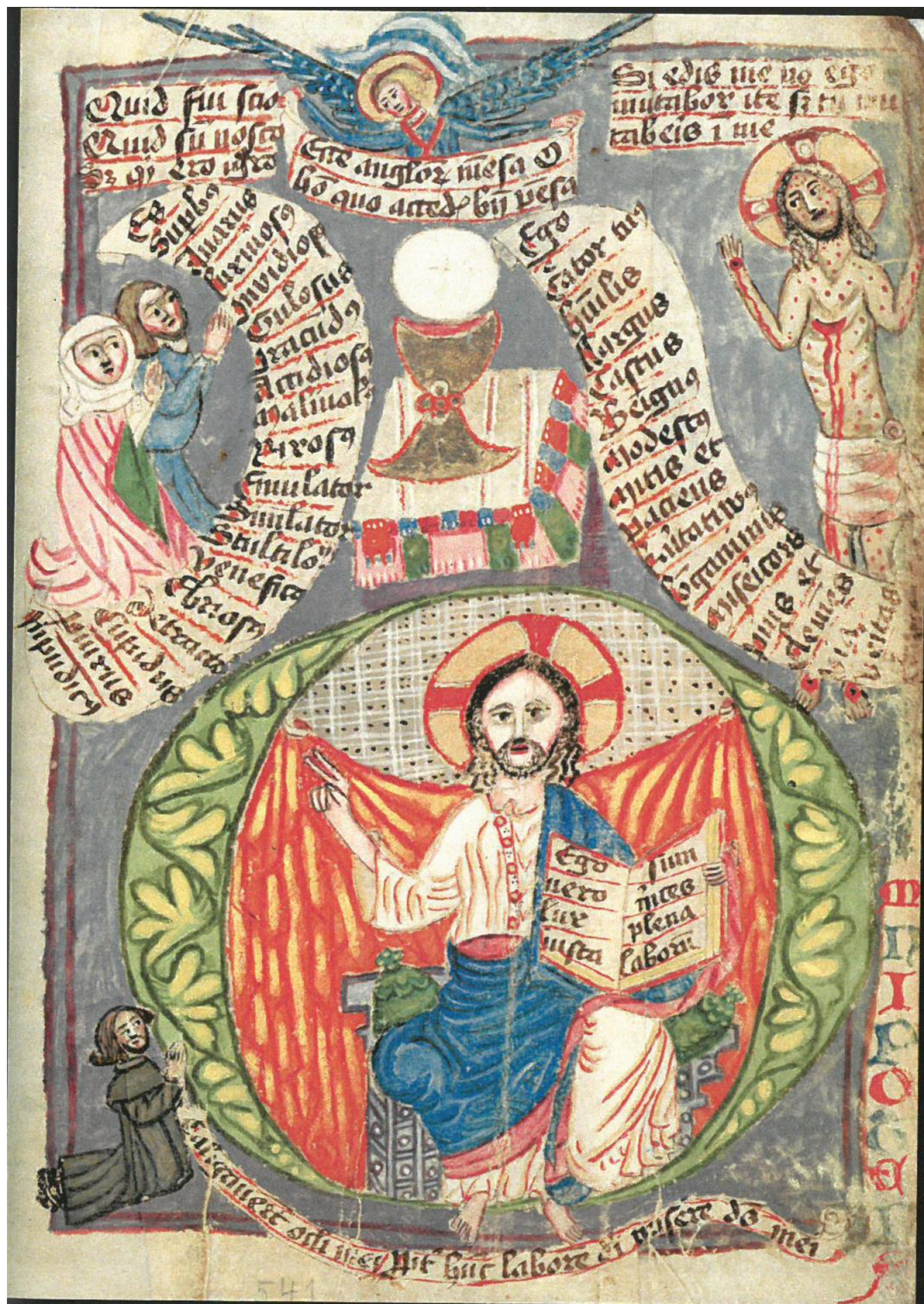
5. Věřící vyznávající své hříchy, svátost eucharistie, Bolestný Kristus a Kristus soudce, Bible husitského kněze, 1441, Praha, Knihovna Národního muzea, XVIII B 18, fol. 541r.