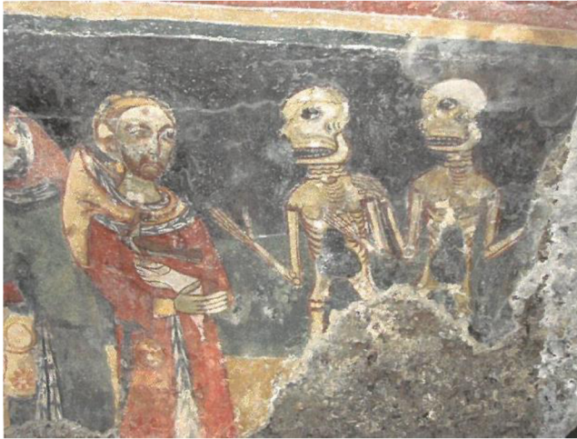
14. Setkání třech živých s mrtvými, 1225, Melfi, Kostel sv. Máří Magdalény.