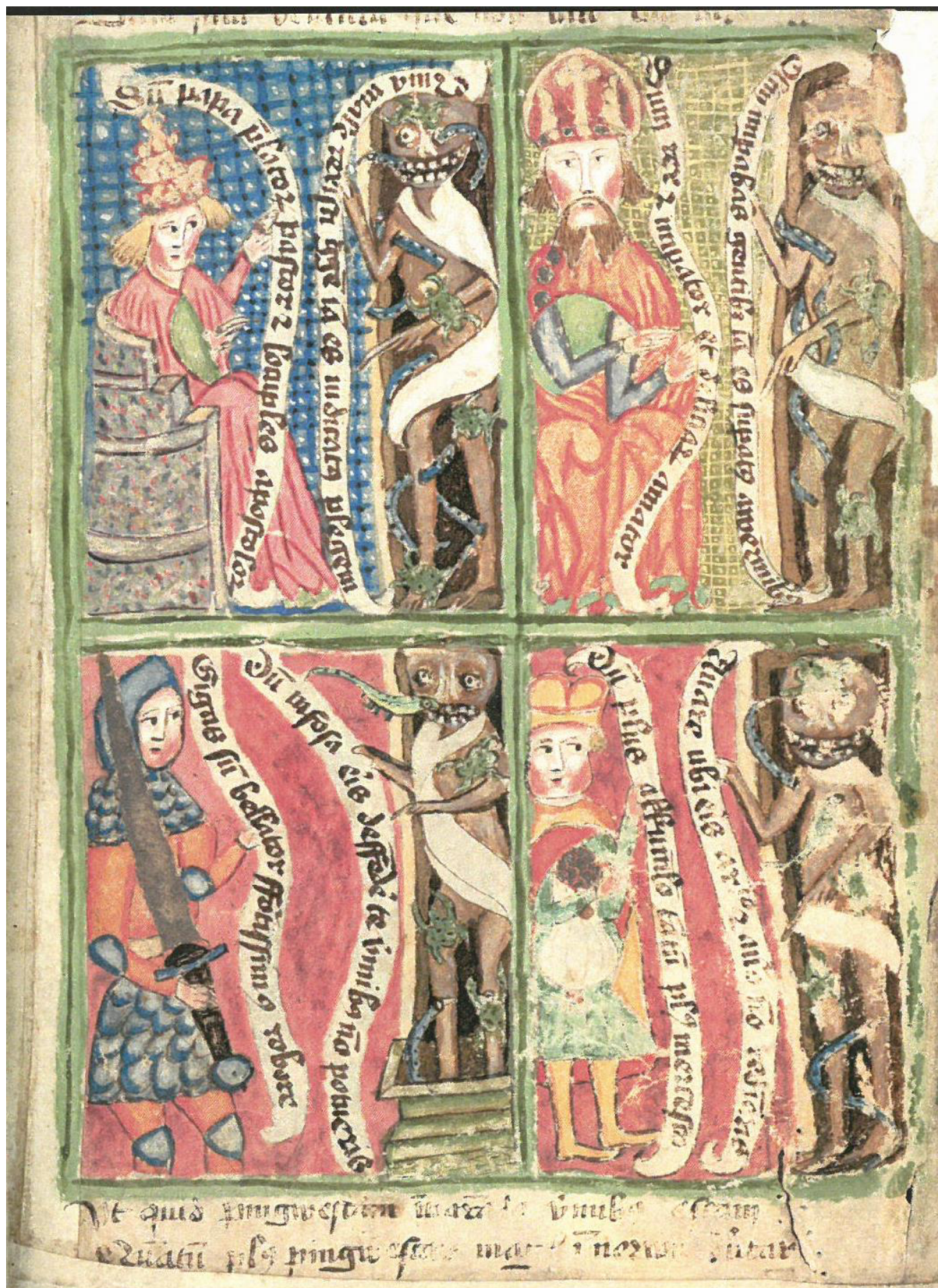
7. Tanec smrti, Bible husitského kněze, 1441, Praha, Knihovna Národního muzea, XVIII B 18, fol. 542r.