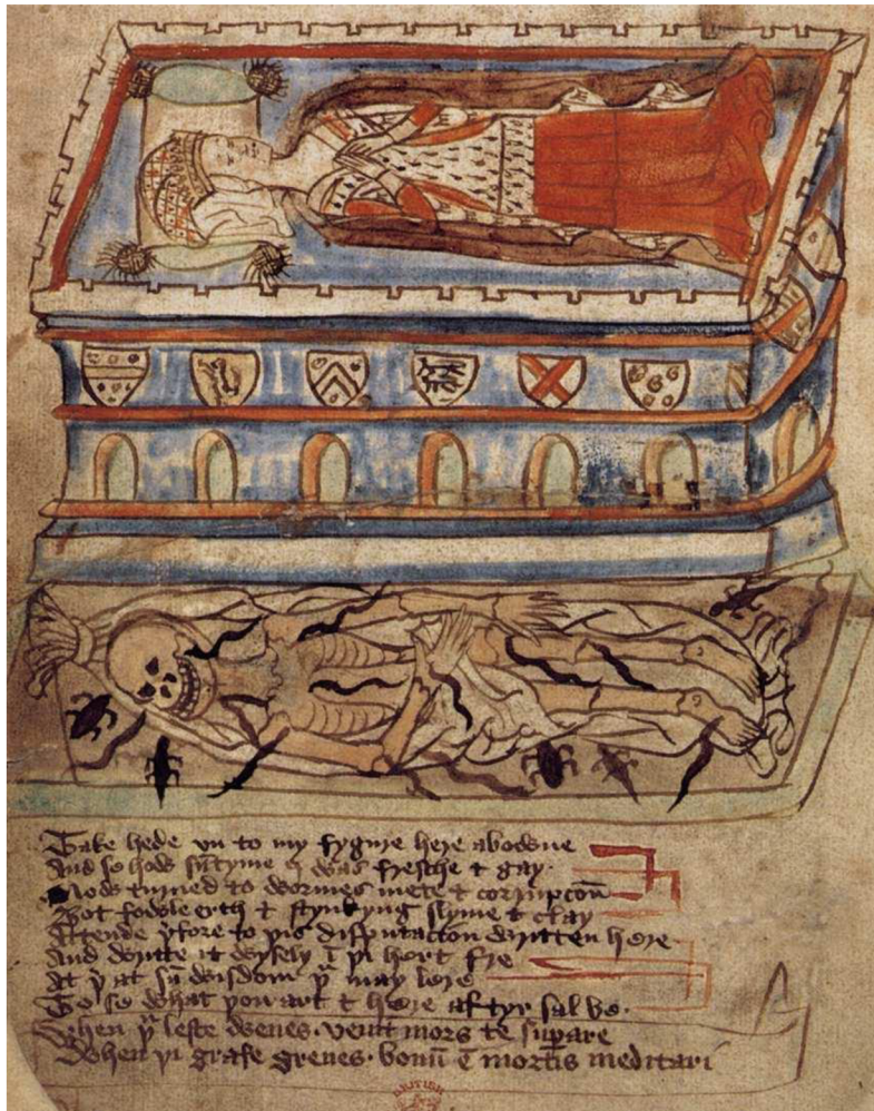
13. A Disputation Betwyxt be Body and Worms, 1460-1470, Londýn, British Libery, MS Add 37049, fol. 32v.