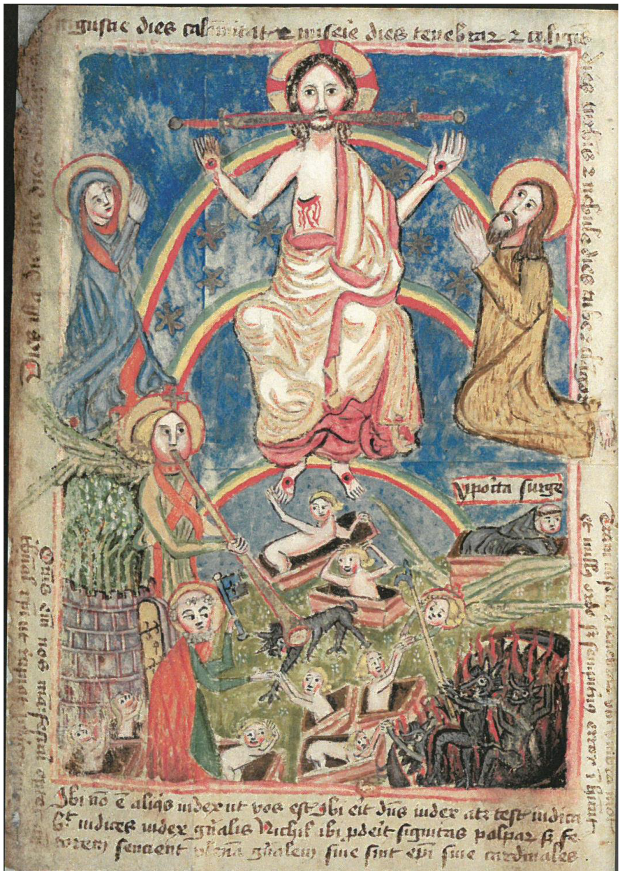
4. Poslední soud, Bible husitského kněze, 1441, Praha, Knihovna Národního muzea, XVIII B 18, fol. 540v.