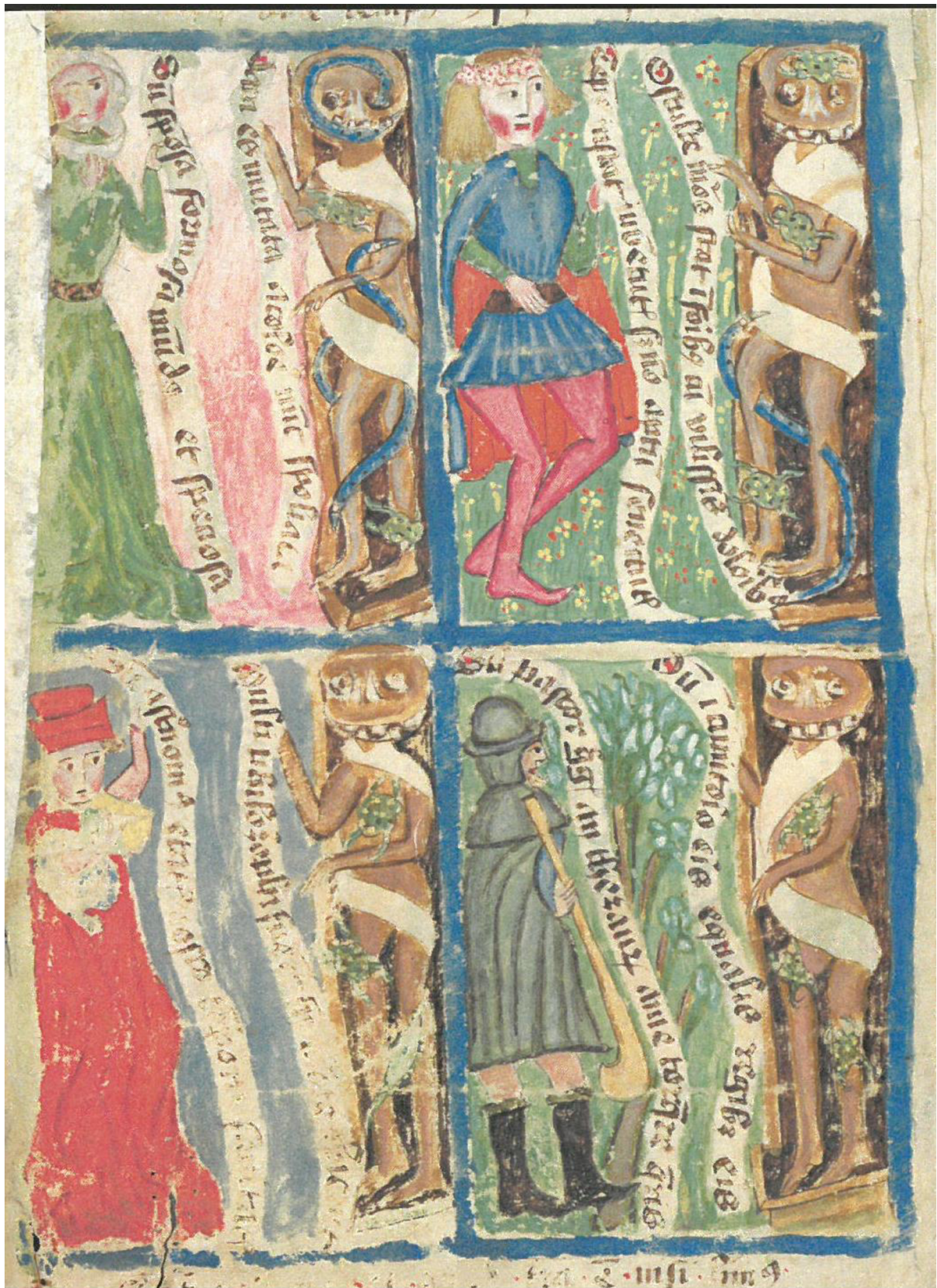
8. Tanec smrti, Bible husitského kněze, 1441, Praha, Knihovna Národního muzea, XVIII B 18, fol. 542v.