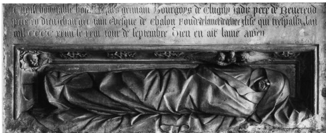
9. Transi náhrobek Jacques Germain (†1424), Museum, Dijon.