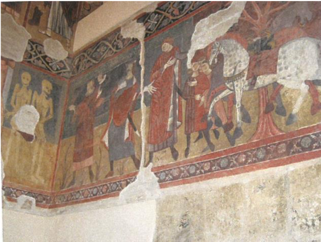
15. Setkání třech živých s mrtvými, 1260, Atri, Kostel Nanebevzetí Panny Marie, jižní apsida chóru,