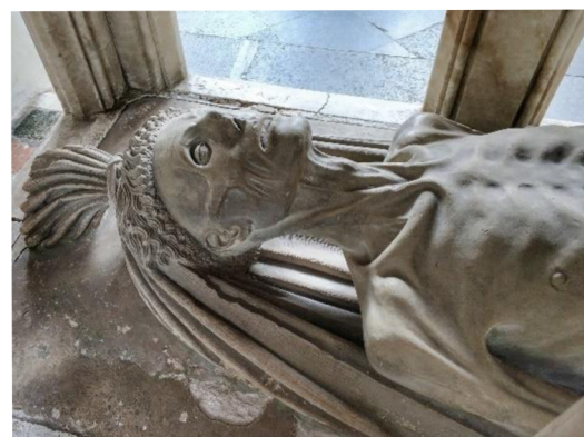
11. Transi náhrobek Jana Fitzalana (†1435), Hrad Arundel, hradní kaple.