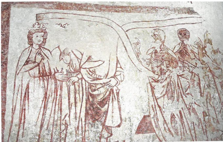
16. Legenda o setkání třech živých a třech mrtvých, 20. léta 14. stol., Mouřenec u Annína, Kostel sv. Mořice, severní stěna lodi.