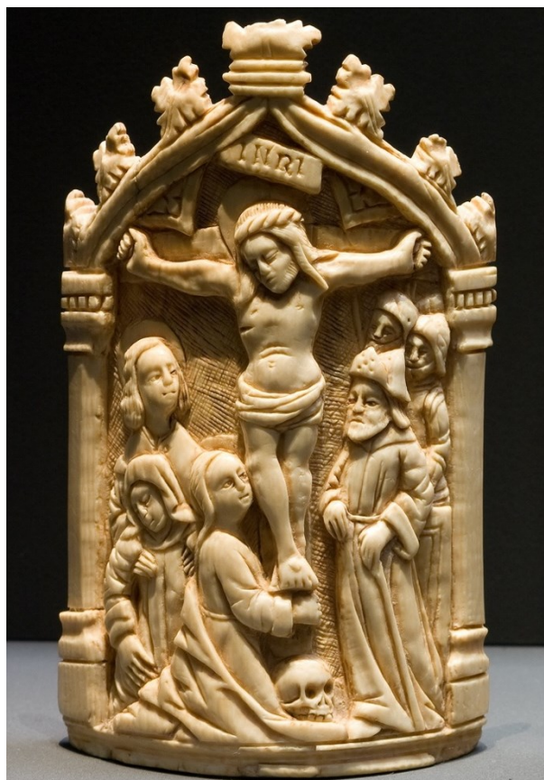
Příloha č. 5 - Pacifikál z počátku 16. století.