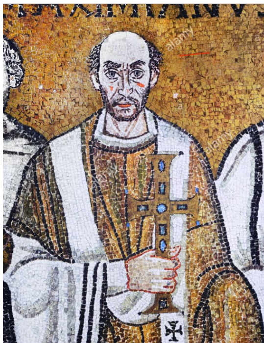
Příloha č. 2 – Mozaika žehnajícího biskupa Massimiana v Reveně (VI. st.).