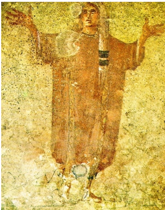
Příloha č. 1. – Gesto oranta, Priscilliny katakomby.