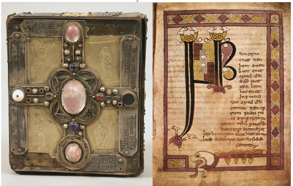
Příloha č. 4 – Cumdach stowského misálu a první strana tohoto misálu.