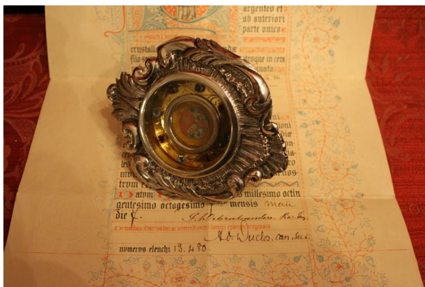
Příloha č. 6 – Barokní osculatorium z roku 1860.