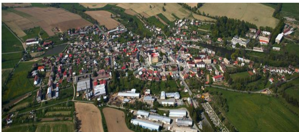
Příloha č. 4: Současná podoba města Bystře – letecký pohled ( www.bystre.cz )