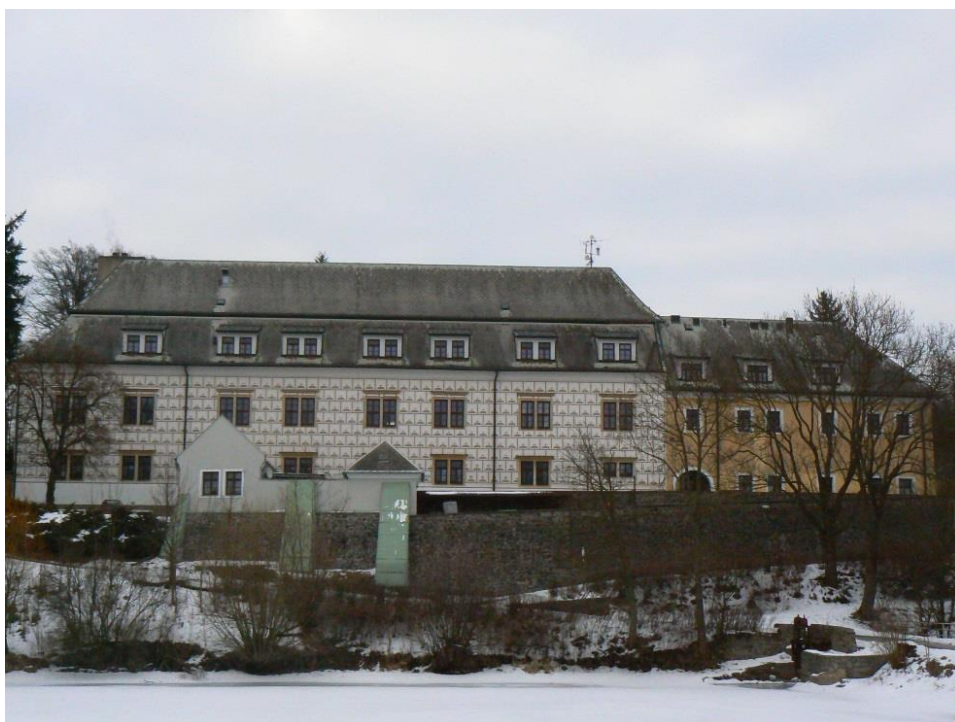
Příloha č. 13: Současná podoba zámku