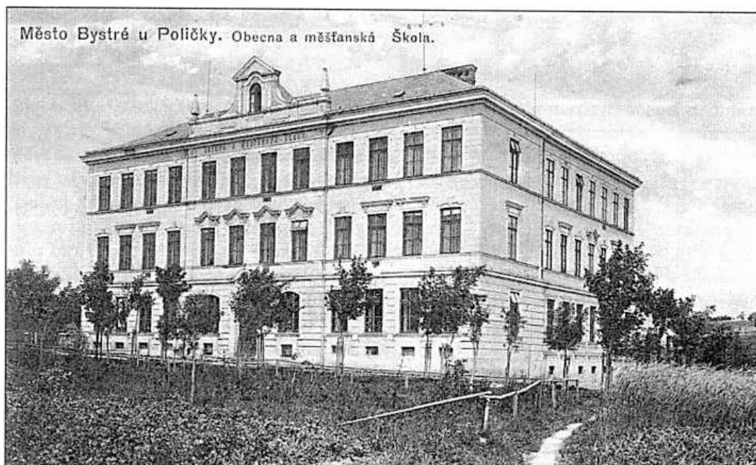
Příloha č. 17: Obecná a měšťanská škola (Bysterské noviny)