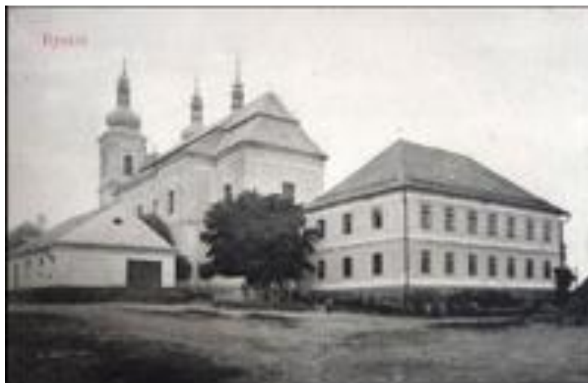
Příloha č. 23: Historický pohled na budovu školy a kostel sv. Jana Křtitele