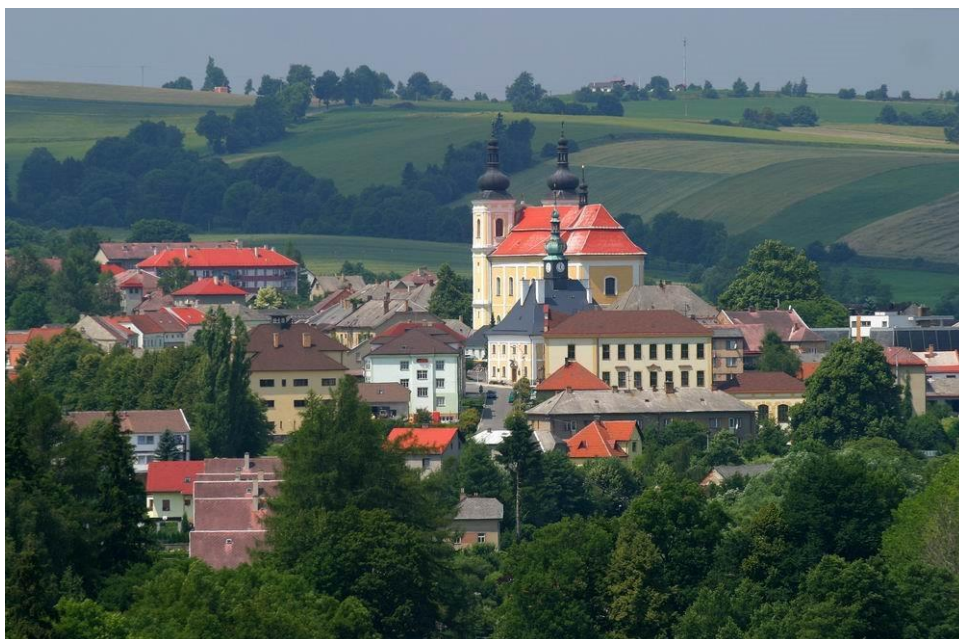
Příloha č. 3: Současná podoba města Bystře ( www.bystre.cz )