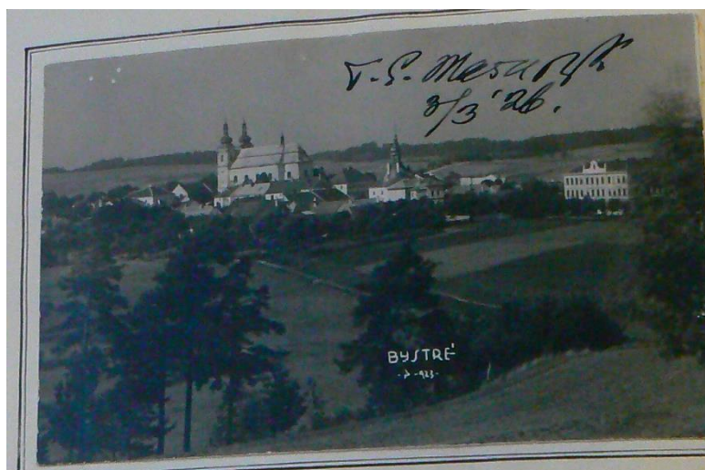
Příloha č. 25: Foto s podpisem T. G. Masaryka (Kronika Měšťanské školy)