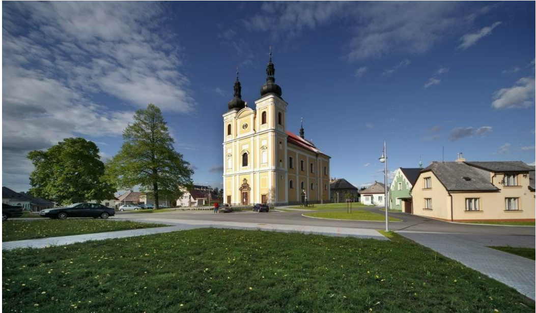
Příloha č. 5: Barokní kostel sv. Jana Křtitele a Panny Marie Karmelské ( www.bystre.cz )