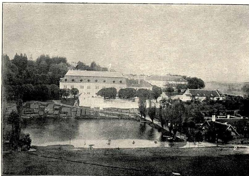
1. ZÁMEK A 2. PIVOVAR V B. STRÉM.