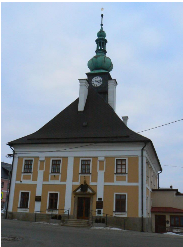
Příloha č. 7: Barokní budova radnice