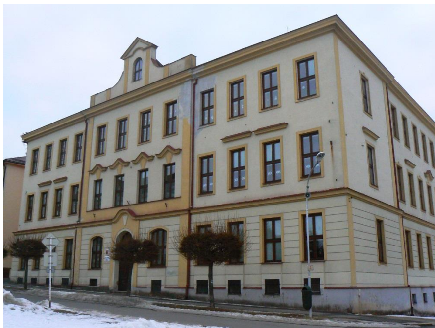
Příloha č. 18: Základní škola Bystré