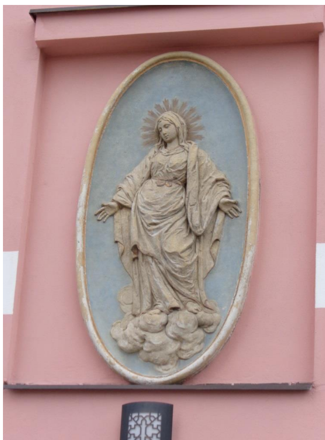
Příloha č. 21: opravený reliéf Panny Marie na budově základní umělecké školy