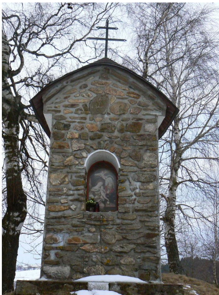
Příloha č. 2: U kostelíčka – místo, kde ležela původní osada Bystré