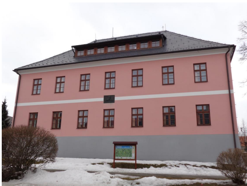
Příloha č. 20: Budova obecné školy, současná základní umělecká škola