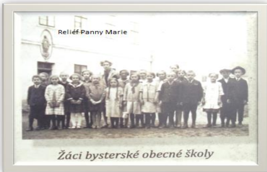
Příloha č. 19: Žáci bysterské obecné školy ( www.bystre.cz )