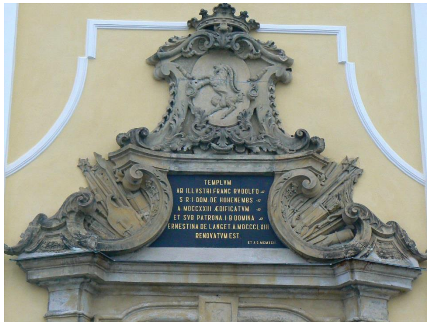
Příloha č. 6: Pamětní deska nad vchodem do kostela