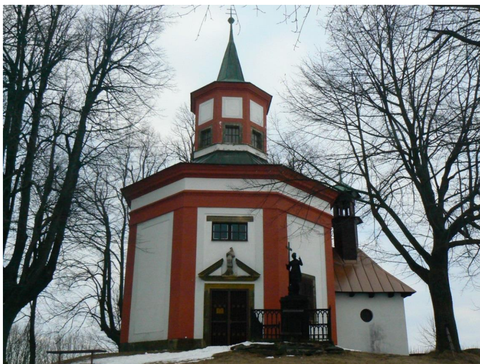
Příloha č. 8: Hartmanská kaple