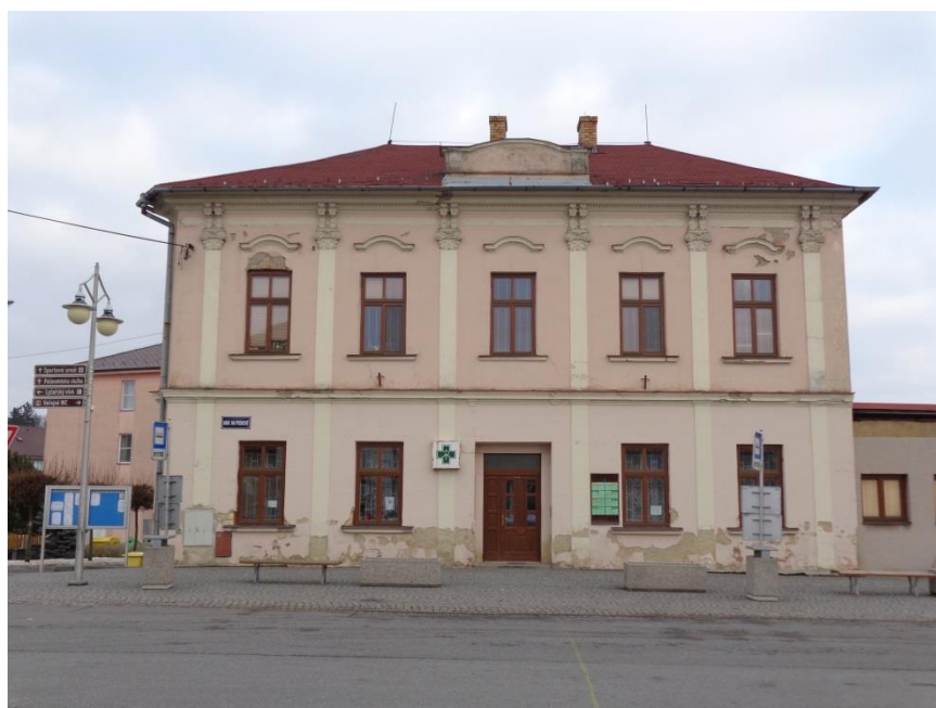
Příloha č. 24: Hejtmánkova opatrovna, současné zdravotní středisko