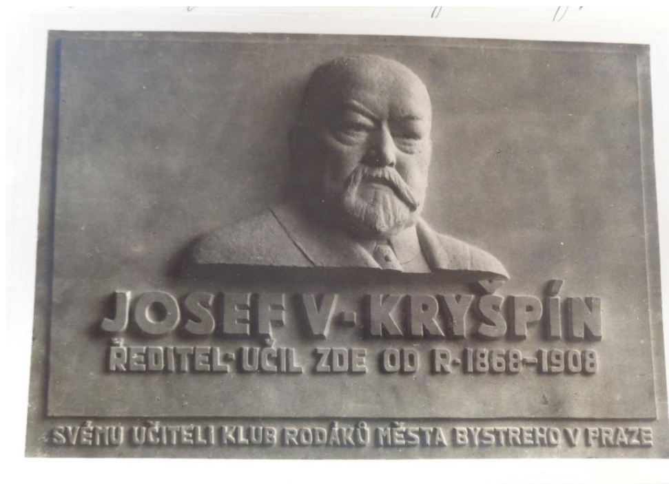
Příloha č. 22: Pamětní deska J. V. Kryšpína na budově základní umělecké školy