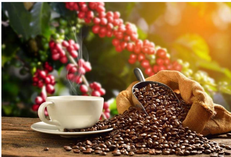
Obrázek 1: Káva jako rostlina

Kávovník může dorůst až do výšky devíti metrů, pro zpracování je tato výška velice nepraktická, proto jsou keře upravovány tak, aby jejich výška dosáhla maximálně do výšky tří metrů. Plody kávovníku nazýváme kávové třešně, jsou to kávové bobule, které řadíme mezi ovoce, jedná se o jedlé plody, uvnitř kterých jsou schována semena – kávová zrna. Tyto plody mají červenou až žlutou či oranžovou barvu. Dozrávají zhruba devět až dvanáct měsíců a mohou zároveň nést zralé i nezralé plody a současně kvést. Díky tomu mohou sklizně probíhat i několikrát ročně (VÁŇA, PLŠEK, 2017, str. 11).