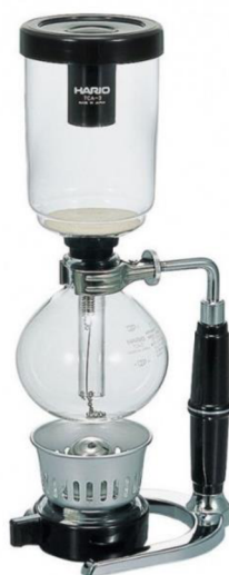
Obrázek 5: Vakuum pot (Čerstvá Káva, [online], 2008)

Do spodní baňky se nalije předem ohřátá voda, to celý proces urychlí. Připravíme si filtr, který se vloží do druhé části vakuum potu, do skleněného válce. Celý přístroj se následně ohřívá nad kahanem. Při ohřívání ve spodní skleněné baňce vzniká pomalu pára, která vytvoří tlak a vytlačí pomalu vodu nahoru do vrchní nádoby. Po zaplnění baňky vodou se přidá káva tak, aby se řádně smíchala a byla zcela namočená. Takto se káva louhuje zhruba jednu minutu. Zhasneme kahan a mírně promícháme. Jakmile začne celý vakuum pot chladnout káva začne překapávat přes filtr zpět do spodní baňky (VESELA, 2018).