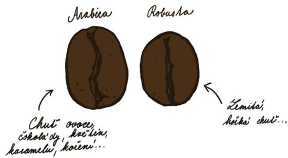
Obrázek 2: Arabica a Robusta (Čerstvá káva, [online], 2011)

Tento druh kávovníku obsahuje až 2x více kofeinu než arabika a její chuť je nezaměnitelná. Má výraznou hořkou chuť a při její konzumaci cítíte velmi silné, zemité tělo. Jedním z největších producentů této kávy je Vietnam (VESELÁ, 2010, str.17).