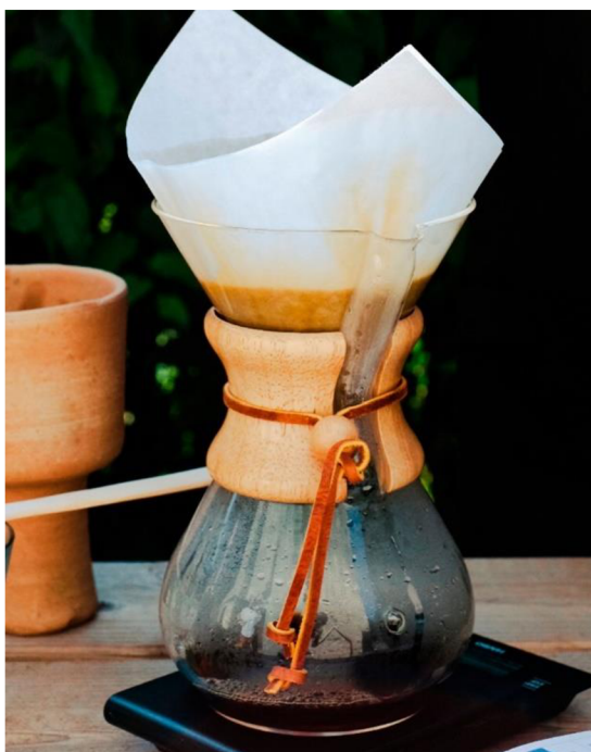
Obrázek 4: Chemex – skleněná baňka (Mahogany specialty coffee, [online], 2022)

Ohřejeme vodu v konvici na 98 °C, vložíme do chemexu papírový filtr a promyjeme horkou vodou. Z prohřátého chemexu vylijeme horkou vodu a do filtru nasypeme kávu. Dávka je určena podle velikosti a podle toho, jak silná káva je preferována. Káva se zalévá malým množstvím vody, tak aby veškerá káva byla namočená. Vzniklá kašička z kávového lógru je jemně a krátce promíchána. Po 35-45 sekundách začneme pomalu nalévat horkou vodu na kávu, ideálně krouživými pohyby a ze stejné výšky. Voda se následně louhuje společně s kávou a pomalu překapává do spodní části. Doba překapávání by neměla přesáhnout tři minuty. Poté se filtr vyhodí a káva se servíruje přímo z nádoby chemexu (CHEMEX, [online], 2017).