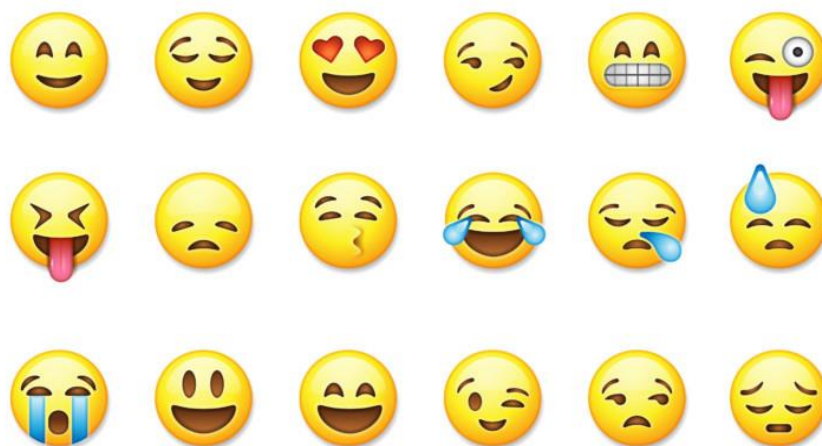
Obrázek 1: Emotikony (Vytiska, 2017, online)

Prvním rozdílem u e-komunikace je užití verbální a neverbální komunikace . Neverbální prostředky jako gesta, mimika, vzdálenost apod. mezi komunikujícími u SMS zprávy, e-mailu nebo chatu nelze tak jednoduše vyjádřit. K tomuto částečně slouží tzv. emotikony , které používáme k vyjádření našich pocitů, emocí nebo postojů, ale ty zcela přímý kontakt a neverbální komunikaci nenahradí.