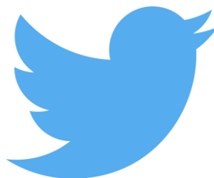
Obrázek 5 - Logo sociální sítě a mikroblogu Twitter (Ježek, 2016, online)

Twitter se také stává zdrojem rychle dostupných informací, jelikož jej v dnešní době používá i mnoho politiků nebo jinak významných osobností, informace se k nám mohou dostat prostřednictvím Twitteru rychleji než z novin nebo televizního přenosu.