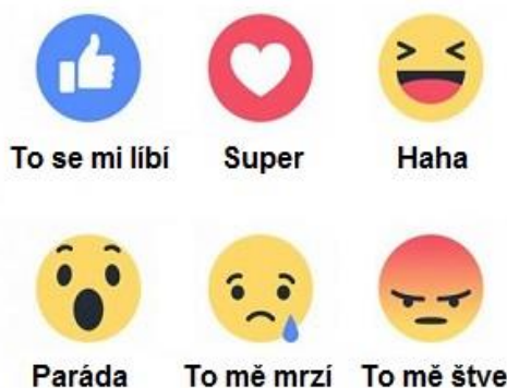
Obrázek 2: Emotikony k vyjádření emocí

Dalšími prostředky, které nám pomohou v neverbální komunikaci na internetu, jsou gify neboli animované grafické obrázky, nebo vyjádření svých rozdílných pocitů, emocí a nálad . S tímto se převážně setkáme na sociální síti Facebook. Zde můžeme lajkovat příspěvky jiných uživatelů a vyjádřit tak, že se nám daný příspěvek líbí. V dnešní době však můžeme kromě To se mi líbí vyjádřit i jiný názor. Existuje dalších 5 ikon, které zobrazují různé emoce. První je emotikon Super , další Haha , Paráda , To mě mrzí a To mě štve . 42