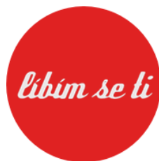
Obrázek 8 - Logo stránky Libímseti.cz (Brejlová, 2012, online)

I přes menší popularitu a používanost, jsem zde stránky Lidé.cz a Libímseti.cz zmínila. Především proto, že i na těchto stránkách stále dochází k formám krizové komunikace u českých pubescentů.