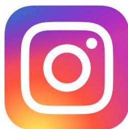
Obrázek 4 – Logo sociální sítě Instagramu (Mikešová, 2016, online)

Instagram je další z nejpoužívanějších sociálních sítí. Slouží ke vkládání fotografií, videí, nebo chatování s jinými uživateli. Jak jsme se již dozvěděli, Instagram patří mezi obsahově a také vizuálně zaměřené sociální sítě. Jde převážně o vkládání fotografií a obrázků, které sbírají “srdíčka” stejně jako u Facebooku “lajky”. Někteří lidé používají Instagram jako formu deníku nebo alba. Vkládají sem fotografie s popisky ze svého života, doporučují ostatním sledujícím místa, která stojí za to navštívit nebo věci, které si sami koupili a osvědčily se jim.