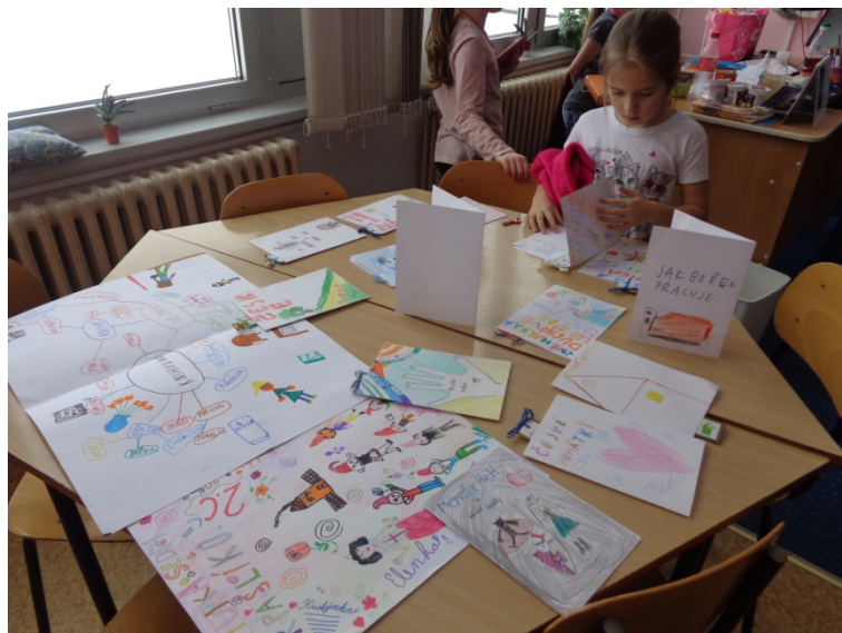
Obrázek 7 Lekce 7: Výstava tvorby žáků, 16. 12. 2015