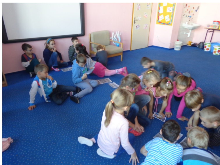
Obrázek 4 Lekce 4: Řazení ilustrací příběhu podle děje, 18. 11. 2015