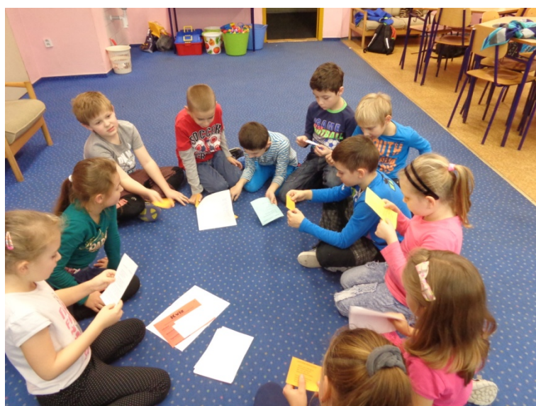
Obrázek 5 Lekce 5: Hledání rozdílů mezi prózou a poezií, 25. 11. 2015