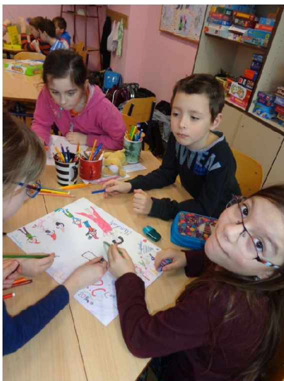
Obrázek 6 Lekce 6: Kresba plakátu k pohádce, 2. 12. 2015