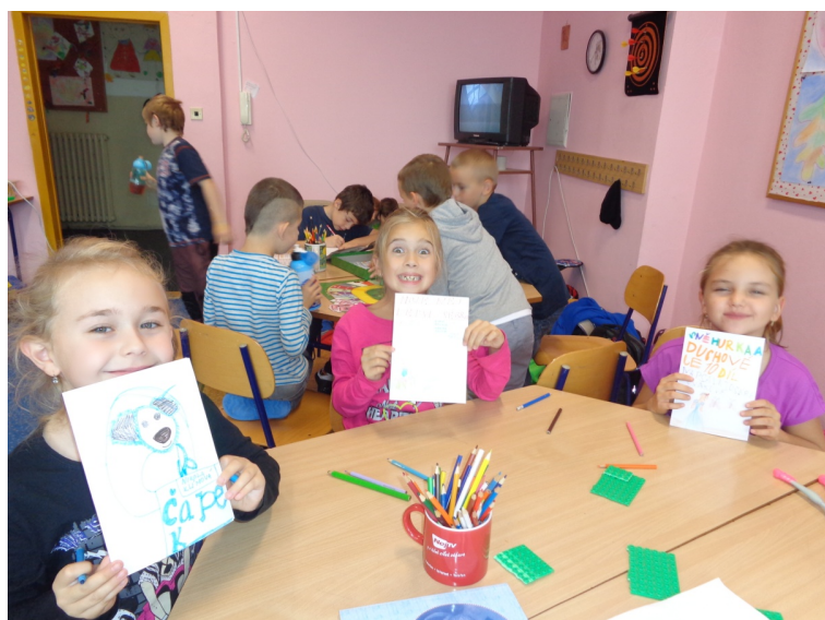
Obrázek 3 Lekce 3: Tvorba knižních přebalů na knihu, 4. 11. 2015