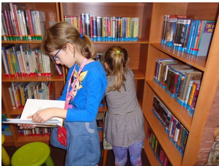
Obrázek 2 Lekce 2: Exkurze v knihovně, 21. 10. 2015