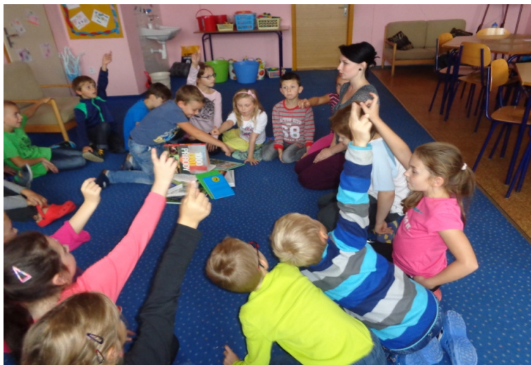
Obrázek 1 Lekce 1: Třídění knih, 14. 10. 2015

Před zahájením programu byli rodiče žáků obeznámeni s fotografováním v průběhu jednotlivých lekcí. Rodiče následně souhlasili s pořizováním fotodokumentace.