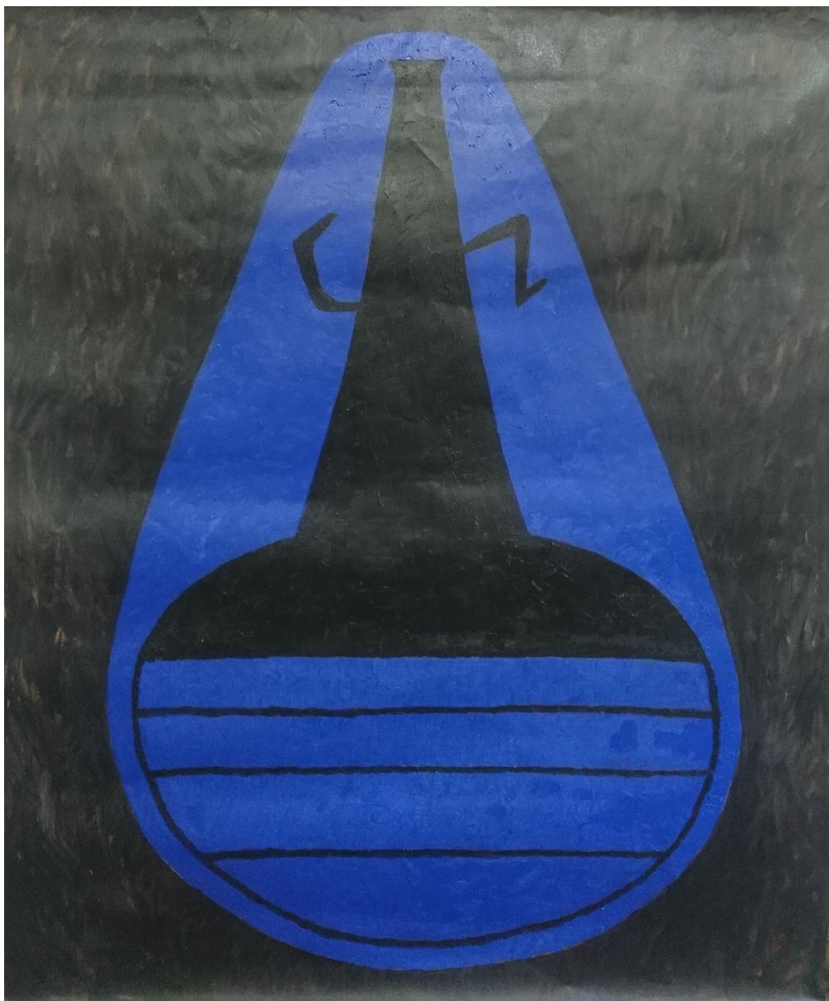
Logo 2, olej na plátne, 120 x 100 cm, 2020