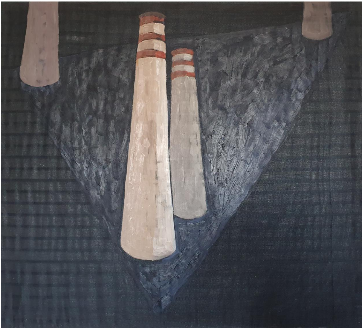
Trojuholník smrti 2, olej na plátne, 80 x 90 cm, 2020