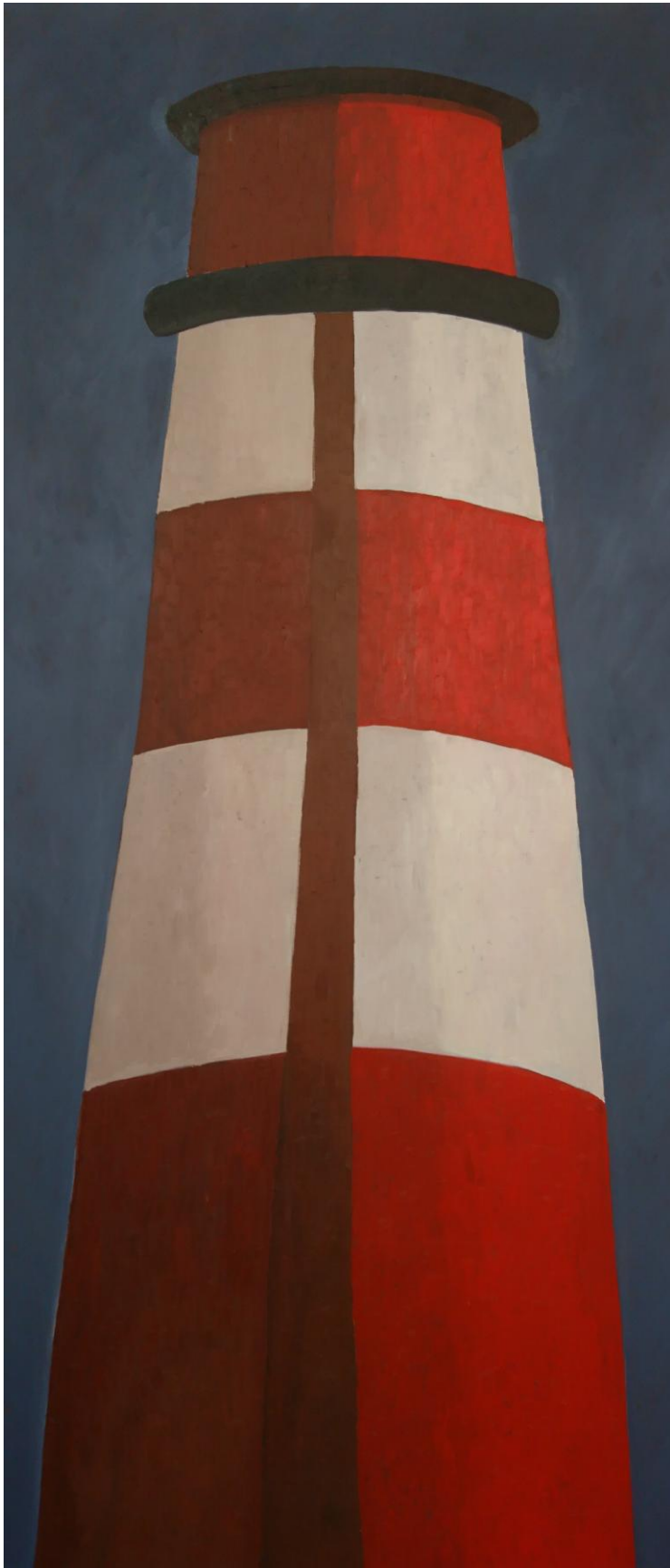
Komín , olej na plátne, 220 x 100 cm, 2020