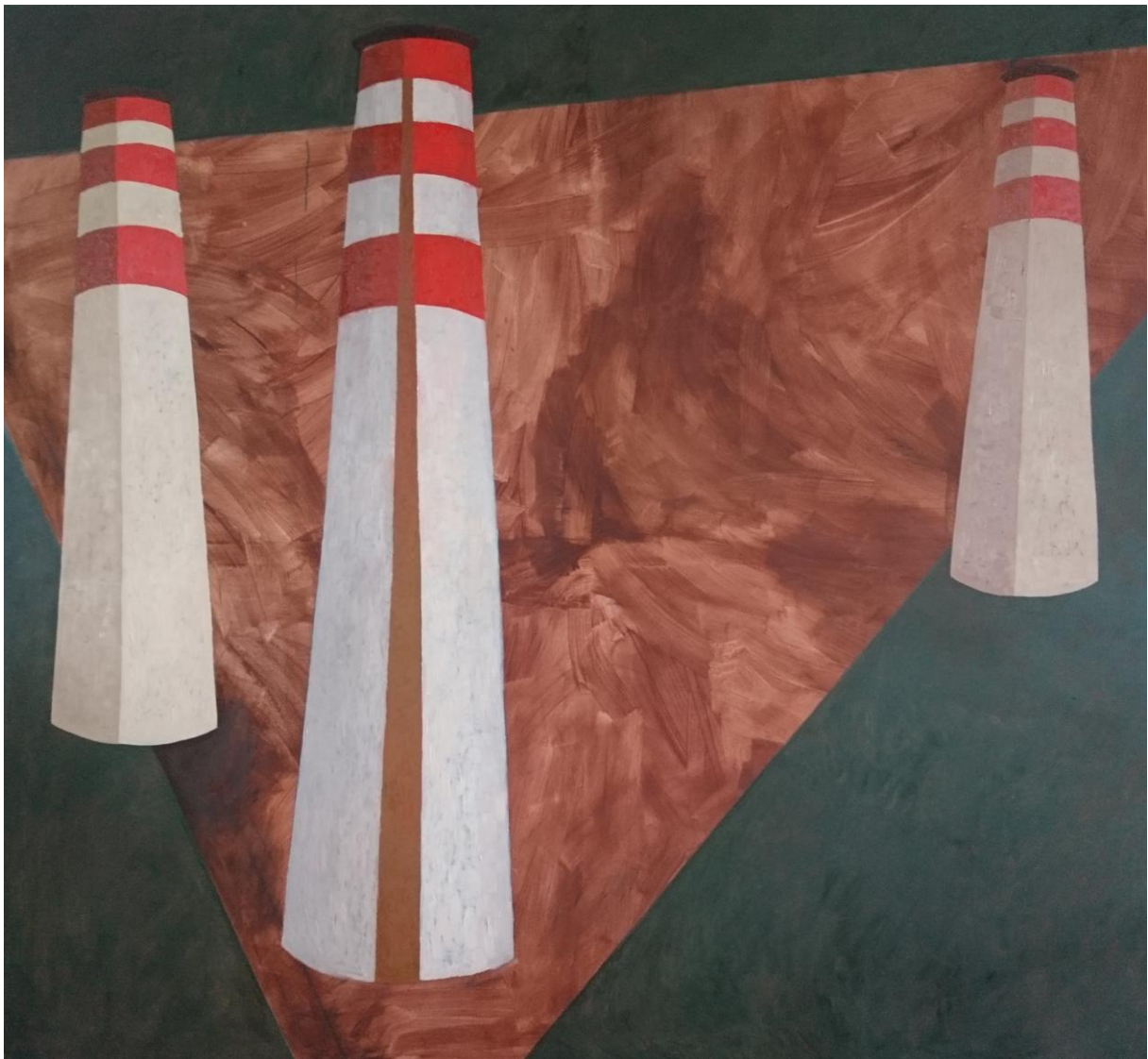
Trojuholník smrti 2, olej na plátne, 200 x 220 cm, 2020