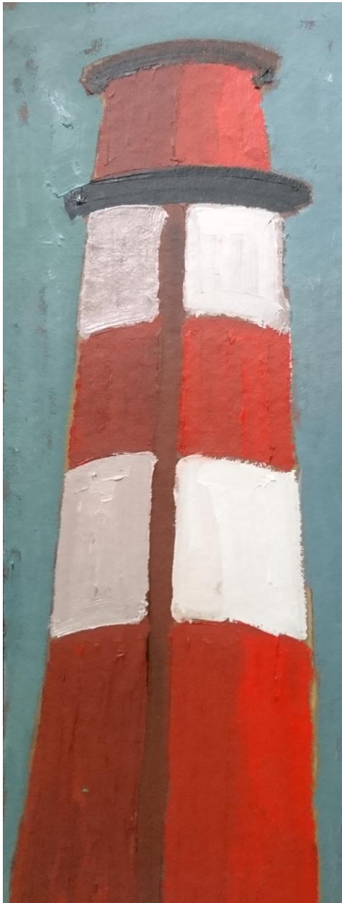
Komín-mini , 37 x 15 cm, olej na sololite, 2020