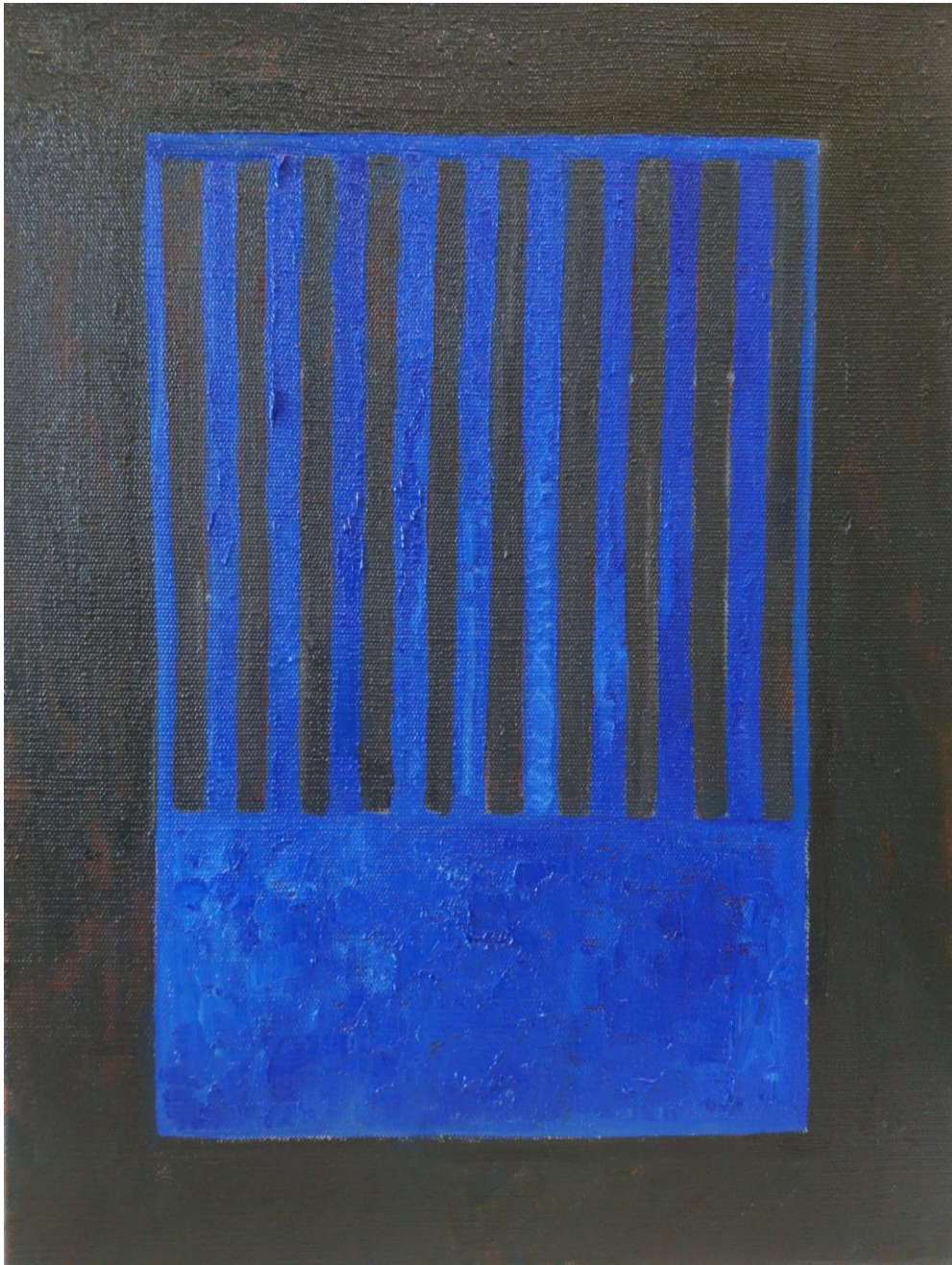
Brána 2 , olej na plátne, 40 x 30 cm, 2020