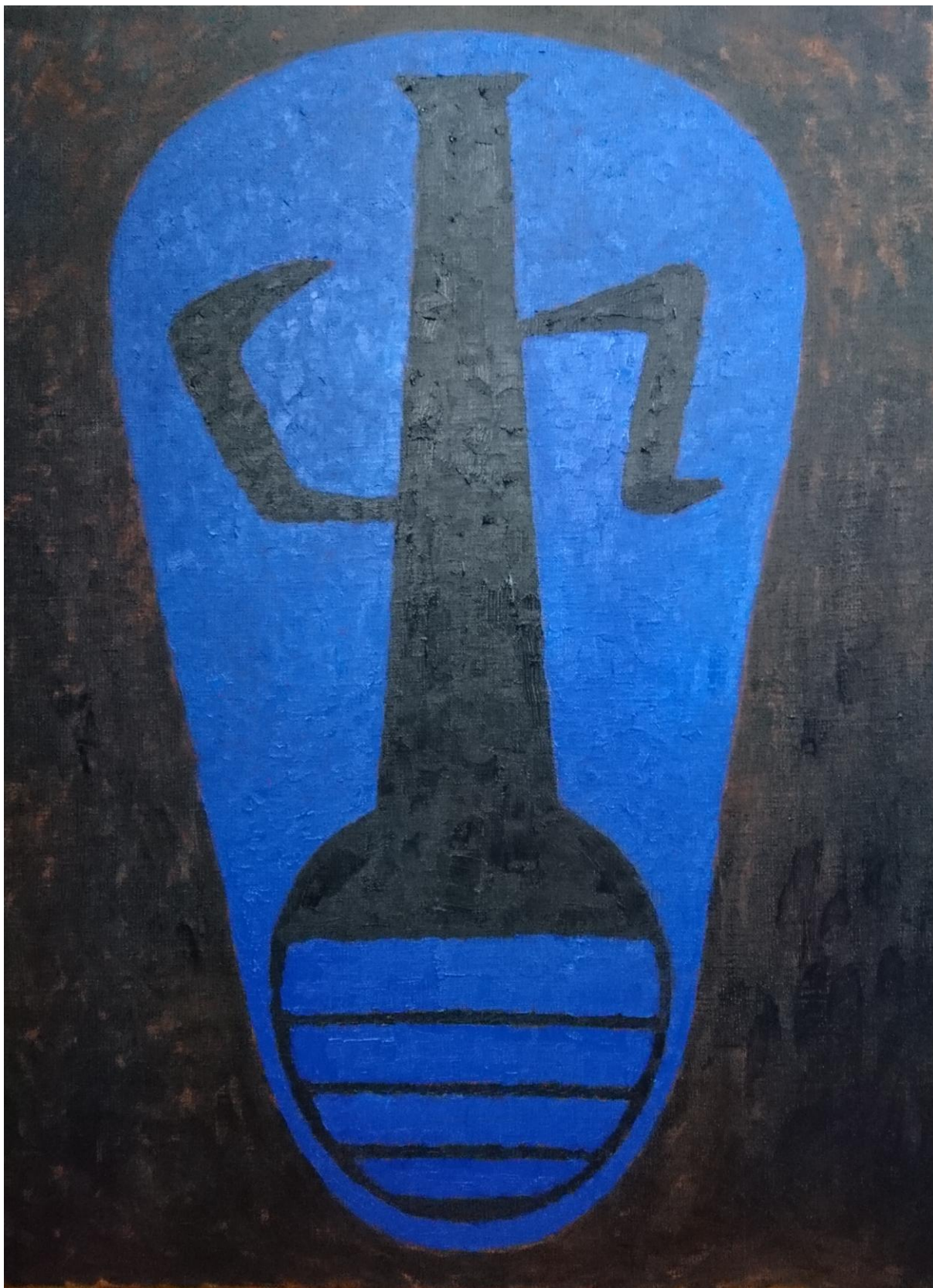
Logo, olej na plátne, 80 x 60 cm, 2020