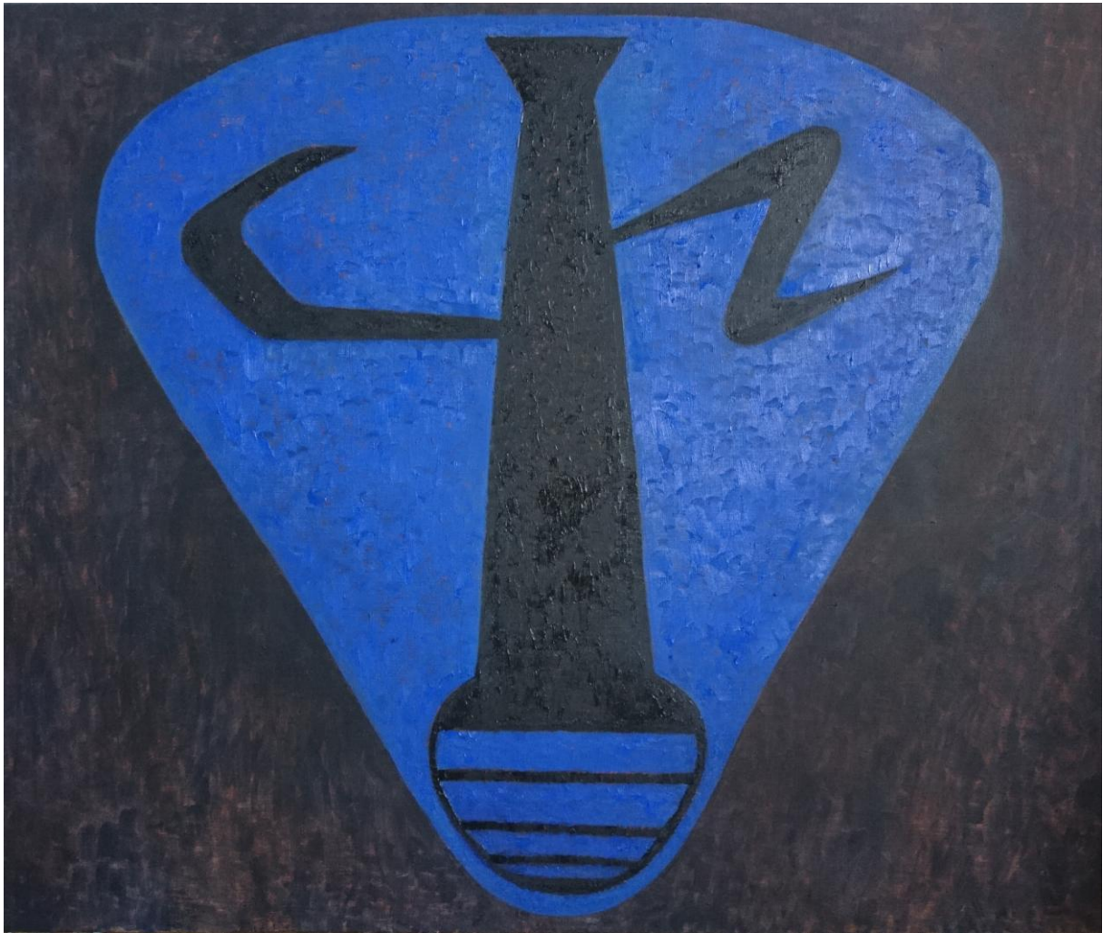
Logo 3, olej na plátne, 100 x 120 cm, 2020