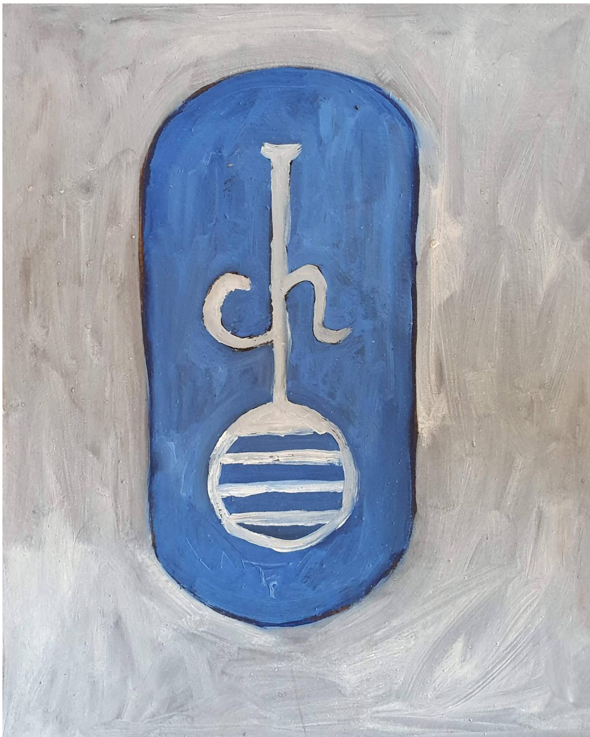
Logo Chemko, olej na sololite, 30 x 25 cm, 2020