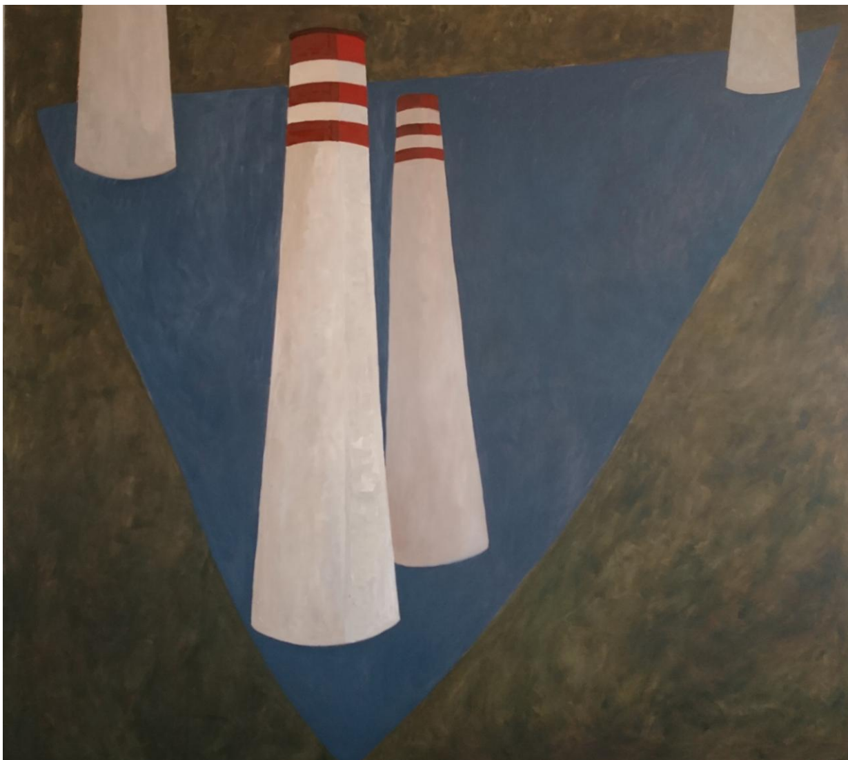
Trojuholník smrti, 200 x 220 cm, olej na plátne, 2020