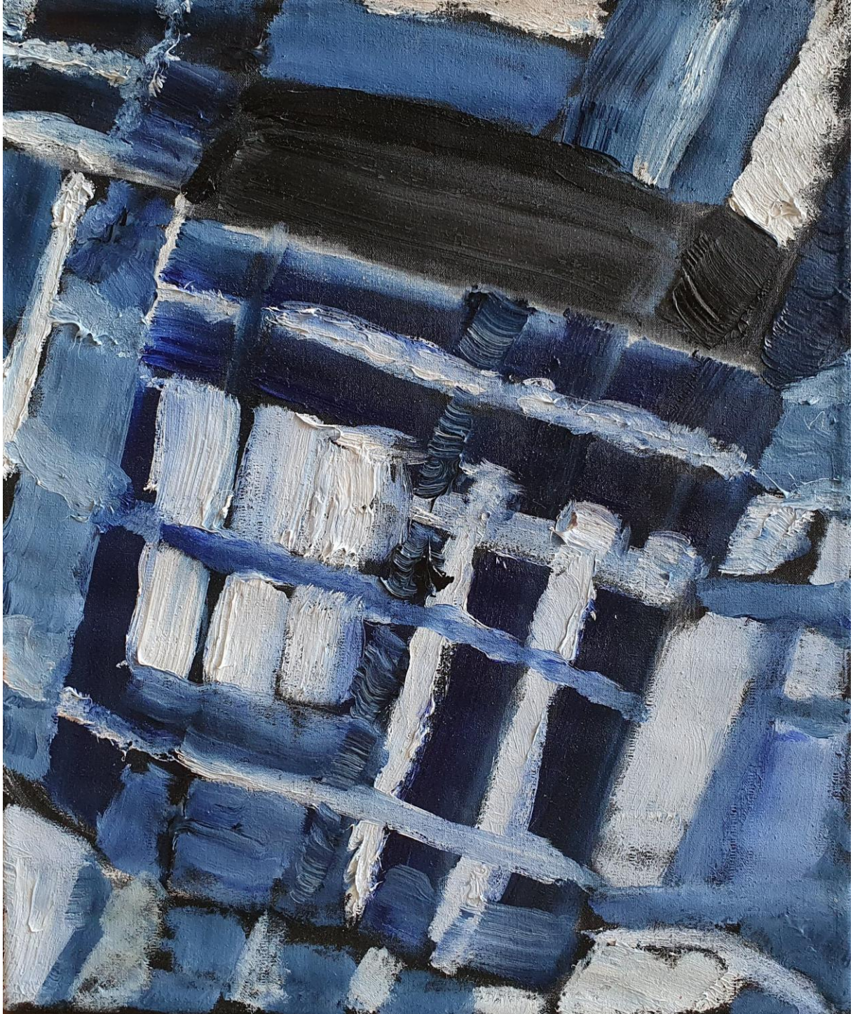
Vrecko , olej na plátne, 30 x 25 cm, 2019