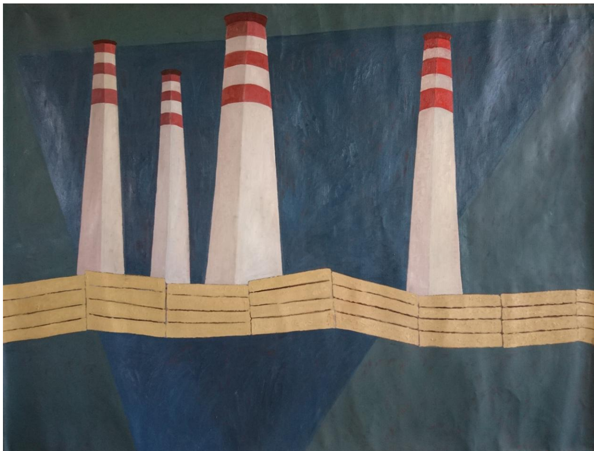
Plot, olej na plátne, 100 x 120 cm, 2020