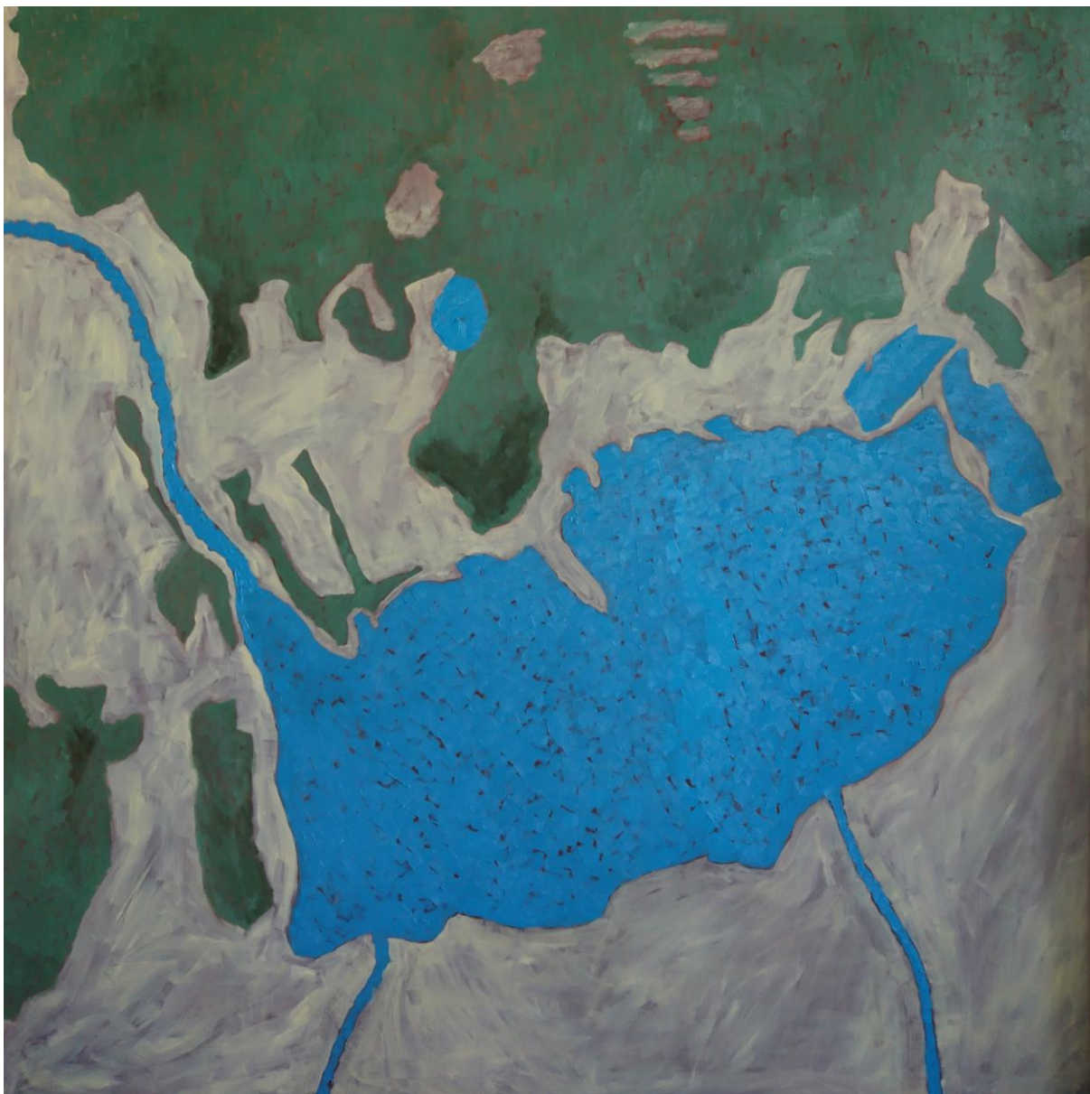
Zemlínka Širava , olej na plátne, 150 x 150 cm, 2020