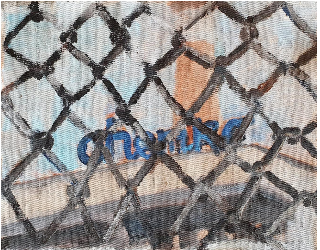
Chemko - skica, olej na plátne, 25 x 35 cm, 2020