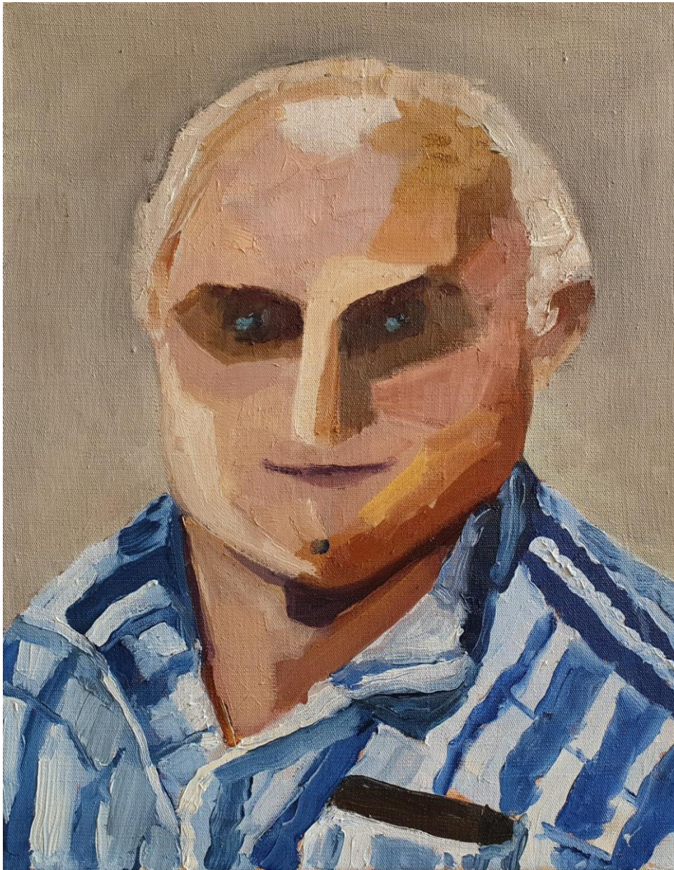
Portrét, olej na plátne, 50 x 40 cm, 2019