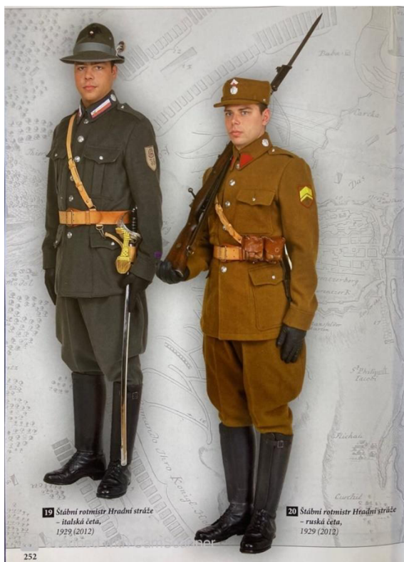
Obrázek 1 - Uniforma italské a ruské čety Hradní stráže 35

Uniforma vzor 1908 byla v roce 1912 modifikována, mužstvo obdrželo polní čepice képi. Později však vojáci obdrželi klobouk alpinů, byly také upraveny kapsy na blůzách. Distinkce byly ve formě kosých prýmků nad manžetami, v barvě černé, zhotovené z hedvábí. Tento stejnokroj byl užíván od roku 1929 3. četou Hradní stráže. Na klobouku a límci zůstal původní odznak, u důstojníků zlatý a u poddůstojníků a mužstva stříbrný. Distinkce byly vyhotovené ve fialovém provedení u mužstva, stříbrné pro rotmistry a zlatisté pro důstojnický sbor. 34