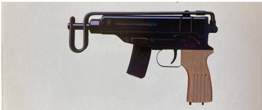
Obrázek 11 – Samopal vzor 61 81

Tento samopal vynikal především svojí hmotností a kompaktností. Vážil 1,4 kilogramu a dlouhý byl 170 mm. Zbraň byla konstruována v ráži 7,65 mm Browning a byl dodáván se zásobníky na 10 nebo 20 ran. Samopal vzor 61 má dynamický závěr a střílí z uzavřeného závěru. Díky těmto vlastnostem se samopal řadil k velice přesným zbraním. Další, na první pohled viditelnou vlastností samopalu, byla sklopná pažba, díky které samopal dostal název Škorpion. V ozbrojených složkách byl užíván jako jakýsi mezistupeň mezi pistolí a puškou a byl zařazen ve výzbroji až do doby, kdy jej nahradil jeho novější model Škorpion EVO 3. 80