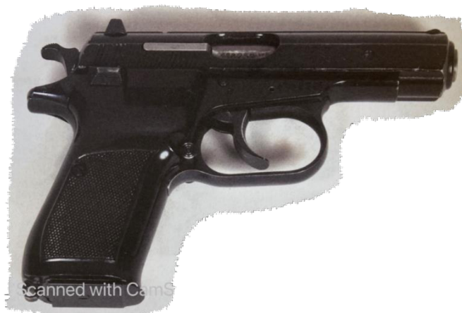
Obrázek 12 – Pistole vzor 82 83

V roce 1982 byla do výzbroje československých ozbrojených složek zavedena pistole vzor 82. Tato pistole byla vytvořena, aby nahradila zastaralé pistole vzor 52. Jedním z hlavních důvodů potřeby modernizace byla nedostačující ráže. Požadována byla ráže 9 mm, unifikovaná ráže armád států varšavské smlouvy. Dále byla požadována delší životnost pistole, možnost ovládní střelcem s dominantní pravou i levou rukou a jednoduchá obsluha a údržba pro vojenské podmínky. Zbraň je určena pro střelbu do 50 metrů a je určena hlavně k obraně střelce nebo k napadení nepřítele. Hlaveň této pistole je k rámu zbraně přidělena kolíkem, tudíž se jedná o pistol s pevnou hlavní. Takticko-technická data pistole udávají, že pistole váží 800 gramů a kapacita zásobníku je 12 nábojů 9 mm Makarov. Celková délka pistole je 172 mm. Tato zbraň byla efektivní především svými rozměry a bojovou schopností, jelikož v zásobníku měla o 4 náboje více, než její předchůdce. Ozbrojené složky tuto pistol užívali až do moderní doby, kdy byla nahrazena pistolí CZ 75 SP-01 Phantom v Armádě České republiky a Hradní stráži (Lauber et al. 2007). 82