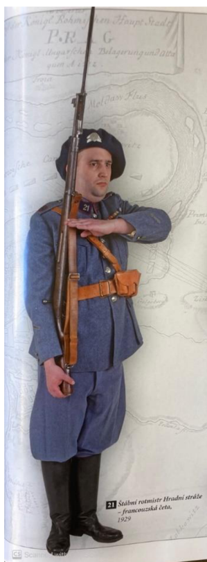
Obrázek 2 – Uniforma vojáků italské čety Hradní stráže 37