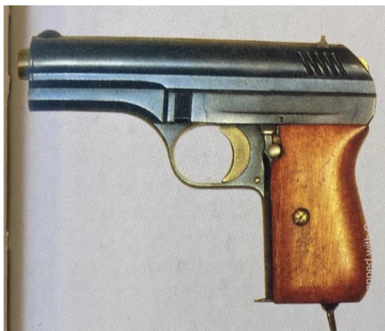
Obrázek 7 – Pistole vzor 24 65

Stejně jako většina vojenských útvarů československé armády, tak i Hradní stráž obdržela tyto pušky. Výzbroj Hradní stráže se od třicátých let dvacátého století nijak nelišila od výzbroje československé branné moci. Dle dokumentu VKPR čj. 249/1928 z 5. října 1928 je znát snaha o unifikaci výzbroje ČSL branné moci, která zapříčinila to, že Hradní stráž pro výkon strážní a obranné služby obdržela dvě stě pušek vzor 24, sto padesát pistolí vzor 24 a dvě osvětlovací pistole. Pro potřebu komplexní obrany Hradní stráž také obdržela sedm lehkých kulometů vzor 26 a tři těžké kulometry vzor 24. Tato výzbroj byla používána Hradní stráží až do nacistické okupace Československa. 66