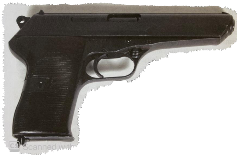
Obrázek 9 – Pistole vzor 52 71

Zbraň dále disponuje automatickou i mechanickou pojistkou při zvýšení bezpečnosti zbraně. U pistole je jednočinné spoušťové ústrojí a osmiranný zásobník má po stranách 4 kontrolní otvory. Zbraň sloužila především k obraně střelce nebo k napadení protivníka. S touto zbraní se dalo efektivně střílet do 50 metrů. 70