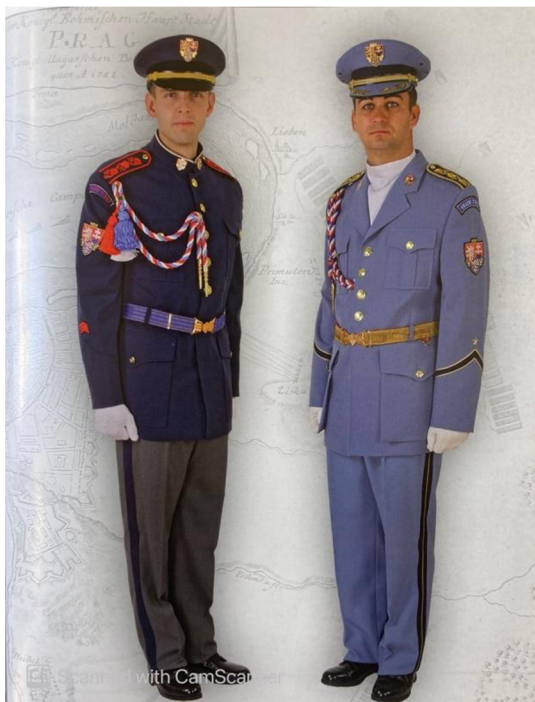
Obrázek 4 – Audienční uniforma Hradní stráže 50

Vycházkový stejnokroj ke každodennímu užití je předepsán ve zjednodušeném oproti audienční uniformě. Je to modrá blůza s otevřeným límcem, ke které se nosí košile s kravatou. Látkový opasek ve stejné barvě jako kalhoty a čepice. Uniforma je dále zdobena erbem Hradní stráže na čepici a límci. Hodnostní označení je na rozdíl od audienční uniformy na náramenících, nikoliv na předloktí. Vycházkový stejnokroj má dvě varianty, zimní a letní. Zimní je v tmavomodrém provedení a letní uniforma je v barvě světlemodré. 51