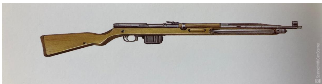
Obrázek 8 – Puška vzor 52/57 68

ohledech. Jedinou nevýhodou pušky byla její hmotnost, vážila 4,1 kilogramu bez munice. Tato zbraň je charakteristická svým sklopným bodákem, který je umístěn z boku zbraně ve vybrání předpažbí. Délka zbraně je 1003 mm a nábojová schránka disponuje kapacitou pro 10 nábojů. Z této zbraně se dalo efektivně střílet do 400 m. Nicméně tato zbraň v československých ozbrojených složkách nevydržela dlouho, o pár let později ji totiž nahradila útočná puška samopal vzor 58. Nicméně u Hradní stráže je užívána dodnes v niklovém provedení pro reprezentační účely. 67