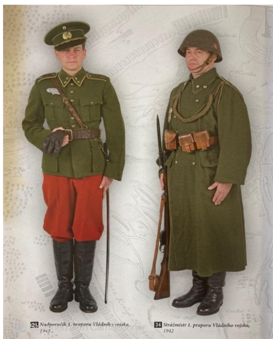
Obrázek 3 – Uniforma příslušníků vládního vojska 42

K uniformě byly dále přidělovány různé odznaky, které značili podřízenost k Německu. Čestné odznaky a střelecké odznaky, které se lišili u vojáků, podle toho, jaký si kdo zasloužil. Stejnokroj vládního vojska se ve své celkové úpravě velice podobal stejnokroji, který užívala československá armáda před válkou. 41