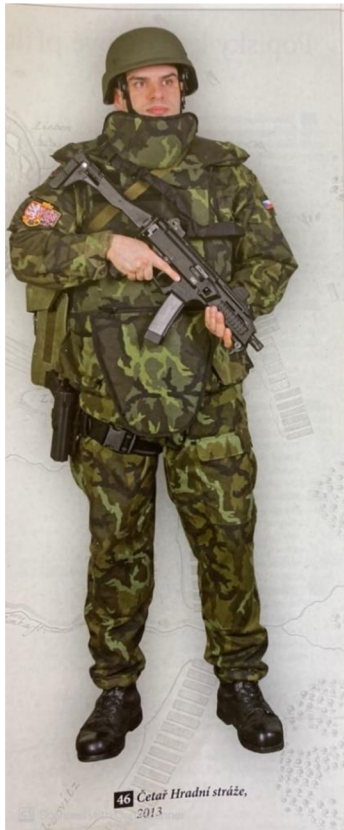
Obrázek 5 – Voják Hradní stráže v uniformě vzor 95 56

Vojáci Hradní stráže se v době výcviku také věnují taktickým a střeleckým dovednostem. K tomuto výcviku užívají k uniformě také prvky balistické ochrany jako je balistická vesta a přilba. 55