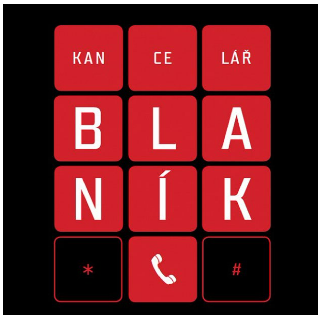
Příloha 3 Kancelář Blaník – logo seriálu (Kancelář Blaník, ČSFD, 2018)