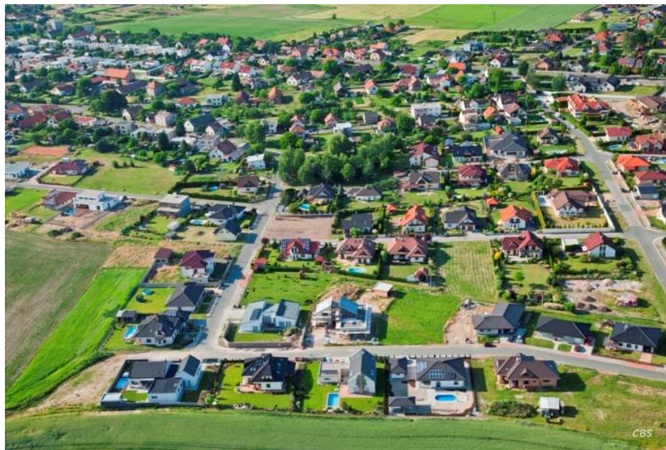
Tabulka 1 – Obec Srch – letecký pohled