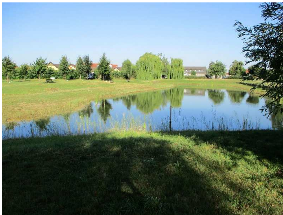
Tabulka 4 – Intravilán obce – východní část