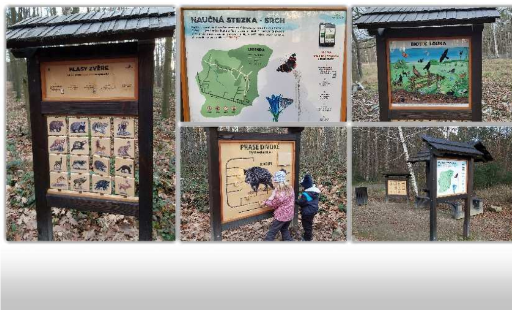
Tabulka 6 – Naučná stezka Srch