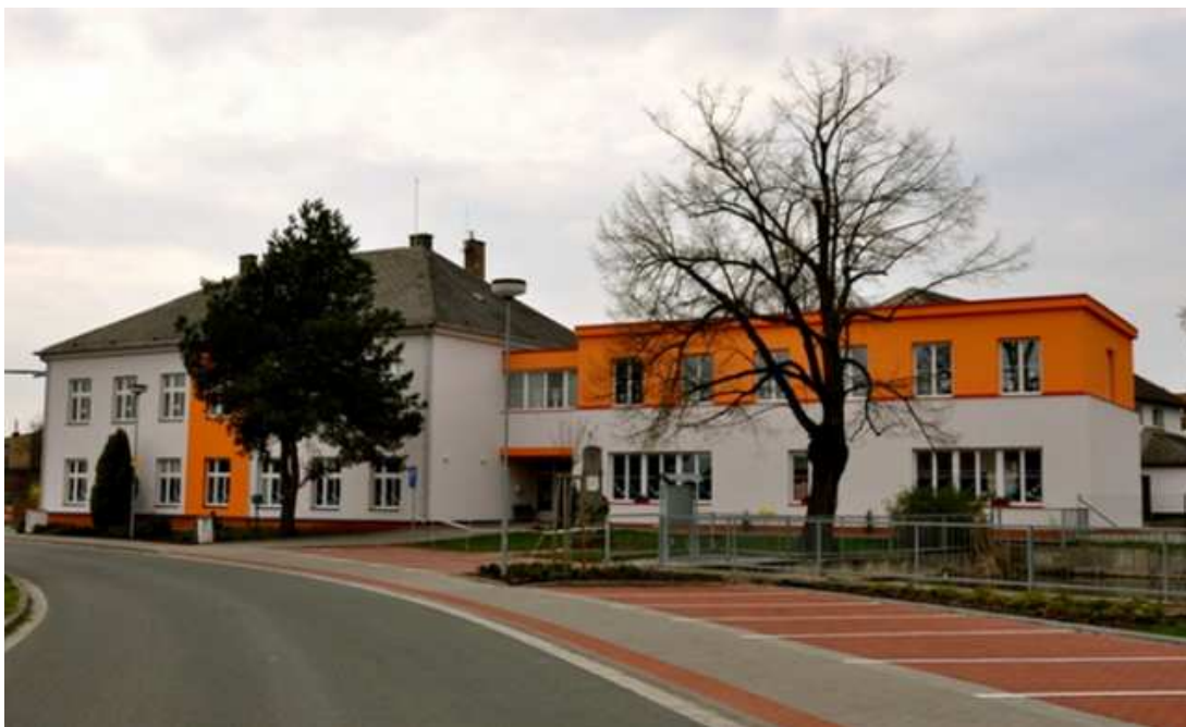
Tabulka 3 – Základní a mateřská škola s tělocvičnou (po rekonstrukci)