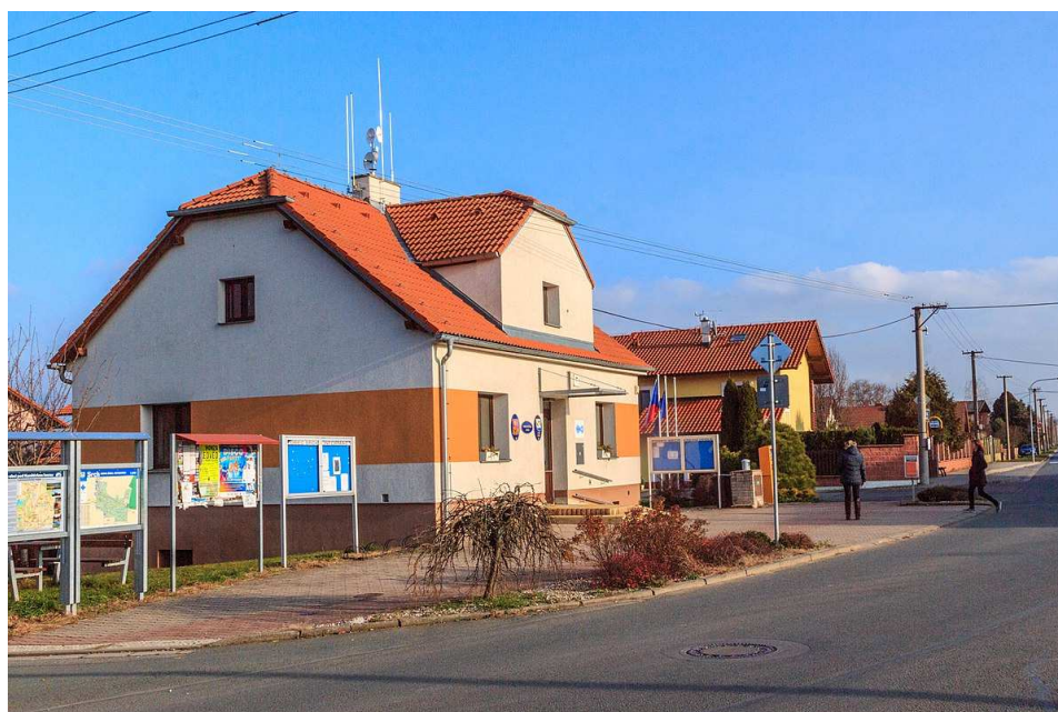
Tabulka 2 – Obecní úřad

Zdroj: Obec Srch. OBEC SRCH [online]. [cit. 2021-08-31]. Dostupné z: www.obecsrch.cz