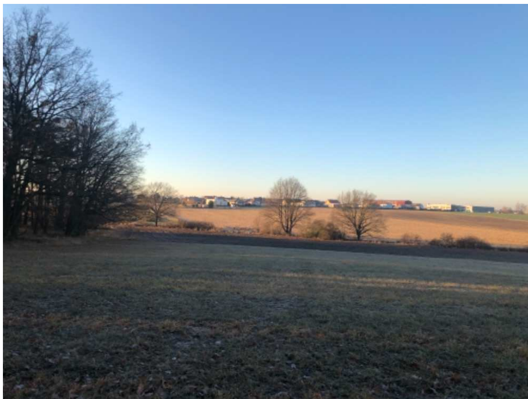
Tabulka 5 – Pohled na obec od lesa