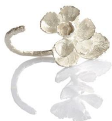
Obr 4. Crassula ring [17]