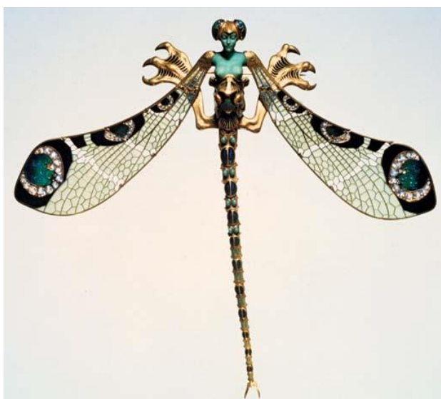
Obr. 1. Vážka [15]

Vytvářel pestrou škálu šperků. Vážka, jeden z fantazijních kusů, je ozdobou ve tvaru vážky, avšak v horní polovině se její tělo mění v tělo ženy. Žena má zelenou barvu pokožky a na hlavě má přilbu ve tvaru vážčích očí. Místo rukou má pestrobarevná křídla a místo jemných hmyzích nožek velké drápy, připomínající spíše ještěra.[9]