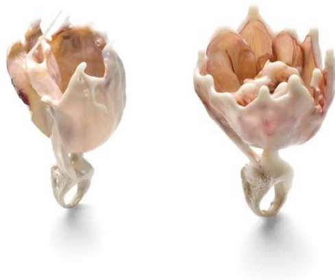
Obr. 6. Tulip ring [19]

Šperkařka narozená v Bosně a Hercegovině. Má za sebou studia v Itálii, Švédsku či Dánsku. Zhotovila kolekci prstenů, k jejíž výrobě jí posloužily květy hyacintů, tulipánů a orchidejí.