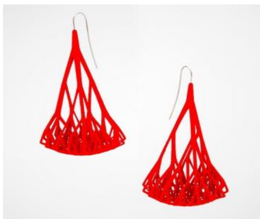
Obr. 5. Trees Červené [18]