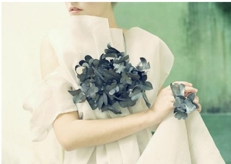
Obr. 3 Květy zla [15]