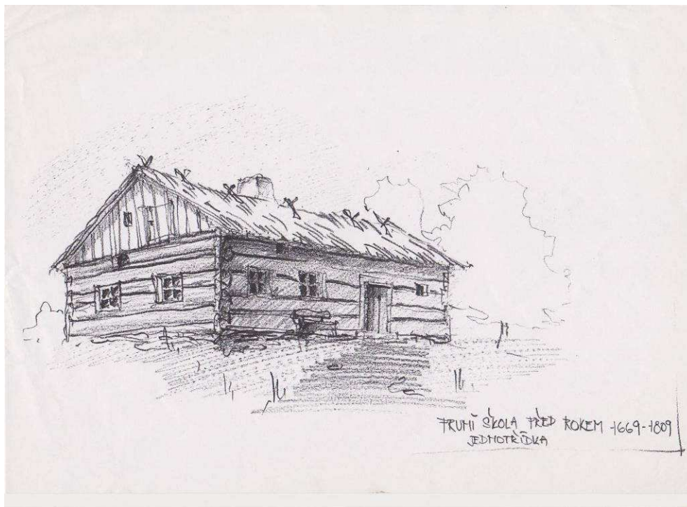
Foto č. 1: podoba první školy po roce 1669.

Fotodokumentace školních budov, č. 1 až 7.