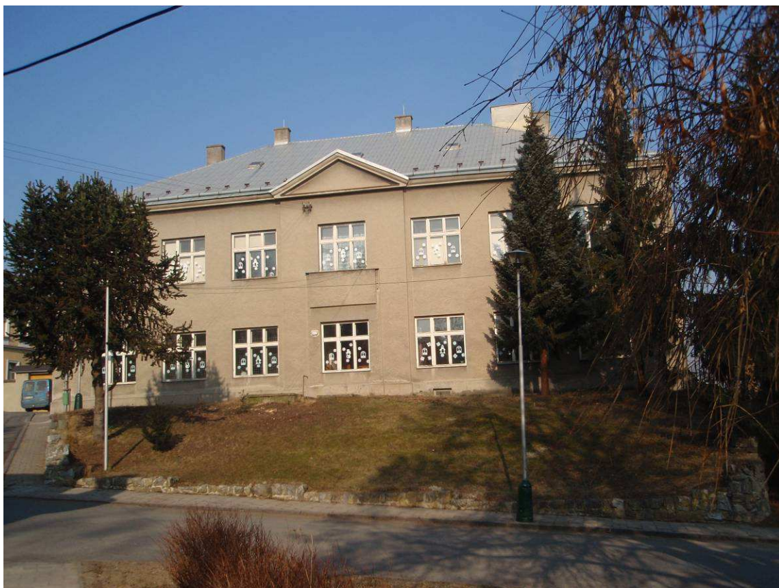
Foto č. 3: současná podoba školy z roku 1879. Dnes budova 1. stupně základní školy, s. 45. Foto: Josef Linek, 28. ledna 2012.