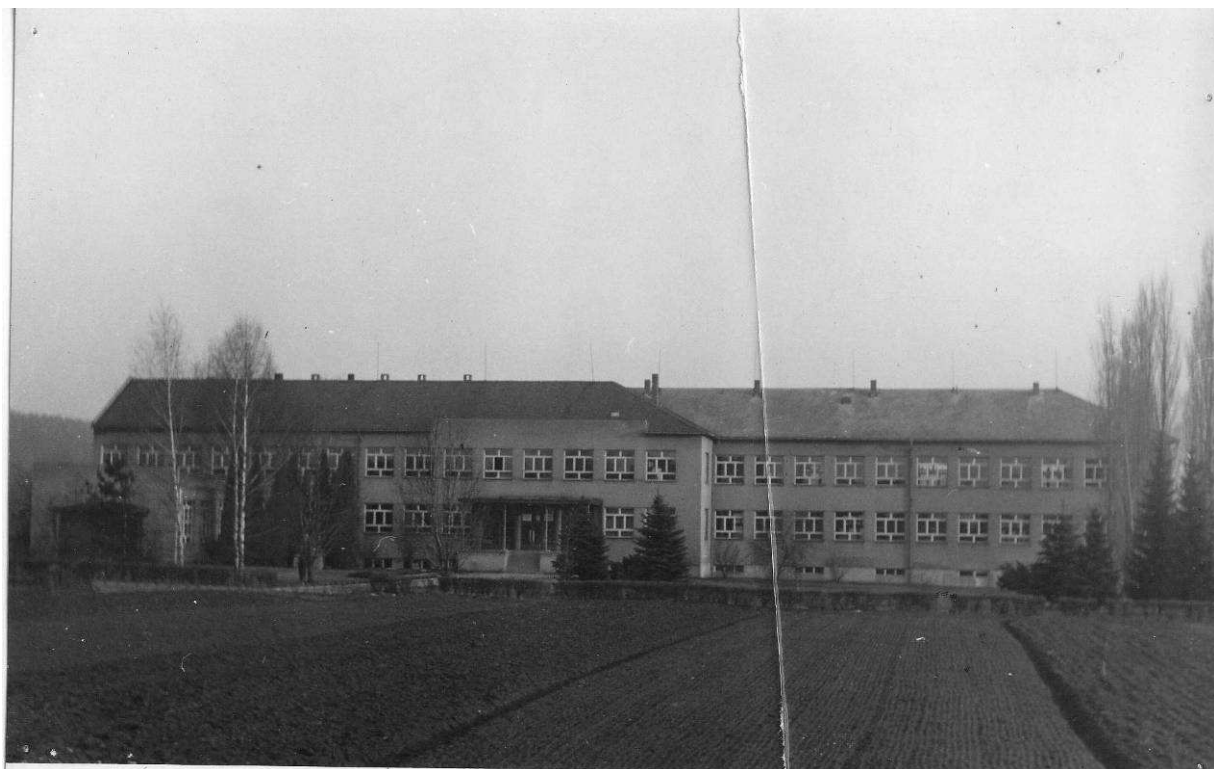
Foto č. 5: podoba nové školní budovy po roce 1950.