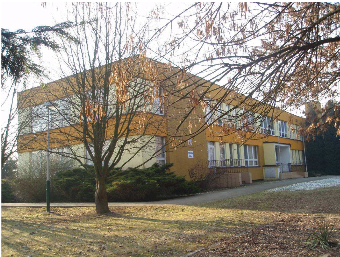
Foto č. 7: současná podoba budovy Mateřské školy ve Velkém Týnci z roku 1981, s. 39. Foto: Josef Linek, 2. února 2012.