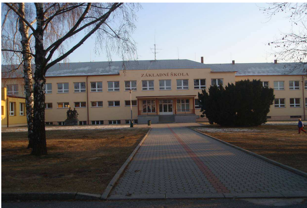
Foto č. 6: současná podoba školy z roku 1950. Dnes budova 2. stupně základní školy, s. 35. Foto: Josef Linek, 2. února 2012.