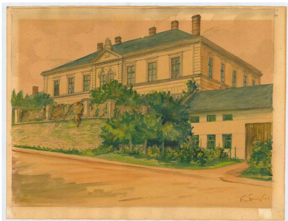
Foto č. 2: podoba školy po roce 1879.