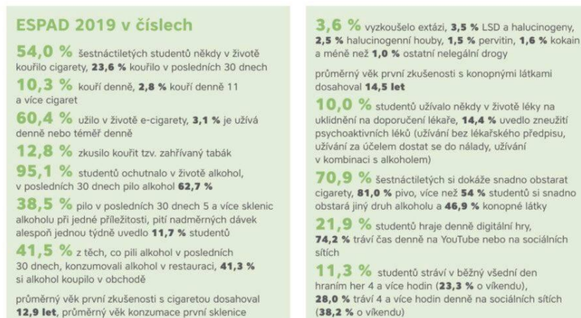
Obr. 3: ESPAD 2019 v číslech (Pedagogické info - Čeští teenageri užívají návykové látky stále méně, ukazují výsledky české části mezinárodní studie ESPAD)

Na rizikovém chování při užívání návykových látek se podílí několik negativních faktorů. Při formulování rizikových faktorů je důležitá účinná intervence, může dojít k zabránění negativních dopadů na jedince, při kterých dochází k ovlivňování rozvoje osobnosti a uplatnění mladistvých v životě. Abstinence od drog je zdržení se, ale i vzdání se nějaké návykové látky, která vyvolává požitek. Experimentální užití drog je jednorázová zkušenost. Rekreační užívání je příležitostné užívání návykových látek. Jedná se zejména o životní styl mladých lidí, na který nepůsobí zdravotní, sociální a psychické problémy. 54