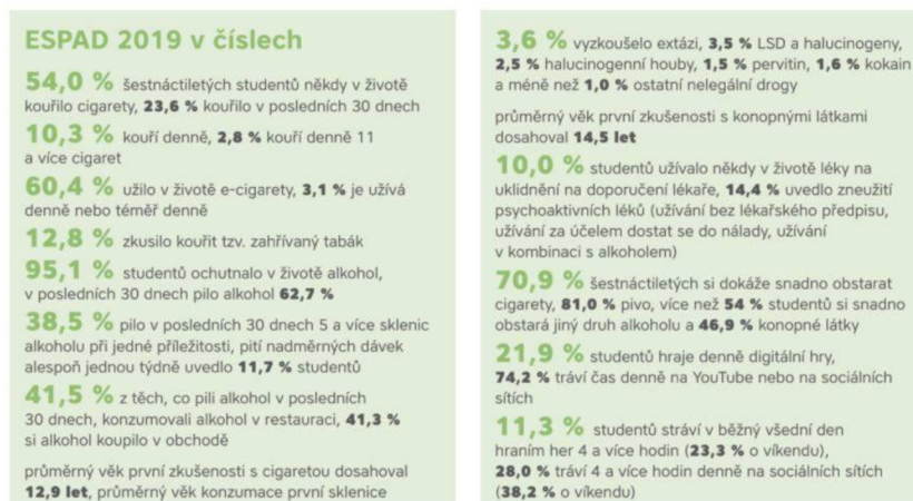
Obr. 3: ESPAD 2019 v číslech (Pedagogické info - Čeští teenageři užívají návykové látky stále méně, ukazují výsledky české části mezinárodní studie ESPAD)

Na rizikovém chování při užívání návykových látek se podílí několik negativních faktorů. Při formulování rizikových faktorů je důležitá účinná intervence, může dojít k zabránění negativních dopadů na jedince, při kterých dochází k ovlivňování rozvoje osobnosti a uplatnění mladistvých v životě. Abstinence od drog je zdržení se, ale i vzdání se nějaké návykové látky, která vyvolává požitek. Experimentální užití drog je jednorázová zkušenost. Rekreační užívání je příležitostné užívání návykových látek. Jedná se zejména o životní styl mladých lidí, na který nepůsobí zdravotní, sociální a psychické problémy. 54