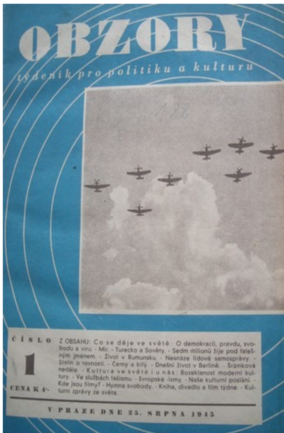
Příloha č. 3: titulní strana 1. čísla týdeníku Obzory