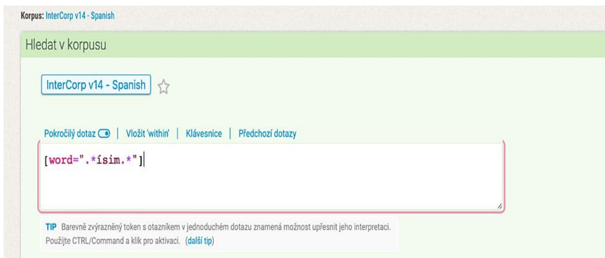
Obrázek č. 1: Zadání pokročilého dotazu [word=".*ísim.*"]

Prvním úkolem korpusové analýzy bude zjistit, jaké superlativy absolutní jsou ty nejčastější. Nejdříve bude v KonTextu navolen korpus s názvem InterCorp v14-Spanish a zarovnaný korpus InterCorp v14-Czech . Následně bude zadán pokročilý dotaz ve tvaru [word=".*ísim.*"] (obrázek č. 1) a hledání omezeno pouze na španělské texty přeložené do češtiny pomocí zaškrtnutí kolonky „es“ (obrázek č. 2).