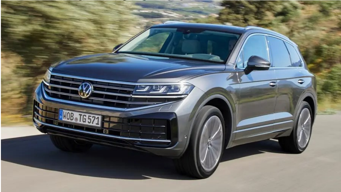
Obrázek 5: Volkswagen Touareg Elegance [23]