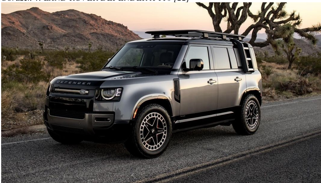
Obrázek 4: LAND ROVER DEFENDER X 110 [22]