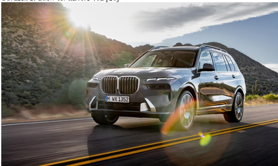
Obrázek 2: BMW X7 xDrive 40d [20]