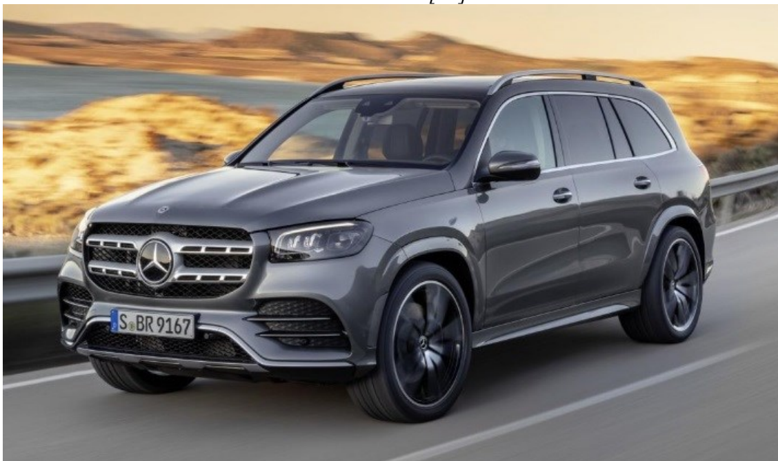
Obrázek 3: Mercedes Benz GLS 450 d 4MATIC [21]