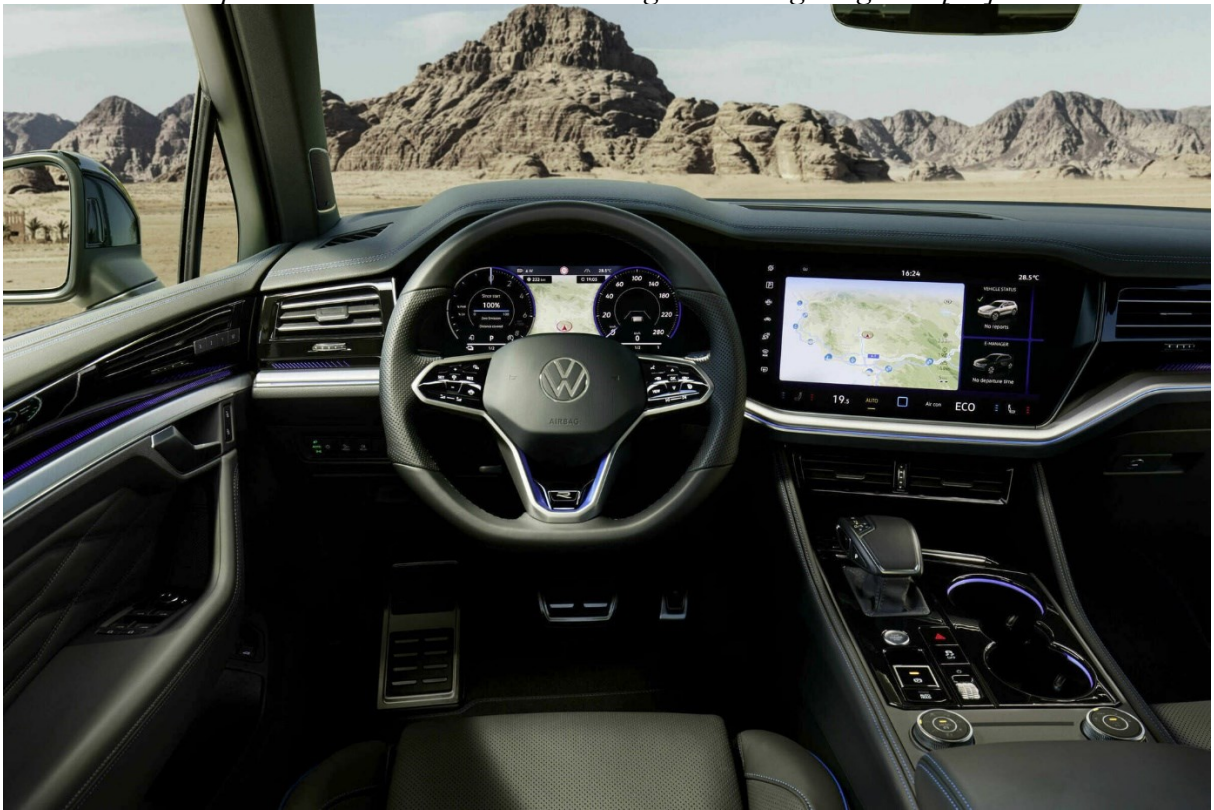
Obrázek 7 - interiér doporučeného automobilu Volkswagen Touareg Elegance [17]