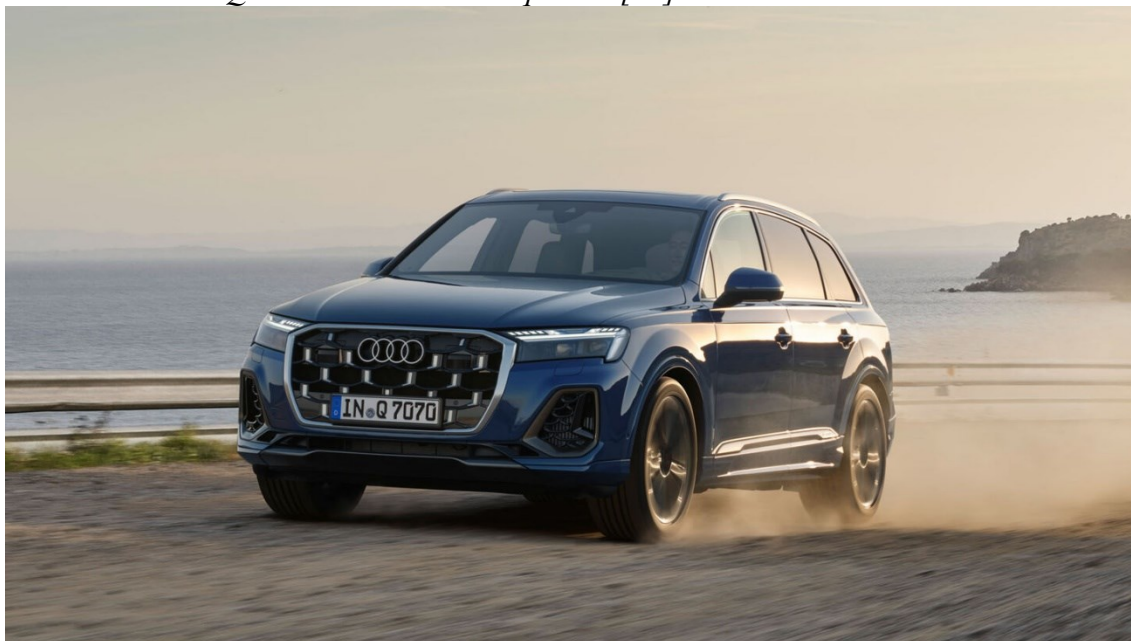
Obrázek 1: Audi Q7 SUV S line 50 TDI quattro [19]