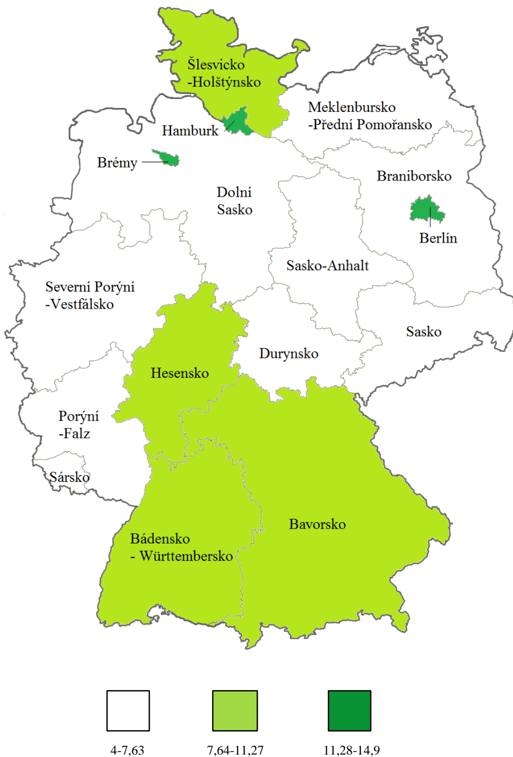
Mapa 4: Volby do Spolkového sněmu v roce 2005 – Volební podpora Bündnis 90/Die Grünen ve spolkových zemích Spolkové republiky Německo (údaje v %)