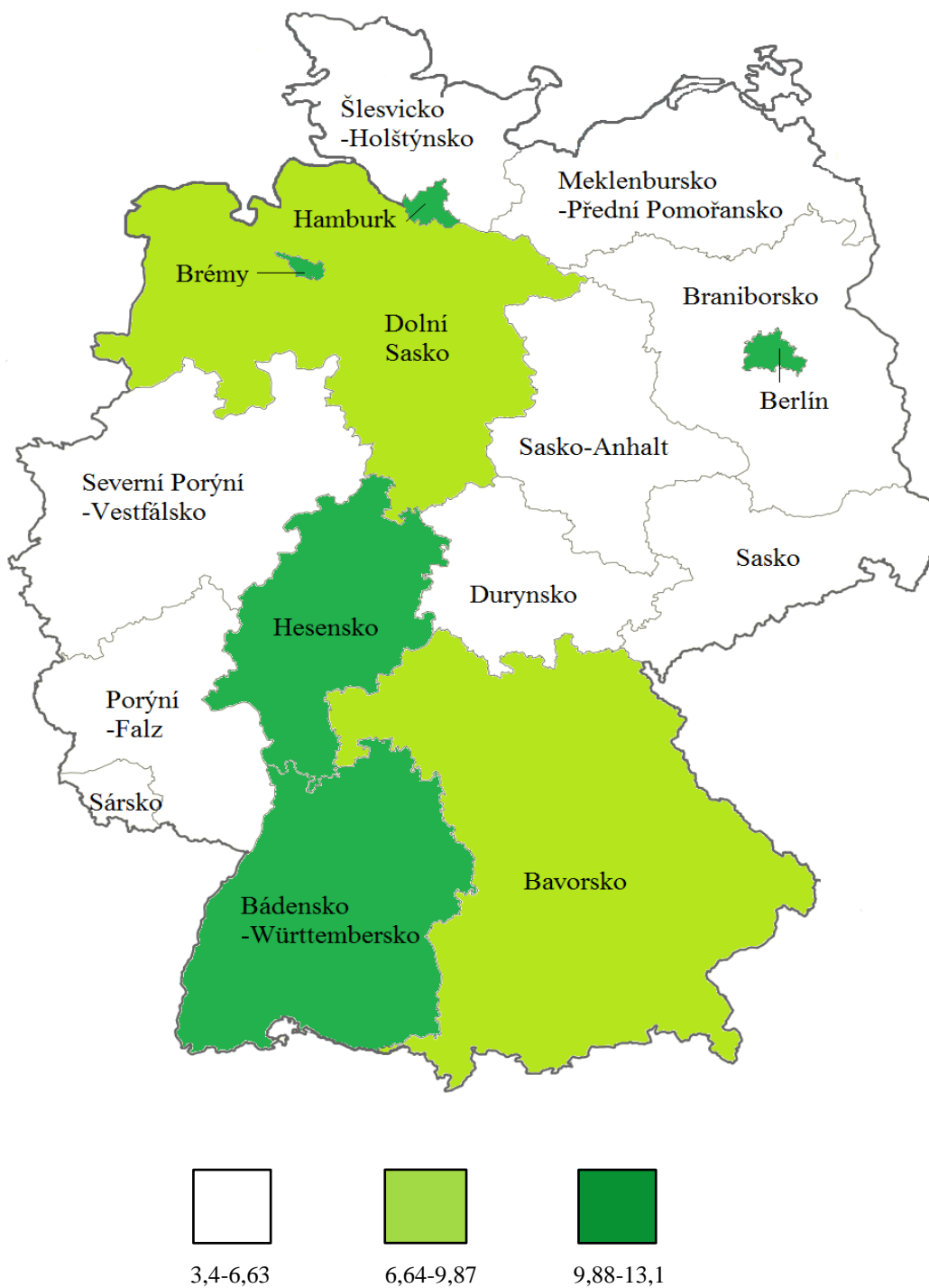
Mapa 3: Volby do zemských sněmů v období 2002 až 2006 – Volební podpora Bündnis 90/Die Grünen ve spolkových zemích Spolkové republiky Německo (údaje v %)