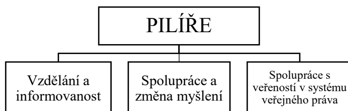
Obrázek 1 Základní pilíře Cochemské praxe (Cirbusová, Brzobohatý, 2019)

Kromě principů Cochemské praxe je tato metoda postavena na třech základních pilířích, které se dle Cirbusové a Brzobohatého (2019, s. 5) vzájemně intenzivně prolínají a tvoří nosnou konstrukci Cochemského modelu (viz Obrázek 1).