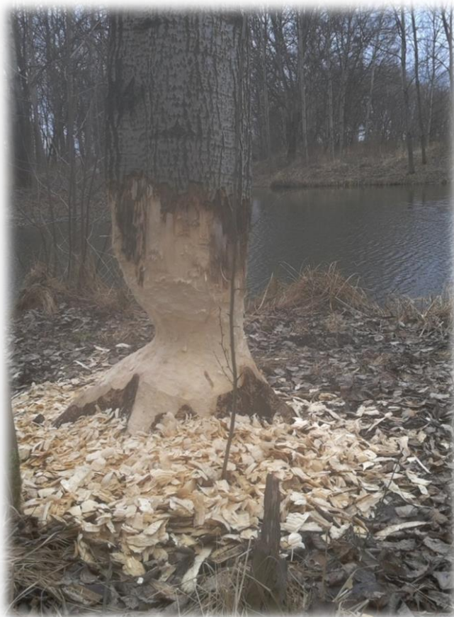
Obr. 4: Spadlý strom příčinou bobra