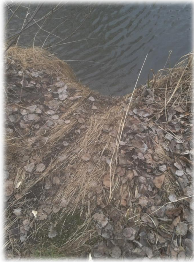
Obr. 2: Bobří příbytek