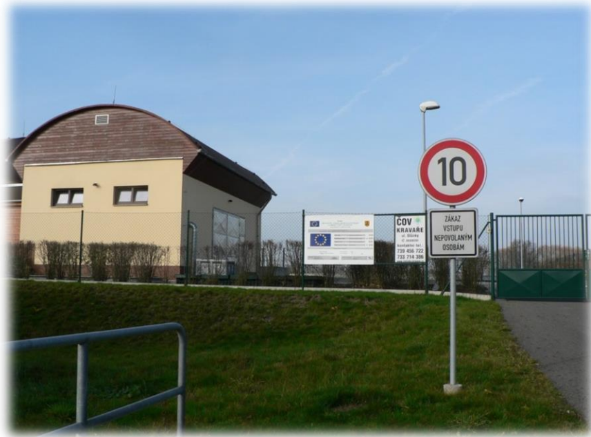
Obr. 20: Tabule s informačním QR kódem