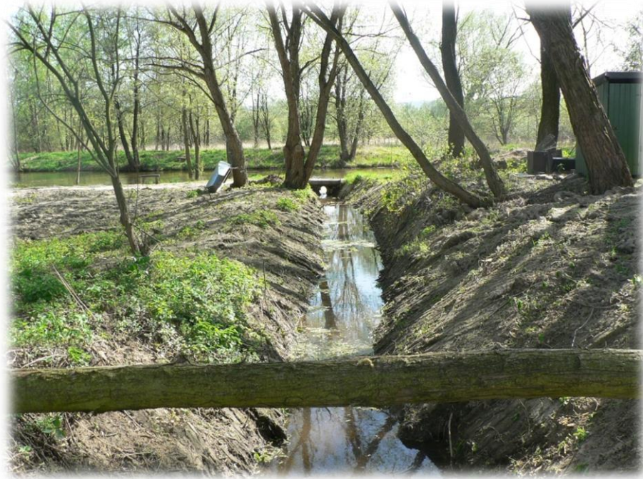
Obr. 12: Lávka přes jezero Olšinky