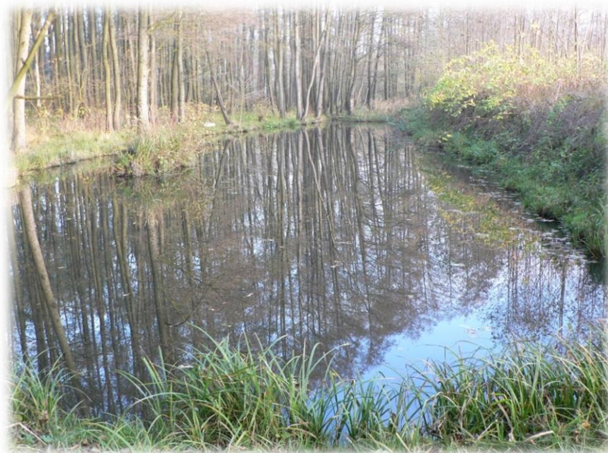
Obr. 14: Lužní les