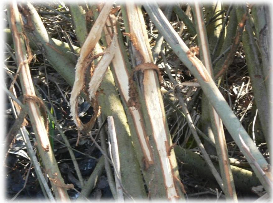
Obr. 6: Strom poškozený bobrem