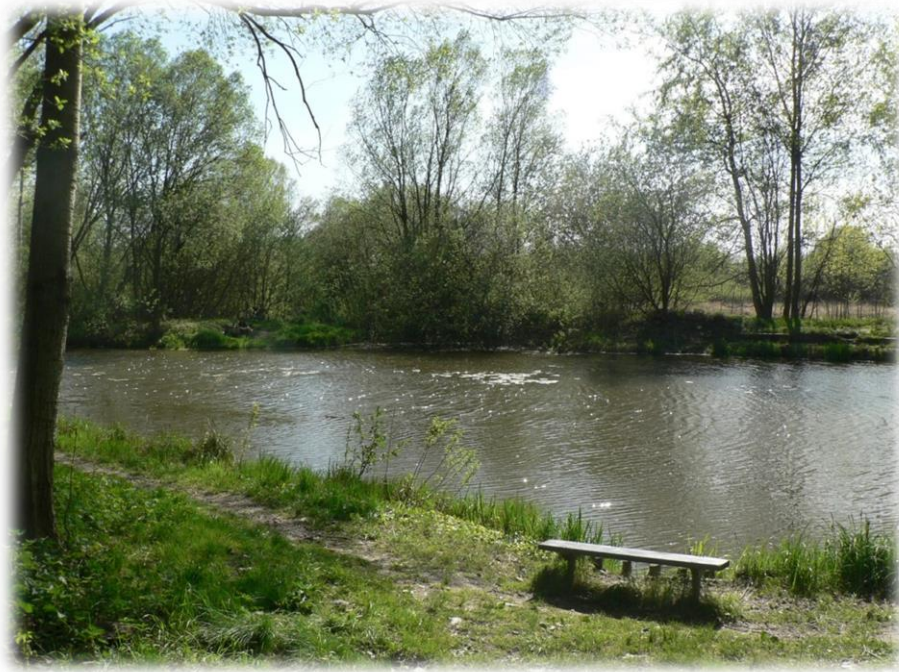
Obr. 10: Jezero Olšinky s nechvalně známým zeleným povlakem