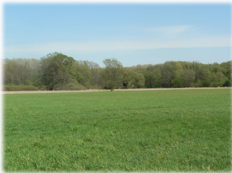
Obr. 8: Louka na nivních půdách