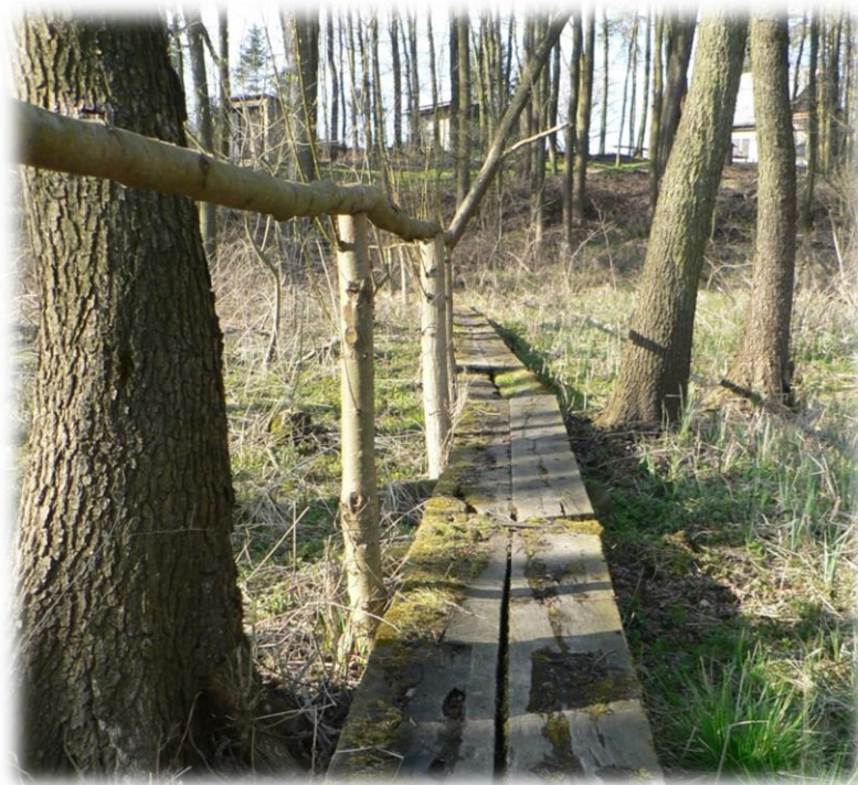
Obr. 16: Mokřadní olšiny