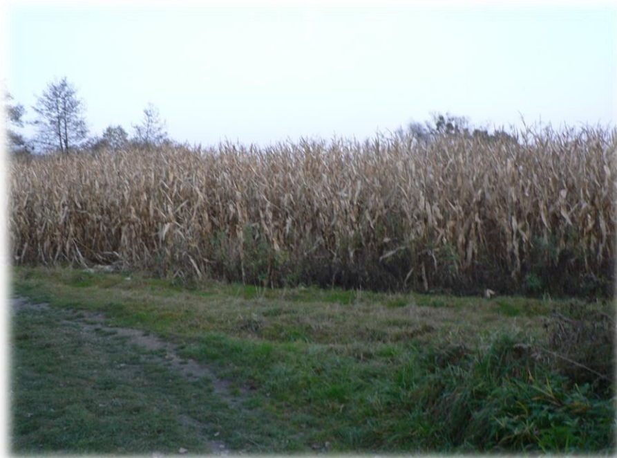
Obr. 18: Vegetace vysokých ostřic