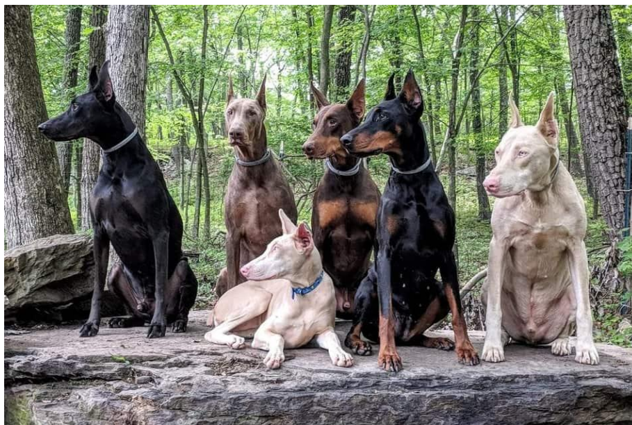
Obrázek 11: Veškeré barevné variace dobrmanů

Toto plemeno je velice inteligentní, temperamentní a vytrvalé, dobrmani vyžadují častý kontakt s člověkem, neradi snášejí samotu. Díky jeho srsti, velice dobře snášejí vysoké teploty, jeho srst není ani tak náročná na údržbu (stejně jako RTW) na rozdíl od NO. Nevýhoda jeho krátké srsti se projevuje v zimním období, kdy majitelé musí být více opatrní aby jim pes nenachladl. Dobrmán má přirozeně uši dolů a dlouhý ocas, dříve však podstupovali kupírování obou částí těla, a měli uši nahoru a krátké ocasy. Stejně jako v případě RTW, je kupírování v určitých zemích zakázáno a proto dobrmany můžete nyní vidět na území ČR spíše v jejich přirozené podobě. (Cunliffeová, J.,2012)