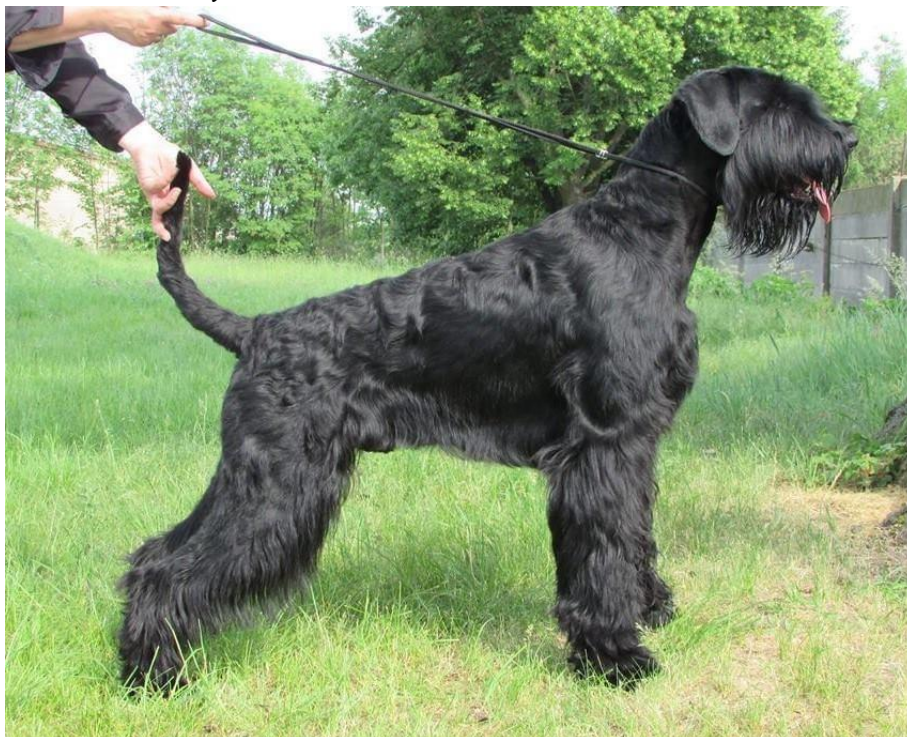
Obrázek 12: Knírač Velký – celočerné zbarvení