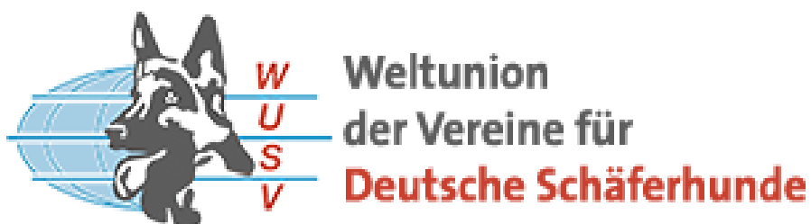
Obrázek 18: Znak světové organizace zaštiťující plemeno německý ovčák – WUSV