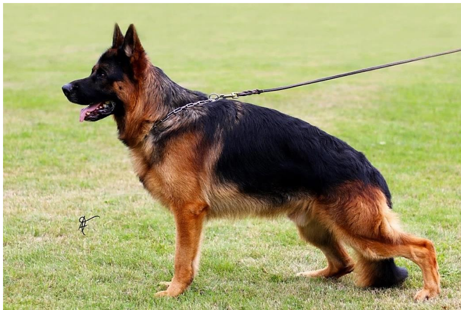
Obrázek 1: Exteriérová linie NO

Německý ovčák má dvě linie: exteriérovou nebo-li výstavní a pracovní linii. Rozdíl na první pohled je zde velice jednoduše viditelný, jelikož se tyto linie odlišují zejména barevně a samozřejmě extrémně povahově. Výstavní linii si můžete představit jako známého „Komisaře Rexe“, hnědé až zlatavé zbarvení s černými znaky na hřbetě, hlavě apod. Pracovní linie má tři možnosti zbarvení: vlkošedá, celočerná a znakatá (celočerná barva s hnědými znaky pouze na nohách a lehce na hlavě). Obě linie mohou mít dlouhosrsté jedince, dříve tito jedinci byli vyřazeni z chovu, dlouhá srst byla považována za něco špatného, co zhoršuje povahu jedince, ale není to vůbec pravda a už několik let je i dlouhá srst u NO schválena FCI a tito jedinci mohou být puštěni do chovu.