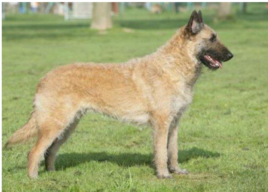
Obrázek 8: Belgický ovčák – Laekenois