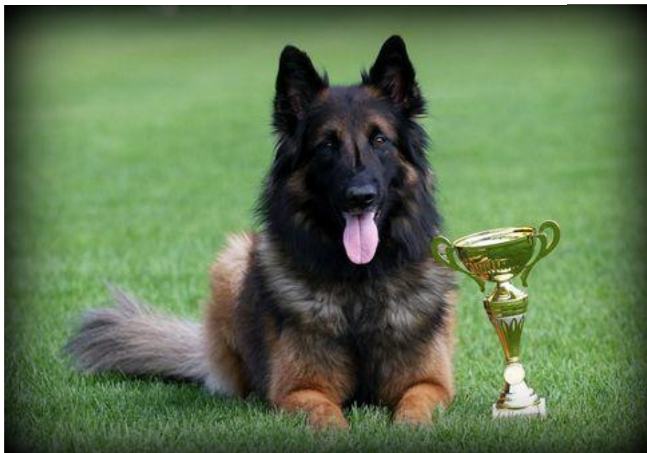
Obrázek 6: Belgický ovčák – Tervueren