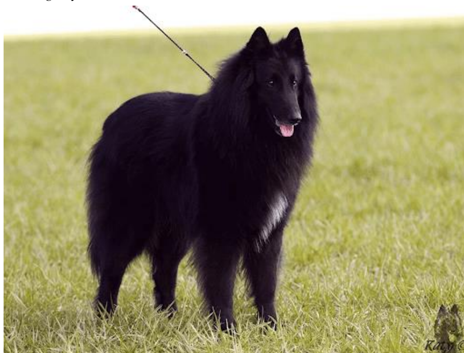
Obrázek 7: Belgický ovčák – Groenendael