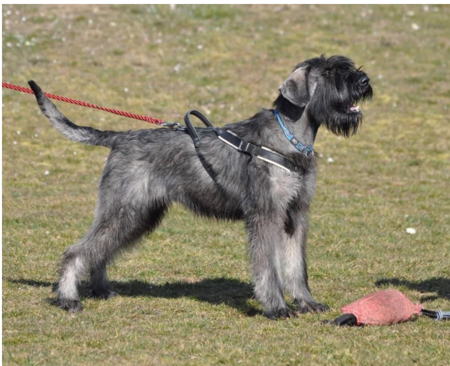
Obrázek 13: Knírač Velký – zbarvení pepř a sůl