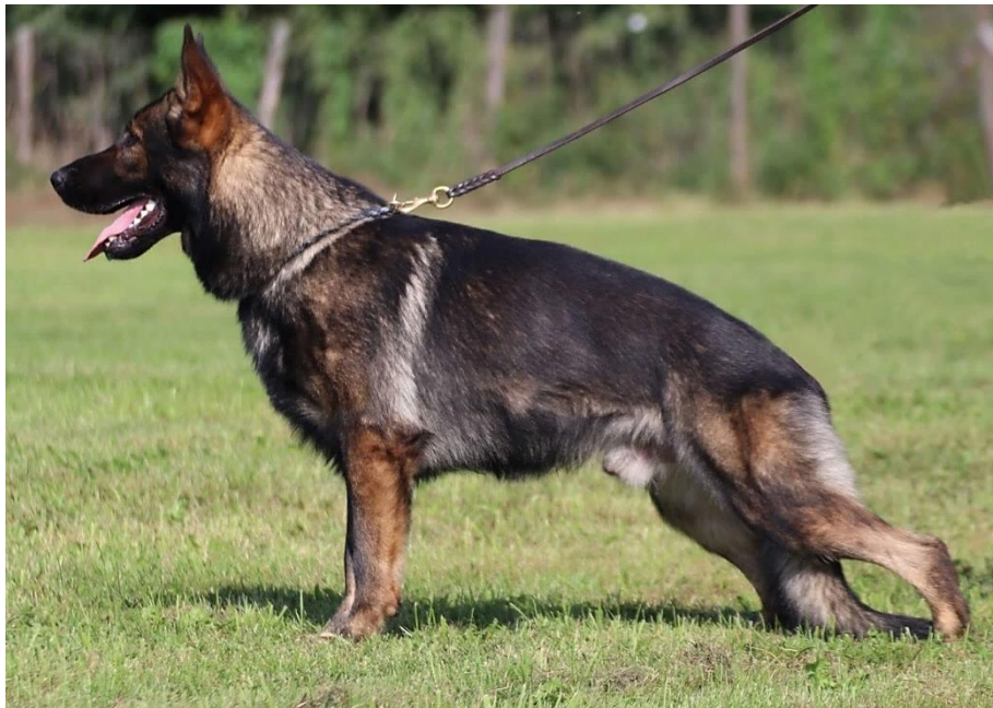
Obrázek 2: Pracovní linie NO – vlkošedé zbarvení