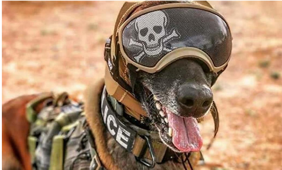
Obrázek 14: BOM ve službách americké armády