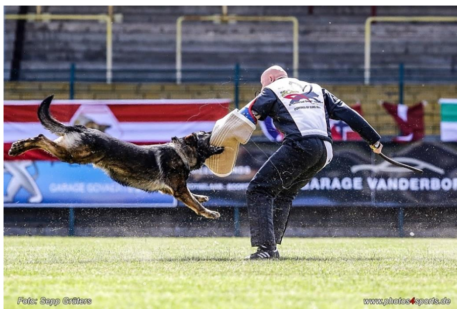
Obrázek 16: Nynější podoba oddílu C – obrana (kontrolní výkon)