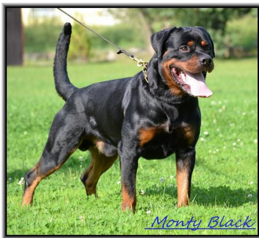
Obrázek 9: Exteriérová linie RTW

Z mého pohledu je rotvajler velice atraktivní plemeno a má „něco do sebe“. Obdivuji jejich stavbu těla, na to jak mohutní a obrovští dokážou být, jsou také ale extrémně atletičtí a určité cviky, které vyžadují pružnost a lehkost, přímo ze sportovní kynologie jsou pro ně jednodušší než na příklad pro NO. Na druhou stranu umí být velice tvrdohlaví a laxní proto se ve sportu tolik nevyužívají, oproti NO a BOM mají poloviční chuť do práce. Stejně jako předešlá plemena se postupem času i u rotvajlerů vyvinuly dvě linie, exteriérová nebo-li výstavní a pracovní. Neb pouhým laickým okem nejsou rozdíly, tak znatelné, jako na příklad u NO, kde se tyto dvě linie odlišují barvami, u RTW (Rotvajler) je rozdíl znatelný zejména na stavbě těla, mohutnosti kostry. Exteriérová linie má ohromné, nádherné a extrémně masivní jedince, dosahující váhy kolem 60 kilogramů, ale bohužel pro sport nepoužitelní a na druhé straně pracovní linie se stavbou těla podobá již spíše dobrmanovi či boseronovi, o polovinu menší než výstavní jedinci, ale chuť do práce nesrovnatelná.