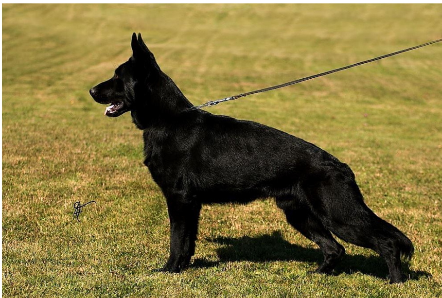
Obrázek 3: Pracovní linie NO – celočerné zbarvení