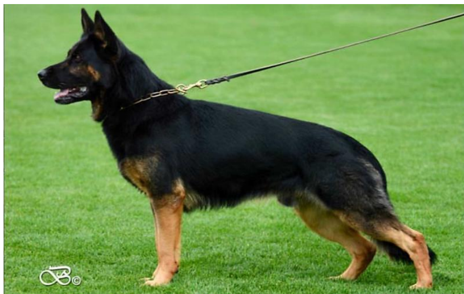
Obrázek 4: Pracovní linie NO – černé s pálením zbarvení