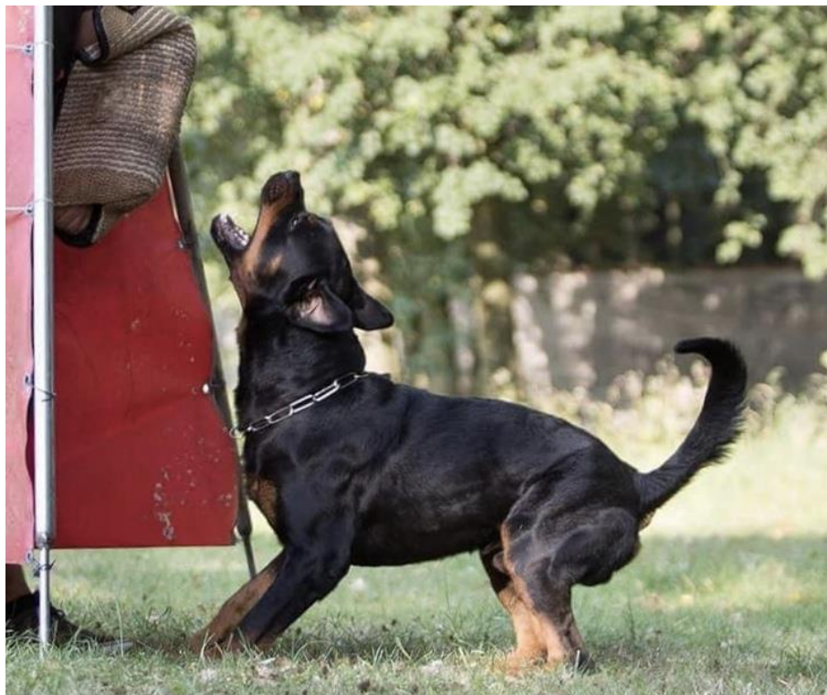
Obrázek 10: Pracovní linie RTW