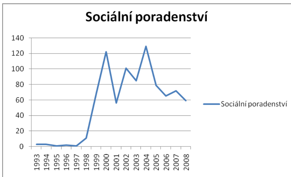
Graf 2: Sociální poradenství

Postupem let přicházely do poradny klientky, které potřebovaly řešit svoji nepříznivou sociální situaci, ve které se ocitly ať už vlastním přičiněním, či bez vlastního přičinění.