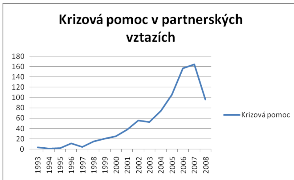
Graf 1: Krizová pomoc v partnerských vztazích