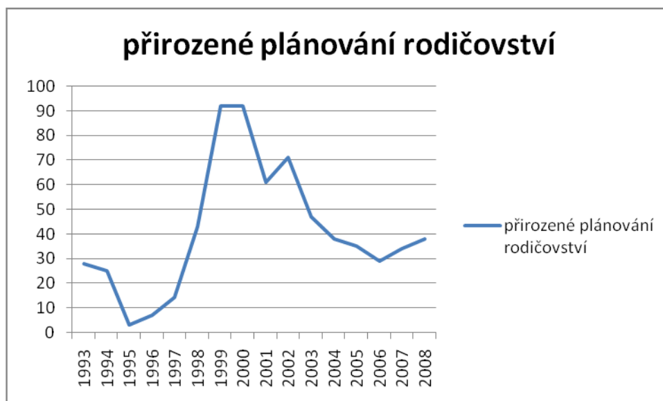
Graf 4 : Přirozené plánování rodičovství

Poradna pro ženy a dívky byla také poradnou pro přirozené plánování rodičovství. V průběhu celého sledovaného období od roku 1993 – 2008 byla návštěvnost klientek se zakázkami z této kategorie poměrně vyrovnaná. Výkyvy v počtu zakázek jsou v jednotlivých letech jasné z grafu, který tyto změny zaznamenává.