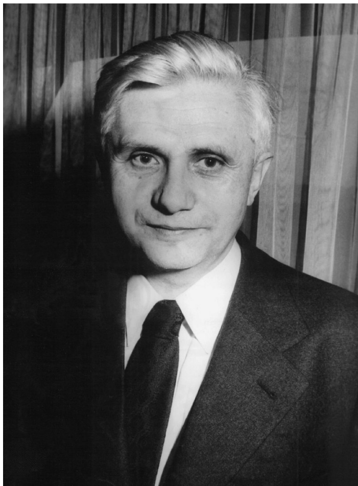
Obrázek 1 Profesor Joseph Ratzinger