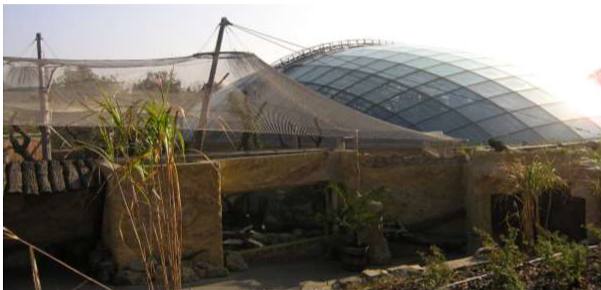
Pavilon Indonézie, ZOO Praha

napříč více kategoriemi, nelze řešenou stavební strukturu definovat pouze jako stavbu veřejnou pro kulturu (připomeňme si, že hovoříme o muzeu). Stejně tak lze uvažovat o stavbě pro výchovu a vzdělávání nebo o stavbě výrobní s živočišnou výrobou, protože jednou ze základních funkcí je chov živočišných druhů.