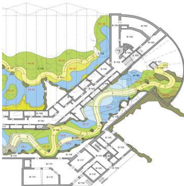
Ukázka z vlastního návrhu pavilonu Amazonie pro ZOO Praha Trója

Typickým zástupcem takového zařízení je tzv. „centrum“ či „pavilon environmentální výchovy“. Ukázka ideového scénáře pro návrh centra environmentální výchovy „Hanácký statek“ ZOO Park Vyškov je součástí dizertační práce