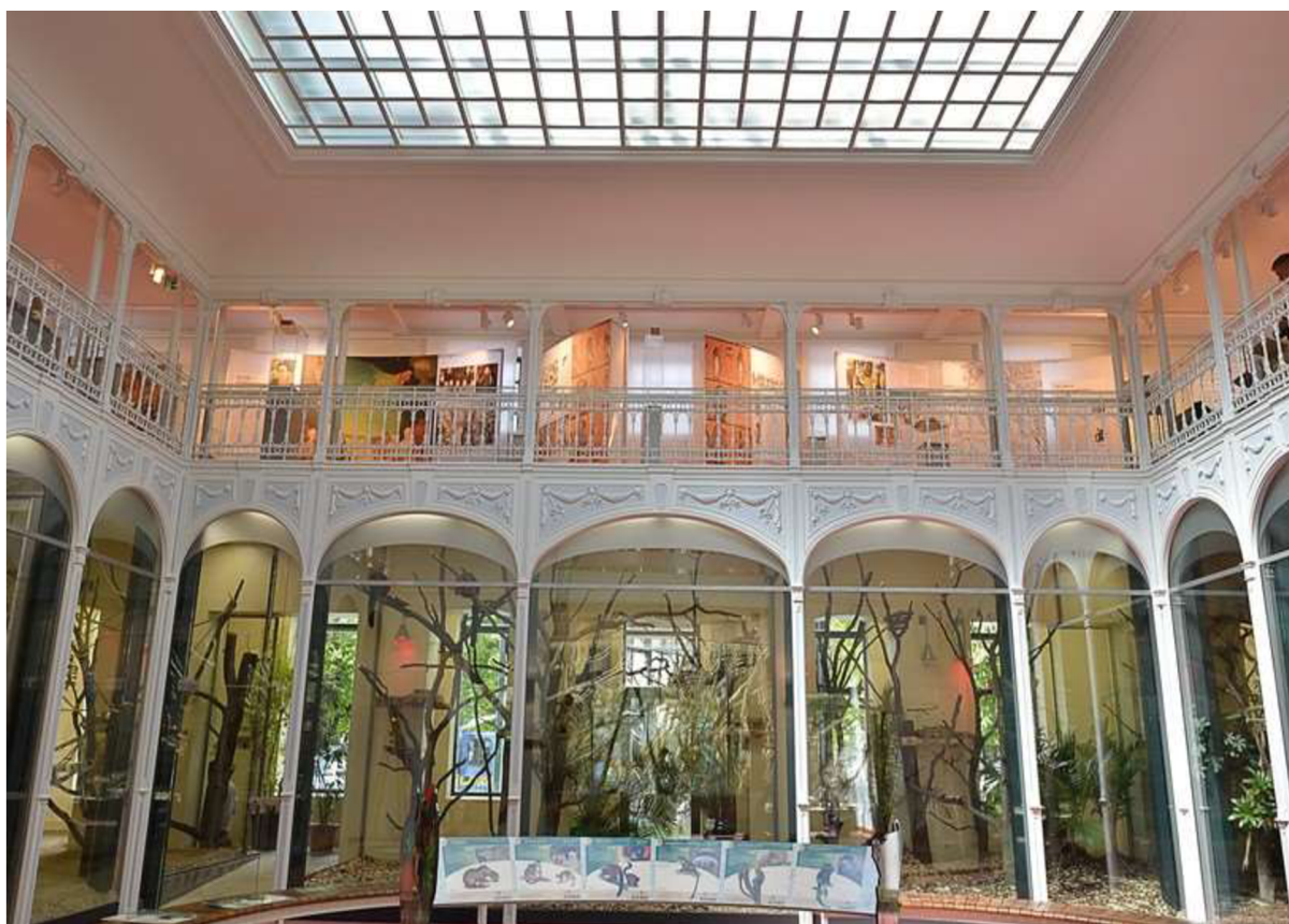
Jeden z původních pavilonů ZOO Vídeň – Schönbrunn, z období Marie Terezie

Tato témata jsou spojena s existencí člověka od prehistorických dob do současnosti a neztratila na své důležitosti. Otázky týkající se přírody nikdy neovládaly celosvětový zájem tak, jako dnes. Politici, vědci a ekonomové zahrnují ochranu přírody do svých domén. Zdá se, že si člověk konečně uvědomuje, jak intenzivně je jeho přítomnost na světě s tímto světem propojena.