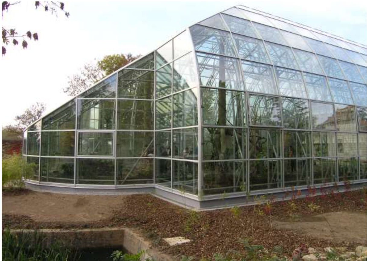
Tropický pavilon ZOO Lešná v době těsně po dokončení

Dnešní moderní zoologická zahrada je poměrně složitým organizmem, komplexem budov a zařízení, zajišťujících nejrůznější funkce a činnosti. Funkce základní, související s hlavními úkoly Zoo – zábava, rekreace a relaxace – výchova a vzdělávání – vědecký výzkum – záchrana ohrožených živočišných druhů a ochrana biodiverzity. Funkce vedlejší, doprovodné, související například s technickým zajištěním provozu nebo doplňkových služeb návštěvníkům.