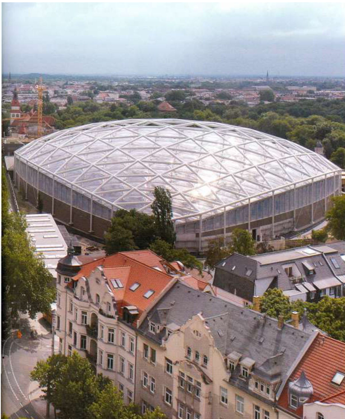
Gondwanaland, ZOO Lipsko (fotografie). In: ZOO LEIPZIG GmbH. Tropical Experience World Gondwanaland. Leipzig: LEIPZIGER BLÄTTER, 2011