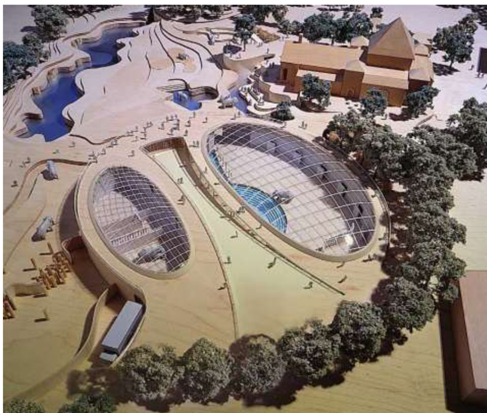
FOSTER + Partners. Návrh pavilonu (model afric.savany – Elephant House, ZOO Kodaň)

A tak se v šedesátých letech zdá být východiskem seskupování expozic do celků na základě zoogeografické příslušnosti. Vedle takového seskupování se v některých zoologických zahradách ubírají cestou výstavby velkých smíšených výběhů pro zástupce více druhů a to i z různých systematicky vzdálených skupin. Oba tyto směry se velmi úspěšně rozšiřují a mnohé zahrady mění zásadním způsobem svoje rozčlenění a stávají se zahradami s velkými smíšenými výběhy seskupenými do zoogeografických celků. Tohoto systému prezentování zvířat využívají zejména nejružnější v té době nově vznikající „safari“. Cílená chovatelská práce se z expozic přesouvá do chovatelských zázemí. (4)