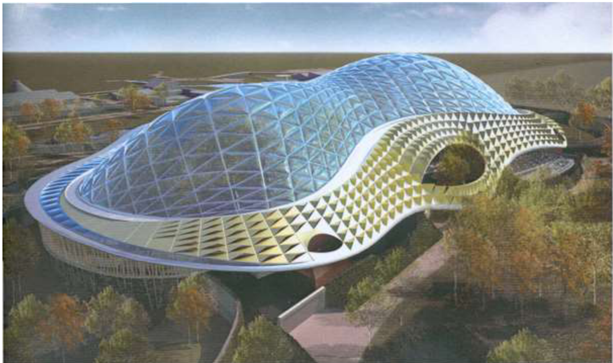
Projekt gigantického biodómu Kongo v ZOO Chester, Anglie

U ZOO pavilonu nejde prioritně o botaniku, ale především o živočichy a na druhém místě o návštěvníky. Pro základní výběr rostlin to znamená další selekci. Eliminovány jsou druhy toxické, přednostně vybírány druhy s atraktivním habitem a druhy v celkové kolekci tvořící pestrou a rozmanitou škálu. Speciální pozornost je věnována rostlinným druhům pokryvným, které mají schopnost odclonit nežádoucí pohledy na konstrukce a technologická zařízení.