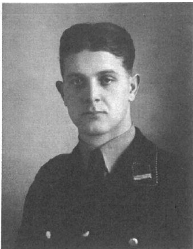
Příloha č. 1: Předválečné fotografie E. Liedtkeho