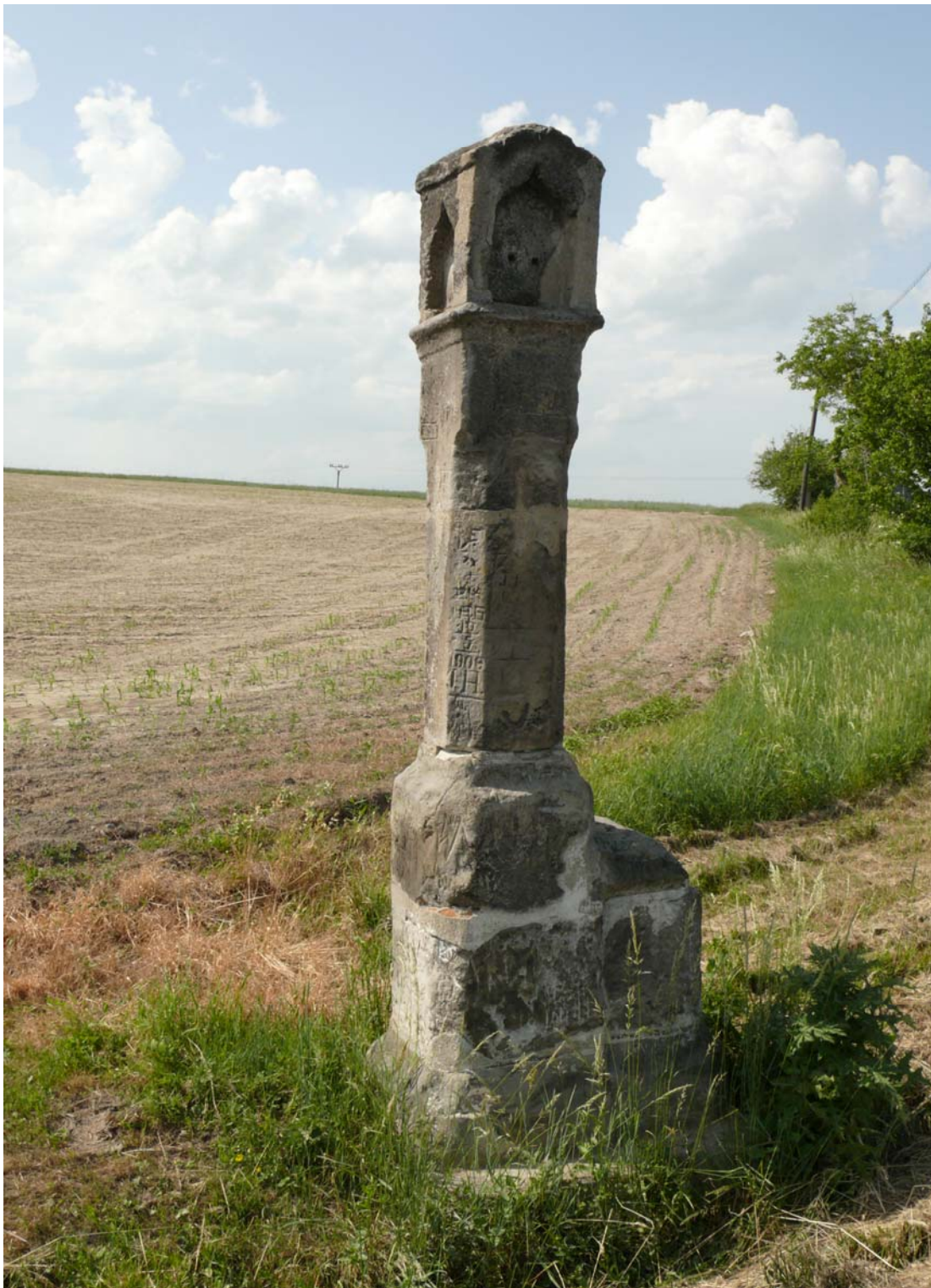
Příloha č. 2 – Dřínov – boží muka nedaleko obce