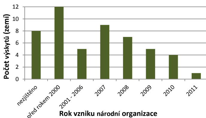
Graf 1: Počet národních organizací založených v jednotlivých letech

Údaje o oficiálním zřízení národních center propagujících myšlenku WWOOF v jednotlivých zemích byly úspěšně zjištěny ve 43 případech (z celkového počtu 51). Výsledky odpovídají výše uvedené informaci, že před rokem 2000 ve světě fungovalo pravděpodobně pouhých 12 autonomních organizací a dále, jak je vidět i z grafu, opravdu došlo k jejich největšímu rozmachu zejména v letech 2007 a 2008, kdy bylo založeno dalších 16 samostatných hospodařících poboček WWOOF.