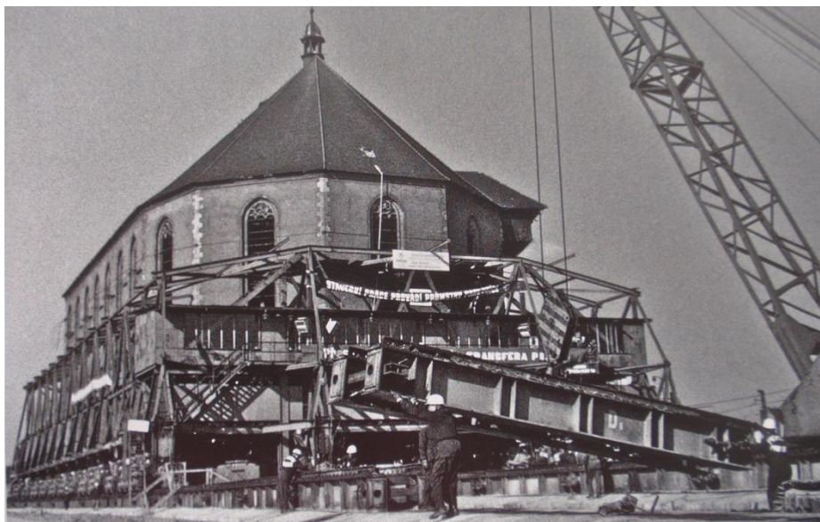
Obrázek 5: Transport děkanského kostela Nanebevzetí Panny Marie (Štýs et al. 2014).

památku (Štýs et al. 2014). Dobývání uhlí v lokalitě lomu Ležáky-Most bylo ukončeno v roce 1999 (Ehrenberger, 1985).