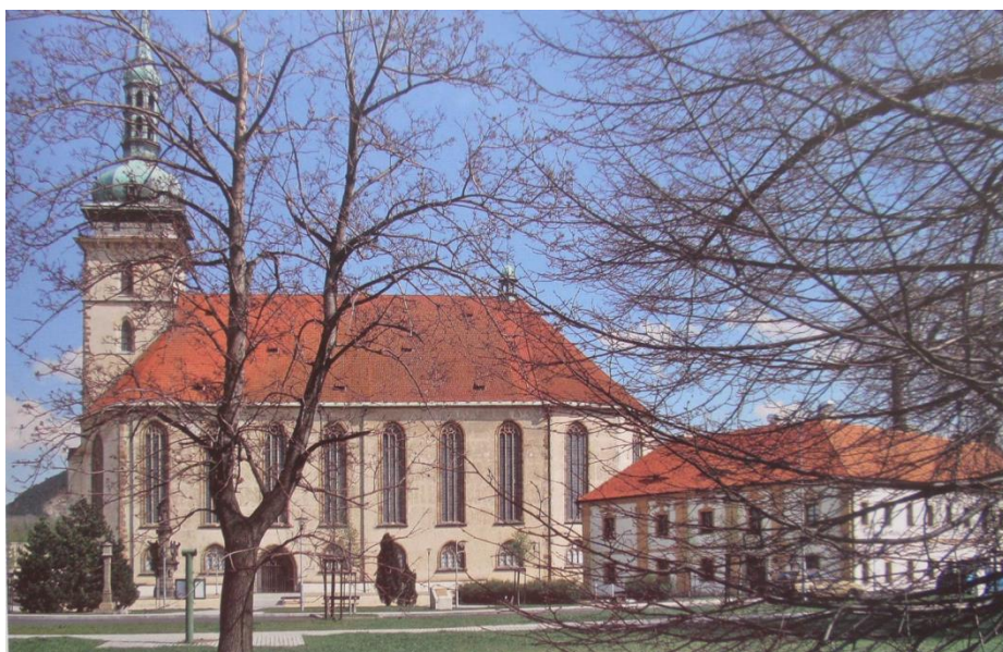
Obrázek 6: Kostel Nanebevzetí Panny Marie – foto z roku 2008 (Štýs et al. 2014).