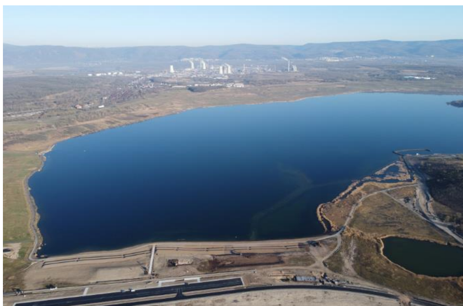
Obrázek 8: Jezero most v dubnu roku 2020