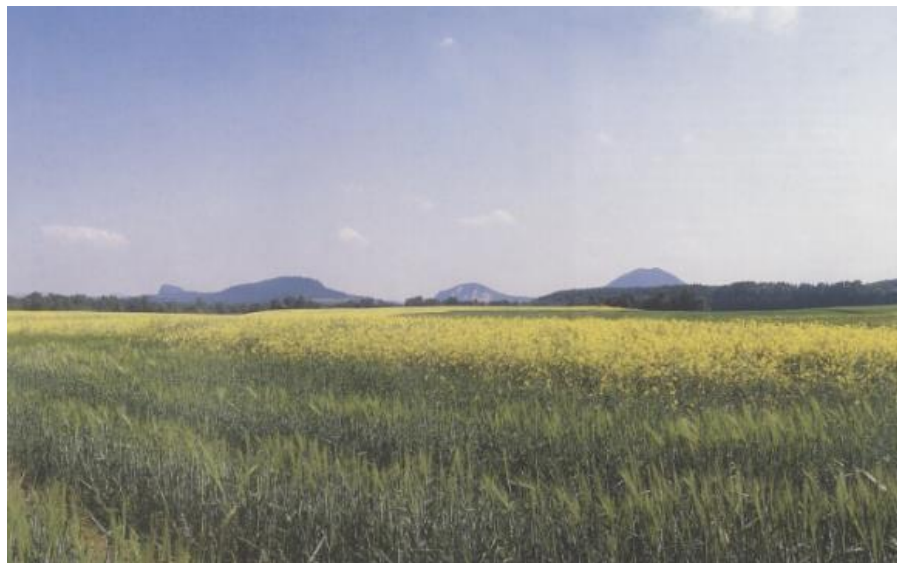
Obrázek 1: Pohled na zemědělsky zrekultivovanou Teplickou výsypku nedaleko obce Braňany (Bejček, 2003)

Po zrekultivování území je nezbytné nadále provádět opatření, jimiž bude podporován půdotvorný proces. Mezi tyto postupy patří správné střídání plodin a zařazování plodin zlepšujících půdní úrodnost (VŠB ©2024).