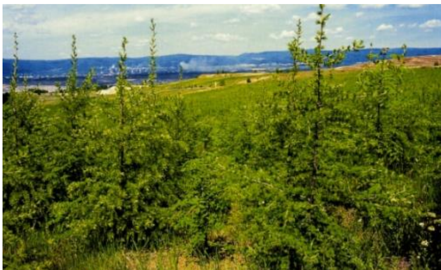
Obrázek 2: Úsek Střimické výsypky 7 let od zahájení rekultivace (Štýs, 1996)

Lesnické rekultivace jsou dále značně ovlivňovány i funkčním typem porostů (Štýs et al. 2014). Lesy produkční mají podobu standardních lesů nebo plantáží, na kterých jsou vysazovány rychle rostoucí dřeviny, které mohou v budoucnu sloužit pro energetické účely. Lesy účelové se dělí podle druhu stanoviště, na kterém se nachází, a podle funkce, kterou budou v krajině plnit (Štýs, 1996), například na lesy půdotvorné, půdoochranné, sanitární, rekreační nebo na lesy s hydrologickou funkcí (Štýs et al. 2014).