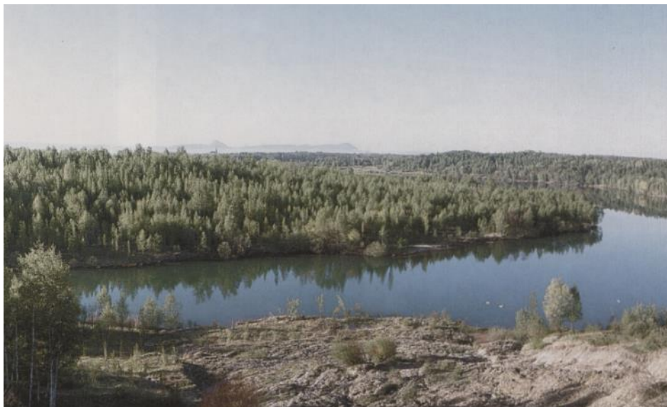
Obrázek 3: Pohled na lomové jezero Barbora u Oldřichova (Bejček, 2003)