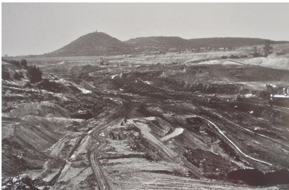
Obrázek 7: Areál bývalého lomu Ležáky – Most (Štýs et al. 2014)