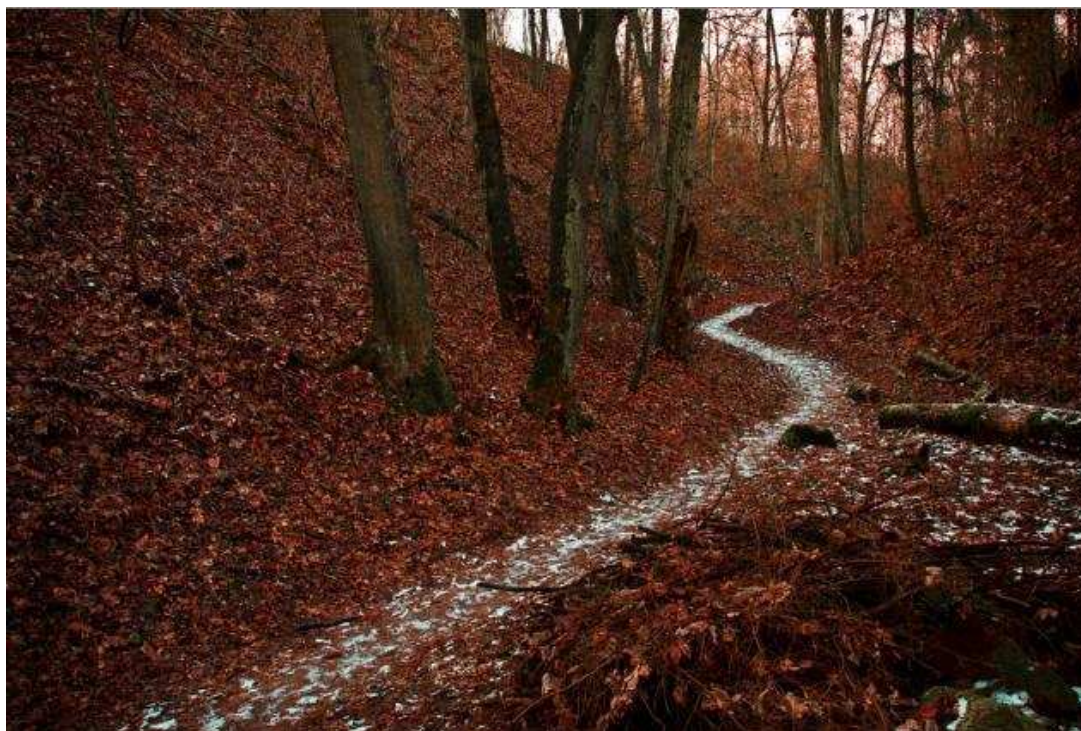
Obrázek č. 1 - Malebná lesní cesta

„Ať už má genius loci jakoukoliv podobu, rozhodující pro jeho chápání je subjektivní vjem, vznikající kombinací rozumových a citových, vědomých i nevědomých podnětů. Genius loci může být vázán na jednotlivce a jeho zkušenost, na generace a jejich paměť (tradice) a konečně i na kolektivní podvědomí přesahující generace (kult, legenda, mýtus)“ (SKLENIČKA 2003 ex MIMRA 1998).