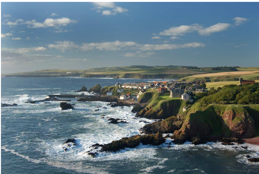
Obrázek č.2 - St. Abb's, Skotsko

NĚMEC a POJER (2007) připomínají, že důležitou součástí krajiny, či příslušné scenérie, je její obsah a velikost (měřítko) prostoru. Určitá místa otevírají výhledy do krajiny, nabízejí pohled na vzdálené horizonty, jiná místa leží v uzavřených prostorech, které jsou ohraničeny svahy. (viz obrázek č.2)