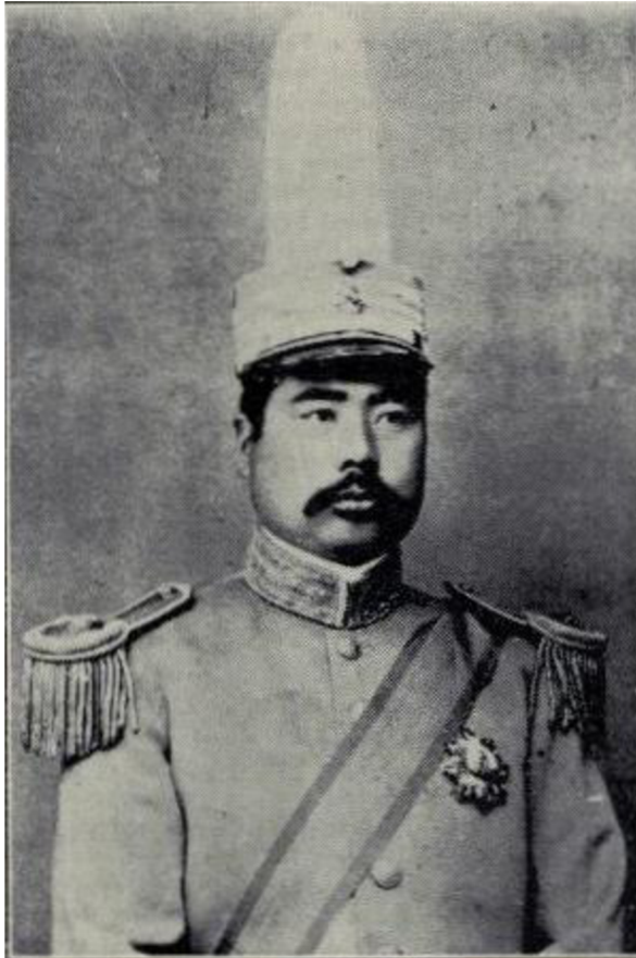
General Feng Yu-hsiang 馮玉祥字煥章。