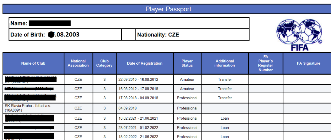
Obrázek č. 3 – Hráčský passport

K výpočtu mezinárodní tréninkové kompenzace je nezbytná tabulka s výší částek kategorie na základě konfederace a taktéž elektronický passport hráče.