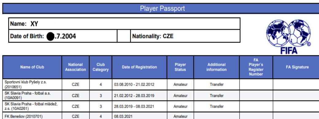
Obrázek č.2 – Modelový příklad hráčského passportu pro výpočet tréninkové kompenzace

Tento hráč byl poprvé zaregistrován jako člen FAČR dne 3. 8. 2010, kdy oslavil i své šesté narozeniny. Tudíž i od stejného dne se bude vypočítávat tréninková kompenzace.