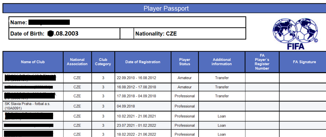
Obrázek č. 4 – Hráčský passport

V případě zájmu prvoligového klubu v České republice potřebujeme k výpočtu hráčský passport a tabulku č.3 Výše tréninkové kompenzace.