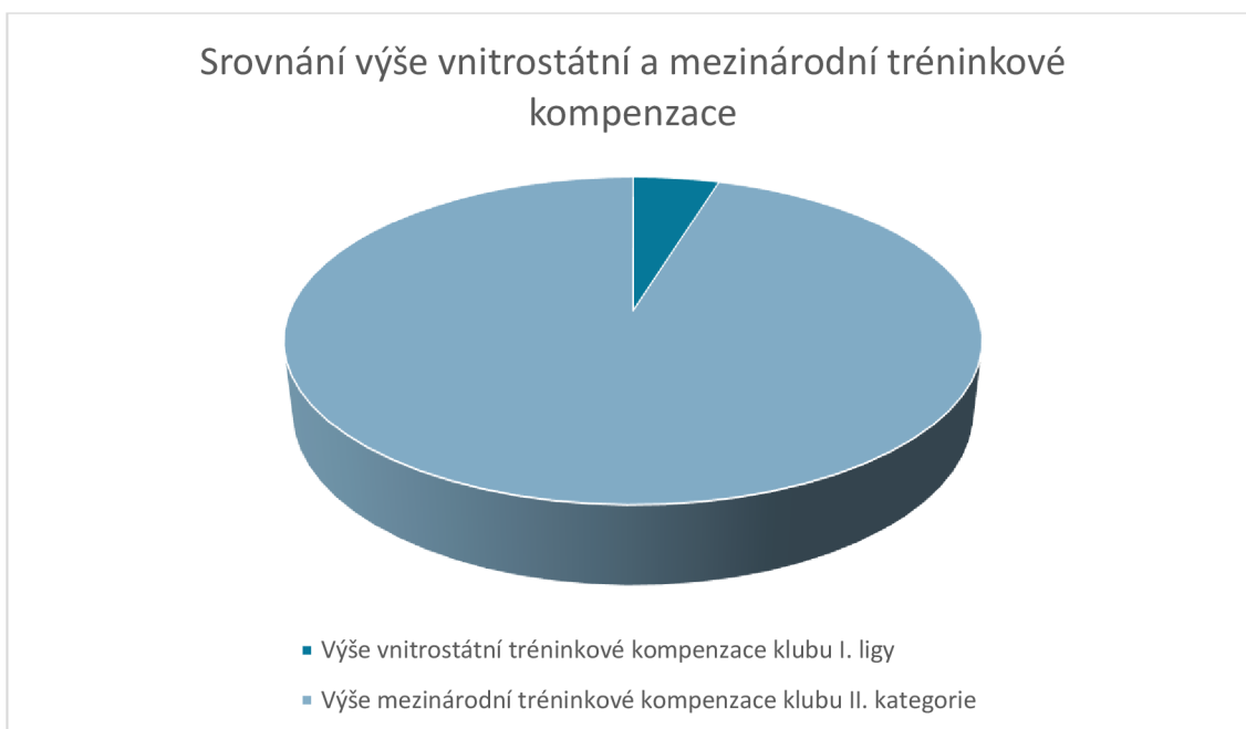
Graf č. 3 – Srovnání výše vnitrostátní a mezinárodní tréninkové kompenzace

Vzhledem k vysokým rozdílům mezi částkami vnitrostátní a mezinárodní tréninkové kompenzace, je potřeba se zamyslet a zhodnotit její výši na vnitrostátní úrovni.