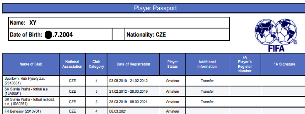
Obrázek č.2 – Modelový příklad hráčského passportu pro výpočet tréninkové kompenzace

Tento hráč byl poprvé zaregistrován jako člen FAČR dne 3. 8. 2010, kdy oslavil i své šesté narozeniny. Tudíž i od stejného dne se bude vypočítávat tréninková kompenzace.