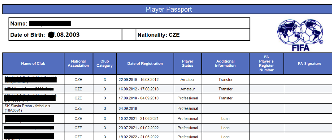
Obrázek č. 3 – Hráčský passport

K výpočtu mezinárodní tréninkové kompenzace je nezbytná tabulka s výší částek kategorie na základě konfederace a taktéž elektronický passport hráče.