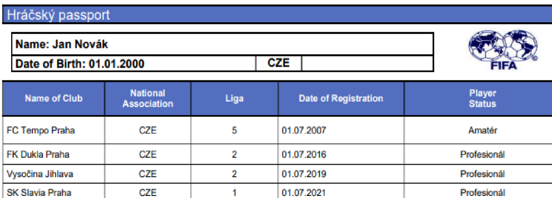
Obrázek č. 1 – Modelový příklad Elektronického hráčského passportu (Komentář legislativně právního oddělení k institutu tréninkových kompenzací, 2022)