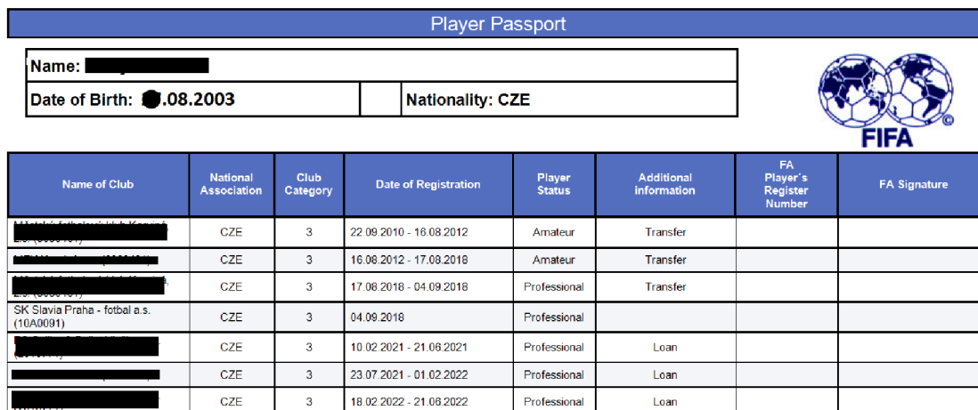
Obrázek č. 4 – Hráčský passport

V případě zájmu prvoligového klubu v České republice potřebujeme k výpočtu hráčský passport a tabulku č.3 Výše tréninkové kompenzace.