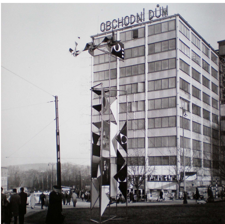
Obrázek 2: II. celostátní přehlídka - festivalová výzdoba města Zlína