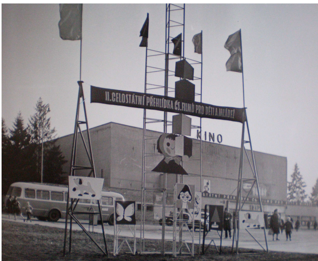
Obrázek 4: II. celostátní přehlídka - festivalová výzdoba před Velkým kinem