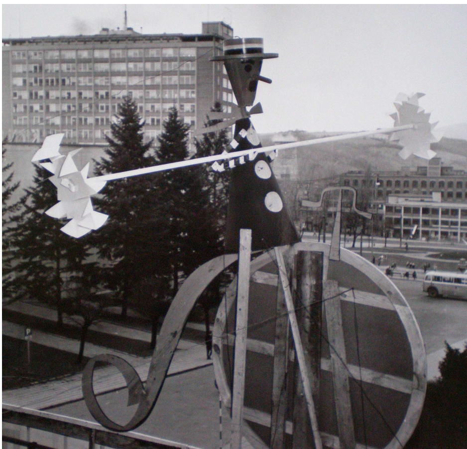
Obrázek 9: festivalový panáček