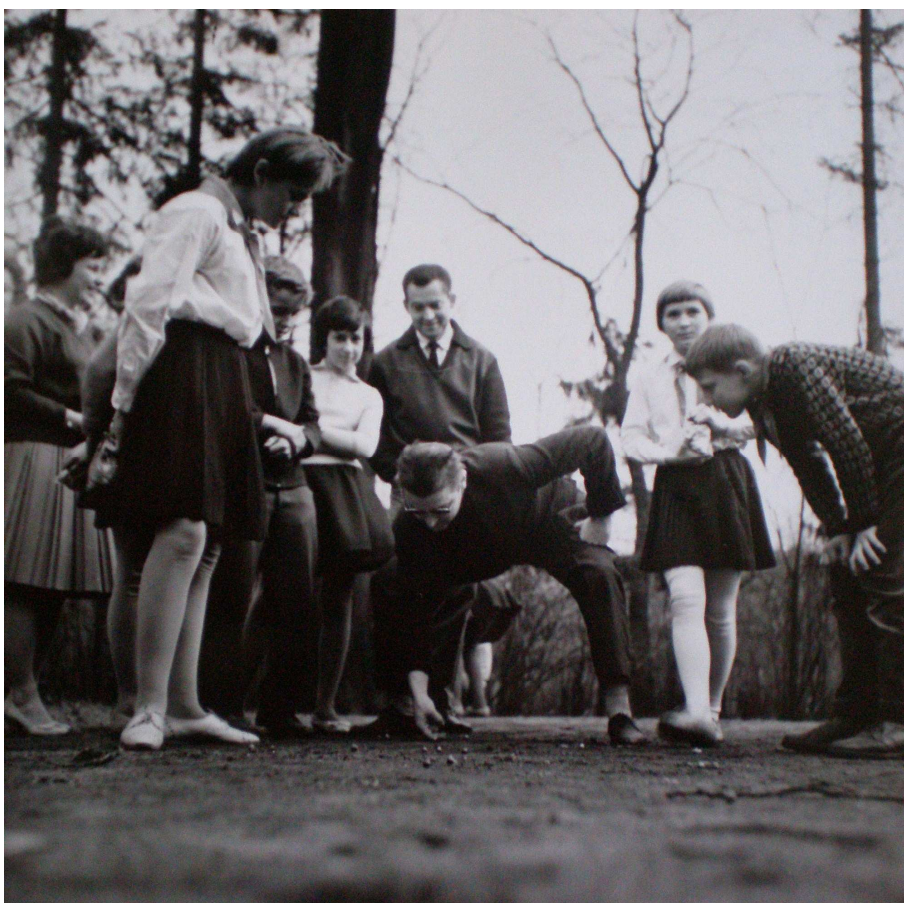
Obrázek 12: I. mezinárodní festival - doprovodný program