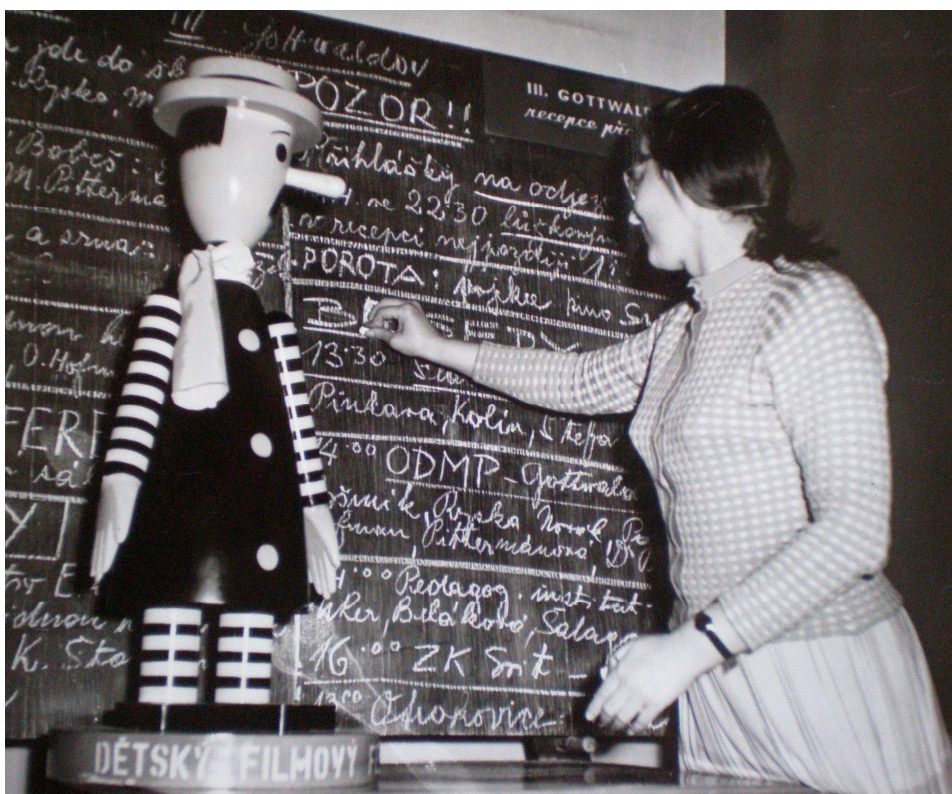
Obrázek 8: III. celostátní přehlídka