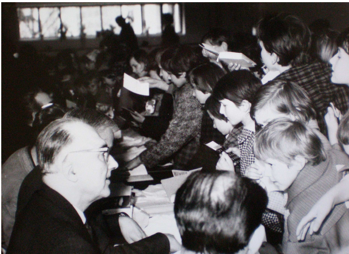
Obrázek 11: I. mezinárodní festival - autogramiáda