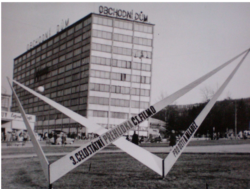
Obrázek 6: III. celostátní přehlídka - festivalová výzdoba města