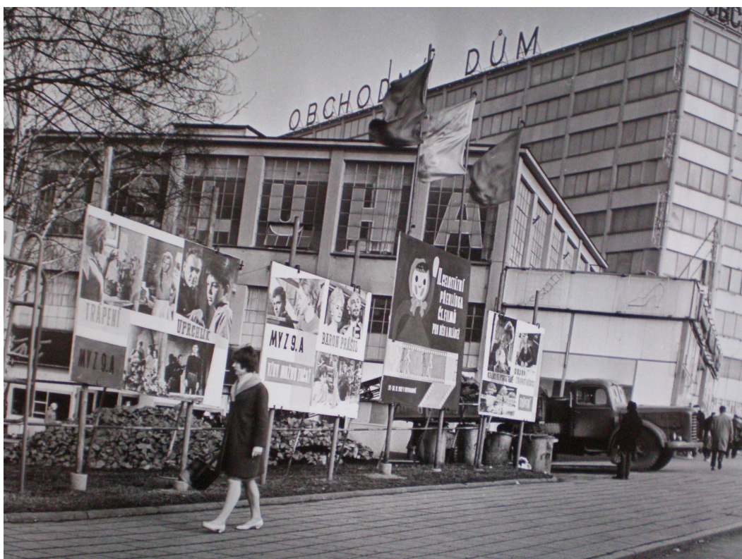
Obrázek 3: II. celostátní přehlídka – festivalová výzdoba města