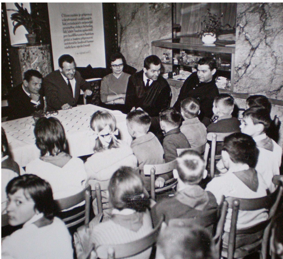
Obrázek 10: I. mezinárodní festival - beseda s dětmi