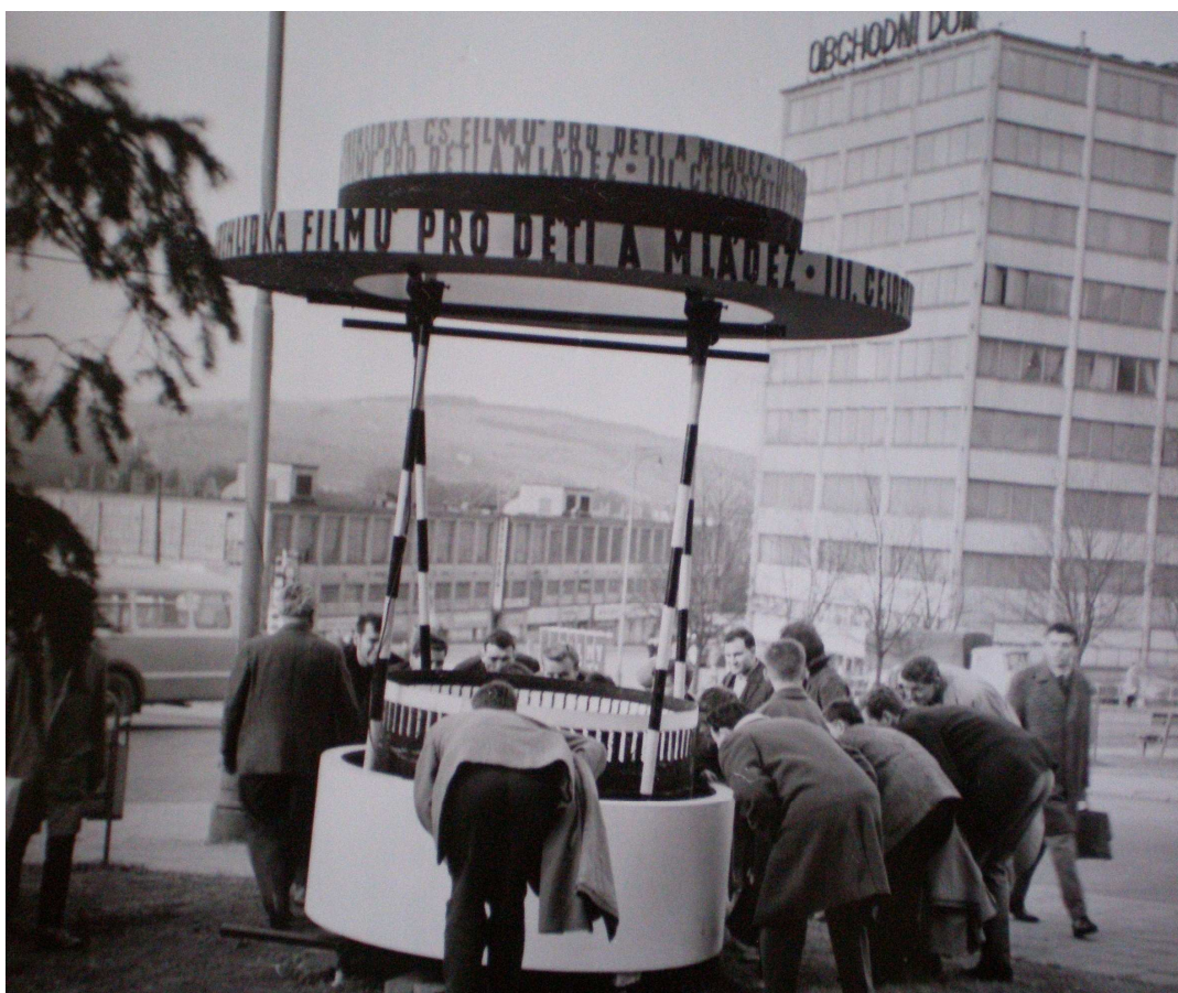
Obrázek 7: III. celostátní přehlídka