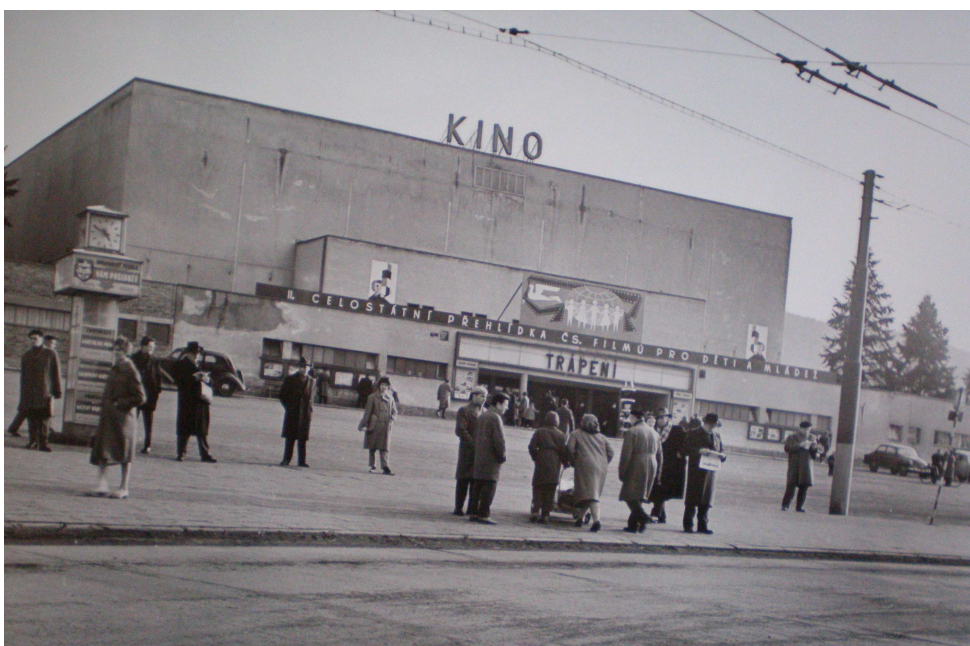
Obrázek 1: II. celostátní přehlídka čs. filmů pro děti a mládež