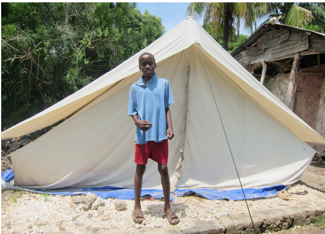
Obr. 6 Stan postavený pro rodinu na místě, kde stál před zemětřesením jejich dům.