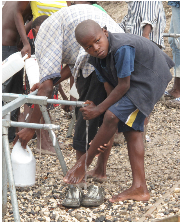
Obr. 5 Zdroj nezávadné vody vybudovaný v táboře Petion Country Club