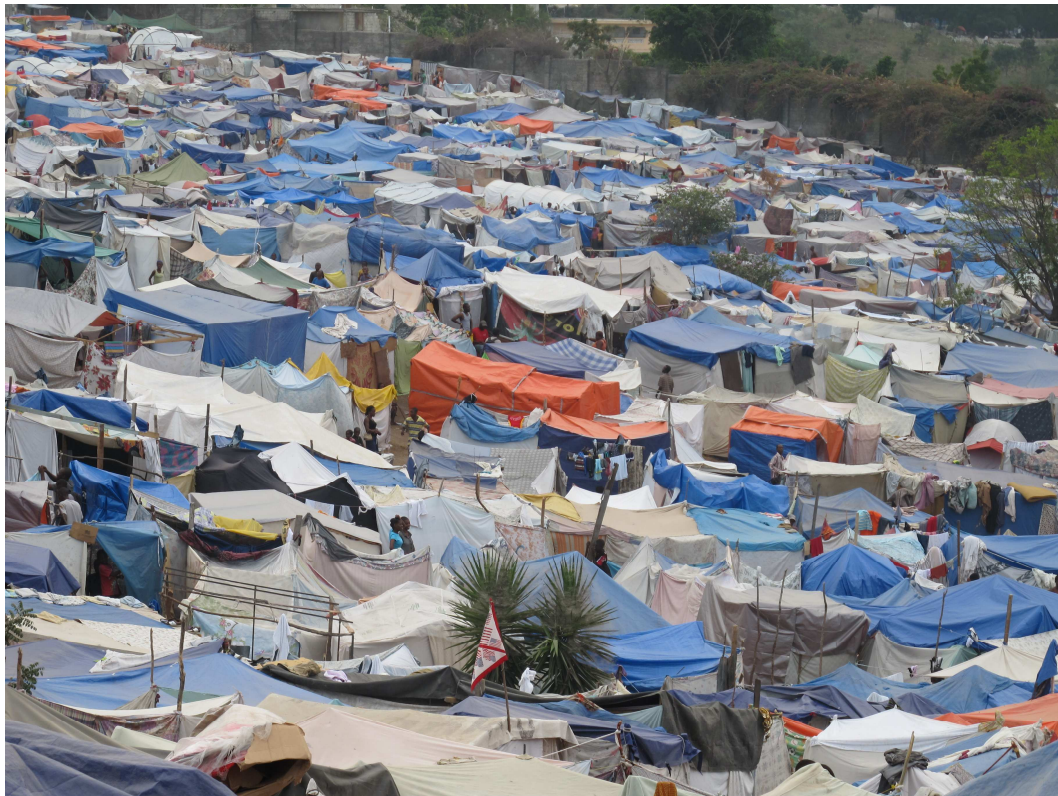
Obr. 2 Spontánní stanový tábor Petion Country Club (foto: Oldřich Pospíšil, 2010)