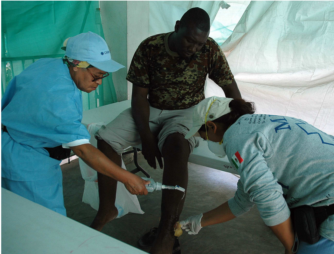
Obr. 4 Zdravotníci z Mexica v provizorním charitním zdravotnickém zařízení