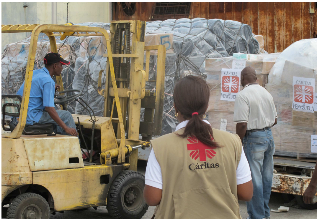
Obr. 3 Členka logistického týmu Caritas Haiti přebírá materiální pomoc zaslanou Caritas Venezuela