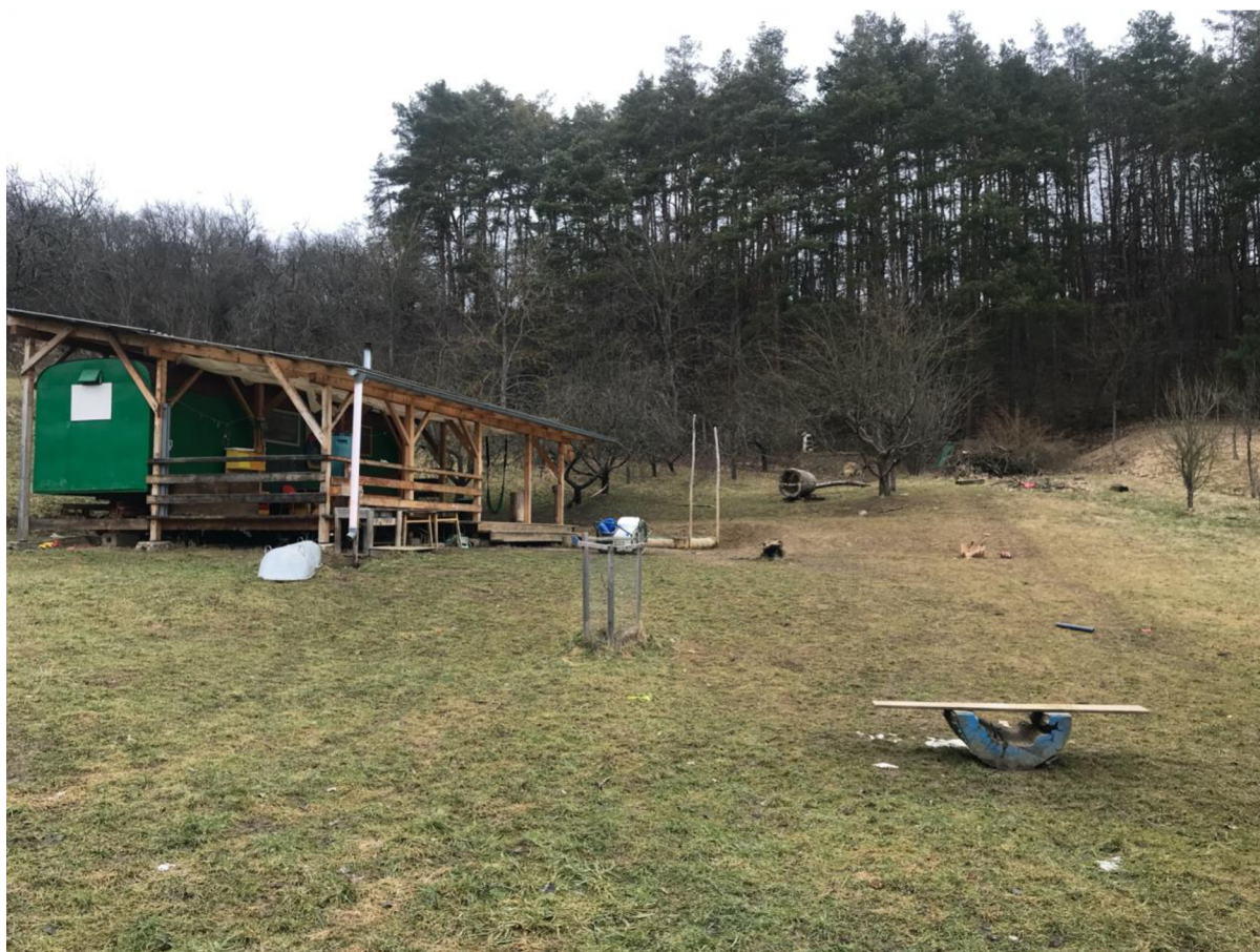
Obr. 1, Zdroj: Vlastní fotografie

Ve lesním klubu Jabloňka mám už půl roku i svoji dceru. Některé informace o denním režimu vím, ostatní jsem zjišťovala při rozhovoru s průvodkyní Luckou.