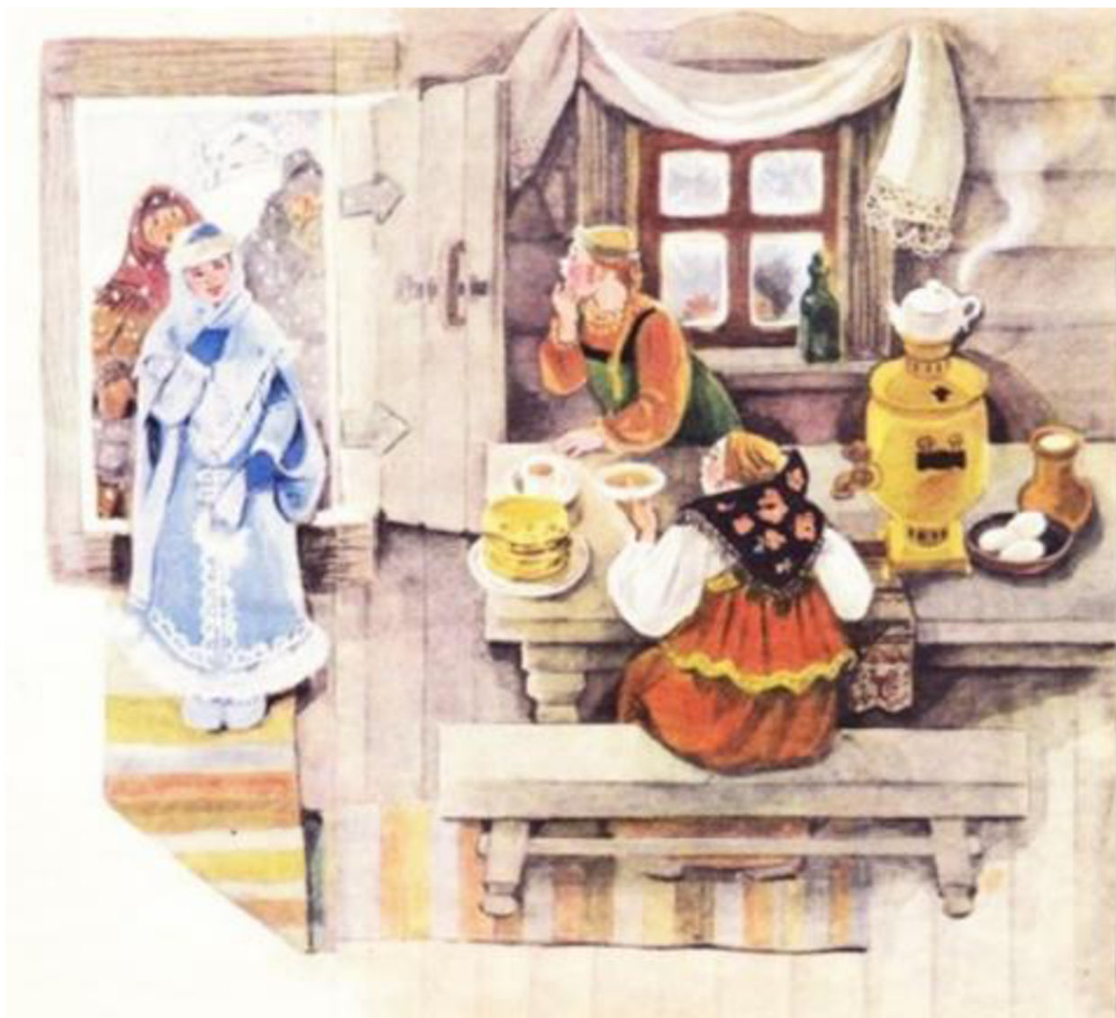
С - ШЕВАРЁВА, Тамара Петровна. Без названия [акварель]. In: Морозко . Москва: Малыш, 1985, с. 8-9.