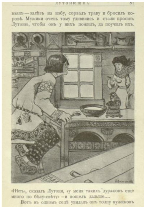
Иллюстрация А - Лутонюшка, 1913