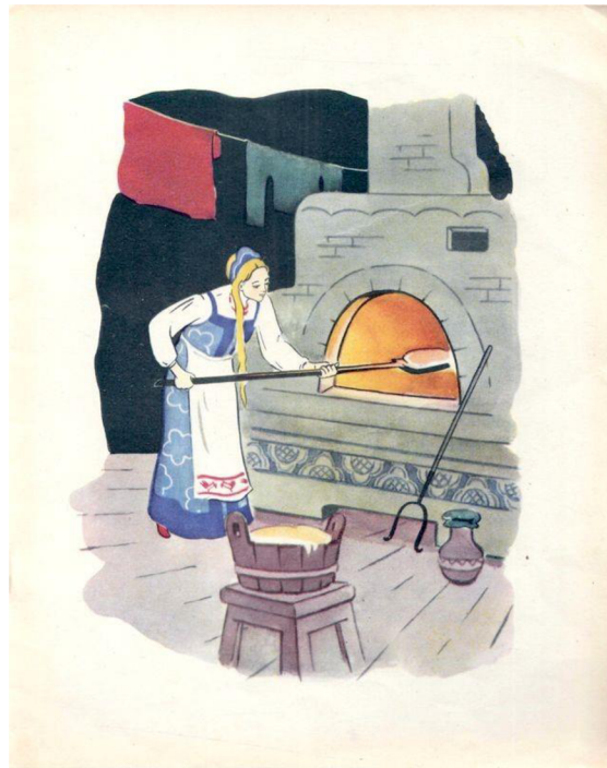
Иллюстрация В - Кривая Уточка, 1958