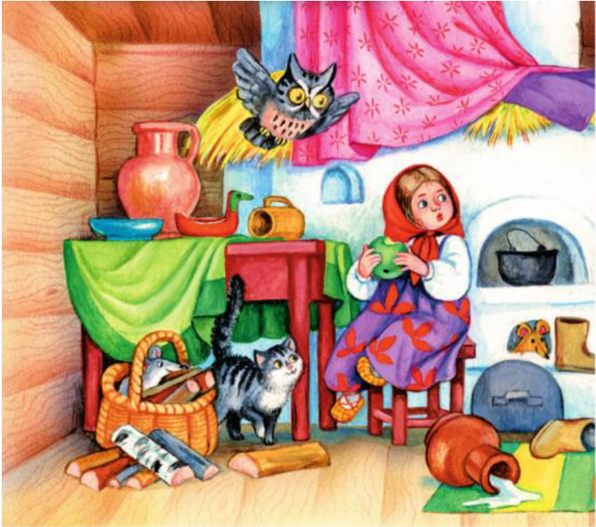
D - Художник неизвестен. Без названия [смешанная техника]. In: Сказки Бабы Яги . Москва: Эксмодетство, 2021, с. 10. ISBN 978-5-699-25154-4.