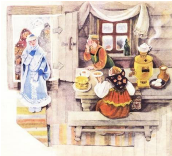
Иллюстрация С - Морозко, 1985