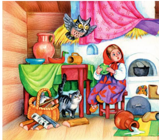
Иллюстрация D - Маша и Баба Яга, 2021