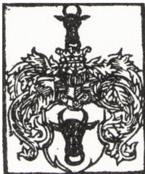
Erb pánů z Pernštejna 77