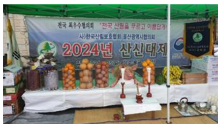
Obrázek 4 – Rituál horskému duchu pořádaný ulsanskou radou Asociace pro ochranu korejských lesů Zdroj: Hanguk sallim boho hjöpchö Ulsan hjöbühö [cit. 2024-04-09].

Využití symboliky horského ducha ve prospěch ekologických zájmů si již v menší míře ve společnosti našlo své místo. Ulsanská rada Asociace pro ochranu korejských lesů každoročně pořádá dobrovolnickou akci, na níž vykonají obřad na uctění horského ducha spojený s následným úklidem lesa. 115