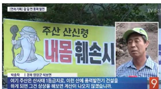
Obrázek 3 – Plakát s horským duchem v reportáži TV Čosön o protestech proti výstavbě větrné elektrárny na hoře Čusan